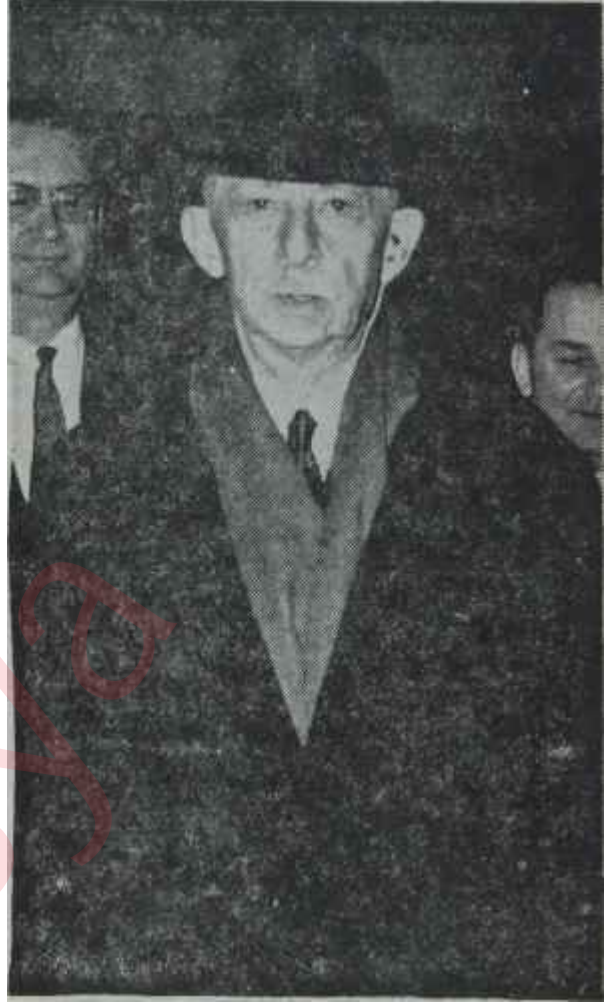
C.H.P. Genel Başkanı İsmet İnönü Yıl 1963

B iz bundan sonrası için hükümetlerin vazifesini şu şekilde görüyoruz: Toprak Reformunu derhal yapmak zamanı gelmiştir. Kalkınma için açıktan ilân ederek ve her şeyi adıyla söylemekten çekinmeyerek kudret ölçüleri' içinde vergi almak lâzımdır. Köylü ihtiyacının Hükümet içinde bir Bakan tarafından hususi olarak daima takip edilmesi gerekmektedir. Bundan sonra CHP'nin bir koalisyona katılması Şubat başında yeni vergi ihtiyaçlarının halledilmiş olması, Şubat başında Toprak Reformunun Meclise getirilmesi, Hükümet teşkilâtının o şekilde düzeltilmesi esaslarında bizimle mutabık bir ekseriyet bulmaya bağlıdır. İnönünün şahsi mevkii önemli değildir. Bu ekseriyet bulunmadığı takdirde Meclis içinde ve memleket içinde serbest kalarak dâvalarımızı takip etmek tek vazifemiz olacaktır. Bugünkü vaziyet içinde CHP'nin düşündüğü tedbirler bunlardır. Prensipleri esas olarak bu şartlara aykırı bulunan, meselâ plân yerine pilav teklifinde veya Servet Beyannamelerinin kaldırılma-