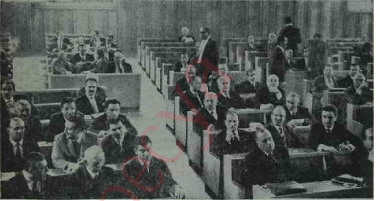
Koalisyona katılmama kararı alan C.H.P. Grubu

C.H.P. içinde karar garip bir hava ve tuhaf bir ruh haleti içinde alındı. Gerçi, hiç bir koalisyona girmeksizin muhalefette kalmayı samimi olarak