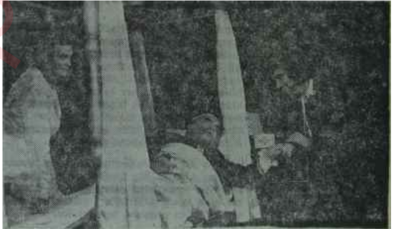
Üçüncü Tiyatroda "Tilki"