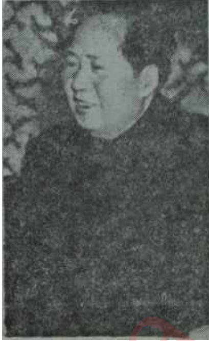
Mao Çe - Tung

Şırsın satırların yazıldığı sıralarda, Mırsın başkenti Kahirede, çok uzaklardan gelecek bir konuk için ateşli karşılama hazırlıkları yapılmaktadır. Gerçekten, şimdiye kadar pek yurt dışına çıkmamış olan Çinin kuvvetli adamı Mao Çe Tung, birkaç güne kadar Kahireye gelecek ve burada Mısır lideri Nasır ile görüşmeler yapacaktır. Bu görüşmelerden ne çıkacağı şimdilik kesin olarak kestirilememektedir, fakat bilinen birşey varsa o da, bütün dünyanın bu görüşmeyi merakla izlediğidir.