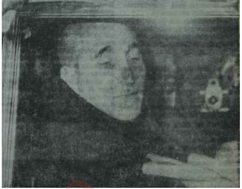
Osman Bölükbaşı otomobilde Böyle Başbakana, böyle yardımcı

"— Temsilciler Meclisinin Haziranda seçim yapılması kararının ne önemi olur? Bu, bir günlük iştir. Temsilciler Meclisini yeniden toplantıya çağırır, aksine kararı aldırırveririz!"