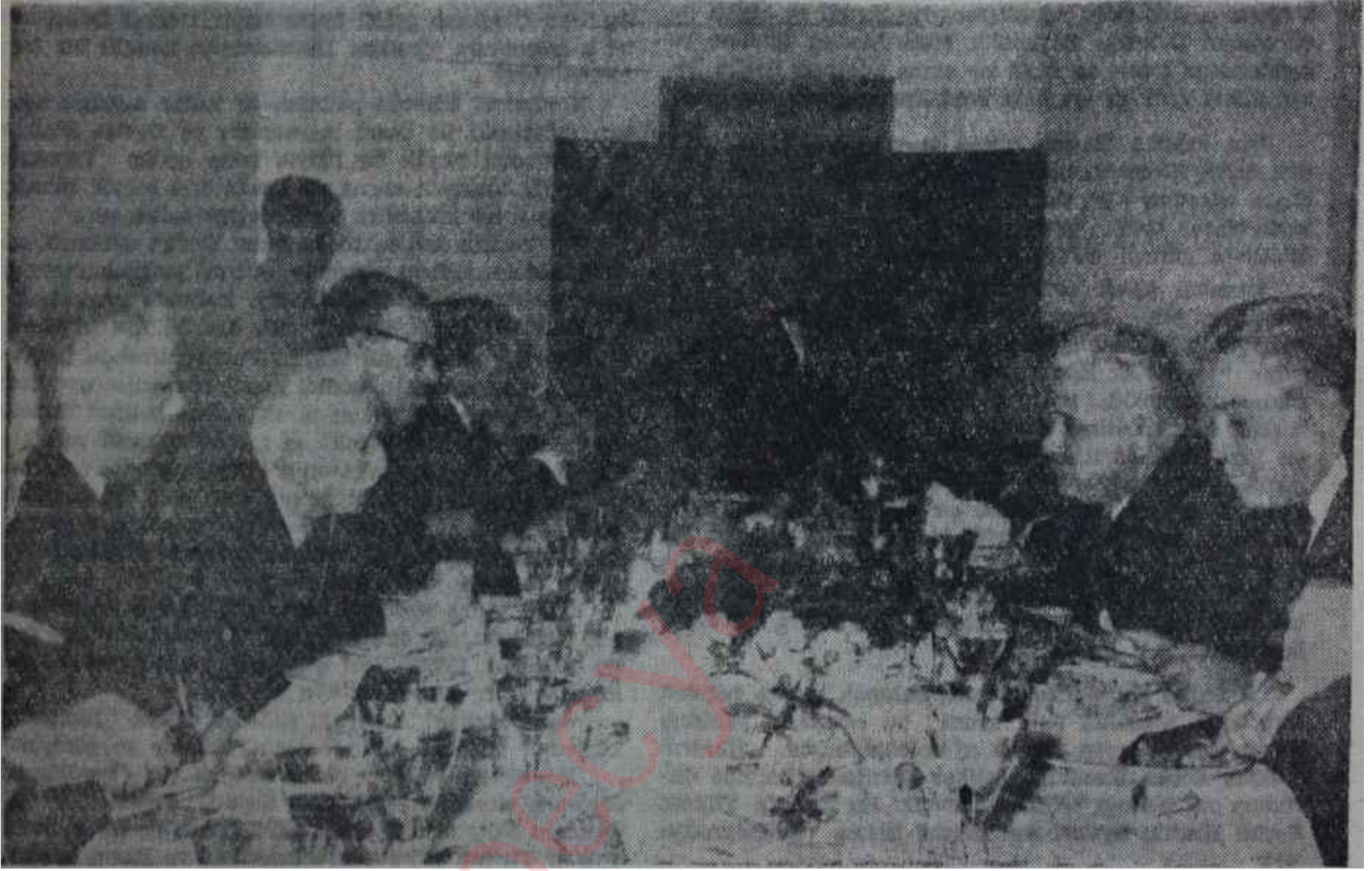
12. Koalisyon Kabinesinin hakanları son yemeklerinde

Bâki kalan bu kubbede bir nebze dostluktur