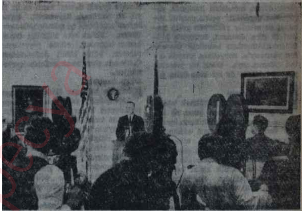
Başkan Johnson Beyaz Sarayda ilk konuşmasını yapıyor

İşin aslına bakılırsa. Başkan Johnson, Kongre önünde yaptığı konuşmada ortaya kendine has yeni bir program koyuyor değildi. Zaten bu kadar beklenmedik bir başkanlığa gelişten sonra, o kadar kısa bir süre içinde yeni bir program hazırlaması da beklenemezdi. Fakat Johnson, büyük bir kuvvetle, Kennedy'nin ilerici programını yürütmeye devam edeceğini söylüyordu. Bilindiği gibi Kennedy, bir yıl yakın bir süredir, zencileri beyaz-