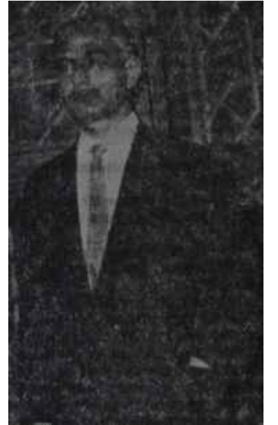
Eroğan Seçimde. sonra, Ya, Altunizadeler ne dedi?

u haftanın başında pazartesi günü saatler 24'e yaklaşıyordu ki CHP.