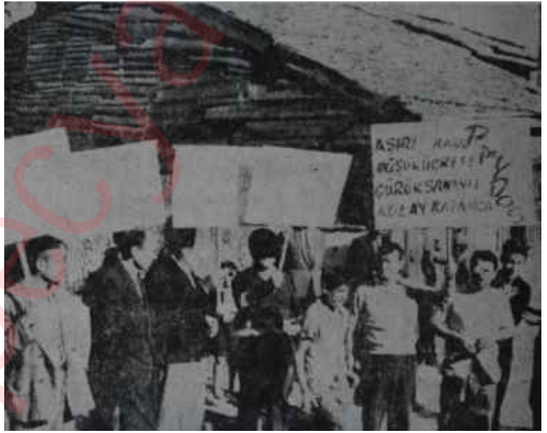
Grev başladıktan sonra işçiler flamalarıyla İlk heyecan

Grevin üçüncü gününde İstanbul Sıkı Yönetim Komutanı Refik Yılmaz bir tebliğ neşretti ve "Kanunsuz grev yapanların altı ay hapis, 1000 lira para cezası ile cezalandırılacaklarını" bildirdi. İşçiler, tebliğin mânâsım ilk