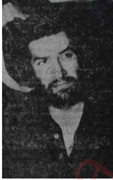
Sakallı bir grevci özenti mi?

Topkapı Arpaemini yokuşu No. 33'de faaliyette bulunan Trio lastik fabrikası işçileri. Lastik-tş sendikasının teşebbüsüyle greve başlamışlardı. Fakat bu grev -ki Grev kanununun kabulünden sonra yapılan ilk kanuni grev