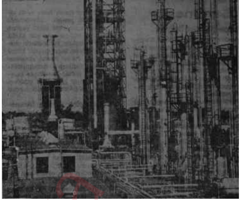
Bir rafineri tesisi Play Boyluğa paydos

Fakat devlet, toprağım elinden aldığı geniş arazi sahibine bunun ne bedelini birden vermiş, ne bono usulüne baş vurmuş, tabii ne de komünistlerin yaptığı gibi gâsbetmiştir. Çinliler düşünmüşlerdir ki eğer devletin eline geçen arazinin parasını devlet hemen vermeye kalkışsa mutlaka enflasyona gitmesi gerekecektir, Bono. aynı isti-