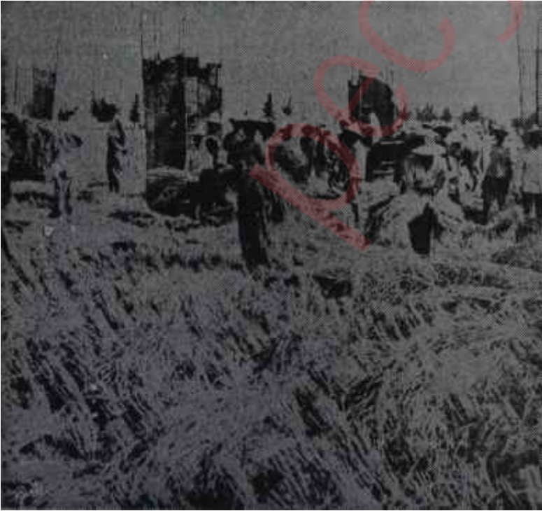
Bereketli topraklar üzerinde hasat Çalışan kazanıyor.

1961'de Devit 32.752 şialık arazi dağıtmıştır: Bu rakkam 1952'de 17.869, 1953'te 12.400, 1958'te 9.783 şia olmuştur. Bunun sebebi, ilk elde en iyi topraklara talip çıkmış olması, ondan sonraki toprakların kalitesinin daha düşük bulunmasıdır. Mamafih 1961'de topraklar iyileştirilince dağıtılan arazi 26.177 şia olmuştur. Yapılan son istatistiklere göre 98.980 şialık arazi 203.531 aileye dağıtılmış, daha doğrusu satılmıştır. Bugün, 1963'te Formozada bütün borcunu ödemiş ve toprağına tam manasıyla sahip dünya kadar köylü aile görmek kabildir. Bunlar, Toprak Reformunun faydayla birlikte refah getirdiği zümrelerdir ve hayatlarından