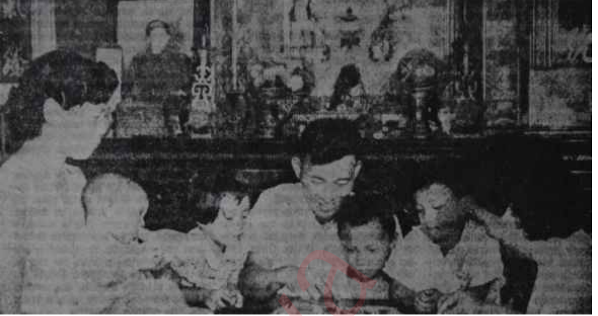
Çinde bir çiftçi ailesi Son gülen iyi gülüyor