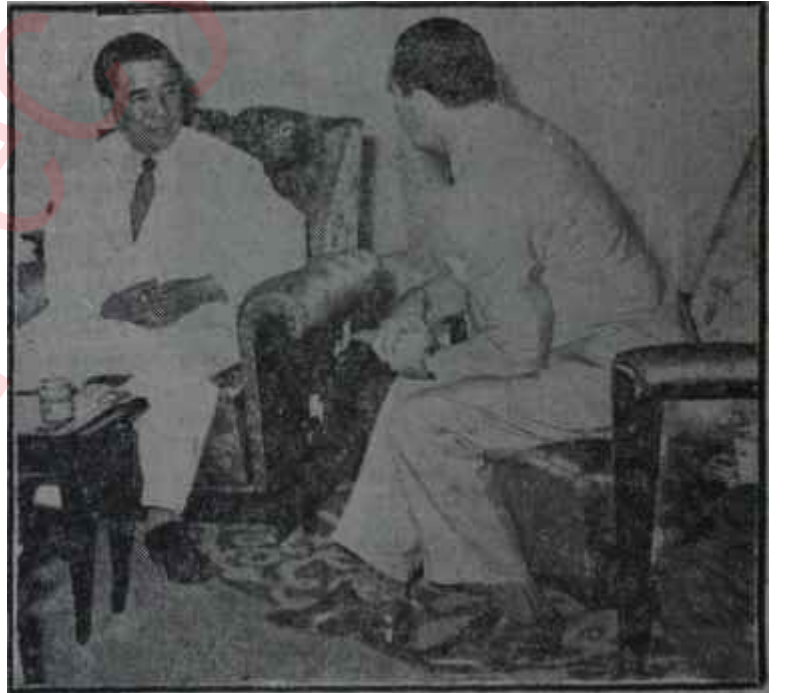
Diem Başyazarımızla İhtilâlden iki gün önce