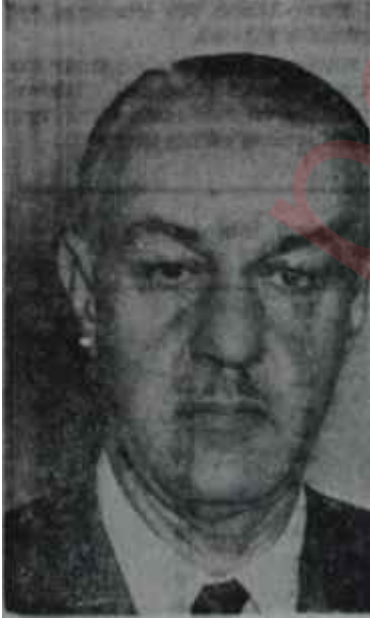
Suat Hayri Ürgüplü Ver papucumu, al abdestini

Komisyon hemen toplandı. CHP'den Mehmet Hazer ve Zihni Betil. AP'den İskender Cenap Ege ve hızlı senatör İhsan Sabri Çağlayangil, Tabii Senatörler adına Suphi Karaman, Cumhurbaşkanlığı kontenjanından ise