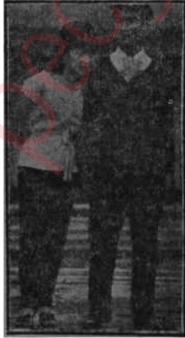
Nhu'lar Kadının fendi erkeği yaktı.

Budist Teşkilâtının ileri gelenleri bunu budistlerin katolik Diem Hükümeti' tarafından tazyiki saymışlardı. El altından yapılan propagandada budistlerin bayrak taşımalarının bütün bütün yasak edildiği yolunda haberler ya-