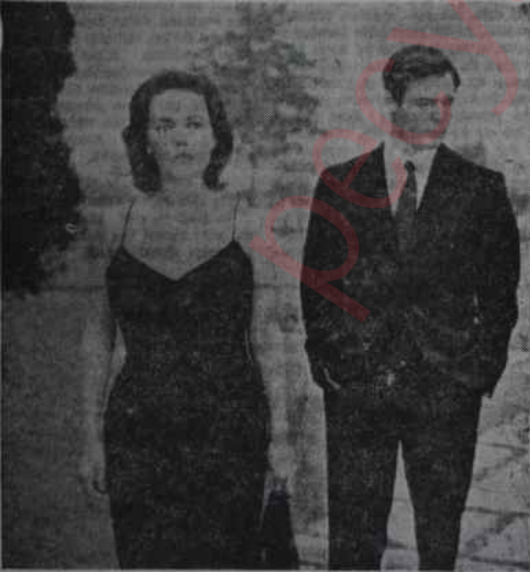
Jean Moreau ve Marcello Mastroianni: "La Notte - Gece" de

Giovanni ile Lidia, bu garip yaşayışa bir süre dışardan seyirci kaldıktan sonra, istemeden ve ellerinde olmaksızın, bir içgüdüyle o kişilerin oyunlarına, düzenlerine "muhteşem Roma gecesi" nin çilginliklarına kendilerini kaptırırlar. Böylece karı-koca yeniden birbirlerinden koparlar. Giovanni, evin kızı Valentina (Monico Vitti) nin gençliğine ve güzelliğine çekiciliğine dayanamaz. Ama çok geçmeden her ikisi de - Giovanni ve Valentina - bu yeni ilişkinin boşluğunu, gerçek değerini ölçmekten geri kalmazlar. Bu deneme, kendilerine yalnızca bir hayal kırıklığından başka birşey getiremeyecektir. Bu gerçeği anladıklarında