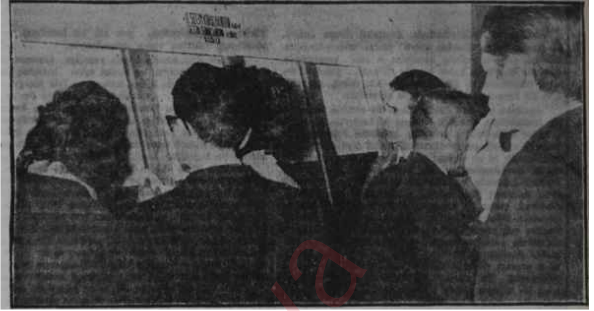
Seçmen kütüklerini inceleyen seçmenler Vazife saati