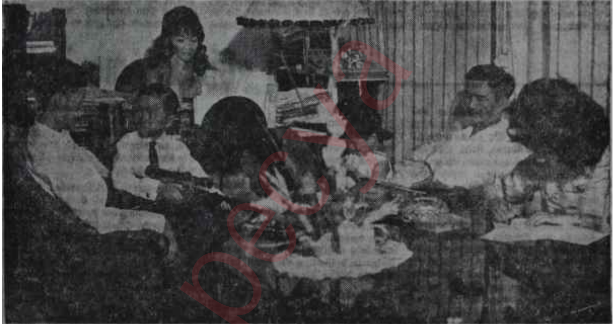
Nhu familyası bir arada Başkanlık makamında bir Kleopatra

Amerikalıları Nhu'ların pirelendirmesinde, kaçık Bayan Nhu'nun ölçsüz sözlerinden ziyade merkezinde Nhu bulunan bir takım siyasi oyunların rol oynadığı şüphesizdir. 1956'dan beri milletvekili olan, bu sıfatıyla memleketinin hayatında faal de rol oynayan, kadın haklarını korumak azmiyle çeşitli kanunlar yaptırtan, bir takım paramiliter kadın teşkilatları kurup onları, hatta Ordu birliklerini teftiş eden, kızını elde silah yetiştiren, bir cazip şehir olan Saygonu koyu katolikliği yüzünden manastıra çeviren.