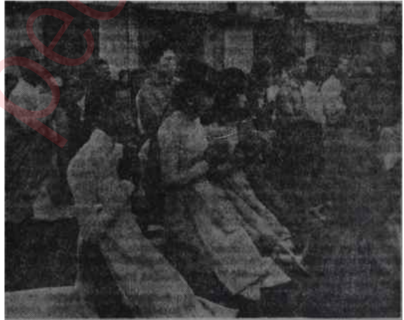
Budist kızlar bir ayın sırasında

Komünistlere karşı girişilen savaş başarıya yönelirse, en büyük memnuniyeti Birleşik Amerika duyacaktır. Güney Vietnam'a yaptığı yardımların Diem'in yanlış tutumu yüzünden heba olmasını, Washington, büyük bir endişe ile karşılıyordu. Bu bakımdan bazı gözlemciler, yapılan ihtilâlde Amerikanın parmağını arayacak kadar ileri gitmektedirler. Bilhassa şu sırada Amerikada bulunan Bayan Nhu'ya göre bu olup bitenlerin tek sorumlusu, Amerikadır. Amerikan idarecileri, Vietnamdaki ajanları vasıtasıyla, bu darbenin yapılacağını çoktan öğrenmişlerdi, fakat buna karşı hiçbir harekette bulunmamış, üstelik Diem'e yapılan yardımları kısarak onu daha da güç duruma sokmuşlardır. Moskova radyosuna göre de, eğer bu iddia Bayan Nhu gibi işin her türlü girdisini çıktısını bilen biri tarafından ileri sürülüyorsa, buna inanmak lâzımdır.