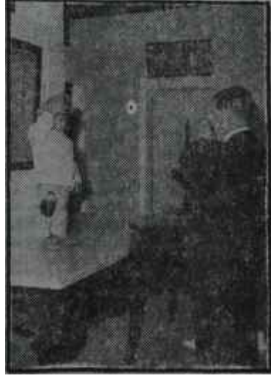
Diem ve sevgili yeğeni Dert açan sevgi

8 Mayıs günü Hue'de iki nümayiş oldu. Birincisi, daha politik bir mâna taşımaktaydı. Zira gösteriyi yapanlar, Diem'in Kuzey Eyaletleri Müşaviri olan kardeşi Dgo-Dinh-Canh'm adamı Hleu'yu yuhaladılar. Nümayişin esas sebebi, Hükümetin çıkardığı bir nizamnameyi protesto etmek içindi Hükümet, budist gösterilerinde budistlere alt bayrakların Vietnam bayrağından üstün mevkide bulundurulmasını yasak etmişti. Budist rahipler ve