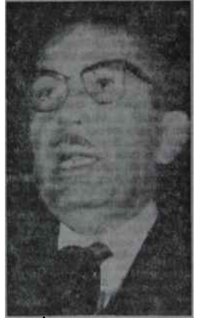
İ. Sabri Çağlayangil Olmadı başkan

Bunun üzerine, AP kulisini idare eden Turan Bilgin ve Cihat Bilgehan harekete geçtiler. Evvelâ AP içinde geniş bir faaliyette bulundular. CHP ile herşeye rağmen bir anlaşmaya varılması gerekiyordu. Bunun haricinde bir seçimin sonuçlanması imkânsızdı. Enver Aka, CHP ye oldukça sempatik görünüyordu. CHP üzerine Aka yönünden gidilirse bir sonuca varmak mümkün olabilecekti AP içinde yapılan kulis şu şekilde işlendi: "AP gibi Türkiyenin en fazla oyuna sahip bir siyasi teşekkülün. Senato Başkanlığı-