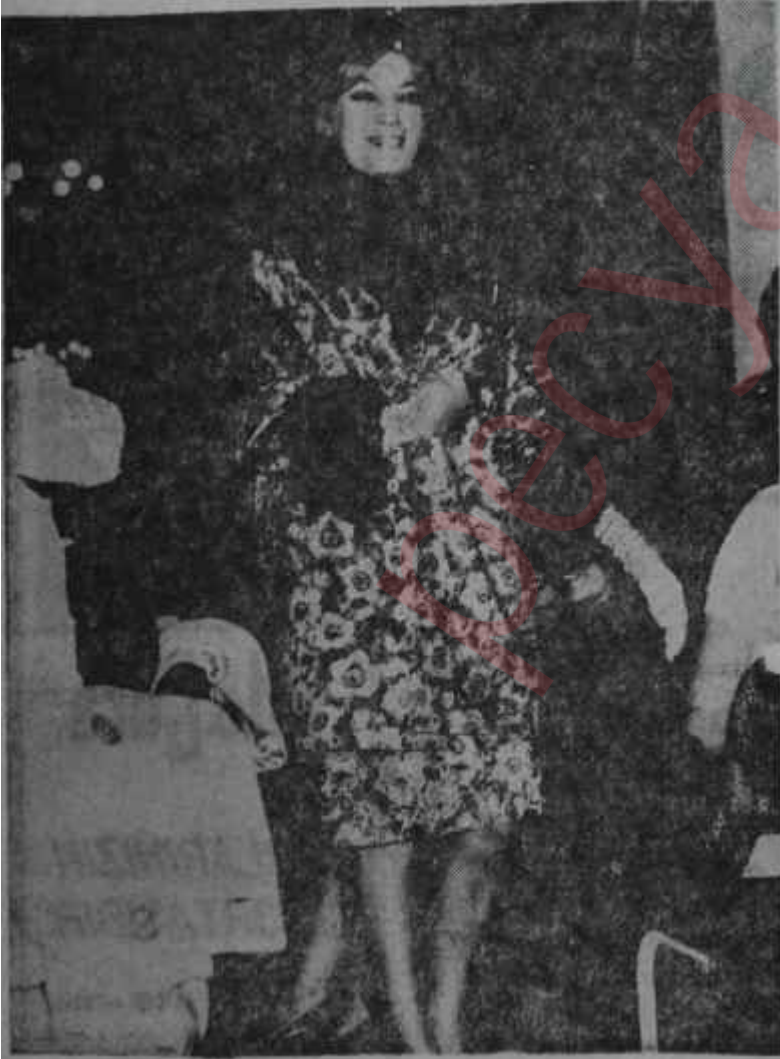
Faizenin moda defilesi Gözlere şenlik

P azartesi günü Ankara Palasta Fa- rize moda salonunun defilesi vardı. Kısa zamanda işlerini hakikaten yok geliştiren ve ilerleten bu müessese bilhassa titiz ve muntazam çalışması