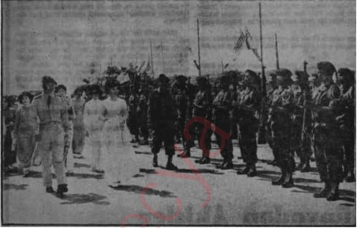
Paraşütçüleri teftiş eden eteklikli