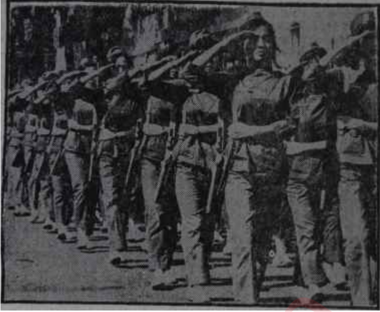
Nhu'ların kızı arkadaşlarıyla talimde