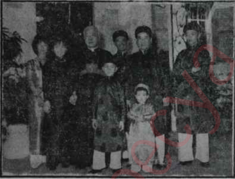
Tarihe karışan aile: Ngo Dinh'ler Yel üfürdü su götürdü

Vietnam, Diem ekibinin elinde dokuz yıl geçirdi. Bu dokuz yılın sonunda çok sahada çok terakkinin elde edilmiş olduğunda şüphe yoktur. Vietminh. Diem'in seçim yapmak niyetinde olmadığını anlar anlamaz 17. Paralelden aşağı sarmakta tereddüt etmedi. O günden bu yana devam eden, bir klasik harp değildir. Bir gerilla savaşıdır. Kuzeyliler çeteler kurmakta, onları silâhlandırarak, sonra hududu geçirip Güneye salmaktadırlar. Bunlar Güney köylerini haraca kesmekte, yiyecek ve giyeceklerini orarlardan sağlamakta, türlü vahşet yapmakta, hattâ zaman zaman Saygon yakınlarına gelerek ona buna kurşun sıkmaktadırlar. Maksat dünyaya, Di-