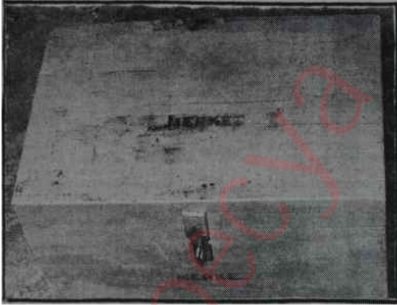
Seçim sandıkları İçinden çıkana bak

liği etmişcesine hayli sitayişkâr sözlerle Napoleon Bonaparte'den bahsetmekte ve başlarını hayranlıkla sallıyarak: