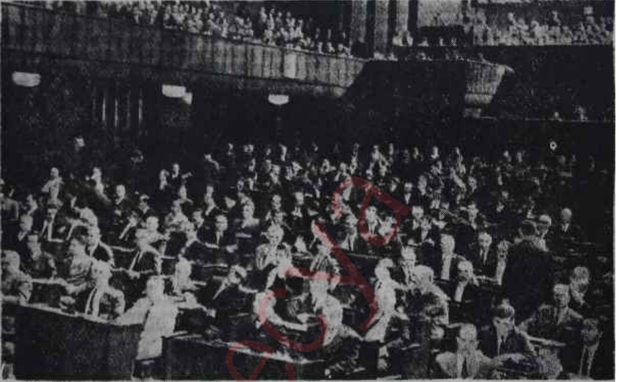
T. B. M. M. toplantı halinde Haramda su döğülüyor