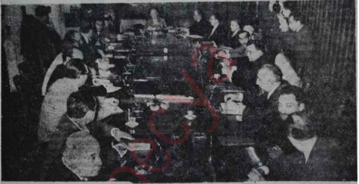
İnönü Hükümeti çalışıyor Ama kör topal

Haftanın ortasında bulutlar dağılmadı. Koalisyon yürüyordu. Yürüyordu ama, kör topal yürüyordu. Üstelik bu yürüme, taraflara çok şeye mal olmaktaydı. Her iki uçta da hakim fikir buydu. Bilinen, tebessümlerin al-