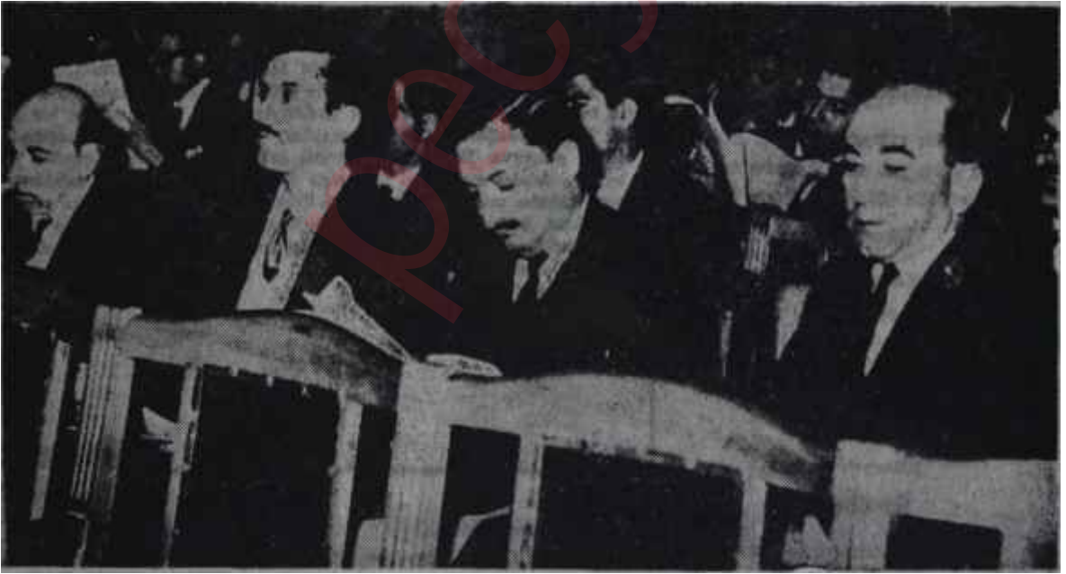
Bülent Ecevit Ankara Basın-İş Sendikası kongresinde

Gümrükler — Bundan kısa bir süre önce İzmir Cumaovası Hava Alanına, değirmenlerde kullanılmak üzere, bir balya eleklik tül gelmişti. Muayene ve izin gibi formalitelerin tamamlanmasından sonra balyayı şehre götürecek olan kamyon tam hareket ettiği sırada hava alanı gümrüğüne bir ihbar yapıldı. Buna göre, tüller aslında eleklik değil, perdelik tüldü. Gümrük memurları