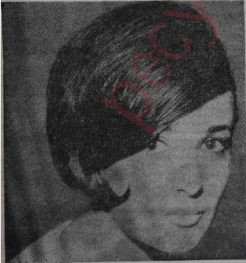
Son model saç tuvaleti Hanımlara müjde!

Türk-Amerikan Kadınları Kültür Derneği 16 Ekimde Büyük Millet Meclisinde, Şeref Salonunda verilen çay ile faaliyet yılına girdi. Çalışma kola-