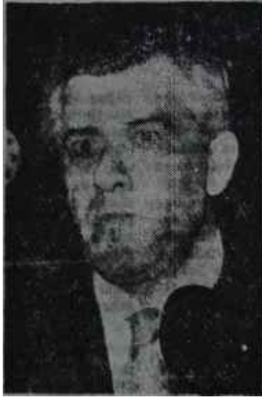
Kemal Satır Uyan Sanam uyan!..

AP yöneticileri Türkiye'nin Belediye Başkanlığı açısından bir çok yerinde endişeye düşmüşlerdir. Mesela en fazla güvendikleri Ege Bölgesinde