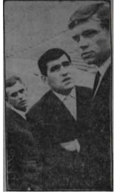
"Öldüren Dakikalar" Havanda döğülen su