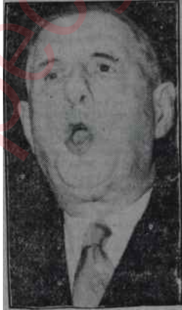
General De Gaulle Kendi başına buyruk

Gazetecilerin sorularını -cevapsız bırakan uzun boylu diplomat, Fransız, Dışişleri Bakanı Couve de Murville'di ve kendisi ketum davranmakta ne kadar ısrar ederse etsin, Washington'a gittiği zaman amerikan idarecileriyim Fransa ile Amerika arasındaki görüş ayrılıklarını görüşeceğini herkes açıkça biliyordu. Fakat ne var ki, hiç kimse bu görüş ayrılıklarının öyle bir görüşme ile giderileceğine inanıyor de-