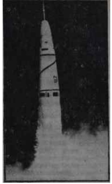
Bir roket Al gülüm ver gülüm

Halen amerikanların elinde, muhtemel bir nükleer savaşta kullanılmak üzere hazır durumda bekleyen 400 ton kadar, atom ve hidrojen bombalarının kullanılan, ham madde -yani Uranyum 235 veya saf Plütonyum- mevcuttur. Bu maddelerin kullanılmasıyla 39 bin civarında nükleer harp başlığı yapılabileceği hesaplanmış ve imalât temposu buna göre âyarlanmıştır. Bunlardan 25 bin kadarının 50 kilometrenin altında menzili bulunan "taktik" harp başlığı olduğu da bilinmektedir. Bu başlıklara en iyi