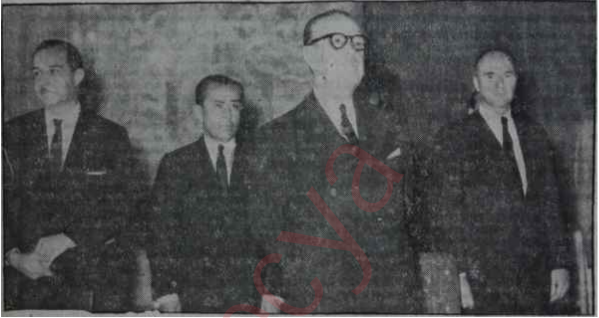
Ortak Pazar andlaşmasında Türk delegasyonu