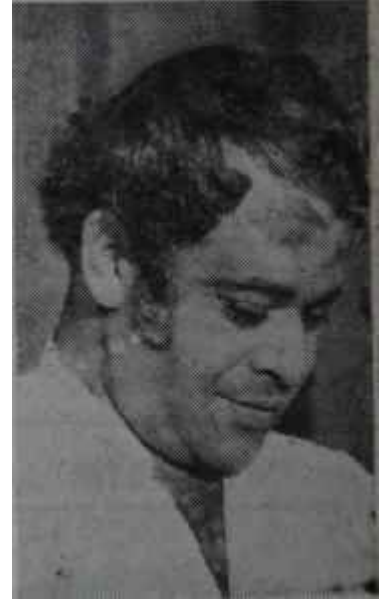
Haldun Dormen - Yıldırım Önal