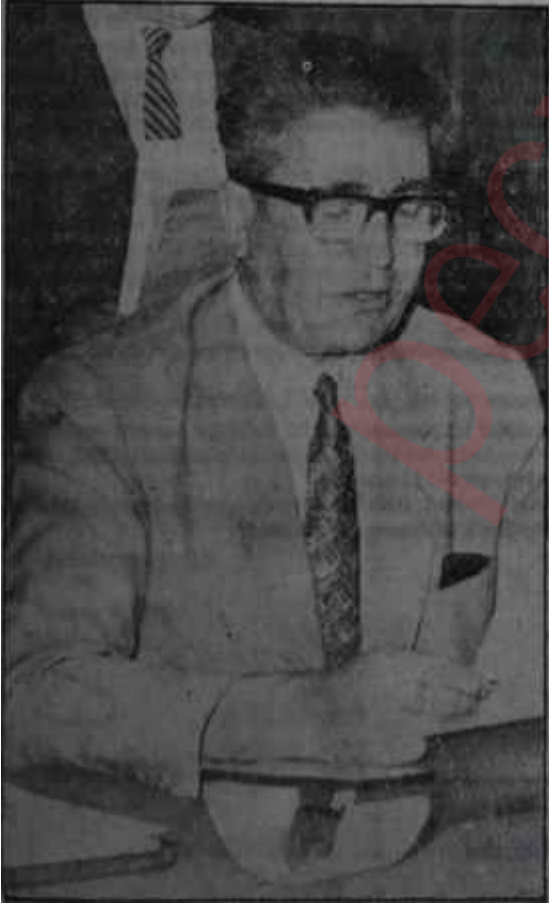
Maliye Bakanı Melen konuşuyor İki kere iki dört eder