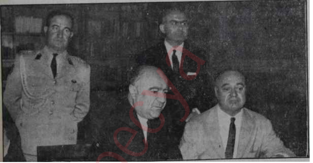
İçişleri Bakanı Bekata Eratamanın firarını açıklıyor Ziyadesiyle nüktedan bir zat!

G çtiğimiz hafta cuma gecyansını 10 dakika geçe Edirnenin, Karabayı köyünde şosedin beş adam ayrıldı. Adamlar hızlı adımlarla Yunan hududuna doğru yürümeğe başladılar. Orta boylu, saçları dökük, hafif kambur ve gri pardesülüsünün heyecandan ne redeyse dizlerinin bağı çözülecekti. Zifiri karanlıkta ilerlerken, yanındaki arkadaşlarına mütemadiyen, Yunan hududuna gelip gelmediklerini soruyor-