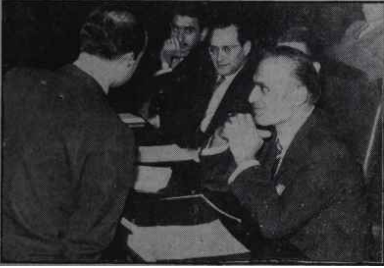
Plâncılar Mecliste Plân görüşmelerinde İki tarafı yaş değnek