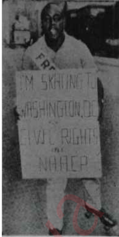
Washington'a yürüyüş Havanda su döğenler

Zencilere iş vermek, ev kiralamak, zenci çocuklarla beyazların birlikte okuması konularında yapılan ayırım gizli kapaklı değildir. Bu, ilk bakışta göze çarpan, herkesçe bilinen bir ayırımdır. Bir de ilk bakışta göze çarpmayan bazı ayırımlar var ki, insan bunların farkına, bir süre amerikan toplumunda yaşadıkten sonra varıyor. Meselâ amerikan film yapımcıları, zenci meseleleriyle ilgili konulara el atmadan dikkatle kaçınırmaktadırlar. Sonra, çevrilen filmlerde, Amerikada bir zenci topluluğu olduğunu gösterecek hiçbir belirtiye rastlanmamaktadır. Aynı şekilde, zenci nüfusun 1.5 milyona yaklaştığı koca New-York'ta, zenciler hakkında, ya da onlar için yapılmış - CBS'in 15 dakikalık bir sabah programı hariç- hiçbir program olmadığı gibi, diğer programlarda zencilerin varlığına işaret eden hiçbir belirti de yok-