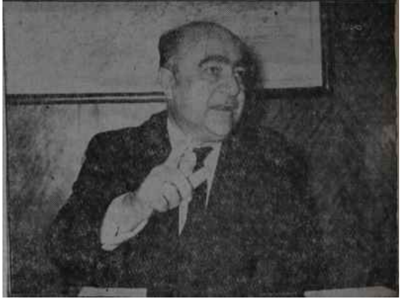
İçişleri Bakanı Bekata konuşuyor

Ancak ilgililer, Bekatanın İstanbulu ikiye ayırmakla değil amai hiç değilse ihtiyaca cevap vermeyen Köy Kanunu, Belediye Kanunu ve Osmanlı devrinden kalma köhnemiş İdare-i Umumiye-i Vilayet Kanunu ile meşgul olmasını istemekteler. İdarelerin dertleri bu üç noktada birleşmektedir. Bu meseleler halledilmedikten sonra ihtiyaçlara cevap vermeyen kanunlarla muazzam bir finansman sıkıntısı içinde İstanbul değil ikiye, oniki parçaya da bölünse müspet bir