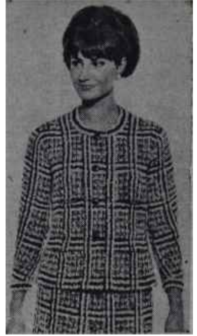
Bir Chanel tayyör

Chanel yalnız bir moda oyuncusu değildir. O, Birinci Dünya Savaşından itibaren kadının hürriyeti için çalışmıştır. Chanel'e göre, hürriyet kıyafetle de tahdit edilebilmektedir. Nitekim o, kendi saçlarını kısacık keserek, kadını usun saçtan kurtarmış ve ona iş hayatında rahatça giyinebileceği elbiseler yapmış, modada bir büyük ihtilâl yaratmış ve modayı erkeklerin hisarından kurtararak, kadına sade giyim mefhumunu aşlamıştır. Svec — etek modası, rahat tayyör modası hep Chanel'in ortaya attığı icat-