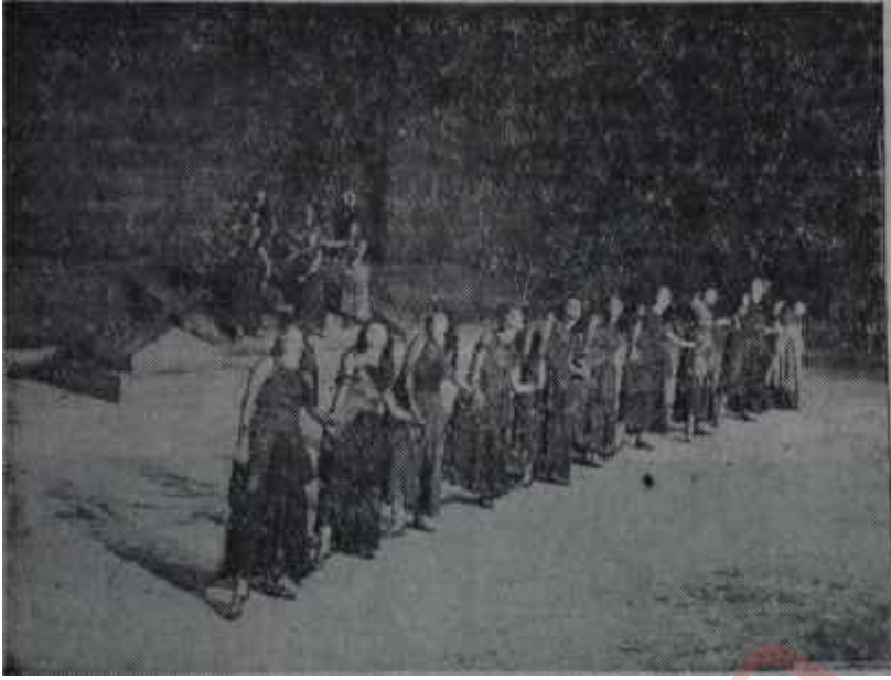
Atina Festivalinde "Bakkha"lar Diomyos'u mest eden koro