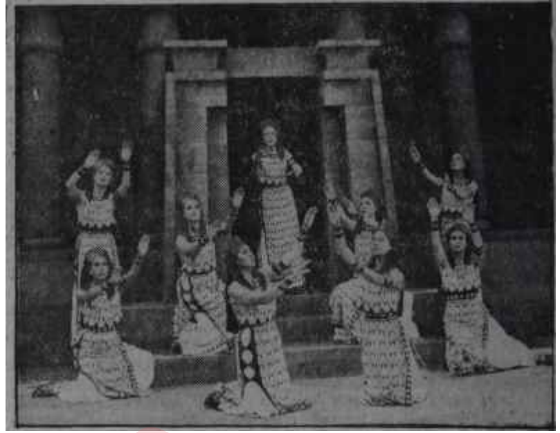
Atina festivalinde "Helena"

Bu faydalı temaslar, şimdiden, 6-nümüzdeki mevsim için bazı opera solistlerimizin Atina ve Ankara arasında mübadelesi, Bale topluluğumuzun gelecek yaz Atina Festivaline katılması gibi güzel tasarıların ele alınması-na yol açtı. Balemizin son gelişmeleri