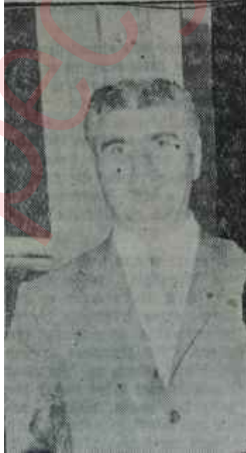
Talât Aydemir No:1