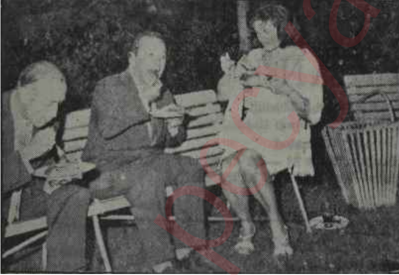
Polonya Büyük Elçiliğindeki kokteylde Çelikbaş atıştırıyor Yediğini inkâretmiyor, maşallah!

Kasım Gülek, yüzünden eksik etmediği gülümsemesiyle herkesin elini