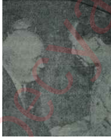
Krutçef Pekinde Mao ile ...hayali cihan değer