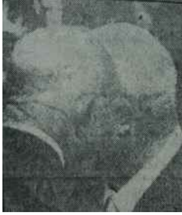
Krutçef Camp David'te İke ile Tarih tekerrürden ibarettir

Tabii işin iyi ve pratik tarafı, nükleer silâh denemelerinin yasaklanması konusunda üç heyetin Moskovada anlaşmaya varın neticeyi almasıdır. O takdirde siyasi hava son derece yumuşak ve böyle bir ortam içinde Saldırmazlık Paktı çok kolaylaşacaktır. Zaten tutulan yol da bu olmuştur. Bu Paktın, belki de XX. Asrın en önemli siyasi hâdisesini teşkil edeceğinden hiç kimsenin şüphesi yoktur. Ama bu önemde bir hadisenin, bugünden yarına, hiç haksızlık ve ortamı yapılmaksızın gerçekleşmesi çeşitli çevrelerin direnmeleriyle güçle-