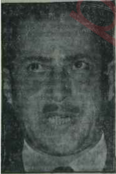
Celâl Sungur Yel üfürdü...

Özal ve Dizdaroğlunun bu izahlarından sonra toplantıdaki hava birden gerginleşti, müşterek toplantı içinde iki karşı fikir belirdi. Biri,