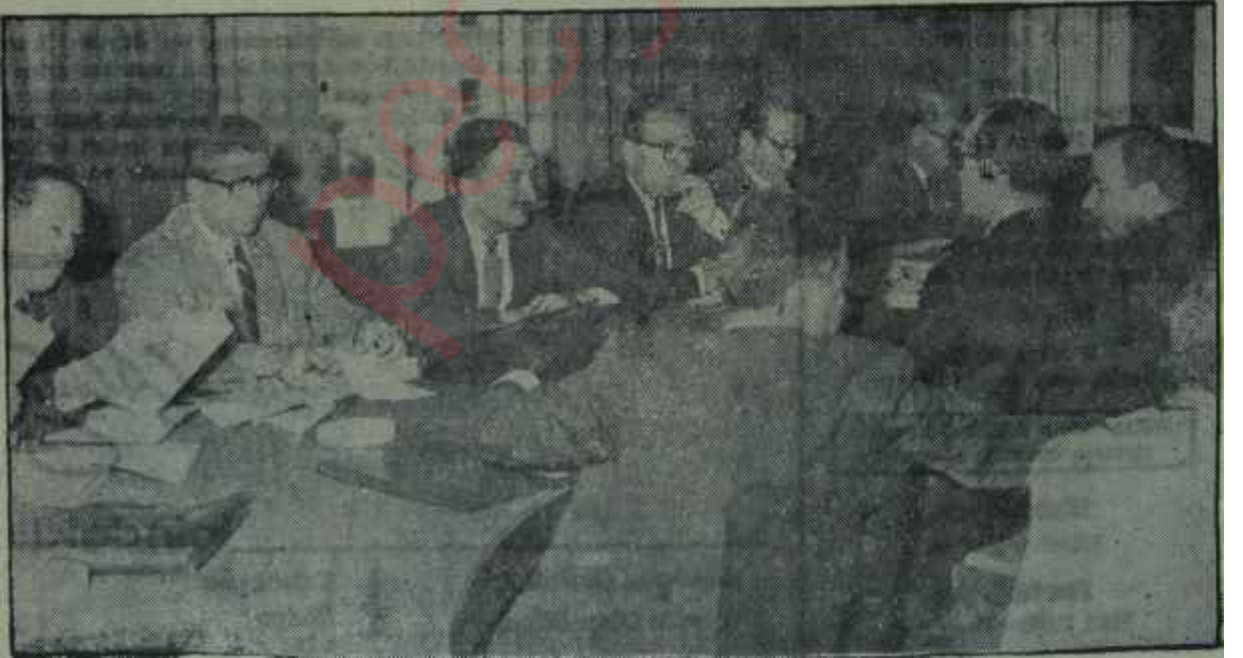
Özel Sektör temsilcileri Hükümet üyeleriyle yaptıkları toplantıda

— XI. Kota sanayicilere tahsisti ithal mallardan yapacakları ithalat için yüzde 10 nispetinde nakdi teminat yatırımları külfetini yüklemiş bulunmakta-