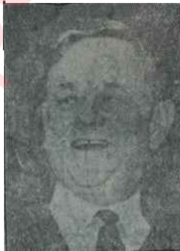
Lord Hailsham Sâkin ingiliz

yasaklama konusunda görüştü. Havada, denizde, fezada ve karada yapılacak denemelerin yasaklanması konusunda fazla bir müşkilatla karşılaşılma-dı. Bu hususlarda uzun Cenevre konuşmalarında hava yumuşatılmış, meseleler olgun hale getirilmişti. İhtilâf konusu, yeraltı denemeleri