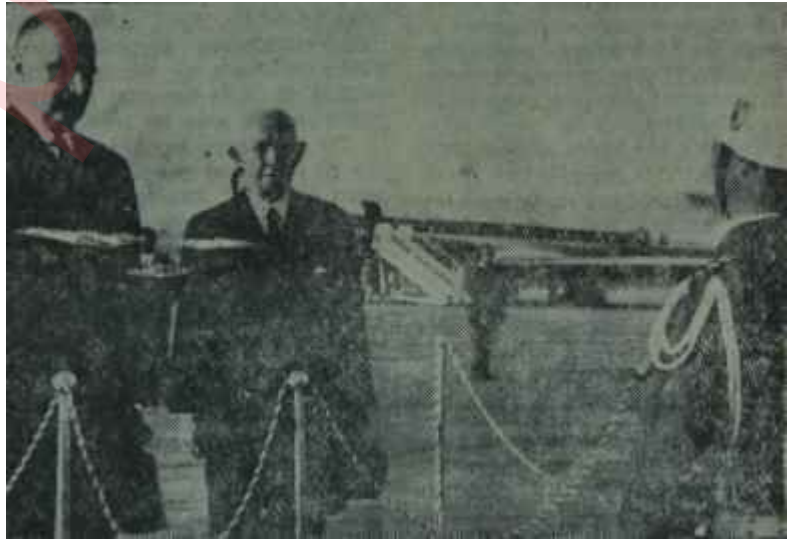
Georges Pompidou ve İsmet İnönü