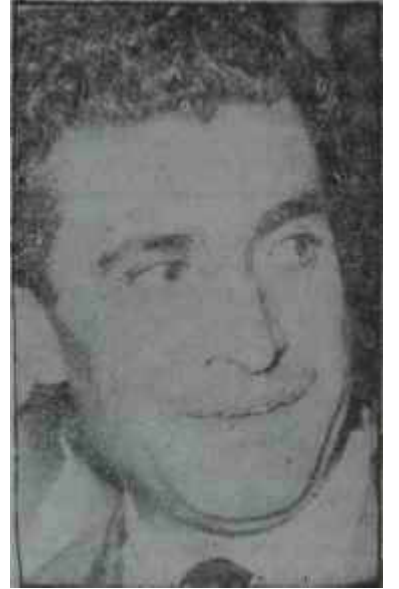
Talât Asal "Au Revoir!"

YTP Grubunda ilk konuşmayı Ta-lât Asal yaptı. Asal daha evvel or-taya çıkan ve Öçtenin liderliğini yaptığı Grubun sözcüsü durumun-