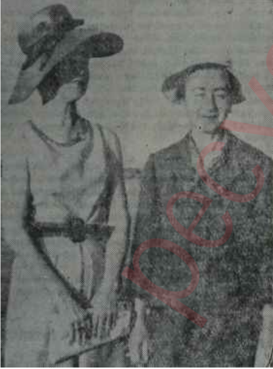
Mme. Pompidou ve Bayan İnönü