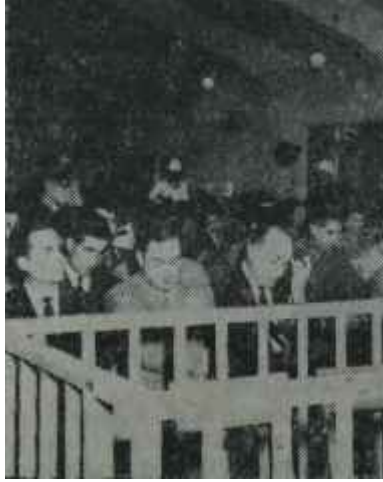
20-21 Mayıs sanıkları Finişe doğru

"— Muhakeme bizim yönümüzden sona ermek üzeredir. Bu mah-