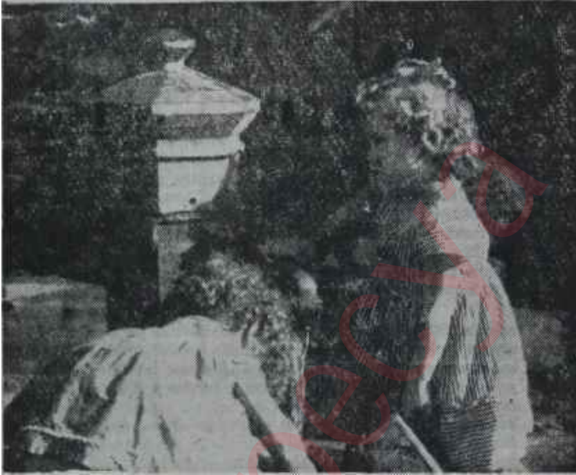
Ankarada çeşme başında çocuklar Kerbelâ sakinleri

Diğer bir baraj Kayaş vadisindeki yan derelerden Bayındır deresi üzerinde inşa edilmekte olan -aynı zamanda, şehirde tahribat yapan taşkın sularını da tutacak- Kayaş barajıdır. Bu da yılda ortalama 7 milyon metreküb su sağlayacak ve 1965