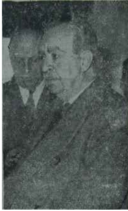
Ahmet Emin Yalman Sil baştan!