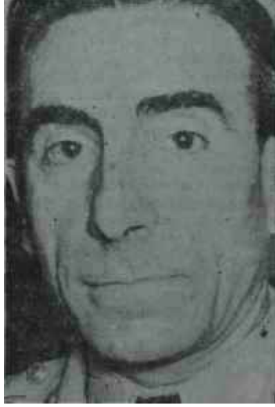
Alpaslan Türkeş İpliği pazara çıktı.

Kararnamede. hazırlığı bu olan bir devletin demokratik sistemle hiç bir alakası olamayacağı belirtilmekte ve