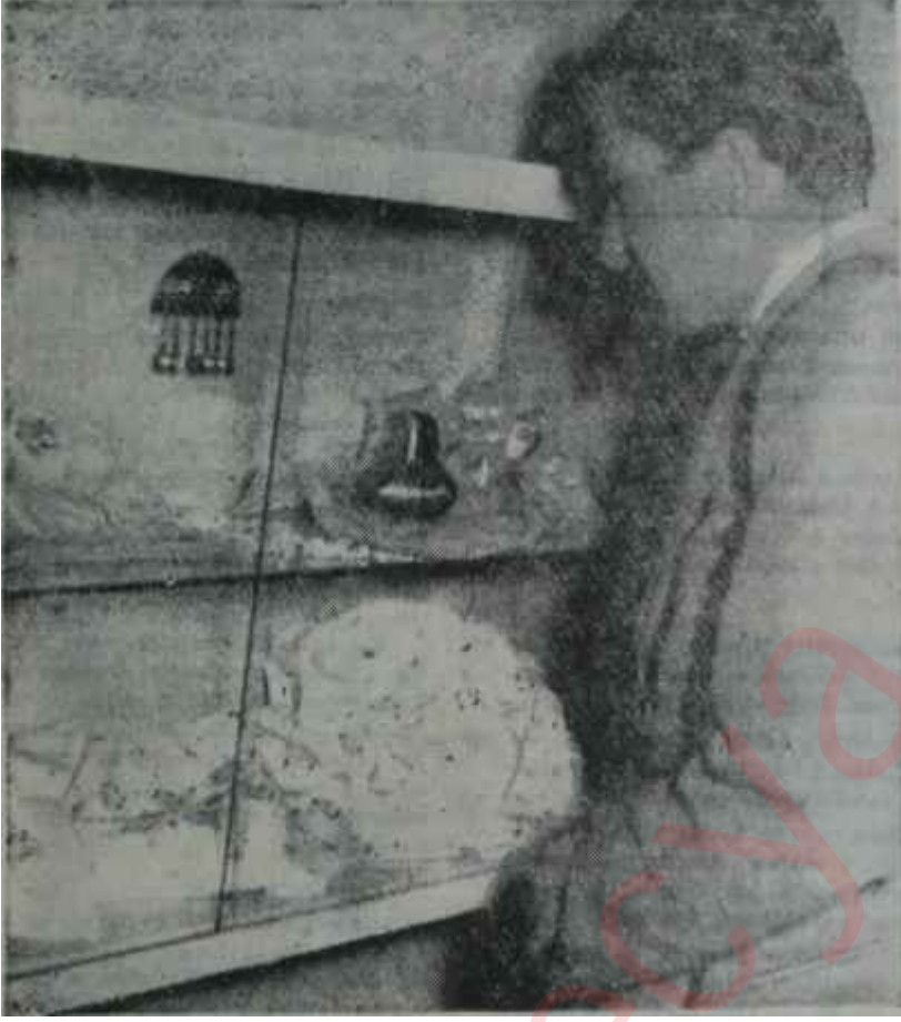
Türk El Sanatlarını Tanıtma Derneğinin eserlerinden Boşa gitmeyen emek