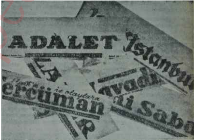
Fırsatçı gazetelerin başlıkları