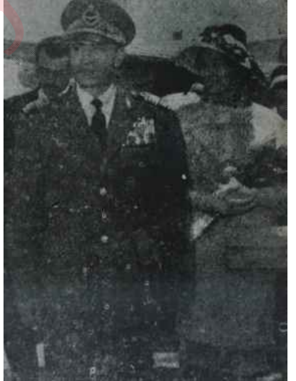
İran Şahı ve eşi Farah

Ondan sonra komşu memleketi korkunç bir kaosun beklemekte oluşu, meseleye bizim de büyük önem vermемizin sebebidir.