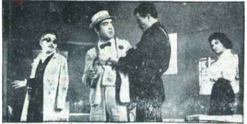
Dormen Tiyatrosunda "Altın Yumruk"

Sonuç: Mevsimi gerçek bir başarıyla kapayan bir "altın oyun".