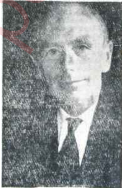
Lord Home Karşıye yolunda

Dışişleri Bakanları arasındaki politika konuşmalarında bir "umumi dünya ahvali" ele alındı, bir de "Türkiyeyi hususi surette ilgilendiren meseleler" görüşüldü. Batı - Do-