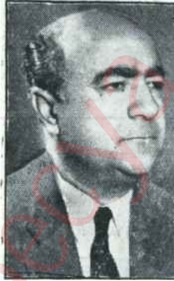
Hıfzı Oğuz Bekata Çanlar kimin için çalıyor?

Zira M.B.K. idaresinin bir iyi devlet, bir iyi memleket idaresi olmakta çok uzak bulunduğunu Türkiyede herkesten mükemmel ve yakın Türk Silâhlı Kuvvetlerinin mahsupları bilmektedirler. Hele bir takım "devrin kudret sahipleri"nin, seçimlerin bu şekilde neticelenmesi içinleriyle, cansiperane çalıştıkları hiç