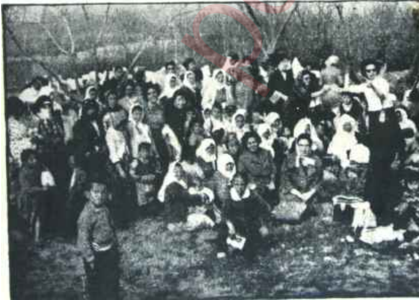
Köyde dernek çalışmaları İğinin doğurduđu içtenlik

Aileler arasında deđiş - tokuş: Umumiyetle üniversite ofisleri bu işi üzerlerine almışlardır. Bunlar, adresleri temin etmekte ve çocuklarını tatile göndermek isteyen ailelerin mektuplaşmalarına yardımcı olmakta, gereken işlemleri yapmaktadır. Böylece aile, hiç para harcamadan, kendi çocuğunu yollamakta ve buna mukabil, o evin çocuğunu mi-