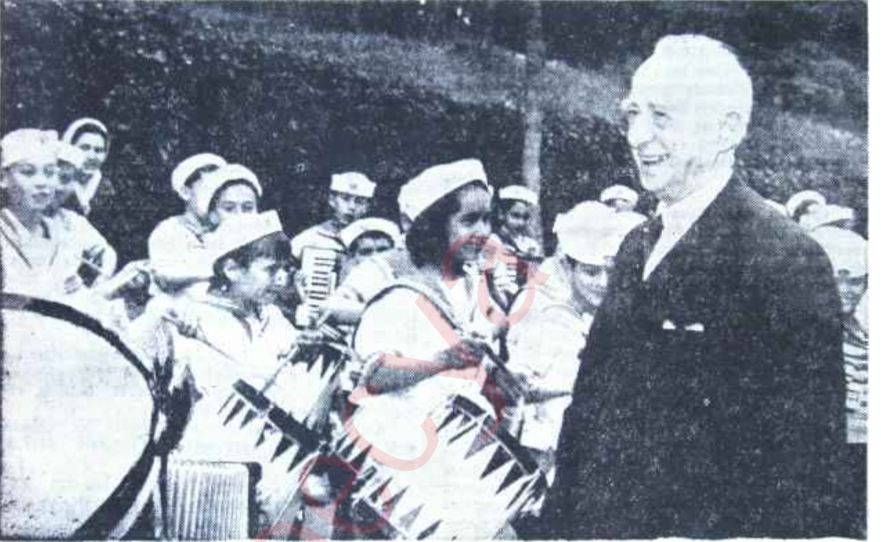
23 Nisan günü çocuk bandosu ve İsmet İnönü