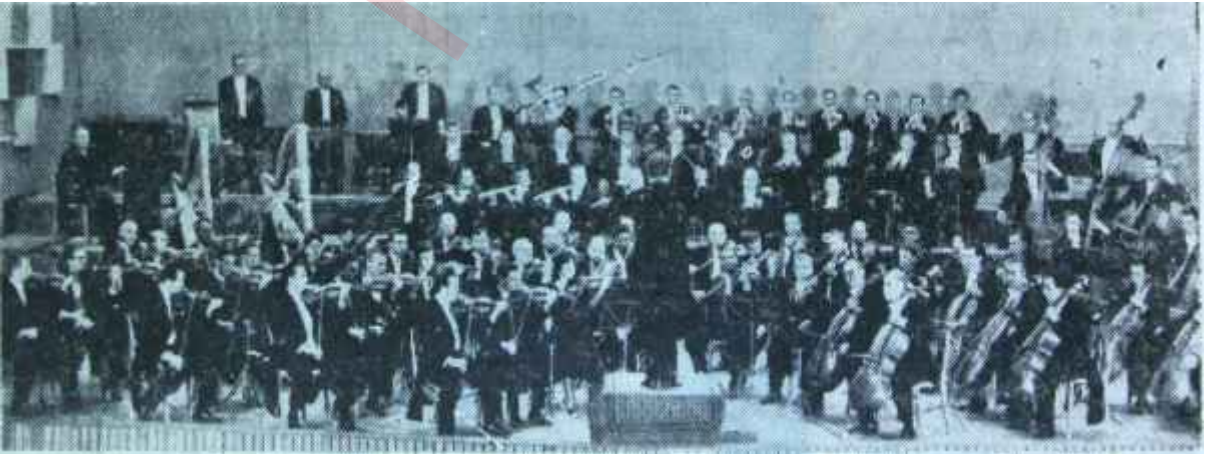
Cumhurbaşkanlığı Senfoni Orkestrası üyeleri bir arada İddialı gezi

T urnenin asıl amacı, memleketimizin sanat müziği alanındaki durumunu ve eriştiği seviyeyi canlı bir şekilde ileri ülkelerde göstermek olduğuna göre, türklerin artık fes giymediğini, yalelli söylemediğini, türk kadınlarının ise peçe takmadığını, maşlâh giymediğini göstermek için sanat alanında ileri milletler gibi kalabalık bir senfoni orkestrasıyla üç seçkin solocumuzu dinletmek yerindedir. Ancak, uygarlığın ortak malı hâline gelmiş olan bazı bestelerin çalınmasıyla bu amaca tam olarak