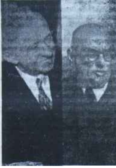
İnönü - Bayar Masal!