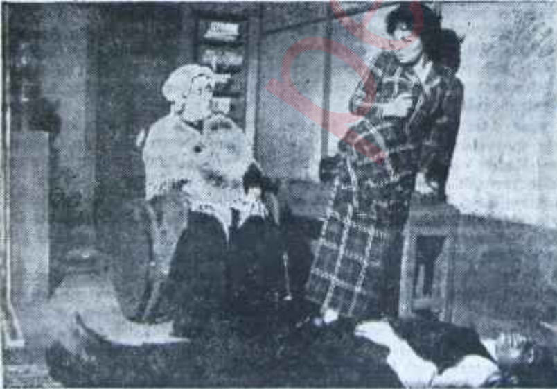
Oraloğlu Tiyatrosunda "Gelin"