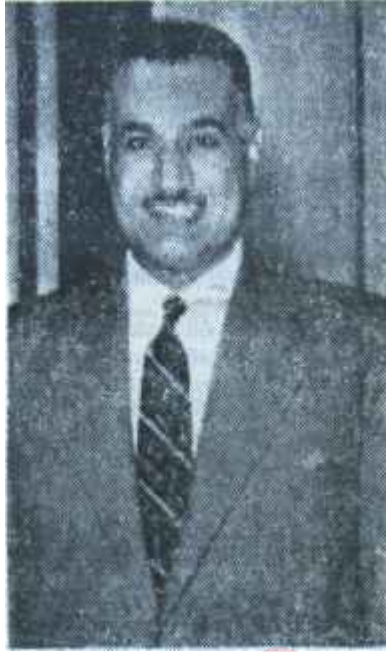
Arap âleminin lideri Nâsır Parsa peşinde

Kral, yeni Başbakana, gönderdiği mektupta, "Avam Kamarası, Başbakan Rifainin Arap Birliği lehindeki politikasını tasvip etmeyerek, artık halkın iradesini temsil etmediğini ortaya koymuştur" diyor. Bu ifadeye bakılacak olursa, eski hükümetin Arap Birliğine taraftar olduğunu v- bu birliği istemeyenler yüzünden başının derde girdiğini zannetmek mümkündür. Halbuki durum tamamen bunun aksidir. Kralın niçin böyle konuştuğunu anlayabilmek için Ürdün'ün içinde bulunduğu şartlar yakından bilmek lâzımdır. Nâsırın Kahire Radyosu vasıtasıyla açtığı geniş propaganda kampanyasının etkisi altında olan Ürdün halkı, esas itibarıyla Arap Birliğine taraftardır. Bunun dışında Nâsıraların ve Baas partisinin Ürdünde çok geniş yeraltı faaliyeti mevcuttur. Bu ülkede, Kral da dahil, hiç bir kuvvet halkta birleşme arzusuna mukavemet edebilecek, bu arzuyu açıkça hiç sayabilecek güçte değildir. Bu ba-