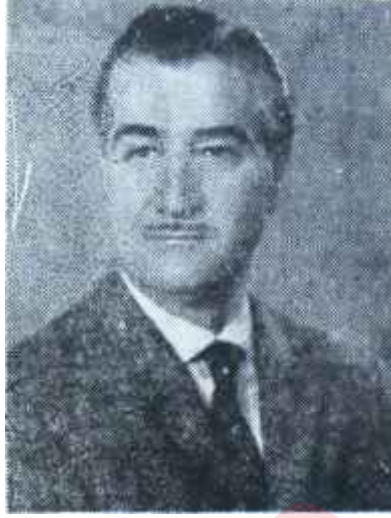
Mükerrer Berk Gayret dayıya

Böylece Orkestranın, gezisinde bol bol türk bestesi çalabilmesi imkânı kısıtlanmıştır. Ancak bu konuda diğer bir güçlük, bizzat müzik alanında ileri sayılan ülkelerdeki dinleyicilerden gelmiştir. Bilhassa Almanyada çağdaş müzikle, hattâ daha az yeni müzik eğilimleriyle bile henüz gerektiği kadar uyuşamamış büyük bir dinleyici kütlesi vardır. Bu kütlenin zevklerini ve alışkanlıklarını gözönünde tutmak zorunda olan konser organizatörleri, senfoni orkestrasının bu gezisini tertipleyenlerden "modern eserleri programa fazlaca koymamalarını" özellikle istemişlerdir. Bu arada, belirtilmiştir ki, konser programlarında 15 - 20 dakikadan daha uzun süren tanın-