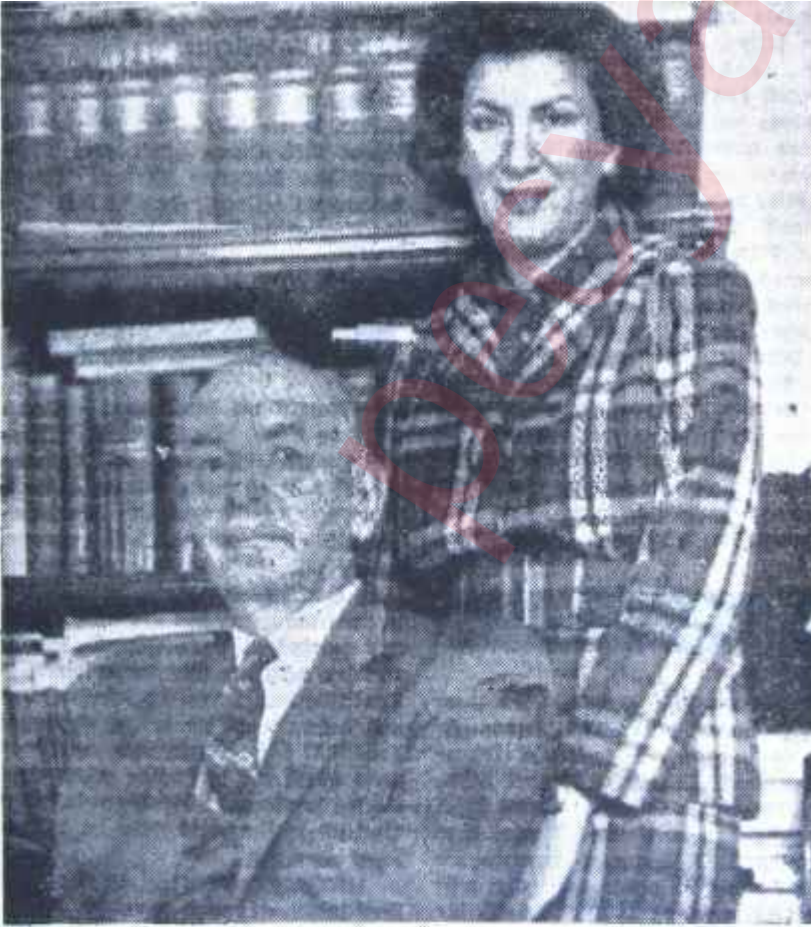
Zekâi Tahir Burak ve eşi Geride kalan: Tatlı hatıralar

1925 yılında Cumhuriyet Hükümeti, 18 milyonu aşmayan nüfusumuzun artması için doğumu teşvik eden bir politika güdüyordu. Bu maksatla memleketin muhtelif yerlerinde ve ilk olarak da Ankarada doğumevleri kurulması plânlandı. Ancak, hükümetin imkânları ve hele eleman bakımından imkânları çok mahduttu. Bu sebeple, önce İstanbul Üniversitesi Tıp Fakültesinden, Ankara Doğumevini kurmak üzere bir doğum mütehassısı tavsiye edilmesi istendi. Bu istek üzerine, o zamanki Tıp Fakültesi Profesörler Meclisi, Zekâi Ta-