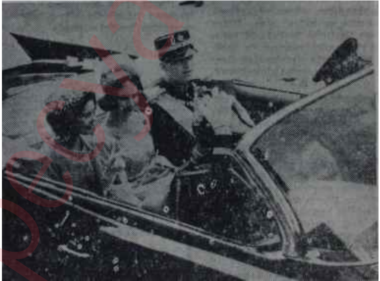
Prenses Sophia ve Don Juan Carlos gezintide Kara kediyeye pist!

Genç çift arasındaki anlaşmazlıkla ilgili haberler bilhassa İngiliz ve Fransız basını günlerce meşgul etti, Saray çevrelerinden sızan