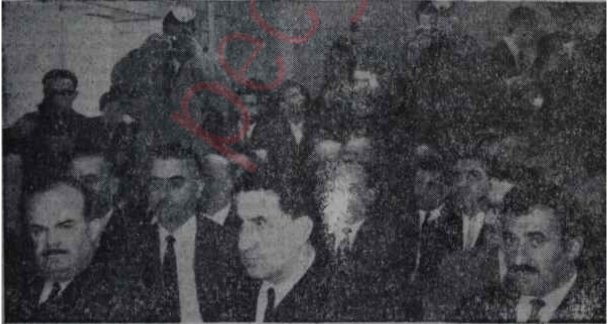
A.P. li temsilciler A. P. Genel Merkezinde