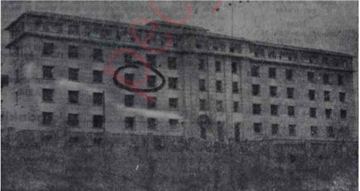
Ankara Hastahanesinde Bayarın kaldıđı odalar

Sonra Bayar bir ağzını açtı mı tam yarım saat ko-nuşmakta, bu sırada ağzı hiç kurumamaktadır. Hal-buki, aç adamın böyle bir marifet yapmasının imkânı yoktur. Bayarın anlattıđı başlıca konular, İstiklâl Mü-cadelesi esnasında gösterdiđi eşsiz yararlıklar ile Ata-türkün hatıralarıdır. Bayar bunları ağır ağır, kendisine mahsus pozlarla ve gözlerini yarı yumup bazan göz-lüklerinin üstünden bakarak nakletmektedir. Şu anda