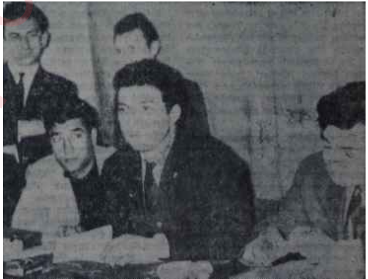
Öğrenci temsilcileri toplu halde

GÜÇ mensupları, bir gece önce, İstanbulda gericilerin toplandığı Aydınlar Kulübünü, sonra, da mahut Toprak dergisini yokladılar. Fakat alman olağanüstü Emniyet tedbirinin yüzünden içeriye giremediler, derginin önünde, devrimler aleyhine neşriyat yapan İlhan Darendelioğlu ve bütün gericiler aleyhine nümâyiş yapmakla yetindiler. Darendelioğlu o gece ancak polisin himayesinde matbaasından çıkabildi ve kurtuluşu kaçmakta buldu. Aynı gece, gene gericiler tarafından çıkarılmakta olan Yeni İstiklâl adlı haftalık gazetenin önünde de aleyhte nümâyişler yapıldı,