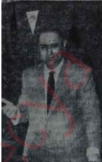
Prof. Behiç Onul

Mesele, 5 Yıllık Plânda Türkiye'de plân devresi sonuna kadar tıp fakültelerinin adedinin üçten sekize çıkarılması'nın sipariş edilmiş olmasından doğdu. Hacettepe, bir fakülte, olmanın bütün şartlarını haiz olduğunu ileri sürerek talebini yaptı. Bu talebi yaparken Hacettepenin başındaki kurnaz Doğramacı umumi efkârı derhal kendi tarafına çekecek bir formülü de beraberinde ortaya attı. Bu formüle göre yeni fakültenin hoca-