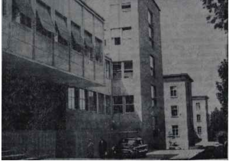
Dışişleri Bakanlığı binası

A.P. için mesele şöyle görünüyordu: Bu faaliyetleri A.P. tasvip etmekte midir, etmemekte midir? Etmiyorsa, bu faaliyetlerin, adaletin pençesine düşeceği muhakkak faillerini bünyesinde muhafaza edecek midir, koruyacak mıdır? yoksa onları telin mi edecektir? Bu, şüphesiz, Hükümetin bir siyasi partinin kapatılmasına karşı olan bütün temayü