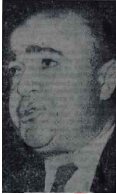
Hıfzı Oğuz Bekata "Dosya koltukta"

düşmanlarını bertaraf edecek kuvveti taşır. Mesele, bu kuvveti harekete geçirmektir. Bunu yaptığımız an, bir buçuk yıldır aldığımız geniş mesafenin son dönemecini dönmüş oluruz. Görürsünüz bunu yapacağınız, bunu başaracağız, bunun tedbirlerini mutlaka bulup tatbik edeceğiz. Millete inanıyorum. Meclise inanıyorum. Adalet mekanizmasına inanıyorum. Ben telâşlı değilim. Memleketin kaderiyle oynayanlardan, kördüğümü kılıç darbeleriyle çözmeden kurtulmak imkânı vardır. Bu memleket benim elimde kazaya uğramamıştır. Uğramamaz."