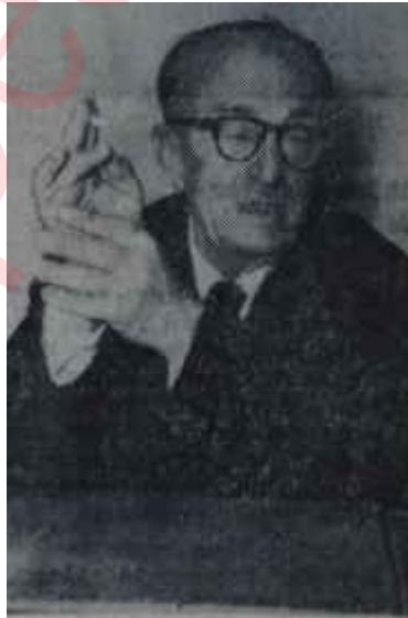
Gümüşpala kendinden geçmiş En tabii fotoğrafı

— Nümayişlerin son günü isteydik Türkiyeyi kana bulardık..." Sonra devam etti: "— O gece telefonla bütün illere itidal tavsiye ettik.."