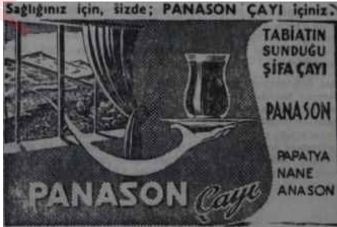
(AKİS . 180))

Gelgör ki. Umum Müdürlüğün Tesisat Dairesi Reisi, ilk ihaledeki tutumu dolayısıyla bu işe karışma* maktâ ve görüşü sorulan Maliye Bakanlığı ilgilileri de: "Maliye Maliye olalı böyle şartname görmedi. Teklif isteme desen, o değil. Kapalı zarf desen, o değil" demektedirler.