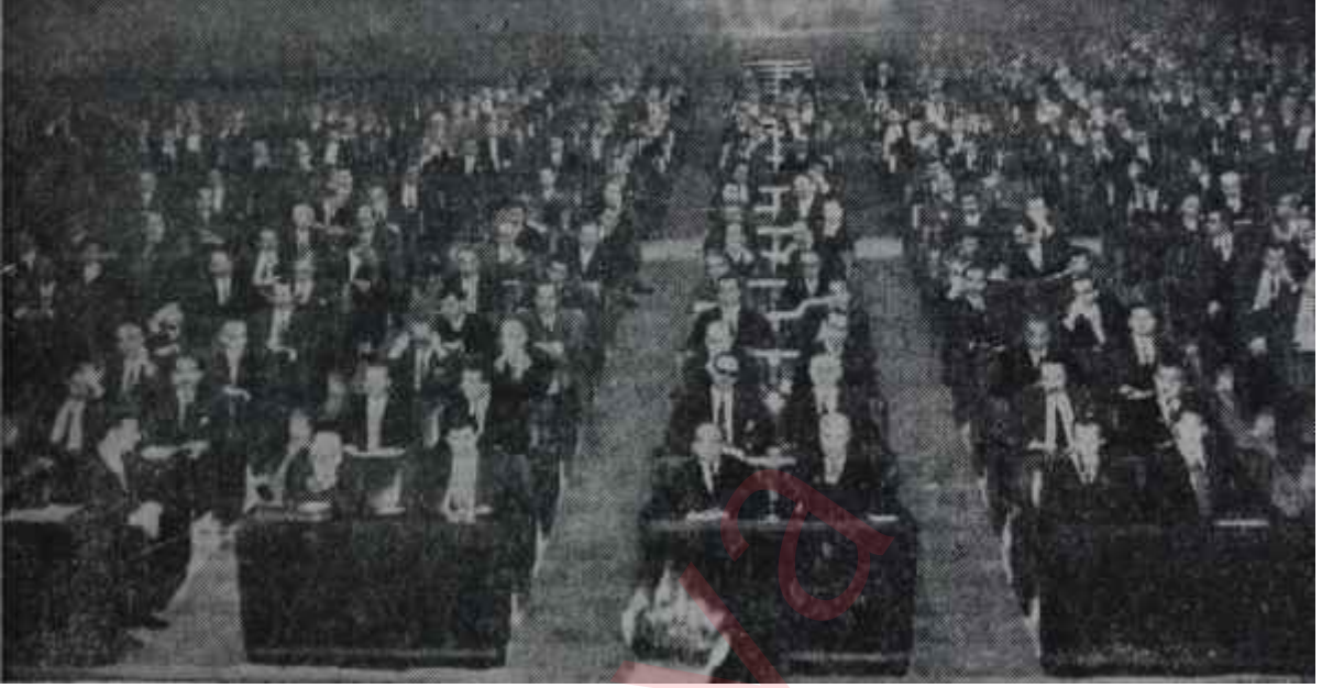
T- B. M. M. de milletvekilleri 'Ak koyun ile kara koyun köprü üzerinde'