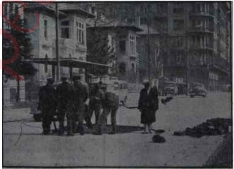
Yollar tamir ediliyor Yemişler efendiler, yemişler!

Çok dert gibi, kökü o Görülmemiş Kalkınma Devrine giden "Yolların tamiri işi" de şu anda, Hükümetin omuzlarındadır. O pislği de, bu Hükümet temizleyecektir. Hem de, bu yüzden şikâyetlere, sızlanmalara, haklı dert yanmalara vesile vererek.. Ama bari o, yolların bugünkü halinden ders alsa ve mahallelere milyonlar değil, sağlam, devam eden yollar bıraksa!