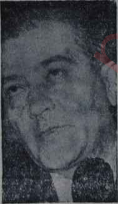
Emin Paksüt Oklara yay araniyor

İlk kademe bir "ara Kurultay" toplama işidir. Parti Meclisi bu kararı verecek ve yakın bir gelecekte Kurultayın toplanmasını sağlayacaktır. Bunun için gerekçe CHP için bir