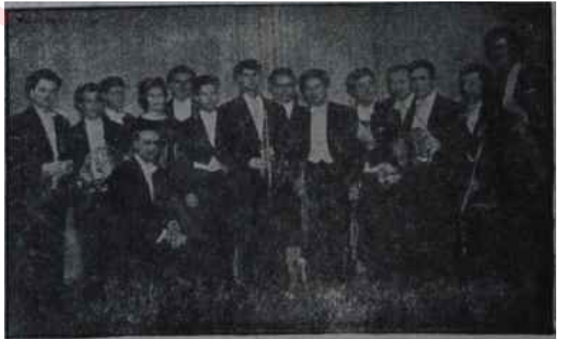
Detmold Nefesli Çalgılar Topluluğu