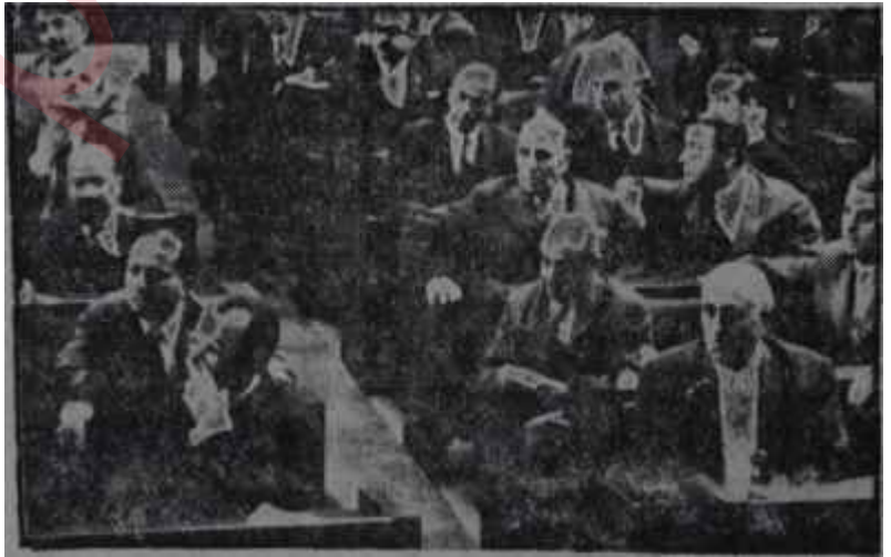
B. M. M. de milletvekilleri Kendi başına buyruk

Çünkü, tazyik memleket ihtiyaçlarının ve onları bilen kuvvetlerin tazyikidir.