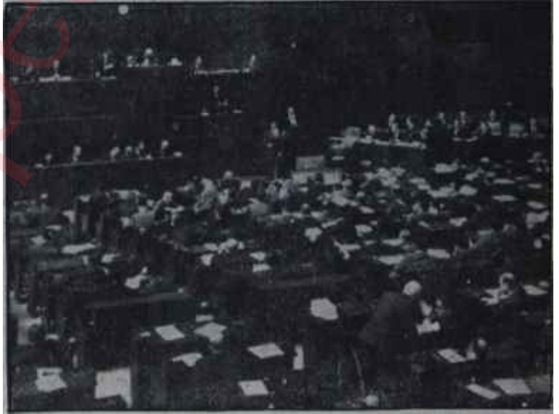
Mecliste bütçe müzakereleri