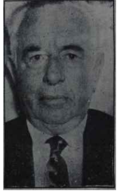
Alpaslan Türkeş — A. Fuat Başgil