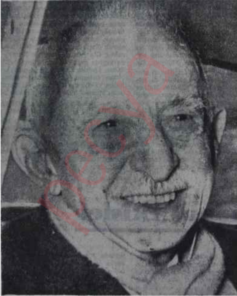
Başbakan İsmet İnönü

Başbakan İsmet İnönüye böyle bir muhtıranın verildiğini Başbakanlıktan bildirdiler, metni de mealen