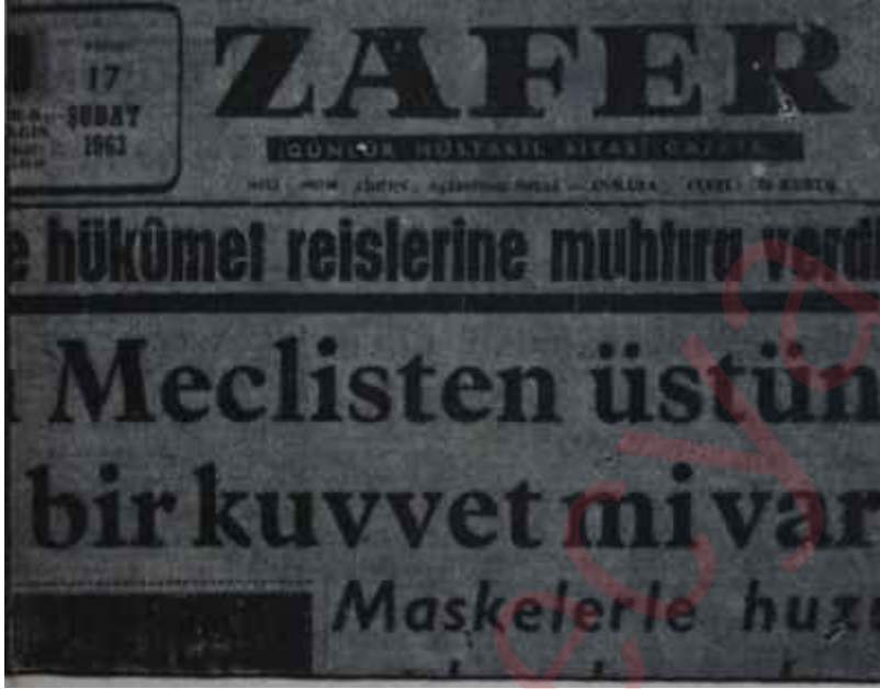
Zafer gazetesinde A. P. muhtırasıyla ilgili manşet Kim vurduya gitti

Bu hafta Çarşambayı Perşembeye bağlayan gece, saatin l'e yaklaşmakta olduğu sırada Ankaranın 0003 numarayı taşıyan en meşhur Opel'i Çankayadaki evden çıktı ve Meclisin yolunu tuttu. Opel, seksen yaşındaki Başbakan İnönüyü evine bırakmış dönmüyordu. Opel, seksen yaşındaki Başbakan İnönüyü evinden almış Meclise götürüyordu. Gece yarısını geçe İnönüye telefon edildi ve acele Meclise gelmesi istendi. Af kanunu dolayısıyla kavga çıkmıştı. Milletvekilleri birbirlerine meydan dayığı çekmişlerdi. Ama İnönünün istenmesindeki sebep bu değildi. Hü-