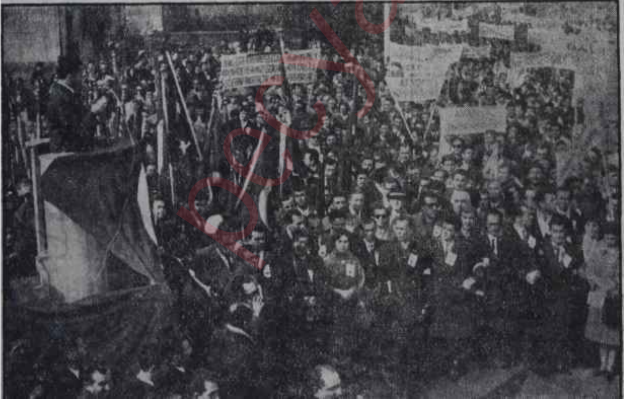
öğretmenlerin büyük mitinginden bir sahne

Turizm __Önceki haftanın sonlarında, Cuma sabahı, Başkentte Renkli Sinema hummalı bir faaliyete sahne oldu. Yerler gazla siliniyor, talaşlar dökülüyor, kol-