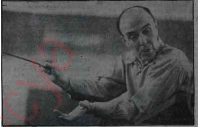
Cemal Reşit Bey Takdir toplayan Şef

Programın gayet güzel tertiplenmesinden, çalınacak parçaların iyi hazırlanmış oluşuna kadar titiz bir gayretin ürünü olan resital büyük