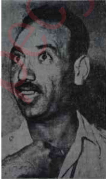
Abdüsselam Arif Göstermelik bir Başkan

Eski Başbakan Kasımın akıbeti hakkında verilen bilgiler ihtilâlin ikinci günü değişikliğe uğradı. ön-