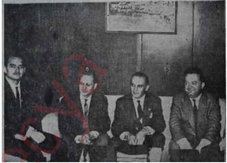
Alan memnun, satan memnun

Program bu konudaki kanuni prosedüre uygun olarak Plânlama Merkez Teşkilâtı tarafından hazırlanmış ve Yüksek Plânlama Kurulunda incelendikten sonra Bakanlar Kurulunda bazı ufak değişikliklerle