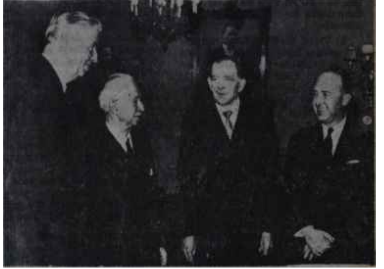
Başbakan İnönü Von Mangoldt ile

a) Uzun vadeli ve düşük faizli kalkınma kredileri. Bu krediler yardımın esasını teşkil edecek ve daha çok Amerika Birleşik Devletleri ve Federal Almanya tarafından karşılanacaktır. Bu tip krediler