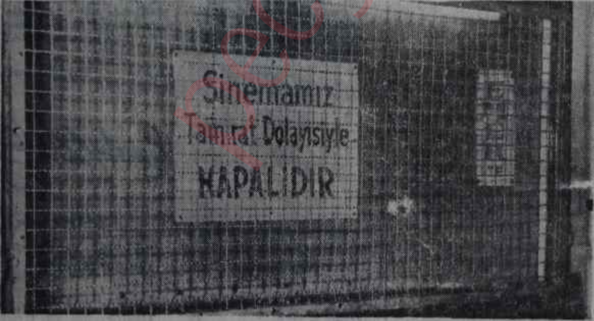
Emekli Sandığı sinemasının Kapısındaki levha Devlet malı deniz!

Emekli Sandığının dünya sinemasına kazandırdığı, sahip olduğu sinema binalarını bizzat işletmek için hususi şirket kurmuş olmasından ibaret değildir. Emekli Sandığı "İstanbulun imarı deliliği" içinde İstanbul Belediyesine para temin etmek için Serklidoryan blokunu satın almak zorunda bırakılmış, böylece sinema binalarına isteristemez sahip olmuştur. Peki, bunları bir bilene kiraya verse ya! Hayır, bir şirket kurmuş, kendili sinema işletmeciliğine girişmiştir. Bununla da yetinmemiş, film ithalâtı işlerine dalmıştır. Arkasında Emekli Sandığı olduğu için dünya piyasalarında "mirasyedi" ünvanını kolaylıkla kazanmış, film satın almalarındaki cömetliğiyle "Ne iyi şirket bu, yahu!" dedirtmiştir. Getirdiği filmleri kendi sinemalarında gösterdiği gibi bunların dağıtımını da iki "becerikli iş adamı"na vermiş, onları da faaliyetinden ziyadesiyle müstefit kılmıştır.