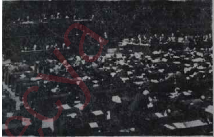
1983 Bütçesi Mecliste müzakere ediliyor