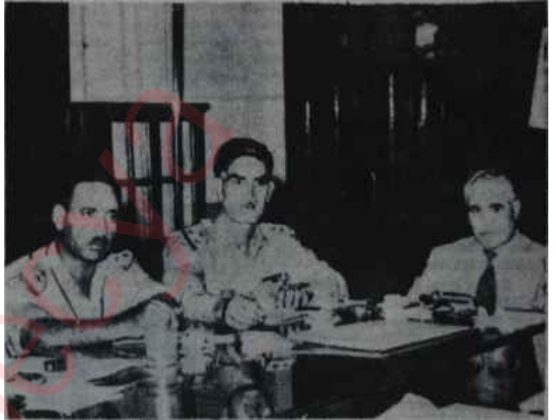
1958 deki ihtilâlin iki lideri Kasım ve A. Arif