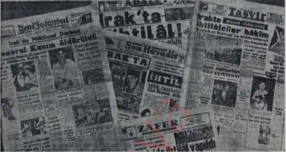
Irak ihtilâlinin A.P. li gazetelerdeki akisi Aç tavuk arpa ambarında