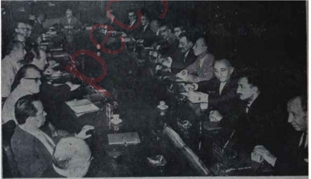
Hükümette plânla ilgili çalışmalar yapılırken

16 milyon 30 bin lira sarfiyla Kastamonuda bir şeker fabrikası, 14 milyon 500 bin lira sarfiyla Eskişehir-