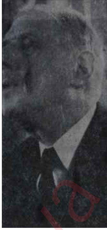
General De Gaulle

Brükselde müzakereler teknik seviyede cereyan ederken, De Gaulle Pariste bir basın toplantısı yaparak İngilterenin Ortak Pazara girmesine muhalefet ettiğini açıkladı. Sebep