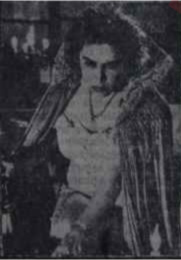
Semiha Berksoy Sahnede 30. Yıl