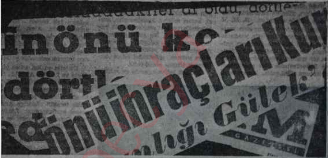
Kurultay müddetince gazetelerde çıkan Kurultay haberleri Kadınlar hamamı

Adam ihraç etmek, "ya ben ya onlar" demek kolaydır. Zor olan Devlet nüfus ve otoritesini devam et-