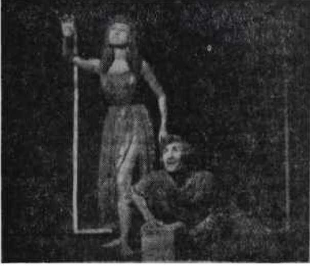
Oda Tiyatrosunda "Kargalar"