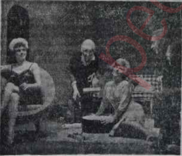
Oda Tiyatrosunda "Amerikan Rüyası"

Sonuç: Beckett'in ve "mücerret tiyatro" akımının temsilcileri görülen, soluğu kesik -bütün oyun 15 dakika sürüyor- bir deneme. .