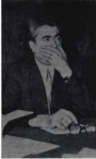
Ferit Melen "Otur da, yap!"