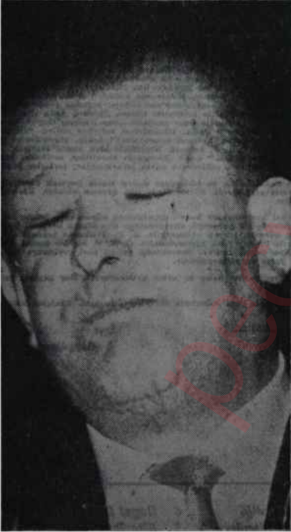
Ulaştırma Bakanı Öçten Ama, hiç "içten" değil

Hükümet — Kurultay dolayısıyla Ankaraya gelen bütün C. H. P. liler, ister Muştan olsunlar ister Edirne* den, ister Sivahlı olsunlar ister Malatyalı "partizanlık"