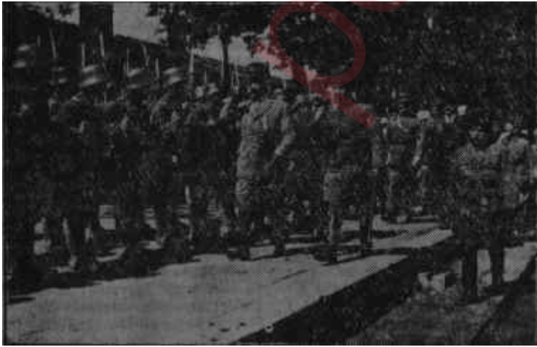
Atatürk ve İnönü birlikleri teftiş ediyorlar Cumhuriyeti üçü yarattı

Hakimiyet kayıtsız, şartsız milletindir. Bu hakimiyeti B. M. M. bütün kuvvetleri nefsinde toplayarak tatbik eder. Devlet Başkanı yoktur. B. M. M. Başkanı aynı zamanda Devlet Başkanıdır. Hükümet Başkanı yoktur. Basbakanı ve Bakanları ayrı ayrı B. M. M. seçer. Müsterek, mesuliyet yoktur. Bakanlardan birisi bir karara muhalif kalır ve muhalefet olarak imza eder. Meclis, Bakanlar arasında ihtilaf olursa hakem olarak bir karar verir. Kararı kabul eden milletvekili Bakan olur. Düşünülmeğe lâzımdır ki bu sistem, içinde bir muhalefet grubu bulunan B. M. M.'nde yürütülebilmiştir. Bir kaç defa Meclisin artık yürüyemez hale geldiği kanaati hakim olmuş, ondan