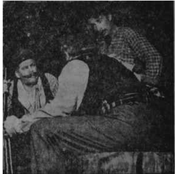
"Ayı Masalı"ndan bir sahne İnandırıcı olmayan bir realizm