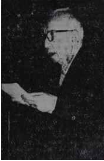
İnönü Mecliste konuşuyor Ord. Prof.

Haber karşısında Hükümetin davranışı, bu son grubun hadiseyi değerlendirme tarzına uygun oldu. İlk resmi bilgiler Çankayada alındığında Başbakan en ilgili iki şahsiyeti, Dışişleri Bakanı Feridun Cemal Erkin ile Genel Kurmay Başkanı Cevdet Sunay'ı Köşke çağırttı. Daha sonra iki istihbarat Alba-