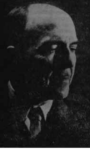
Cemal Reşid Rey Sihirli değnek