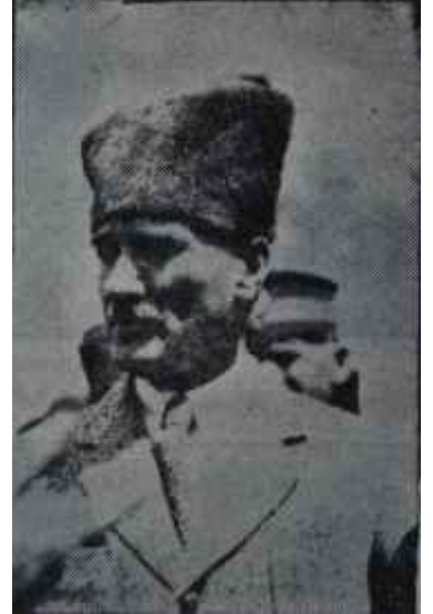
Gazi Mustafa Kemal Paşa Düşünen baş

B ununla beraber Cumhuriyet ilânı gene kolay olmamıştır. Bir defa Saltanat ailesi Hilafet Müessesesi halinde memlekette hüküm sürüyordu. Yabancı devletler, öyle görünüyordu ki, Hilafeti sempatiyle destekliyorlardı. Bu müessesenin yeni kurulan milli devlet için önemli bir engel olacağını ümit ediyorlardı. Lozandaki temaslarımda gazete muhabirlerinin Halifenin resmi ünvanının ne olacağı hususunda beni mütemadiyen sıkıştırdıklarını hatırla-