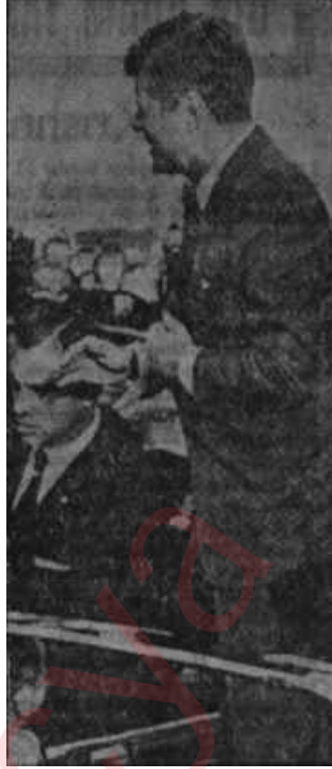
Başkan Kennedy konuşuyor Rest!

B u krizin en çok merakla beklenen tarafı, Rusyanın nasıl bir tavır takınacağı idi. Bütün gözler Rusyaya çevrilmişti. Nükleer bir harp hemen başlayabilirdi. Fakat Rusyanın tepkisi beklenildiği kadar şiddetli olmadı. Sovyet hükümeti, Amerikanın hareketini takbih ettikten sonra, Güvenlik Konseyine başvuracağını söy-