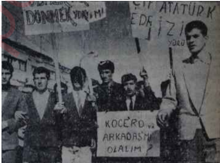
Açıkta kalan öğrencilerin yürüyüşü "...her imtihanında tam numara isteriz!"

Çok mahkûm evine ve ailesine kavuştuğu sırada Ankara Merkez Postahanesinin memuru tahliye emrini götüren yıldırım telgraflarını çekmekteydi de, çekmekteydi..