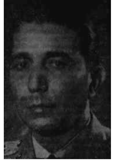
Korgeneral Fikret Esen Jandarmanın başı

Tabii, yeni İçişleri Bakanı, 52 yaşındaki Hıfzı Oğuz Bekatanın siyasi istikbali de..