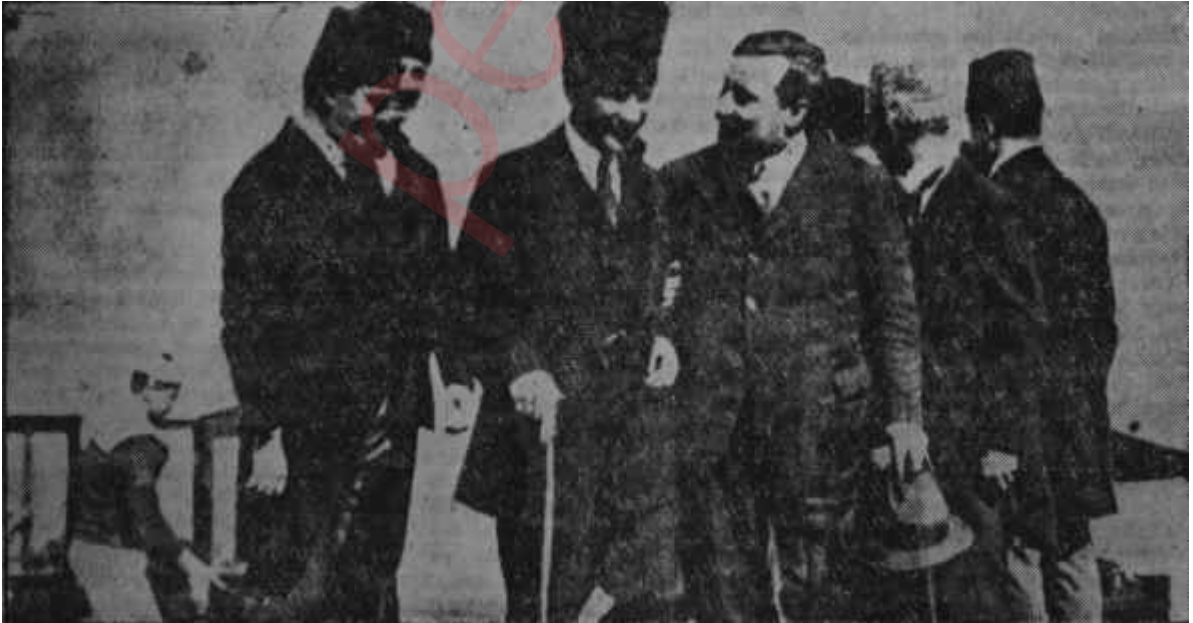
Mustafa Kemal Franklin Bouillon ile birlikte Savaştan sonra gelen barış