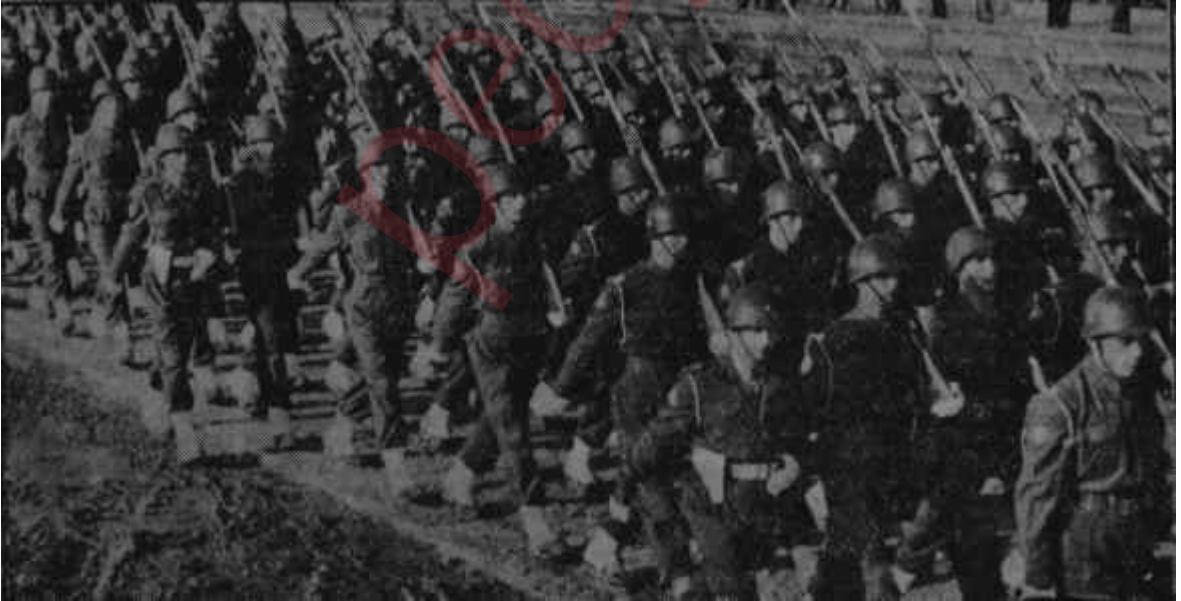
Hudutlar da ve içerde güvenlik tedbirlerini alan Türk Ordusu

Buna mukabil hadisenin halk üzerindeki tepkisi daha yavaş oldu.