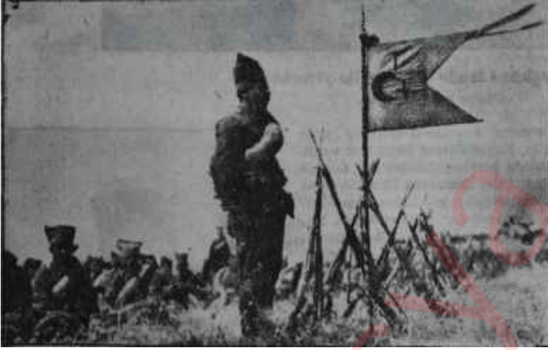
Milli Mücadelede Türk askeri Zaferin perçini

(Bu yazının her hakkı mahfuzdur. İzin alınmaksızın kısmen dahi iktibas edilemez).