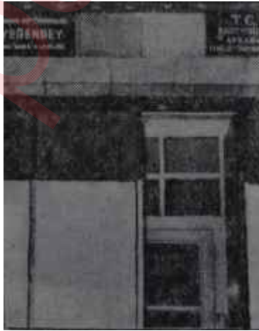
Bir vergi daireesi Ağlama Duvarı

mayacağına belirtti, vergileri değil, bunların aksak buldukları taraflarını tenkit etti. Tenkitlerin konusu