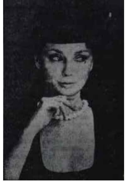
Tek siyah elbise Marifet yakada

Pek çok kadın, evde fazla gidip gelerek yorulur. Çocuklar bu şekilde iş görenannelerine bakarak ve onların nasıl yorulduklarını idrak ederek küçük yaştan işten soğurlar, "Param yok, yeni tip âletler alamıyorum" da demeyiniz. Eğer yardımcı âletleri ön plâna alırsanız, zamanla ne yapıp edip onları elde edebilirsiniz. Sonra, yardımcı âletlerin en pahalılarının yerini tutan ucuz, basit âletler de vardır. Elektriksiz işleyen yeni tip saplı halı süpürgeleri sizi toz yutmaktan, halı çırpılmaktan ve belediye kanunlarını ihlâlden kurtaracaktır. Saplı süpürgeler, saplı yer silme malzemeleri, sizin temiz bir elbise içinde, korkusuzca, yere eğilmeden temizlik yapmanızı sağlayabilir. Köpüklü yeni sabunlar eskilerinden daha ekonomiktir. Bunlarla bulaşık yıkamak bile zevk olmuştur. Evde soğan makineniz varsa, lütfen, "makineyi yıkaması güç oluyor" bahanesiyle soğanı eski usul doğramakta devam etmeyiniz. Gözünüze soğan kaçmasa da, o anda yüzünüz ağlar bir hal alacaktır. Ama birkaç yemeği birden pişirmek hem bulaşığı