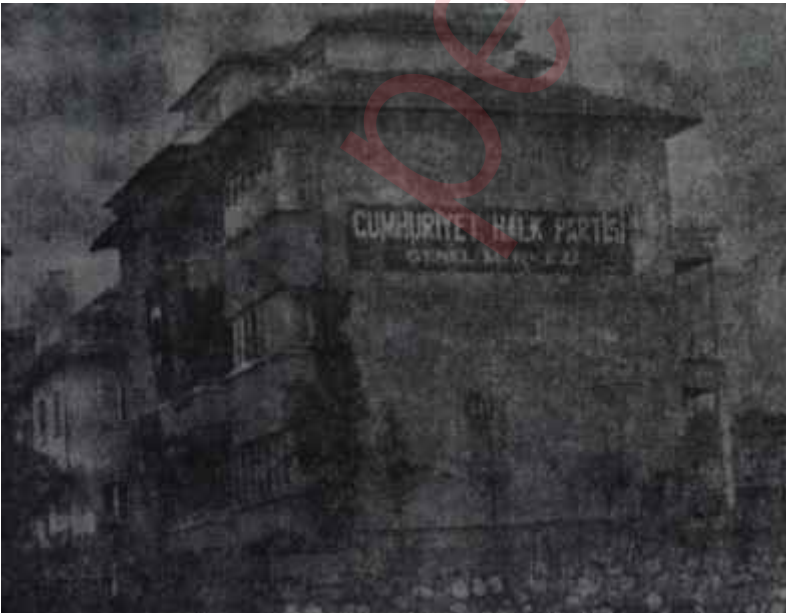
C. H. P. Genel Merkez binası