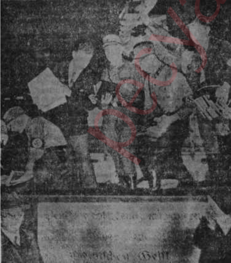
Kitap yakan öğrenciler Gözler kararınca

(Gelecek yazı : "Netice - Hitlerin inanılmaz macerasından alınacak ibret dersleri")