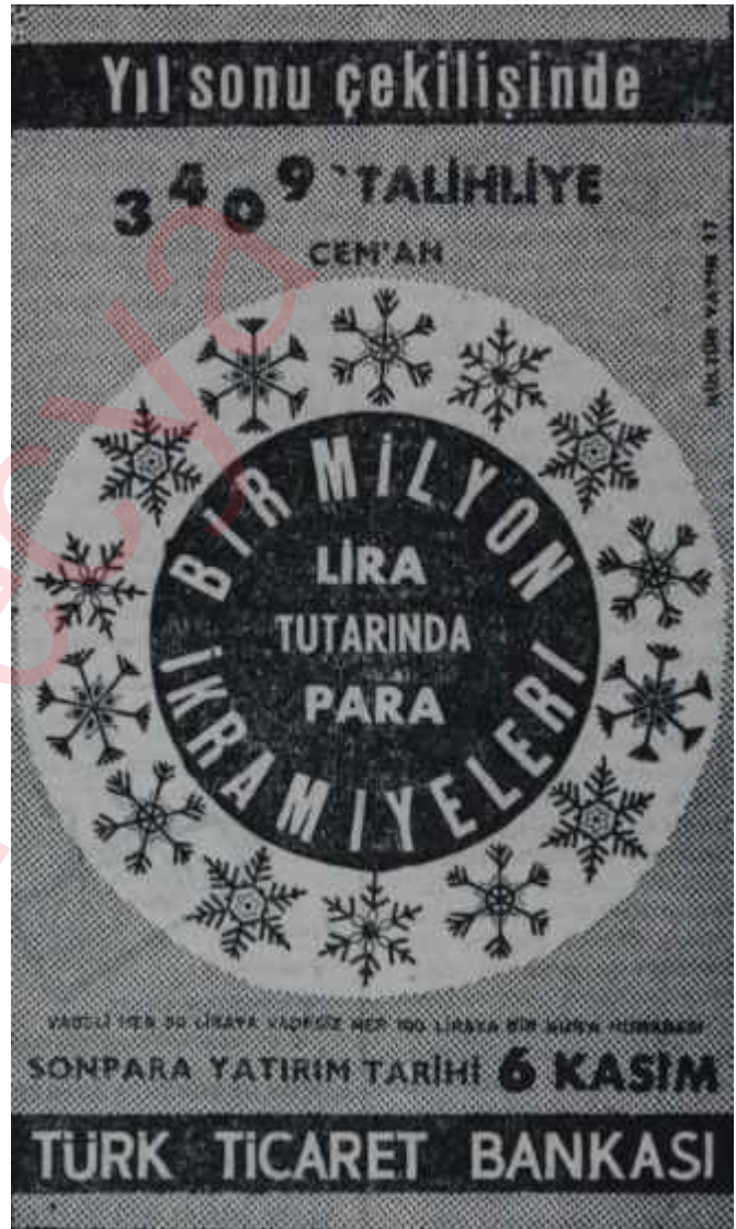
Reklâmcılık - 4184 — 553

diğer önemli yenilik de hemen tahakkuk etmek üzeredir. Bilindiği gibi teşekküllerin yatırımları şimdide kadar çeşitli kaynaklardan karşılanmaktaydı. Bütün bu kaynakların birleştirilmesi ve daha derlitoplular bir finansman sistemi içinde mütalâa edilebilmesi için bir Devlet Yatırım Bankasının kurulması ile ilgili tasarı Bakanlar Kurulundan çıkmış ve Meclisteki ilgili komisyona sunulmuş bulunmaktadır. Önümüzdeki günlerde müzakerelerine başlanacak olan tasarınnın İktisadi Devlet Teşekküllerine, halen aynı işi görmeğe çalışan Amortisman ve Kredi Sandığı'nın yanında, yeni bir dinamizm getireceğine muhakkak gözyle bakılmaktadır.