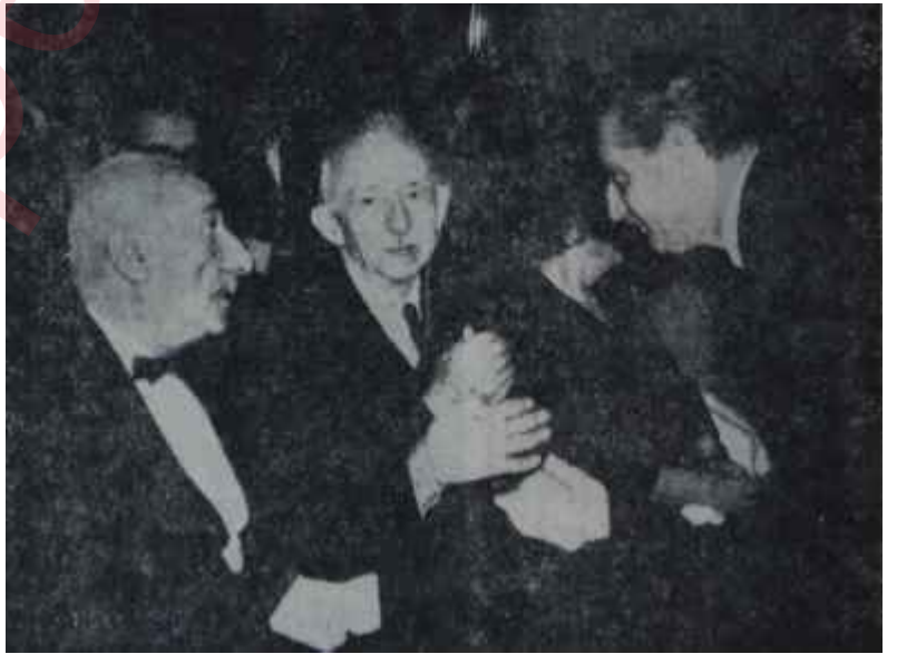
Konser Salonunda İnönü ve Gürsel bir arada Bunlar "Sanatkâr" değil, "Sanat" sevdalıları

Cuma gecesi de aynı yerde aynı Orkestrayla, biraz daha az kalabalık önünde Rus kemancısı Halida Ahtyamova bir konser verdi.