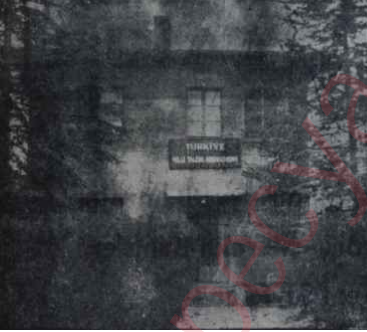
T.M.T.F. Genel Merkezi "Gençlik" "tecrübe" ile buluştu

Aynı hissiyat içinde bir başka grup A. C. H. P den çıktı. İktidarda İnönü yanına kendilerini almadığından dolayı muğber, onun için arabalarını "İkinci İhtilâl" yıldızına bağlamış, parti içinde çeşitli tertiplere girişen, o sıfatlarıyla şu veya bu kuvvetlerle temas eden bu adamlar da affin çıkışını fırsat bildiler ve ortamın müsait bulunduğu itibına saplandılar.