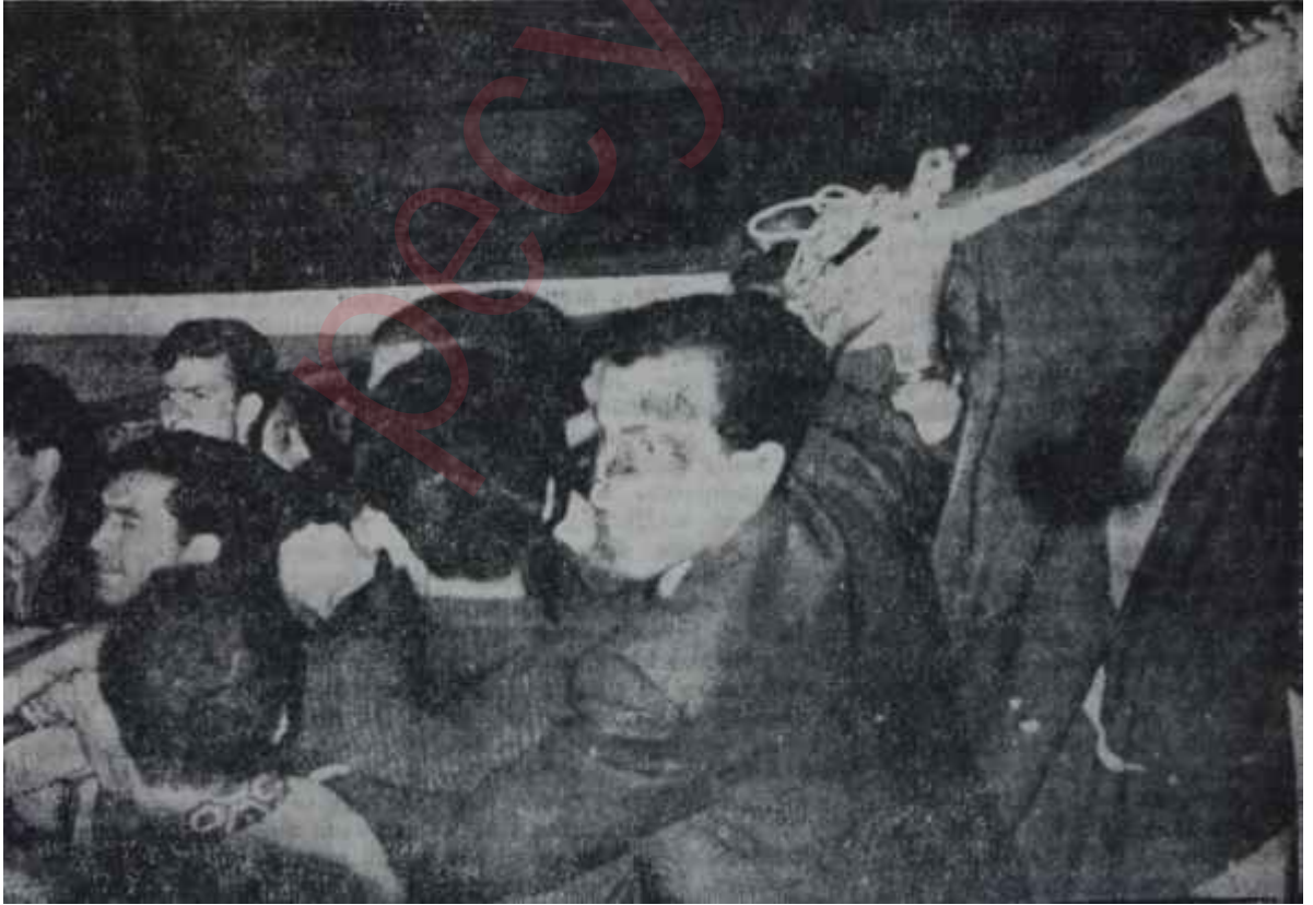
Genç üniversiteliler Yeni İstanbul önünde "Alma mazlumun ahını- Çıkar aheste aheste"

H aftanın içinde, Kızılayda başlayan hâdiseler başkentte durulmuşken bunların birden İstanbul'a sıçramasıyla tansiyon yeniden gerginleşti. İstanbullu gençleri harekete geçiren de. Ankaralı gençleri harekete geçiren sebepler oldu. Eski D. P. zenginlerinin parasıyla kurulan -bunlar