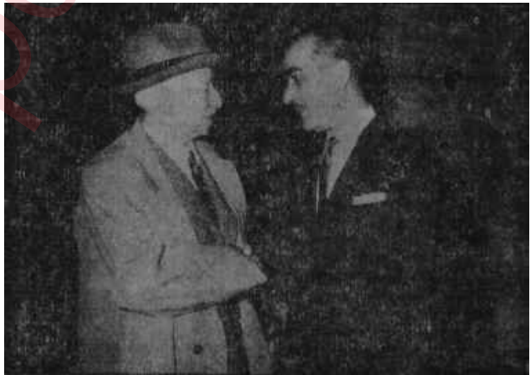
Kurutluoğlu Başbakan İnönüye veda ediyor "Buluşmak üzere"

B itirdiğimiz haftanın başında bir akşam, Türkiye Cumhuriyeti, İşçileri Bakansız kaldı. Bir kabine arkadaşları kadar, hatta onun biride biri