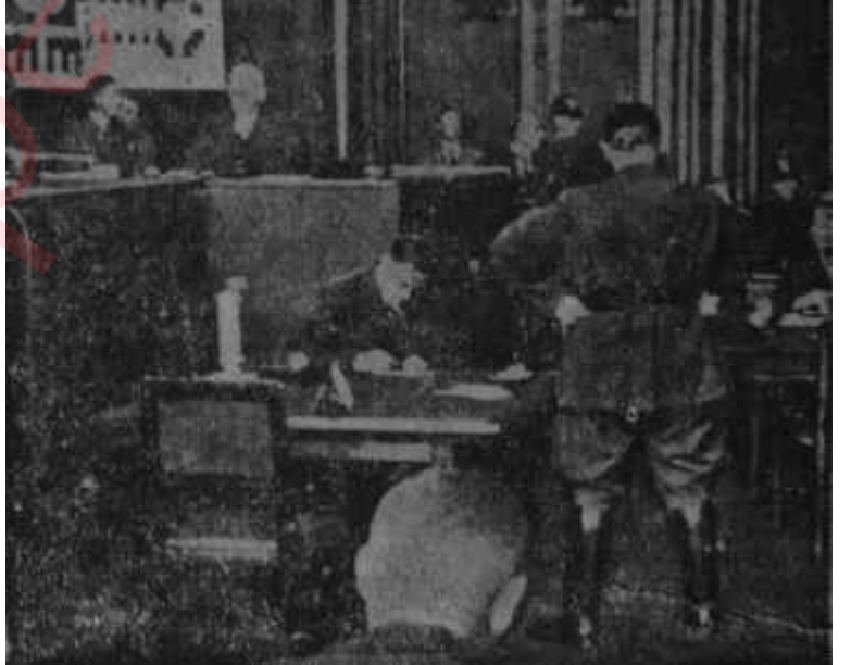
Tanık Goering Tanık değil, kasap

(*) Bu serinin ilk yazıları "Memleket", "Adam", "Darbeci"; "Kitap", "Politikacı", "Steresmann", "İktidar Yokusunda", "Hedefe Doğru" ve "İktidarda" başlıkları altında AKİS'in 424, 425, 426, 427, 428, 429, 430, 431 ve 432. sayılarında yayınlanmıştır.