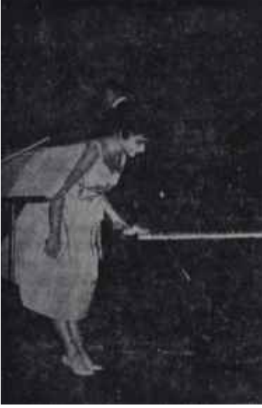
Biret dinleyicileri selamlıyor Haklı alkış

den, "Biz bu kursu, çok akıllı olmayanlar için açtık" gibilerden bir esprinin sâdır olması üzerine, epey hayal kırıklığına uğranıldı.