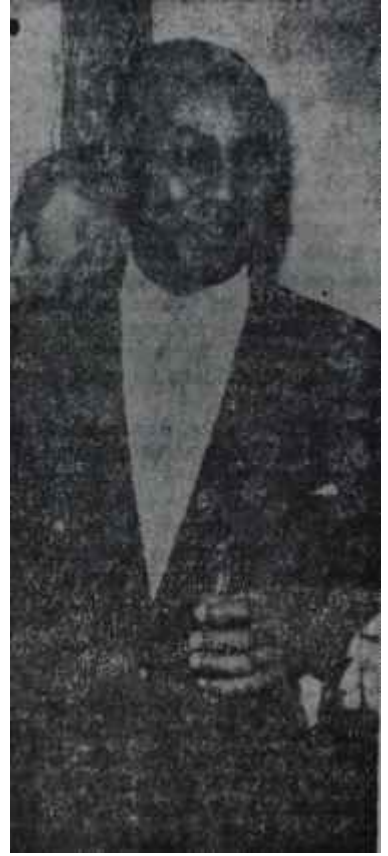
Büyük Elçi Tessema

A ttaş şirketi Mersindeki petrol rafinerisinin açılması münasebetiyle İstanbul ve Ankaradan iki hususi uçak kaldırdı. Hava Yollarından tanesi 50 bin liraya kiralanana bu uçaklarla davetliler Mersine gidip geldiler. Şirketin, açılış şerefine sarfettiği para 200 bin liradır. Davetliler arasında, Bakanlardan Hasan Dinçer ve