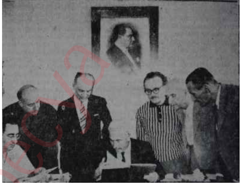
Yürütme Kurula çalışıyor Verimli mesai

Türk Kültür Derneğinin 78 şubesinde Dil devrimi özel törenlerle kutlanacaktır. Milli Eğitim Bakanlığı, Kurumun müracaatı üzerine okullara telle emir vermiş ve dil bayramına kutlanmasını istemiştir. Milli Türk Talebe Birliği İstanbul'da üç gün sürecek bir Dil Bayramı programı ha-