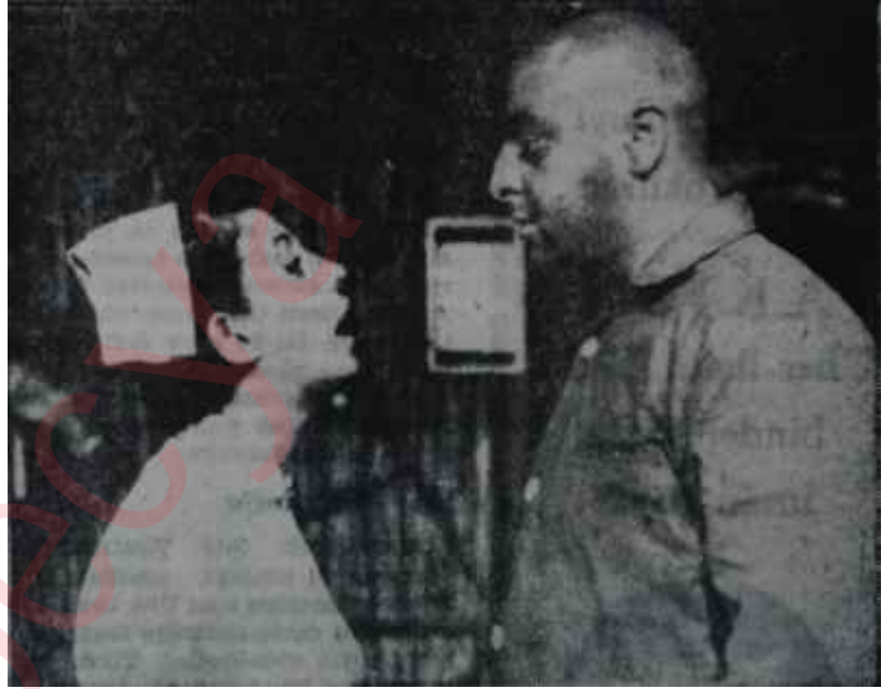
Meydan Sahnesinde "Aceleci Kalp"

"— Kardeşim" dedi, "Ayhan Hünalpin bir romanını bastık, 'Vapur Düdükleri' ardında... Hafta sekiz gün dokuz, kırmızı kalemle çizili, oklarla gösterilen böyle bir takım dergiler gönderip duruyor. Vapur Düdükleri filme almıyor, alınacak, yok neo-realist olacak, yok romantik olacak, yok falan oynayacak, bir sürü haber. Ayhancık, iyi hoş, kitabının reklâmını kendisi yaptırıyor. Bundan şikâyetim yok. Ama bana öyle gelir ki, Aynanın vapurunun düdükleri pek öteceğe benzemiyor. Bu dergiler de masanın üzerinde duruyor.