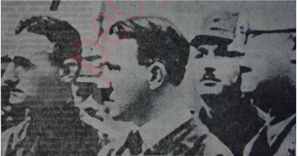
Hitler Brüning ile beraber

(Gelecek yazı: "Hedefe doğru - Örüncük ağına tutulmadan bütün entrikaların üstesinden gelen Şansölye Hitler)