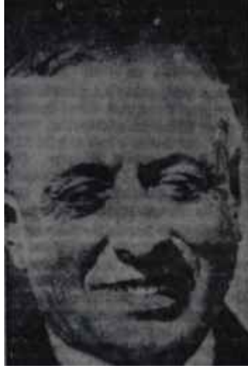
Çelik kralı Thyssen Sonradan gelen akıl

Hitler, hapisten çıktığı günden itibaren böyle bir an için hazırladığı partiyle seçime su sloganlarla katıldı: Her almana iş ve ekmek, bir Heybetli Almanyada, Versay Andlaşmasının yırtılması, harp tazminatının ödenmesinin reddi, suiistimallerin önlenmesi ve para babalarının, hele yahudi iseler dize getirilmesi! Dört milyon alman gencinin bu seçimlerde oy sahibi olacak yasa gelmiş bulunduğunu bütün kampanya boyunca Hitler aklından çıkarmadı. Seçimlerin neticesi, beklenilmeyen bir zafer oldu.