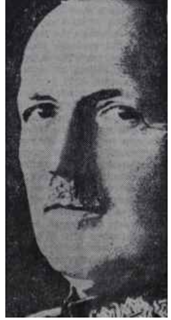
General von Schleicher

lah depolarında ve geri hizmetlerde bile sivil olarak görev görmelerine cevaz yoktu. Fakat krizle birlikte, bilhassa 1930'larda Orduya nazi sızmaları arttı ve önem kazandı. Bilhassa genç subaylar, gönüllerini Hitlerlere kaptırmışlardı. Onun demagojisine ve uydurma edebiyatına inanıyorlardı. Bu sızma o hali aldı ki 22 Ocak 1930'da Savunma Bakanı Gröner, tıpkı Birahane Darbesi sırasında General von Seeck'tin yaptığı gibi bir tamim yayınlarak nazilerin iktidar peşinde koşan bir maceracı grup olduğunu bildirdi, kendilerine dikkat edilmesini istedi. Buna rağmen, politikaya gırtlığına kadar girmiş bulunan Orduda nazilerin tesir sahasının hududu, bilhassa genç subay çevrelerinde arttıkça arttı. Denilebilir ki eğer Alman Ordusu kendisini bu a-kıntıya kaptırmamış bulunsaydı, Nasyonal Sosyalizm belki de hiç bir zaman zafer kazanmayacak ve Hitler memleketin başına geçmeyecekti. Zi-