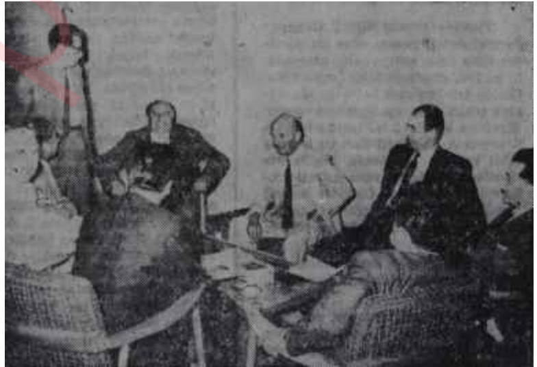
A. P. li milletvekilleri kuliste Kazan dibin kara...