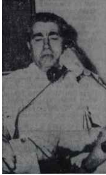
Ferit Melen Meteliksiz milyarder

Gerek Milletlerarası Para Fonu ve gerekse Dünya Bankası, Birleşmiş Milletler Teşkilâtının birer şubesi olup, Türkiye her iki teşekküle de 1947 yılında üye olmuş ve yardım