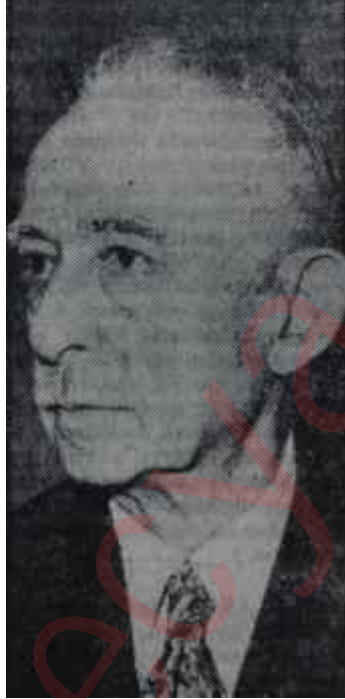
İsmet İnönü Menderes değil, bu!

İkincisi, o budala grubun faaliyeti karşısında elini oğuşturan ve kendi gününün geldiği sevinci içinde memleketin kudret sahibi sağlam kuvvetlerini zor kullanmak için iten öteki uç ta Başbakanın, Hükümetin,