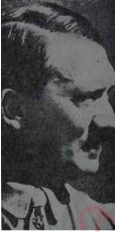
Hitler iktidar arefesinde Sabreden derviş

Parti içinde, bu şahsi çekişmelerin yanında iki büyük cereyan Hitlerin karşısına dikildi. Bir cereyanı, S.A.'ların kurucusu Roehm temsil ediyordu. Roehmü meşruiyet kisvesine bürünülmesine bile tahammül edemiyor, darbelerin devam etmesini istiyor, hadise çıkarmaya çalışıyor, ışık günlerin alışılmış adetlerini sürdürüyordu. Roehm'ün adamları sokaklarda yahudileri dövüyor, çar-