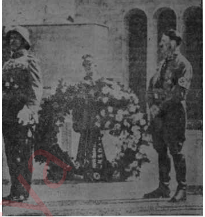
Hitler bir törende Konuşamayan teşkilâtçı

Daha fenası, 5 Ekim 1924'te Schacht ertesi günden itibaren Reichsbank'ın, iç kredi imkanlarının müsadese haricinde her krediyi ve iskontoyu keseceğini ilân etti ve "bir çok cılız müessesenin iflasını göze alıyoruz" dedi. Hakikaten sayısız "enflasyon bitkisi" bu tedbirle kavrulup öldü. Hele Reichsbank, işgal altındaki bölgelerde çıkarılmış olan notgeld'leri ödemelerde kabul etmeyeceğini bildirince, bu paranın yaygın olduğu sanayi bölgesinde kıyamet koptu. Bu sanayi büyük temsilcisi Stinnes "Renanya sanayii. Bay Sch-