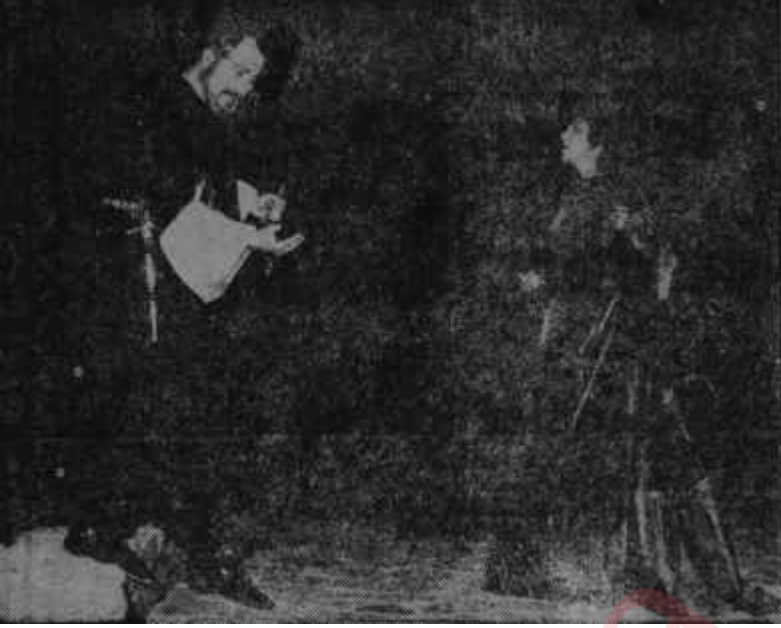
Rumeli Hisarında "Macbeth" Yaz mevsiminin güzel başarısı