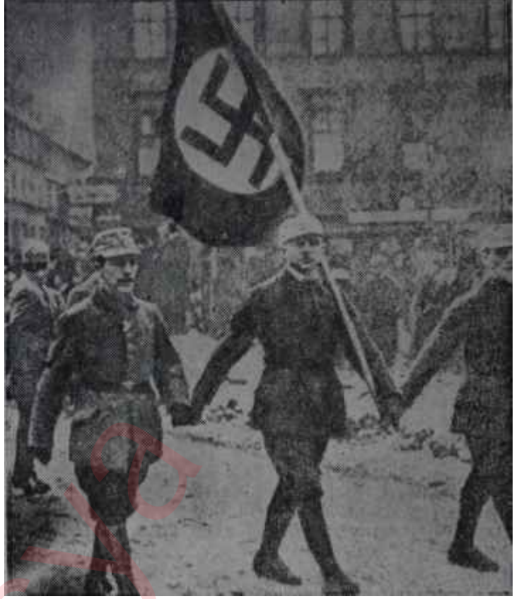
Gamalı haçlar dalgalanıyor Alman ruhuna hitap

26 Şubat 1925'te Voelkischer Beobachter Hitlerin "Yeni bir başlangıç" başlığını taşıyan uzun bir yazısıyla yeniden yayın hayatına atıldı. Führer ertesi gün, partisinin bir toplantısında konuştu. Ancak orada Hitler, dilini tutmaya pek muvaffak olamadı. Devleti ve rejimi yeniden ve şiddetle tehdit etti. Bu konuşması, taraftarlarını gene etrafına toplamaya yetti ama, gözü açılan Bavyera Hükümeti Hitleri kalabalıkta konuşmaktan men etti ve bu yasak iki yıl sürdü. Büyük kudreti hitabet olan bir adam için bunun ne demek olduğu ortadadır ama, bu vesileyle Hitler aynı zamanda bir de büyük teşkilatçı olduğunu yeniden ispat imkanını buldu.