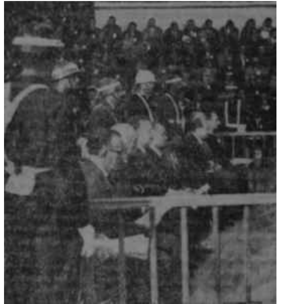
Yassıadada D.P. devri suçluları Eden bulur

Ama şimdi, her şey gösteriyor ki ilk atıfet rüzgarının estirilmediği zamanı gelmiştir. Bunda, milletçe mutabık bulunuyoruz. Bu rüzgarı başka rüzgarların takip etmemeni için hiç bir sebep yoktur. Ta ki, "kısa zaman"ın deformasyonu zihinleri ve ruhları karıştırmamasın, bazı çevrelerdeki hâdiselerin esasını inkâr gayreti yeni infallere yol açmasın. Hâdiselerin esasını böyle deformasyonlardan kurtarılabilirse -toplum hayatımızı tanımlayan Anayasanın giriş kısmı hafızalara ve yüreklerle nakşedilmelidir- dindirilmeyecek hiç bir acı, halledilemeyecek hiç bir mesele yoktur.