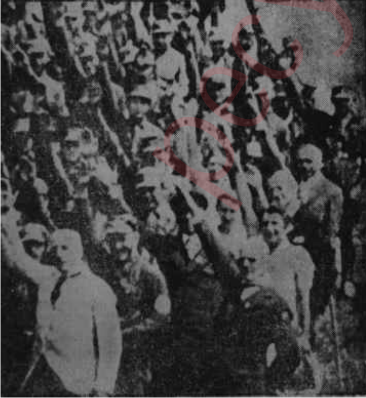
Naziler gösteri yapıyorlar

bölgesi, Almanya harp tazminatını ödemeye yanaşmadığından Fransa tarafından işgal edilmişti. Stresemann'ın birinci koalisyon hükümeti, batılı galiplerin şartlarını kabul ederek önce fransız birliklerinin Ruhr'dan çekilmesini sağladı. Sonra Başbakan, girişeceği ekonomik ve sosyal reformların o kabineyle başarılamayacağını hissederek 2 Ekim 1923'te istifasını verdi. Yeni hükümeti kurmaya gene Stresemann memur edildi. Başbakan kabinesine bazı sanayicileri aldı. Essen Belediye Başkanı Hans Luther Maliye Bakanı oldu. Bu sıralarda 1 dolar 154 bin mark ediyordu. Stresemann alman Meclisinin, Reichstag'ın önüne cesaretle çıktı ve meşhur "Efendiler, Mark ölmüştür" cümlesini söyledi. 15 Ekimde Reichstag Hükümete tam yetki verdi ve Rentenbank'ın kurulmasını derpiş eden kararname yayımlandı, Stresemann mali politikayı yürütme görevini genç ve parlak bir bankacıya, Dr. Schacht'a emanet etti. Schacht 12 Kasım 1923'te Kambiyo Komisyonuna getirildi. Çok geçmeden, Reichsbank'ın Başkanı oldu.