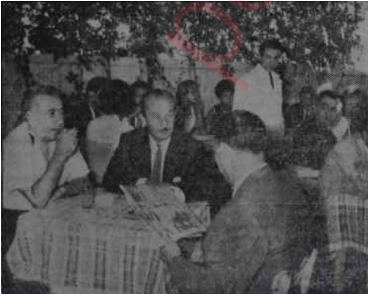
Hülya Pastahanesinde siyasi kulis Hyde Park'tan sonra Westminster

A. P. li yöneticiler buna bir çare bulmakta gecikmediler. Üç toplantıya gelmiyen üyeyi müstafi adedeceklerini bildirdiler. Ancak basit bir hesapla, toplantıya katılmayacaklar, gerekli zamanı müstafi adedilmeden doğurabilmektedirler. Ekim başına kadar her toplantıya bir tiye gelmese, istenilen -A. P. Yüksek Hakem Heyeti tam kadroyla toplan-