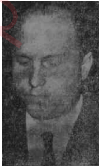
Haydar Tunçkanat Suçlu kim

"— Atatürkün büstüne bir tecavüz vuku bulmuştur. Bu tel'in edil-melidir" diyerek başladı ve sonra cümleleri orasından burasından kıvrarak meseleyi bir noktaya getirdi. Kuluda kaymakam vekilinin bahçesinde vukubulan hadisenin müsebbipleri C.H.P. lilerdi! Bunun için de