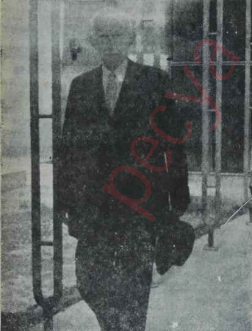
Başbakan İnönü Plânlamadan çıkıyor