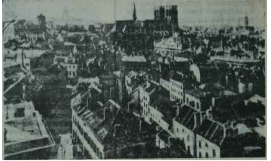
Brükselin umumi görünüşü

Bugün, üç kozun üçünden de mahrum bulunuyoruz. On yıldır Türk elçilerinin Batı merkezlerinde, hep yardım talep ederken, yani hep bir şeyler isterken söyledikleri "NATO'nun Batı kanadı", "Rusyaya karşı kale", "yarım milyonluk ordu", "Türk Seddi" gibi gerçekler şimdi kuru edebiyat olmuştur ve bugünkü konjonktür içinde pek de tesir yapmamaktadır. Nükleer silahların kudreti ve yeni dağılışı şekli sâdece harp ihtimalinin derecesini, değil, harbin tarzını ve çapını da çok değiştirmiştir. Öteki iki kozun ise, bizim için avantaj olmaktan çıkıp birer handikap haline geldiğini herkes biliyor. On yıllık bir D. P. iktidarının sonunda, Türkiye ekonomi bakımından mahvolmuş, sefalet ve karışıklık içinde, siyasi istikrarını kuramamış, her an bir yeni darbeyi bekleyen memleketidir. Böyle