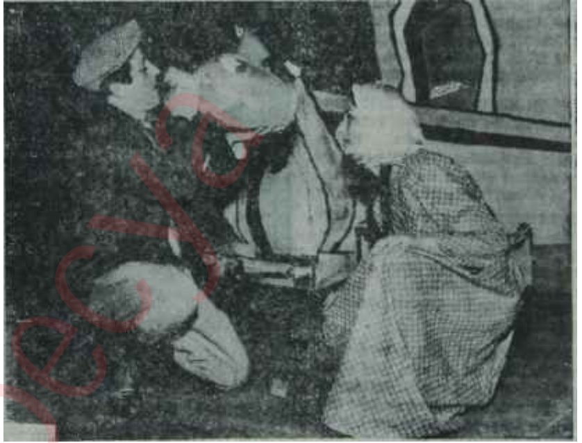
Kenterler "Nalınlar"da İçi bizim, dışı da bizim

görünmek olmuştur. Oysa ki yerli oyunun tiyatrolarımızdan beklediği bu çeşitten bir "koruyuculuk" değil, Kenterlerin gösterdiği çeşitten "aaygı"dır. Doğrusu istenilirse yerli oyunu "korumak" da zaten ona böylesine bir "saygı" -önce duymak, sonra da. göstermekle olur. Terli oyuna bu saygı, Kenterlerin gösterdikleri gibi, gösterilirse nice uykusuz gecelerin meyvası olan bu oyunlar tiyatronun en kaabiliyetsiz sanatçılarına okutulup onların vereceği hükme göre repertuvara alınmak -çoğu zaman da reddedilmek- için aylar ayı bekletilmez; rastgele seçilmiş sahneye koyucuların, dekorcuların, oyuncuların eline bırakılıp "deneme tahtası" haline getirilmez; sadece yıllık faaliyet grafiğini kabartsın diye, mevsim sonlarında, bir büyük lütuf ta bulunulu-