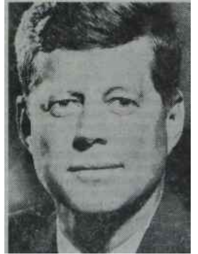
Harold Macmillan - John Kennedy