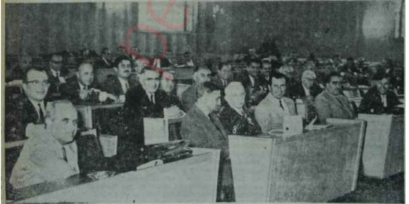
İsmet İnönü, C.H.P. Grubunda konuşanları dinliyor

Saat 19,37 de Alican ve Dinçer, bir kere daha gazetecilerin ortasına düş-