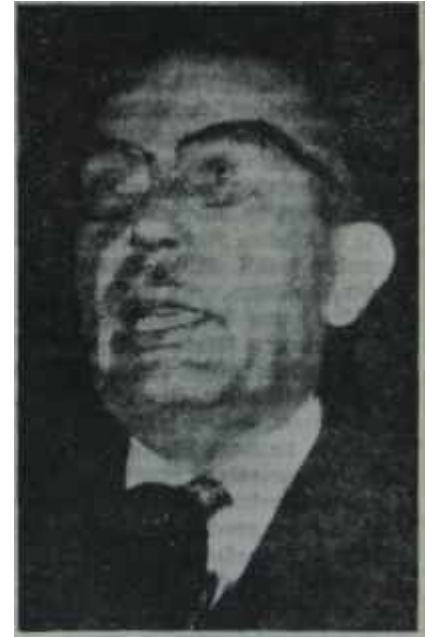
İhsan Sabri Çağlayangil Çoban kaval çalar

Bu kaba oyun, A. P. nin çoğu genç ve yeni politikacılarından bir kısmının gözünü hemen açtı. Bunlar, partiyi mukadder âkibetine terketmek-