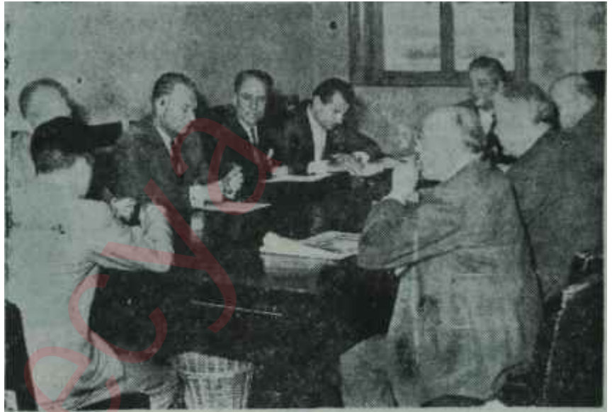
A. P. nin bağımsızları Mecliste toplantı halinde Selâmet!

İhtilâlden sonra, Rusyanın Ankara'daki Büyük Elçisi Rijofun yeni kudret sahiplerinin etrafında dört döndüğü ve bir çoğuyla münasebet kurduğu günler. M. B. K. üyelerini, Bakanları sık sık ziyaret ediyor, görü-