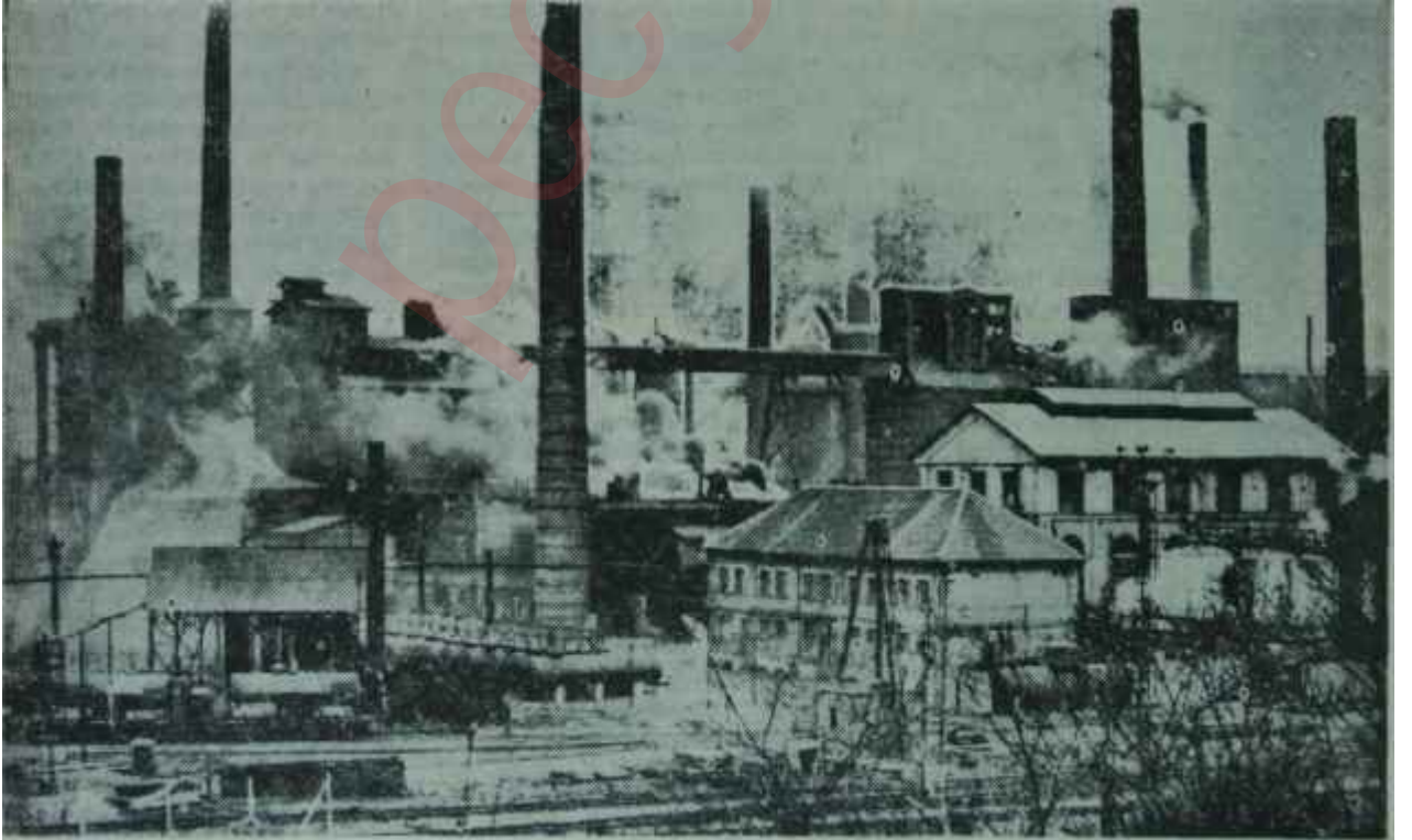
Batı Avrupada harıl harıl çalışan bir fabrika

"Fransanın tutumu, ilk bakışta mantıklı görünse de, aslında bir büyük boşluk taşımaktadır. Atlantik Paktı memleketleri, atom silahının tetiğindeki el bahsinde Amerikaya güvenmeseler. başka birine güvenebilecekler midir? İşte, devletlerin hakimiyetine dayanan, süpransyona