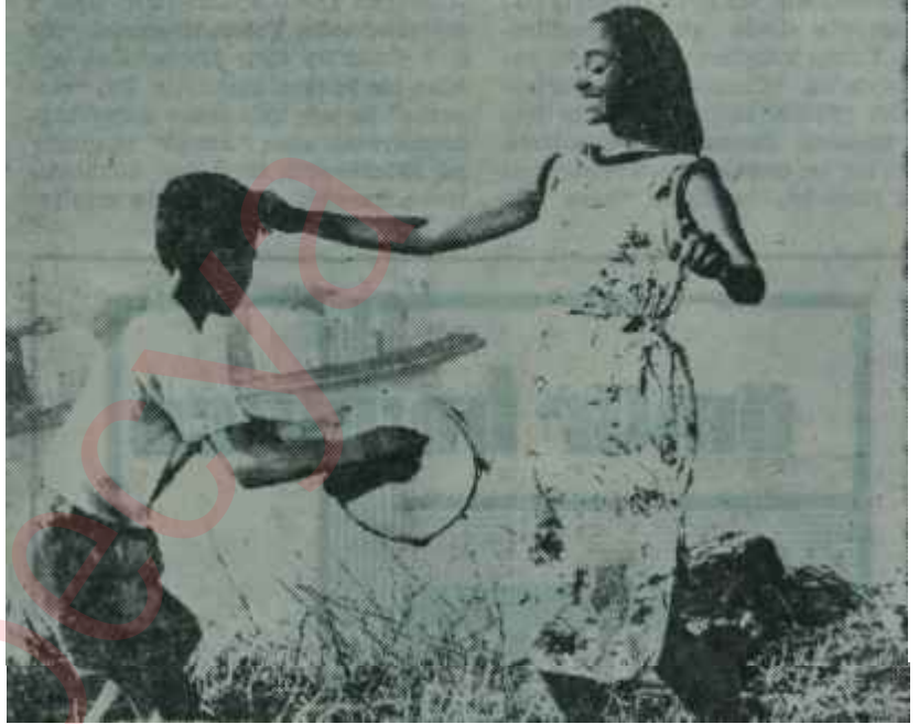
Camus'nün "Orpheu Negro" sundan bir sahne

yılabilir. Konusu, bu tür edebiyatın en iyi temsilcisi Alan Le May'in aynı adlı romanından sinemaya aktarılmış- tır. Film, beyazlar arasına karışmış bir kızıl derili kışan çevresinde dön- mektedir. Aynı yazarın bir başka ro- man - filmi olan John Ford'un "The Searchers - Çöl Aslanı"nda olduğu gi- bi, "Affedilmeyen"de de ırkçılığı sür- düren beyazlar vardır. John Hustan bu yeni ve ilk western denemesinde, öbür western rejisörlerinden kolayca ayrılıvermektedir. Hem Ford'a, hem de Ford'dan sonraki sinemacı kuşağının en güvenilir kişisi Antho- ny Mann'e bakarak daha duygulu ve daha "şair"dir. O çağların tabiatı