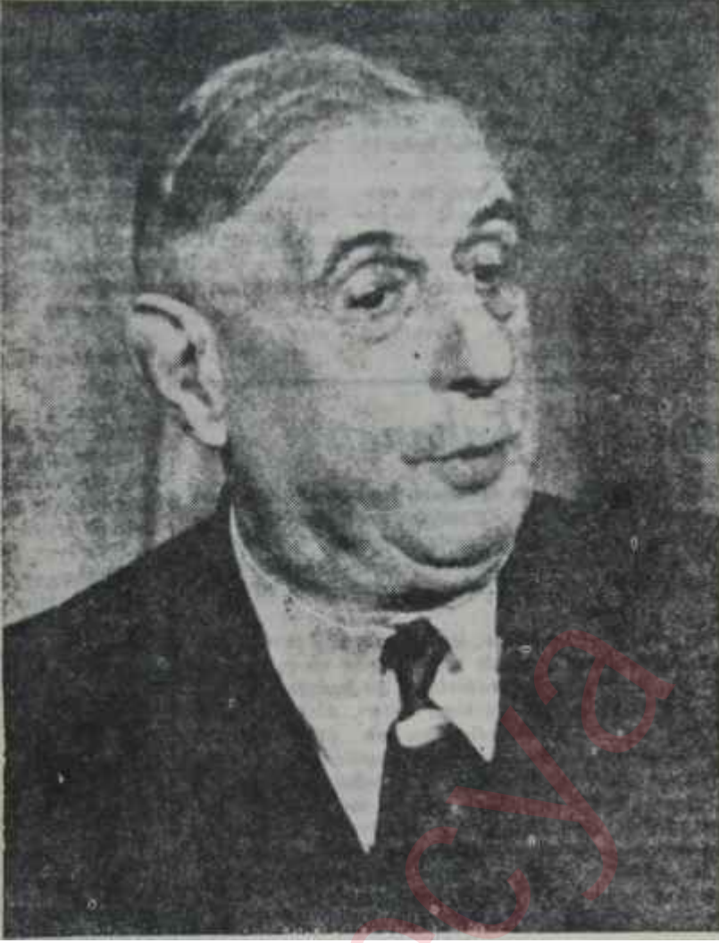
General De Gaulle Geçimsiz bir zat

daha ziyade muvazenesizlik olduğunun delilini teşkil ediyor. Parlamantonun tutumuna karşı Devlet Başkanı, kendi görüşlerini Referandumla millete tasdik ettiriyor. Ama bunu General de Gaulle olduğu için yaptırabiliyor. Ondan sonra, ne olacaktır?