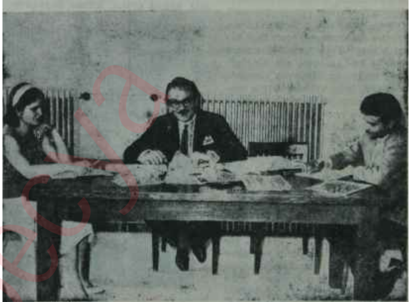
T.D.K. Tanıtma Kolu çalışıyor Başarıya giden yol

Türk Dil Kurumu, Tanıtma Kolu, benzeri bir toplantıyı da Haziran ayı içinde İstanbulda yapmak kararındadır. Bu çalışmaların, Kurumla Basını birbirine yaklaştırmak yönünden olduğu kadar, Türk dilinin arılaşması yönünden de büyük yararı dokunacağı, ilk toplantının genel ha-