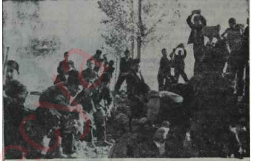
Zirkayı Geliştirme Derneğinin faaliyeti Hayırlı sonuçlar

Baytal bu işleri yapmak için Devlete müracaat etmemiş, hayır kurumlarından faydalanmıştır. Fakat her eserde muhakkak çocuklarını çalıştırmış ve kendisi de onlarla beraber çalışmıştır. Bugün köyün ve yurdu'nun çamlandırılması işine de başlanmış