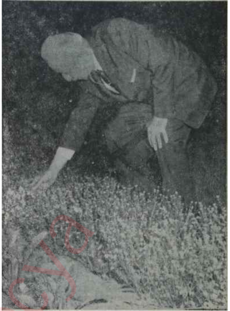
Başbakan İnönü Meclis bahçesinde

Devlet Bakanı Dođanın İstifası, bir bakıma, C.H.P. içinde de yaygın halde bulunan bir temayülü ortaya koydu. Gençlerin teşkil ettiği ve milli huzurun sağlanması için zecri tedbirler alınmasını isteyen bir başka grup, bayram ertesi faaliyete geç-