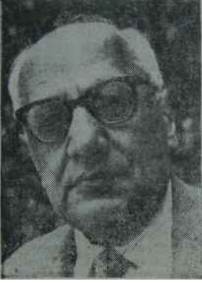
Sıddık Sami Onar