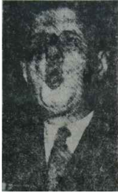
General De Gaulle

Bu son bahiste General kendi kabine arkadaşları ile de hemfikir değil. Bitirdiğimiz hafta bu konuda söy-