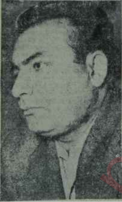
Yaşar Kemal Herşey bu vatani için .

Günümüzün en büyük Türk romancılarından biri olan Yaşar Kemal, salt edebiyatla uğraşan, gözü edebiyatın dışında birşey görmeyen insanlardan değildir. Şiirden hikâyeye, hikâyeden romana kadar edebiyatın hemen bütün türlerini denemiş olan bu büyük romancı, aynı zamanda, Cumhuriyet gazetesinde yazdığı fıkralarla da günümüzün meseleleri üzerine eğilmekte, memleket gerçekleri üzerine tıpkı hikâyelerinin-