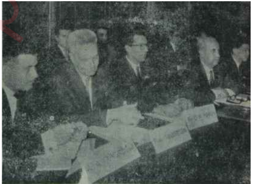
Yabancı uzmanlar çalışıyor.

Devlet Plânlama Teşkilâtı Başmüşavirinin konuşmasının önemli kıs-