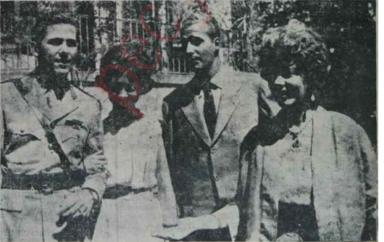
Gelin ailesi damat Don Juan Carlos ile birlikte Düğün hatırası

İspanya tahtının varisi Prens Don Juan Carlos ile sevimli Yunan Prensesi Sophian'ın dillere destan evlenmelerinin hikâyesi pek eski değildir. Gençler vaktiyle, bir düğünde karşılaşmışlardı. O muhteşem düğün kalabalığında kararlarını verdiler: Evleneceklerdi! Esasen ilk olarak o tarihten, dört yıl önce, yâni 1954 yılında bir vapur gezisinde, tanıştılar. Bu, Avrupalı taçları bir araya getiren bir geziydi. Sophia ile Carlos tanıştılar. Evlenmek, küçük zadeların akıllarının ucundan bile geçmedi. Ama kader yolunu çizmiş, müs-