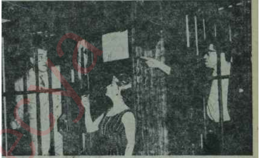
Kadıköy bölümünde "Aman Avcı" Vurma beni

erkeğin dil dökerek kaldıramadıkları İsraili, salon yosması, kadınlığını kullanarak yumuşatmaya çalışır, ama o da muvaffak olamaz. Dünyayı uçurmak üzere olan İsraili, son dakikada, emrini yerine getirmiyen sağır ve dilsiz bahçıvanı bu kararından vazgeçilebilecektir. İğgüdüyle hareket eden "sâf insan"ın sağduyusu bütün nutuklardan ve seksüel zevklerden daha etkili olmuş, kafestekilerle beraber bütün benzerlerini yok olmkatan o kurtarmıştır. Hisseden kissa: Dünyayı gene "İnsan kardeş" kurtaracaktır. Ama sağır ve dilsiz insan kardeş! Bu da yazarın atom ve füze çağının uzay yarışmaları karşısındaki tepkisidir, -nükte ve hiciv dolu bir tepki!