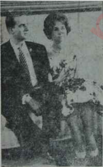
Don Juan ve Sophia Asrın çiftleri

İki taçın vârislerini bir araya getiren şahâne düğün, Atina için büyük bir kazanç oldu. Akıllı Karamanlis, düğünü büyük bir turist, celbi vesilesi yaptı. Bu işte öylesine muvaffak oldu ki, düğünün çok masraflı olduğunu söyleyen Muhalefet liderleri bile sustular. Ayrıca, sokak nümâyişlerinde de ara verdiler.