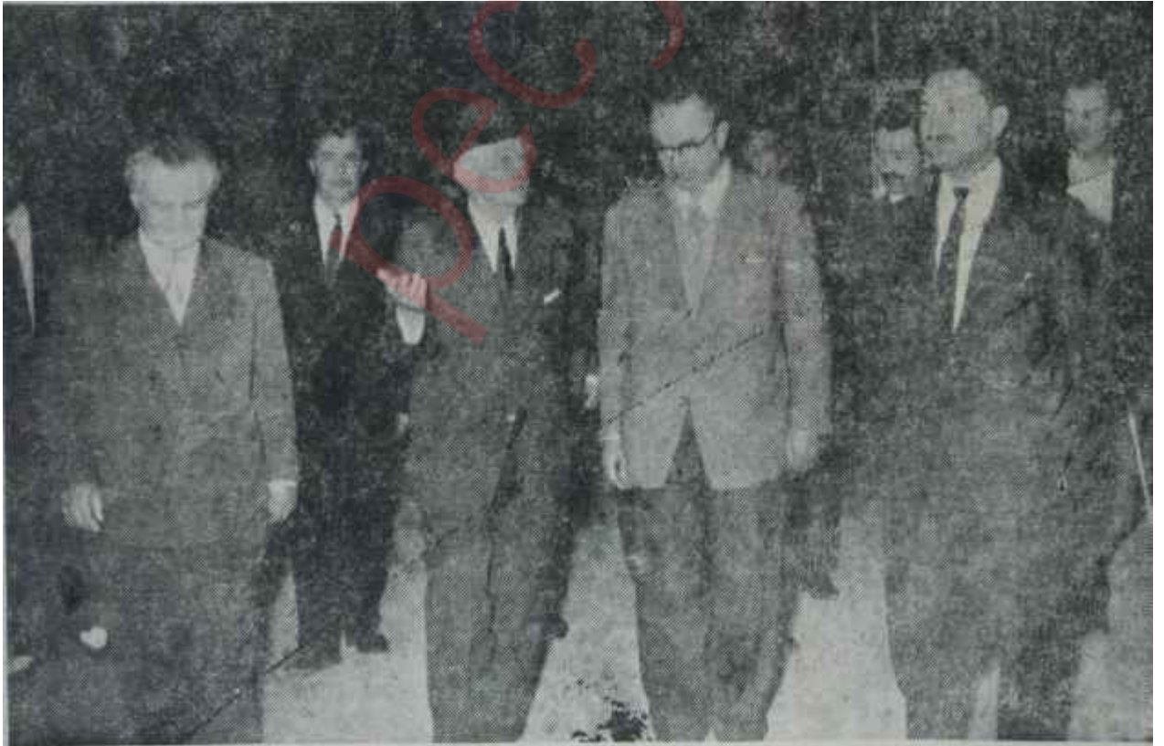
İnönü ve Bakanlar arefe günü yapılan toplantıdan çıkıyorlar Herşey huzur için

"— Af konusunda Gümüşpaladan aldığımız cevap, beklediğimiz aydın- lığı getirmedi. Hükümette bulunan A.P. li Bakan arkadaşlara kalırsa, bu cevap müspettir. Ama biz bunu