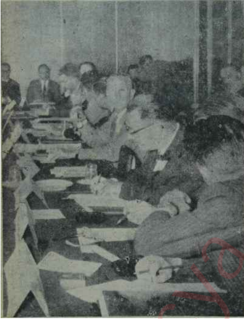
Devlet Plânlama Teşkilatındaki açık oturum