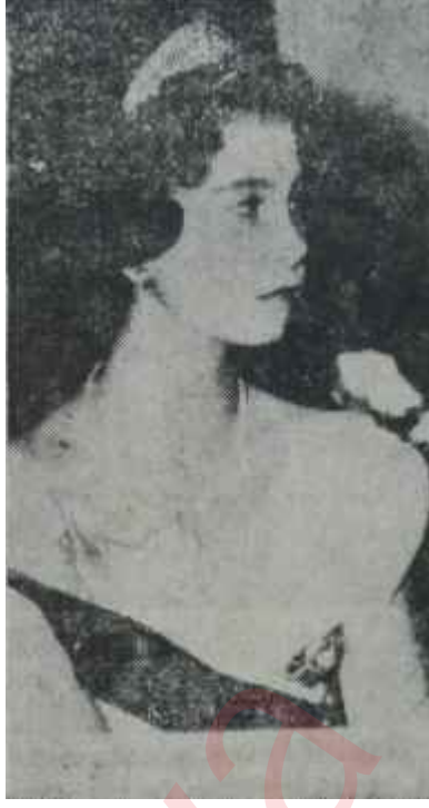
Prenses Sophia Nazlı gelin

O gün Akropolden atılan beş pare top, düğünün başladığını haber verdi. St. Denis Katedralinde, 9.15'de törene iştirak edecek zevat yerlerini almışlardı. Başbakan Karamanlis ve zarif esi, Parlâmento sözcüsü ve eşi, Dışişleri Bakanı Averof ve eşi, Yunanistanın Madrid Büyükelçisi, yabancı kral, prens ve prensesler, General Franco'nun şahsi temsilcisi Amiral