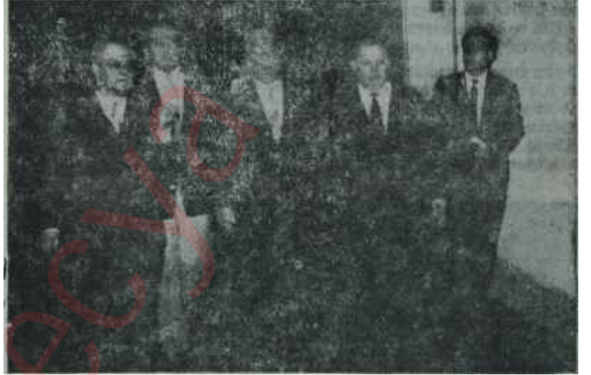
A. P.- li Bakanlar Meclis koridorlarında iki cami arasındaki beynamazlar

Özardanın teklifinin A.P. içerisinde yarattığı panik, A.P. yöneticileri tarafından ertesi gün önlenmek istendi. Yöneticiler, A.P. Genel Başkanı Gümüşşalanın 19 Mayıs Gençlik ve Spor Bayramı münasebetiyle bir mesaj yayınlamasını ve bu mesajında meseleleri telif etmesini arzularlardı. Düşünülp taşınılarak A.P. Genel Merkezinde kaleme alınan Gümüşşalanın bayram mesajında ortaya bir gerçek çıkıyordu. Gümüşşala evvelâ, Hükümet buhranının, koalisyonun C.H.P. kanadı tarafından çı-