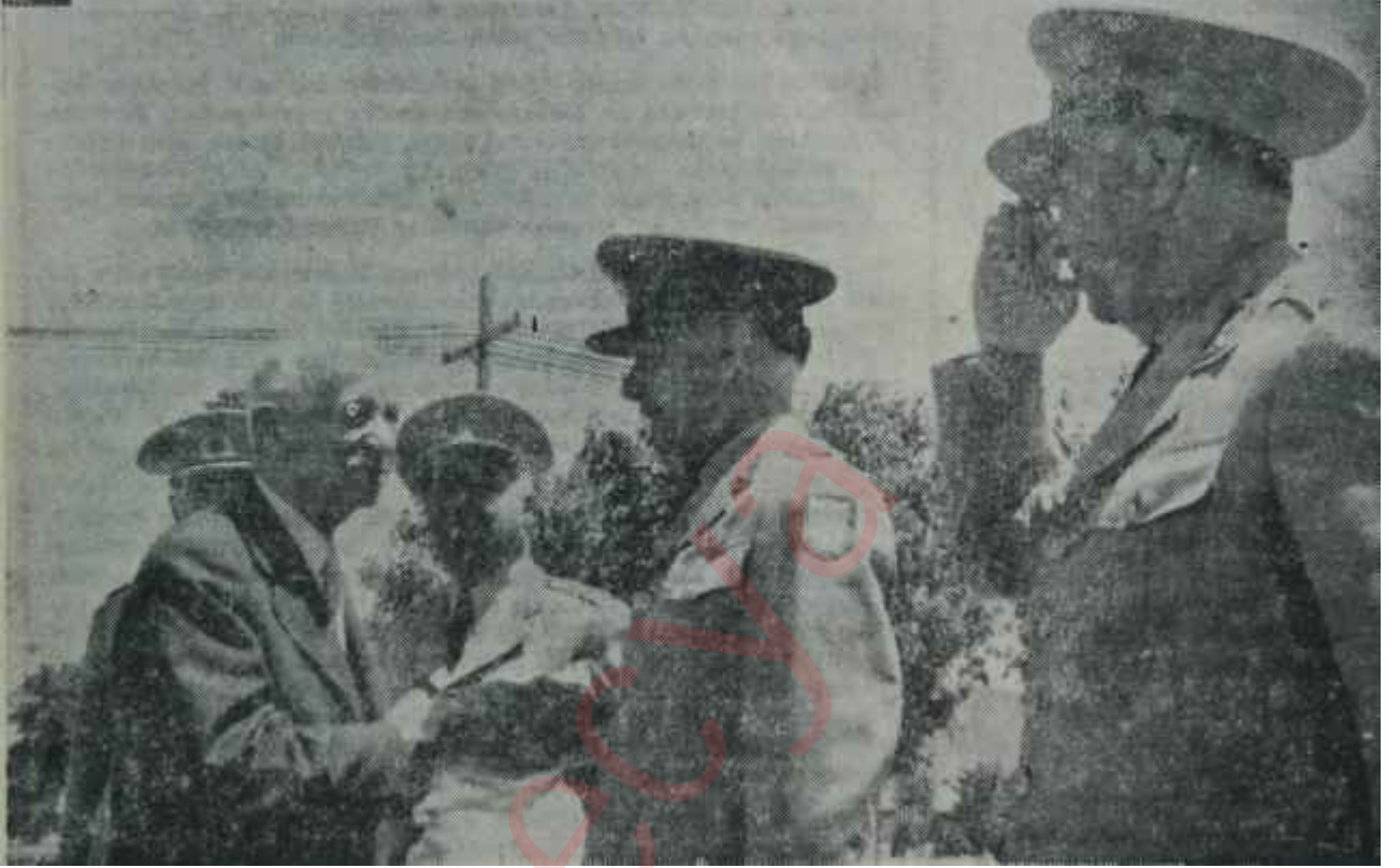
Başbakan İsmet İnönü 28. Tümende kumandanlarla birlikte Askerin dilinden askerler anlar