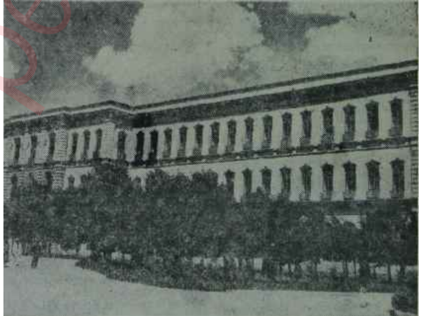
İstanbul Üniversitesine umumi bakış

Tabii bu "oyun" 11'ler tarafından duyulunca kahaahalarla karşılandı ve bu, sözde feragatnameyi kendileri a-