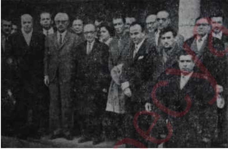
A. P. İl Başkanları toplantı halinde