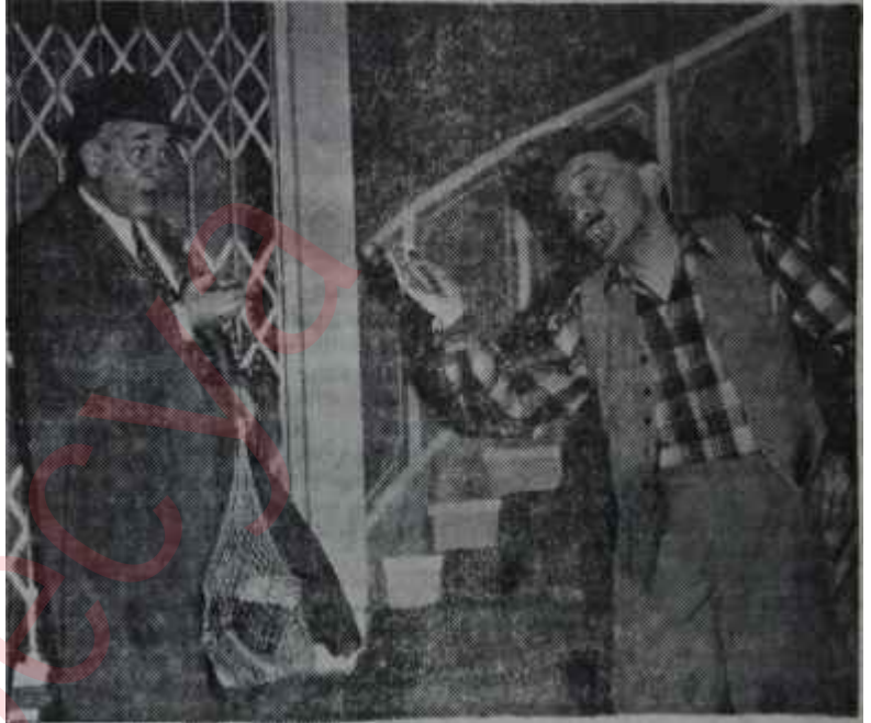
Başkutun "Göç" ü oynanıyor

Onun yanısıra, ikinci perdede, aile hayatlarına ve çeşitli dertlerine va-