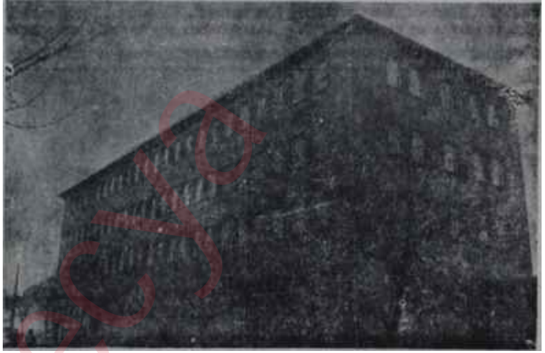
Ankara Kanser Hastahanesi

Marttan İtibaren hastahaneyi Sağlık Bakanlığına devretmiş saydığı için, ortaya, personelin maaşı bakımından bir takım gülünçlükler çıkmıştı. Bir kere Bakanlığın, şipşak kadro yapıp, tâyin işini halledip, personelin maaşını kanuni süre içinde ödemesine imkân yoktu. Kurum ise, hastahaneyi Bakanlığa devrettiği için personel maaşı diye bir konuyla sorumlu tutulamamaktaydı. Personel tam mânâsile muallâkta kalmıştı. Hele durum hakkında personele hiç bir tebligat yapılmamış olması, ayrı bir gülünçlüktü. Ancak bu arada