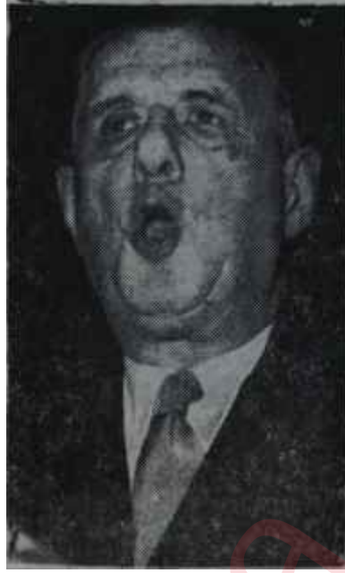
General De Gaulle Çizmeyi çekti

En çok hangi nokta üzerinde durulmuş, hangi bahis "ateş kes" in tahakkukunu geciktirmişti? Cezayirin Fransa ile işbirliği içinde bağımsız-