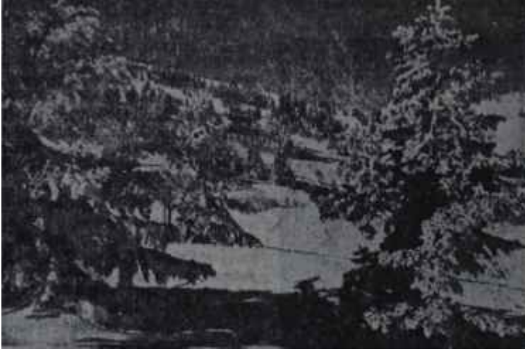
Turistik bölge Bursada Uludağ