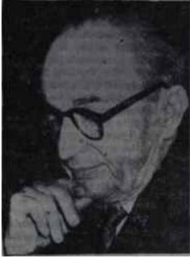
Ragıp Gümüşpala Mavi boncukcu

yarattığını Cumhurbaşkanı bile söylemişti.