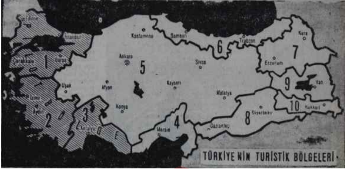
Türkiyenin Turistik Bölgelerini gösterir harita