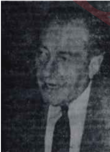
Vildan Aşır Savaşır Tu kaka

tisalarının kendilerine yetki verdiği sahalarda -ve ancak o sahalarda- memleket hizmetine Hükümet Başkanının bir alaturka "bipartizan idare anlayışı" ve yönetici kadrosu uykuda C. H. P. nin uyusukluğu yüzünden iade olunamayacaklar, bunlar başka C. H. P. lilerin başka türlü partizanlıklarının takası sayılabilecek, şirretlik gene prim yapacaksa ah bize, vah bize!