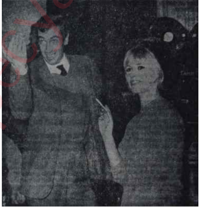
Brigitte Bardot ve rejisör Roger Vadim Yaratan ve yaratılan

Lara'nın bu Sinemo'nun hikâyesini anlattığı eski ve gelenekçi bir sinema diliyledir. Tabii, sıkıcı değildir. Yalnız, kendisinden daha başlangıçta herhangi bir yenilik beklenmemelidir. Elinde iki iyi oyuncu ile Jean Gabin ve Edwige Feullere oyun yönünden sonuca iyinin üstünde varabilen rejisörün tek aksaması Bardot iledir ki, Gabin gibi usta ve yıllanmış bir oyuncu karşısında Bardot gibi de star sisteminin yarattığı yapma bir oyuncunun mağlûbiyete uğramasını da artık normal karşılamak gerekir.