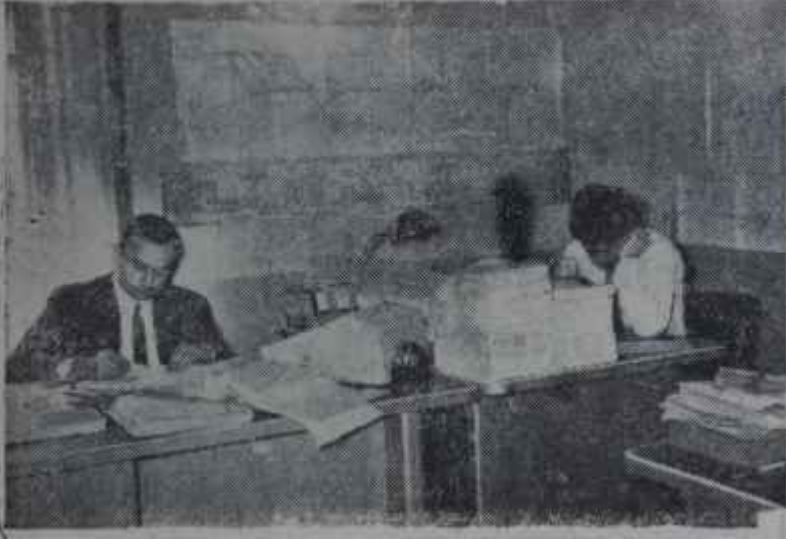
Devlet Plânlama Dairesinde hummalı faaliyet