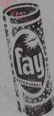
Köpüklü - Deterjanlı

İçerisinde bol köpüklü deterjan bulunan FAY TEMİZLEME TOZU, en iyi kalite ve kalitesine kıyasla piyasanın en ucuz temizleme tozudur