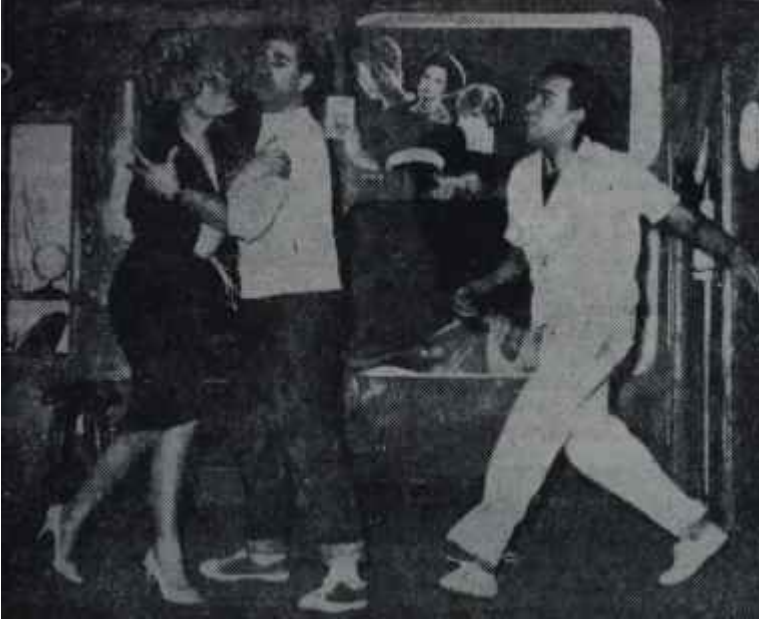
"Tepeden İnme"den bir sahne Her "inen" böyle olursa...

girişmek istemezlerse de, General Zandek'in adamları onları yola getirmekte zorluk çekmezler. Ama hiç bilmedikleri, tanımadıkları adamların kafalarından geçenleri nasıl okuyabileceklerdir? İşte Amerikalı yazarların buluş kaabiliyetleri burada İngiliz sanatlarının imdadına yetişiyor. Hem onları güç durumdan alın akıyla çıkarmanın, hem diktatör generali inandırmanın, hem de seyirciyi kahkahadan kırıp geçirmenin yolunu buluyorlar. Bu arada, Elsie'nin, kapandıkları parayı çıkarabilmek için gizlice satın aldığı ve bir sigara paketinin içinde sakladığı kıymetli bir posta pulunun elden ele ve cepten cebe dolaşması da işin tuzu biberi oluyor.