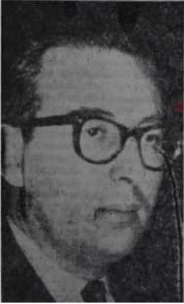
Turhan Feyzioğlu Niyet ve Kısmet

Haftalar vardır ki başkentte, bir fakım elçi adayları gazete gazete doluşmakta, haberler uçuşmakta, havalar yaratmakta, kulis yapmakta, kısaca ortalığı karıştırmaktadırlar. Gün de her gazete bürosuna asgari böyle Üç tip gelmektedir. Her biri, kendini sadece en iyi yere lâyık görmekte,