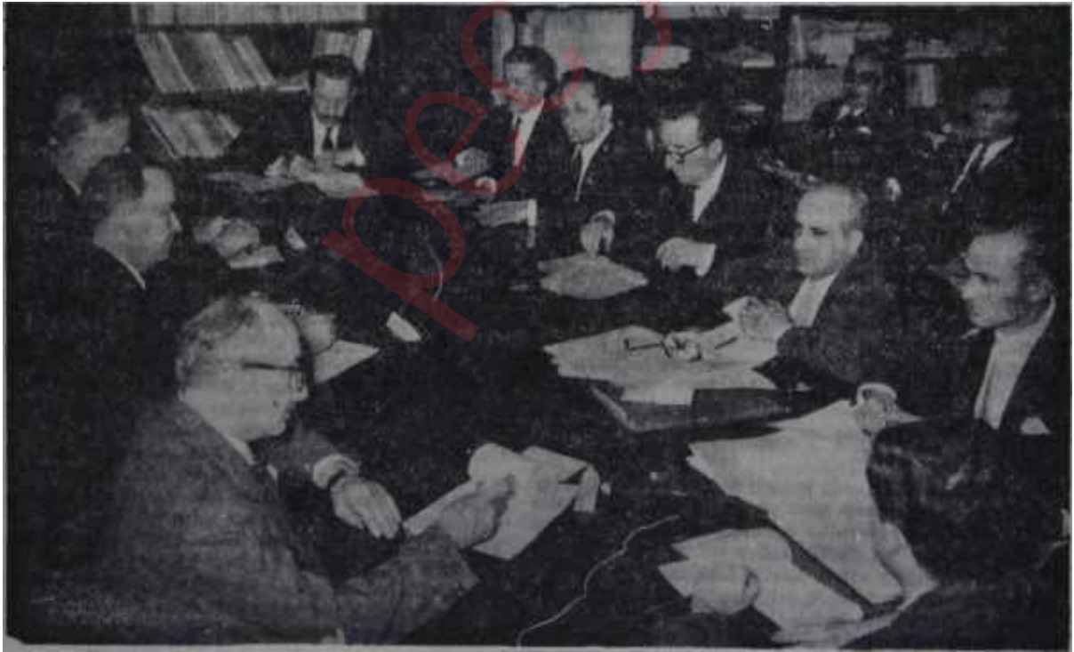
NATO İktisadi Heyeti ile Heyetimiz toplantı halinde

Devlet Plânla- ma Teşkilâtı devlet dairelerine ve bütün İktisadi Devlet Teşekküllerine gerekli talimatı vermiş ve beş yıllık kalkınma planıyla il