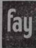
Herşeyi Daha İyi Temizler