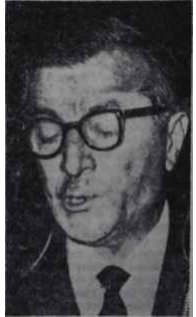
İsmail Rüştü Aksal Kapısı kapalı adam

bir takım gayrimesul şahsiyetler elçilerle rekabet durumundadır. Ama Feyzioğlu, kanunun kalkması kararlaştırılmışken bunu sürüncemede bırakmaya muvaffak oldu. Sarper, bazı Bakanlıklardan ve kendi Bakan-