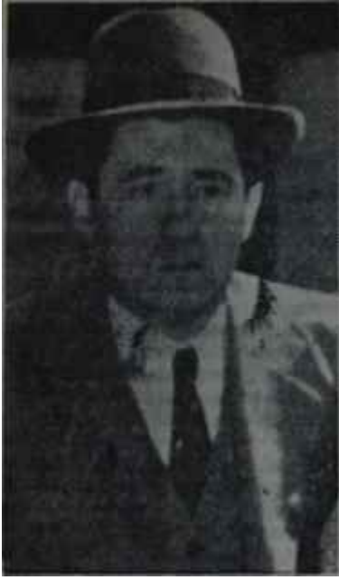
Gromiko Plâna, plan!

gayeye hizmet eder gibi görünmektedirler. İkisinin de amacı bu memlekette her üç eğilimi de temsil eden bir hükümet kurulmasıdır. Güney Vietnamda ise Çinin desteklediği komünist hareketini Sovyetler can-u gönülden alkışlamadıkları gibi, Ame-