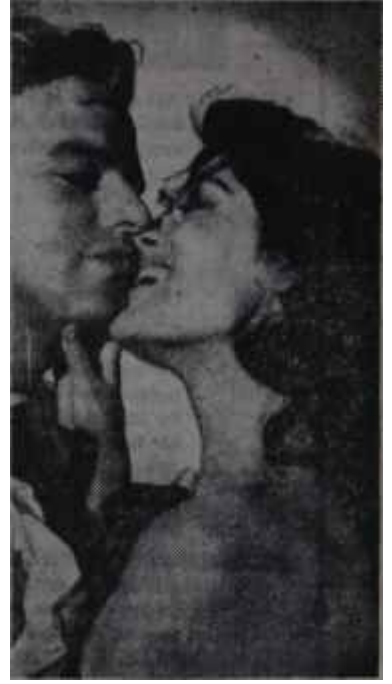
Kanlı Çingene Değişmeyen "Stella"

Bağımsız yaşama adına Stella'nın hikâye içinde yer alan birinci tutkunu Aleko iyi bir kadın insanıdır. Üstelik duygulu bir kişidir de. Şiir yazıyor, Stella'ya piyano satın alıp hediye edecek kadar da varlıklıdır, Stella'yı da iyiden iyiye sevmektedir. Kadını kendine daha çok