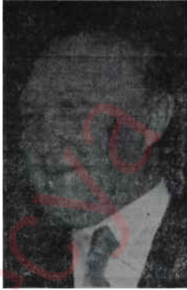
Adenauer iyimser ihtiyar

Adenauer, Batılı müttetikleri, Berlin işinin tazyiki altında silâhsızlanmada tavize yanaşmamaya davet e-