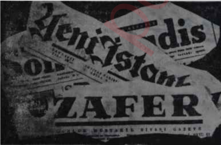
Yeni İstanbul, Zafer ve Son Havadisın başlıkları baklava tepsisi boş geldi

Fibran Battaniyeler Yeni KAKAMÜRSEL'de AKİS — 188