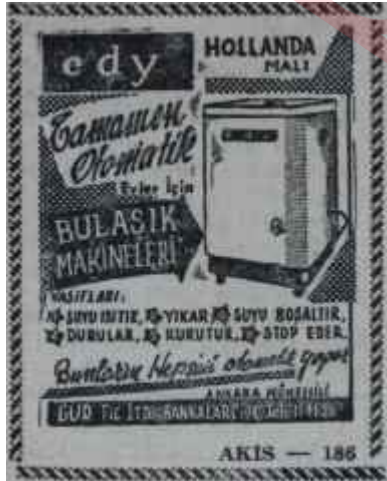
AKİS, 19 MART 1962

Bluzla sokağa çıkmak, hatta bir kokteyle gitmek mümkün olacaktır. Şeffaf kumaşlardan yapılmış süslü bluzların yanında, etek üstüne dü-