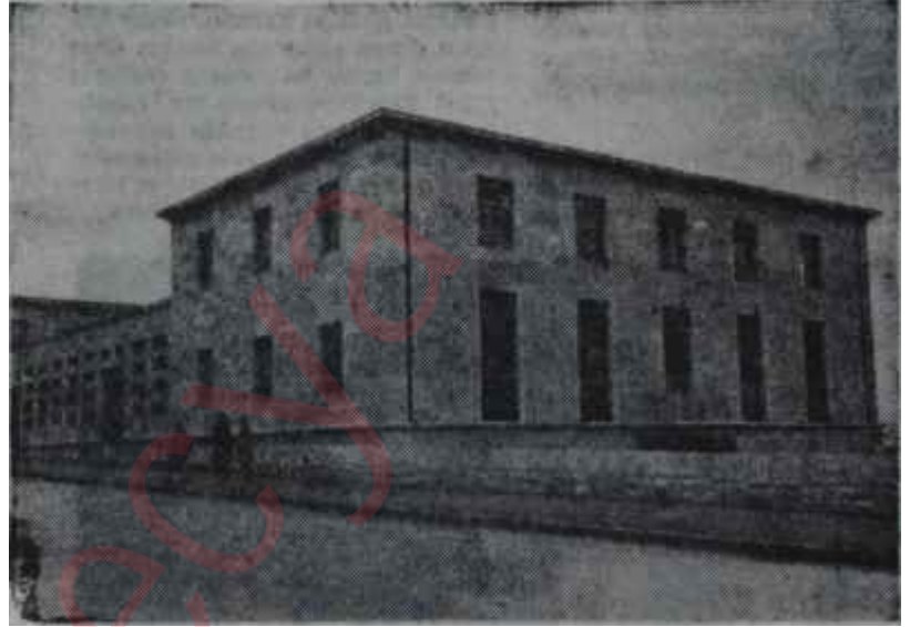
Devlet Plânlama Teşkilâtı binası