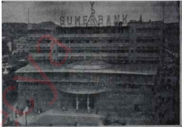
Sümerbank Umum Müdürlüğü binası