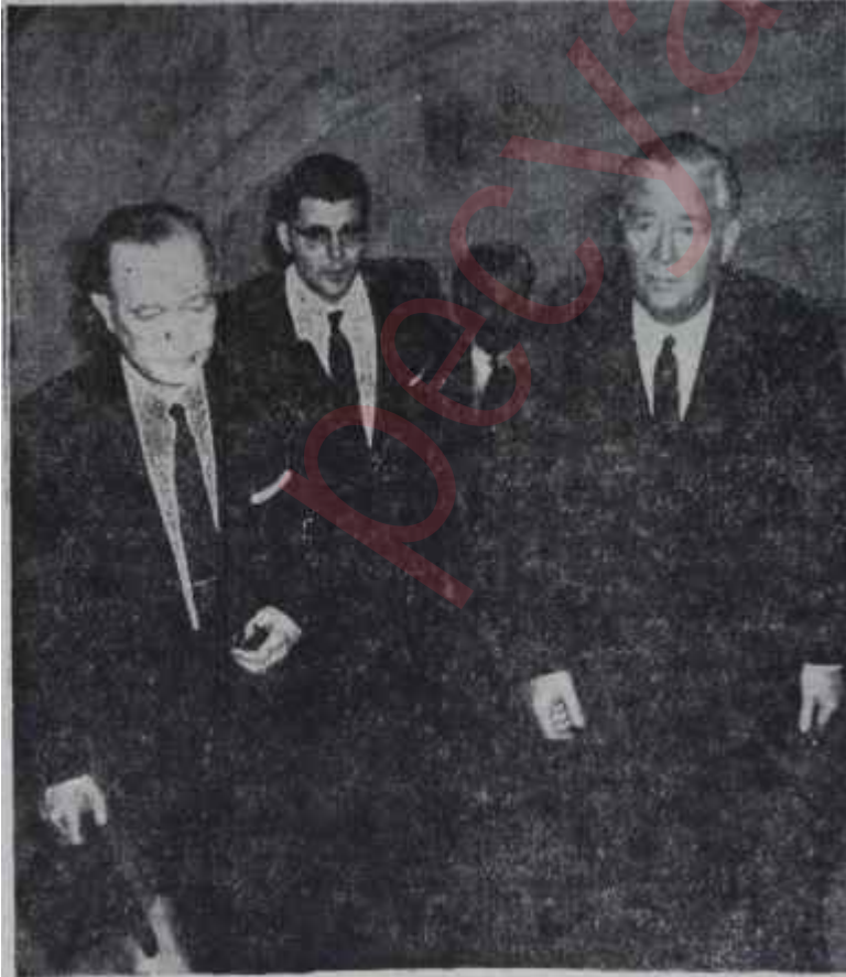
İktisadi Heyet, Plânlama Teşkilâtının merdivenlerinde Yüksek ideallere doğru

Torunun meslek hayatında unutamadığı faydalı tartışma, geçen yıl Hindistanda Nehru ile yaptığı konuşmadır. Hindistan Başbakanı plânlama işinde önemle bir mesele üzerinde durmuş, Torunu Nehrunun bu ikazı bir hayli ilgilendirmiştir. Nehru bir memleketin plânlamasını muhakkak yerli elemanların yapması tarafıdır. Bu bakımdan bol miktarda