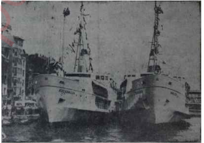
Kuzguncuk ve Kanlıca iskelede bekliyor

Gerçekten İhsan Kalmaz sefere konduktan sadece 13 gün sonra li-