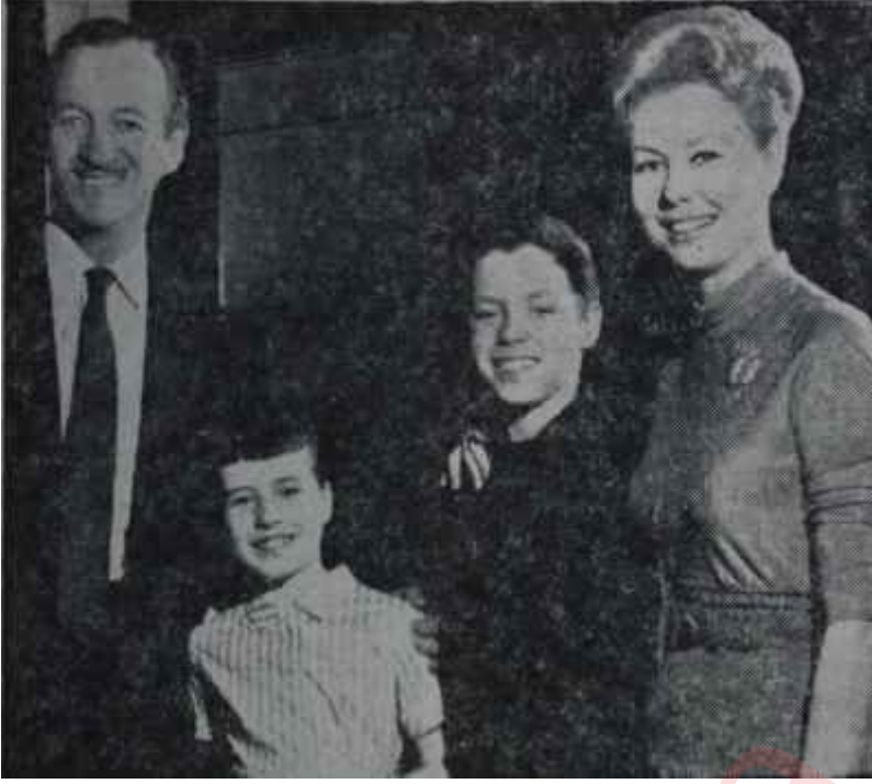
D. Niven ve M. Gaynor "Mesut Yıldönümü"nde Evlilik güzel Şeydir!

bağlı bir kişidir. O gün de evine erken geliyor. Yıldönümü gününü bütün iç ve dış çevre önemsemektedir. Kayın-peder ile kayıvalide de yemeğe davetlidirler. Bu arada Niven'in ortağı da çok zengin, ama dört kocadan bosa-nmış bir kadını -Monique Van Voo-ren- kendisiyle evlenmeye kandırma yollarını aramaktadır. Az Parisli ve az da hafif meşrep bu zengin kadın ile geçkin bekâr ortağın serüvenleri, Niven ve Gaynor'lu evliliğe zıt bir paralellik sağlıyor.