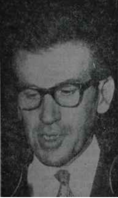
Raif Aybar Floş!

ti yoktu. İşte bu ifadedir ki Alicanın ileri sürdüğü iki şıktan birincisine daha tasavvur halindeyken sıfırı tükettirdi.