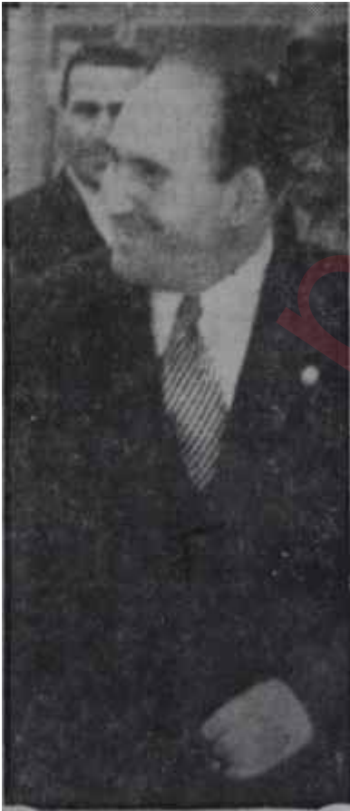
Şeref Balkanlı Çat orada, çat burada