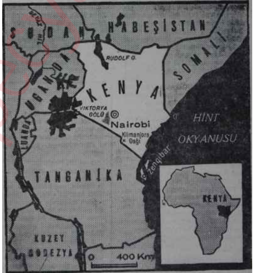
KENYA VE KOMŞULARI

suldürler. Bu mesuliyeti henüz gereği gibi üzerlerinden atamamışlardır. Şimdi Çombe işini yoluna koymuş, toprakları üzerinde çalışan şu mahut "Maden Birliği" üyelerini ve diğerk menfaatleri uzlaştırmış, dolayısıyla kendisine yöneltilen hareketleri durdurmuş olduğuna göre, Sir Roy, istikbali bu kadar parlak olan bir komşudan bir "Anayasa kâğıdı" yüzünden vazgeçebilir mi? Katanga maden damarları Kuzey Rodezyaya uzanmaktadır ve Kuzey Rodezyanın Katanga madenlerinde büyük hissesi vardır. Yarın, öbür gün Londra kabinesi Kuzey Rodezya anayasasını yürürlüğe koyup da bütün bu menfaatlerin sahibi kim olduğu meselesini münakaşa konusu ederse, ne olur? İşin aslı budur. Sir Roy Welenski, muhtemelen muhtar olabilecek bir Katanga ile kader ortaklığına hazırlanmaktadır. Ama, Kongonun huzura kavuşmasına mâni olan Çombe bir zenci, Rodezyayı idare eden ise "Sir" imiş!.. Bunun dünyayı parmağında oynatan "büyük iş" âlemi için hiç bir ehemmiyeti yoktur. Hattâ bu âlem