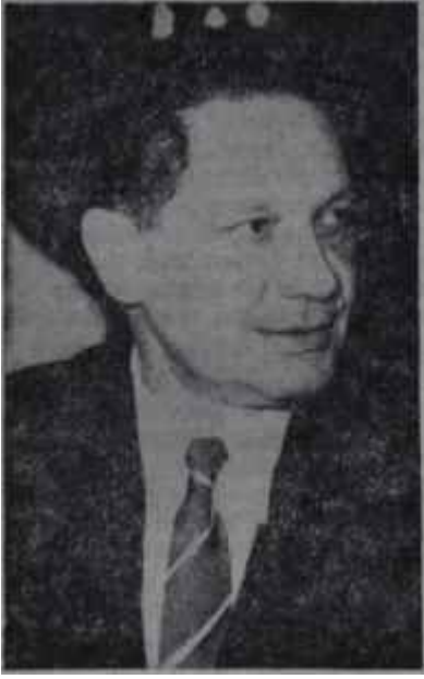
Sami Şehbenderli Merhametten maraz

lamalar, devrin Başbakanı nezdinde teşebbüsler birbirini takip etti. Ankarada Maliye Bakanlığı da, öteki "Nüfuzlu Bakan" aleyhinde tavır takındı. Hemen herkes, en büyük iyi niyetle, bir malın ucuzu dururken pahalısına niçin iltifat edilmesi gerektiğini anlamıyor ve Fairfield uğrunda mücadele ediyordu. Mücadelenin kızgınlığından meselenin başka hususiyetleri ve unsurları kolaylıkla gözden kaçtı. Gemilerin evsafı adeta ikinci plâna düştü ve bir vurguna, daha doğrusu bir yeni vurguna mani olma endişesi her şeyin başında gelmeye başladı.