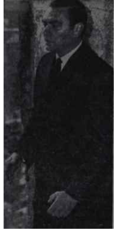
Borgnine "Çifte Tehlike"de Bir oyuncu harcanıyor

Boris Morros'un hikâyesi ve baından geçenler aslında çok ilgi çeki serüvenlerdir. Ayrıca rejisör De Toth'un elinde de her türlü kalıba bü-