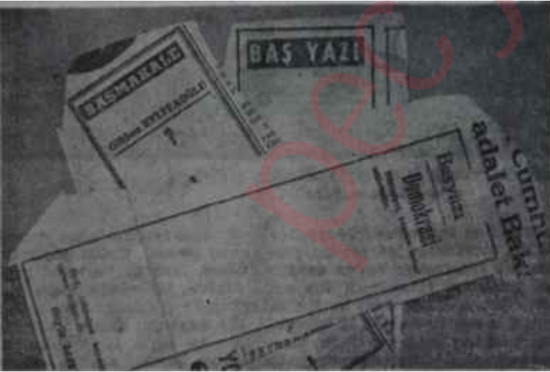
Gazetelerdeki beyaz boşluklar