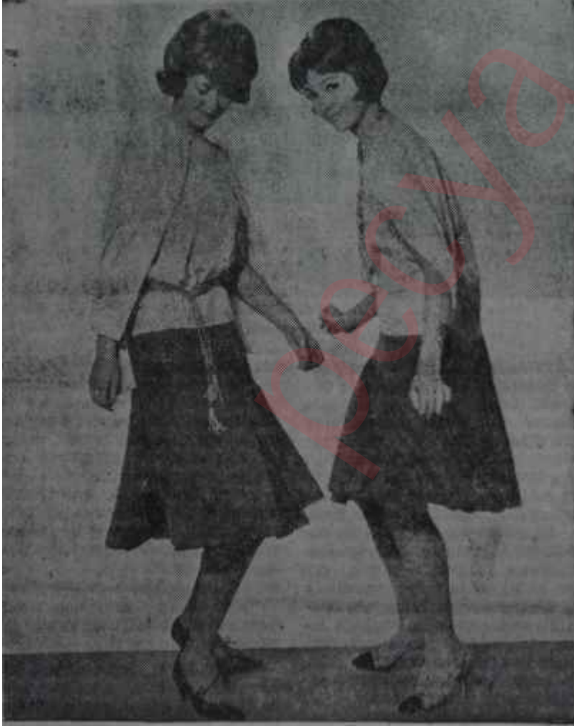
Twist modası "Benimle oynar mısın?"

Twist havası Gençkızlarda bu yıl twist modası hâkimdir. Bu, dansı kolaylaştıran bir rahat kıyafettir ama, dansla hiç ilgisi olmayanlar da çoktan bunu benimsemişlerdir. Twist modasına en uygun kıyafet, etek üstüne düşen rahat ve bol bir sveterle, pli kaşelerle zenginlik kazanan düz bir etektir. Gençkız uzun zincir kolyesini bazen boynuna dolamakta, bazen aynı zincirle gevşek bir şekilde belini bağlayıp, belini göstermektedir. Twist