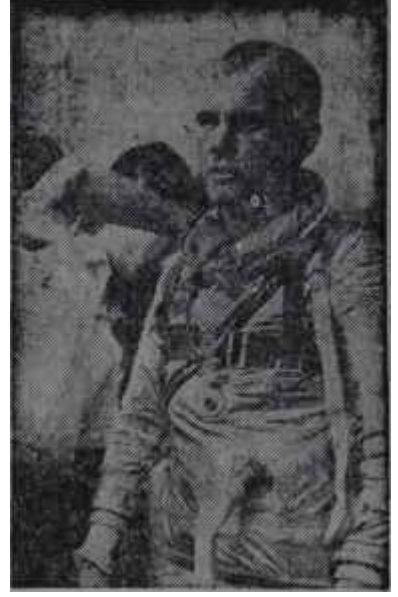
Glenn uçuşa hazırlanıyor Bilimin zaferi

Tam bu sırada Glenn'in kapsülüne yine teknik bir arıza musallat oldu. İnişe geçmesi sırasında gerekli yavaşlatmayı ve istikameti vermeyi sağlayacak kumanda sistemi mükemmel çalışmakla beraber buna otomatik olarak kumanda edecek "otomatik pilot" tertibatı, iyi çalışmıyordu. Glenn onbeş yıllık tecrübeli bir pi-