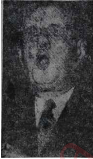
General De Gaulle "Silâhlara veda!"

General De Gaulle, nükleer denemeleri durdurmak için açılacak mü-