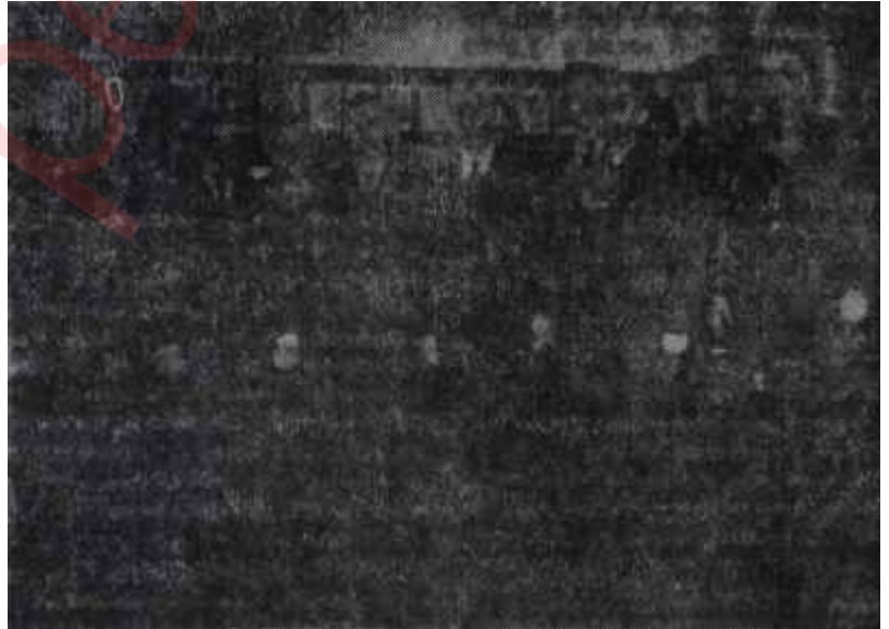
İnönü kumandanlarla birlikte