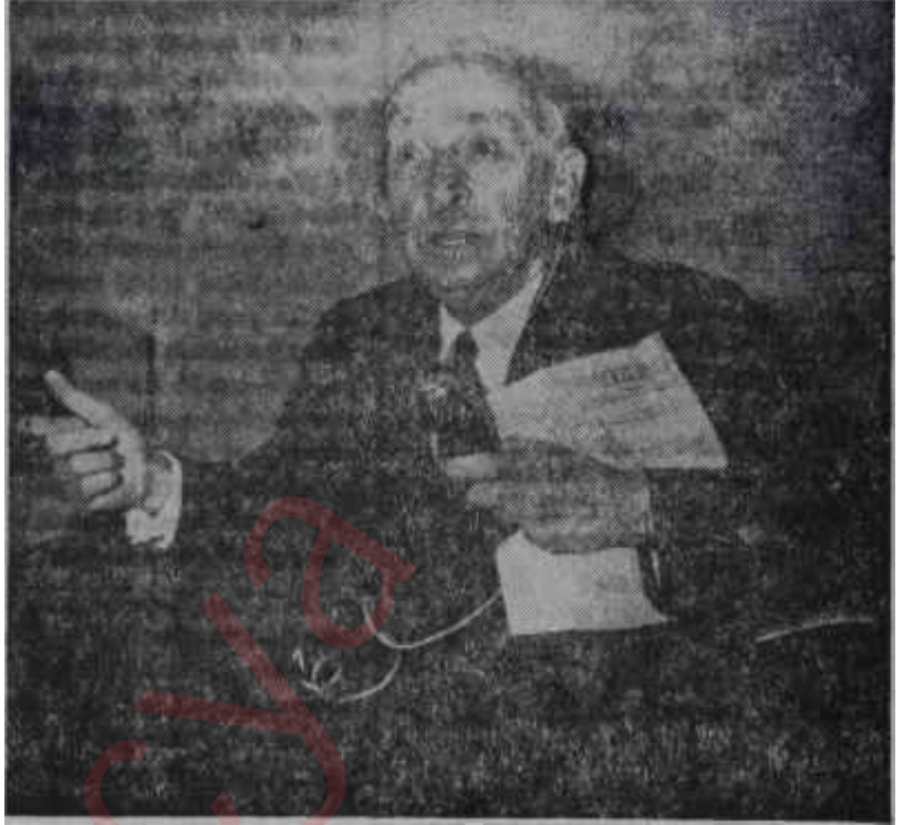
Başbakan İsmet İnönü konuşuyor

Bitirdiğimiz hafta Türkiye'de herkes emin bulunuyordu ki sadece İsmet İnönünün müstesna şahsiyeti ve Türk Silahlı Kuvvetlerine hakim olan basiret, memleketçi görüş ve Demokrasiye inanç hepimizi tarifsiz felâketten kurtarmıştır. Şimdi yapılacak iş, bir daha bu derece tehlikeli bir uçurumun kenarına gelmemek, Türkiyeyi bambaşka ufuklara götürmeye çalışmaktan ibarettir. Bilinmez, hadiseden gerekli ders alınacak mıdır? Bir takım kimselerin böyle bir dersi alacakları ümidi hemen hemen sıfırdır. En ziyade kendilerini sindiren, yıldırın tehlikenin geçmiş olduğu inancı yüreklerine yerleşir yerleşmez tatlısu kahramanlığının doyulmaz lezzeti basit ve iptidai benliklerine gene hakim olacak, ortalığı gene karıştırmaya kalkışacaklardır. Memleketi selâmet yoluna çıkarmak için bunların kaybolmasını beklemek, bir çıkmaz ayın son çarşambasını beklemekten farksızdır. Onlar kalsınlar, ama biz ilerleyelim, Zira onlara lâf anlatmak imkânı yoktur. Doğru yolu göstermek imkânı yoktur. En basit realiteleri gözlerine sokmak imkânı yoktur. İki kere ikinin dört değil beş ettiğine öylesine sağlam inançla bağlıdır ki ancak kâfalarını bir adanın kayalarına vurduklarında ayılmaktadırlar. Şu günlerin heyecan ve şaşkınlığı geçsin, sözlerinden manşetlerine, her şeyleri eski havasına kavuşacaktır