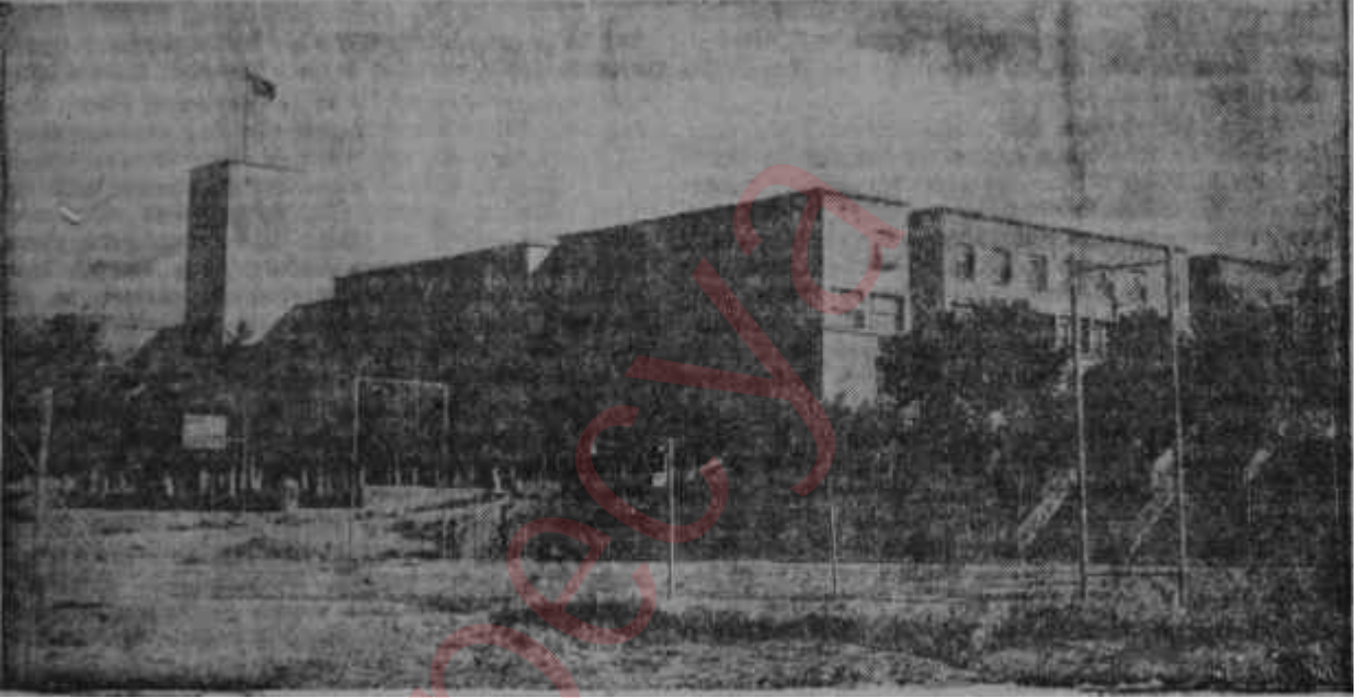
Hadiselerin cereyan ettiği merkez : Harp Okulu binası