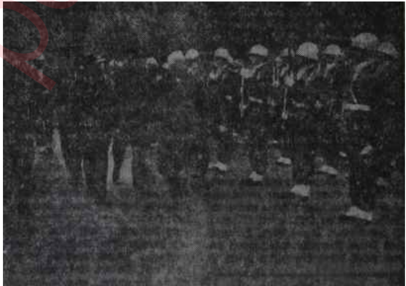
İnönü Harp Okuluna yaptığı bir ziyarette Harbiyelilerle Tırnak etten ayrılmaz

Odadakilerin yüzleri güldü. İş, hal yoluna giriyordu. Fakat İnönü, teklifi derhal reddetti. Ne yapacağını söylemişti. Yarın sabah, bunların hepsini emekliye sevkedecekti. A-