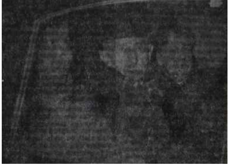
İnönü Hava Kuvvetlerine gitmek üzere bindiği otomobilinde Çat burada, çat kapı arkasında

Saat 19.10 da tanklar bir başka emir aldılar. Genel Kurmay Başkanlığına doğru biraz daha ilerlendi ve yol tamamen kesildi. O cihetten gelen vasıtalara yol veriliyor, fakat