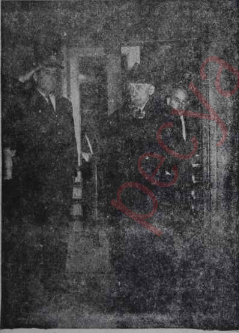
İsmet İnönü Radyo evinden ayrılıyor

Harp Okulunda ilk alarm saat 16.30'da verildi. Albay Aydemir silah dağıtım ve mermi tevzii yapılmış taburlara harekâtın başladığını bizzat haber verdi. Plâna göre, Harp Okulundan anacaddeye çıkan akasyalı yol üzerinde dört kademe halinde sıralamaktı. Dört kademenin arkasında be-