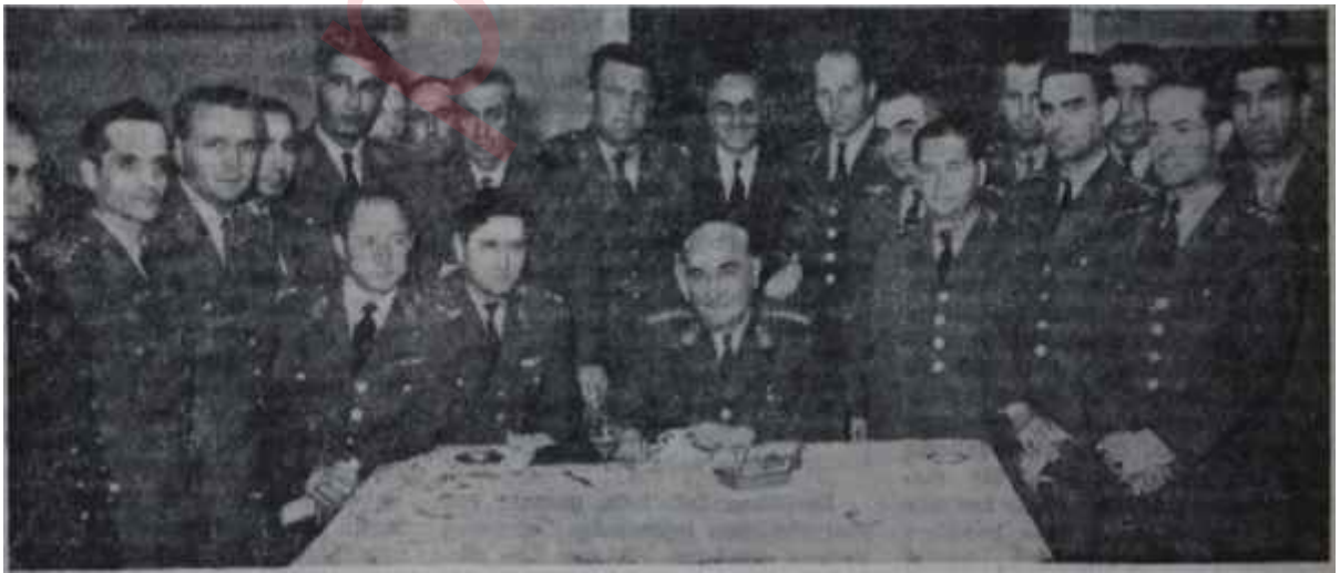
13 Kasım operasyonundan sonra yeni M. B. K. Çankaya Köşkünde Su gider, kum kalır

İhtilâl sonrasına gelince, onun hikâyesi ayrıdır. Bu hikâyeyi AKİS okuyucuları önümüzdeki hafta bu sütunlarda bulacaklardır.