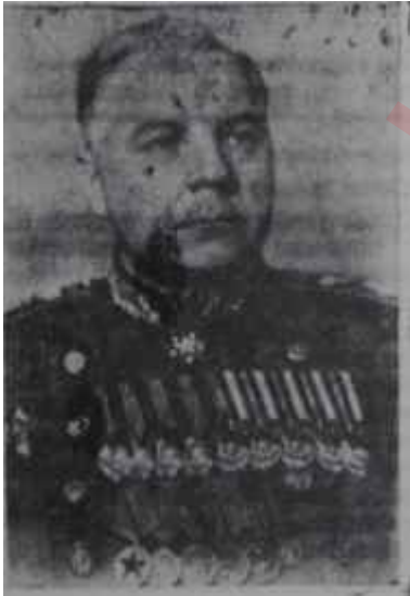
Mareşal Voroşilof Ağır aday

Gerçi Başkan Kennedy bu fikirde değildir. Başkanı çarşamba gecesi, yani son İngiliz -Amerikan cevabının Moskovaya verildiği gün tertiplelediği basın konferansında, 18 üyeli Silâhsızlanma Komisyonunun hang kademedede toplanması lâzım geldiğine dair teati edilen teklif ve, mukabil tekliflerin nükleer denemelere başlamak kararı üzerinde tesir icra etmeyeceğini, bu kararın herhalde bir ay içinde verileceğini söylemiştir. Ama işte bu bir aylık mehil, Silâhsızlanma Komisyonunun toplantı tarihinde bitmektedir. Demek oluyor ki, Amerika ve İngiltere nükleer denemelere yeniden başlamak veya başlamamak için karar almak üzere komisyon çalışma