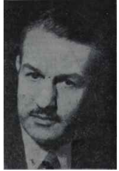
Suat Hayri Ürgüplü Liderlik yolunda

"— Yapamayız. Noter beyin emri diyorlar.