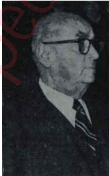
Celâl Bayar Misafir umduğunu değil...

Düşük Cumhurbaşkanının yatmakta olduğu 3. katta, belli bir sessizlik hüküm sürmekteydi. Bir ara, kapıda bekleyen jandarma, hastanın nöbetçi hemşireyi istediğini haber verdi. Nöbetçi Hemşire acele olarak bulundu. Oturmakta olduğu yatakta