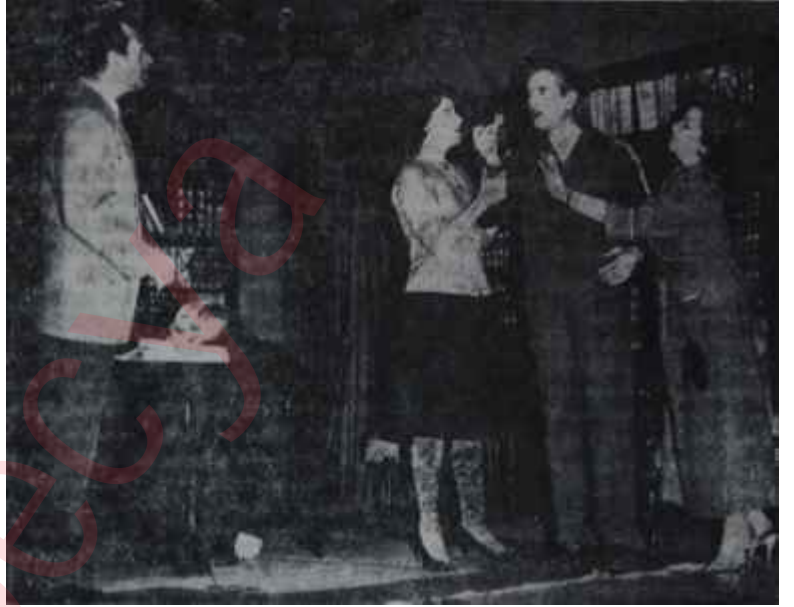
"Mor Defter"den bir sahne