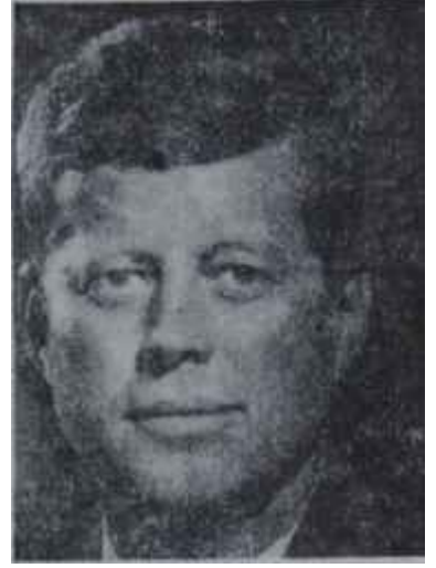
John Kennedy Endişeler içinde

Fakat öte yandan işin bir acaip tarafı da vardı. Tarafsızlar bu suretle otomatik olarak "Büyükler" safına katılmış oluyorlardı. Hem bu tarafsızların silâhsızlanma, hele nükleer silâhsızlanma ile alakalan ne olabilirdi?