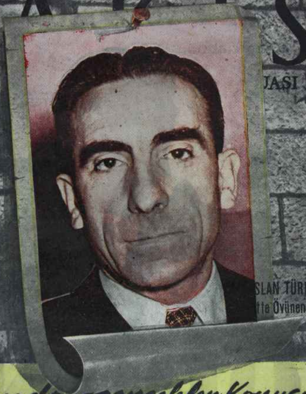
İSLAN TÜRKES te Övünen Adam

Şimdi gerçekleri konuşuyor TÜRKESİN İHTİLÂLDEKİ ROLÜ NE İDİ ?