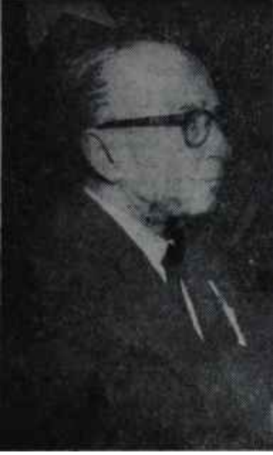
Ragıp Gümüşpala Küçük bağın derdi