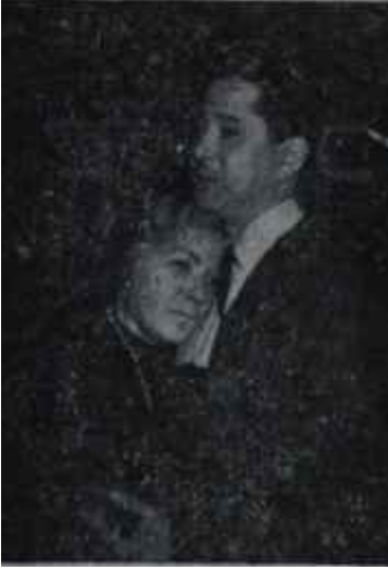
"Ağaçlar Ayakta Ölüyor" İflâs eden "yaşama sevinci"

sızlığı üzerine acımayla, şefkatle eğilen, onu hiç değilse avutmaya çalışan iki şair... Devlet Tiyatrosu bu iki önemli şairin iki yeni oyununu, hiç ara vermeden, arka arkaya sahnesine çıkarmakla bu alana sızmış olan ilk ışıklan hayli kuvvetlendirmiş, bu alanı aydınlığa kavuşturmuş oldu.