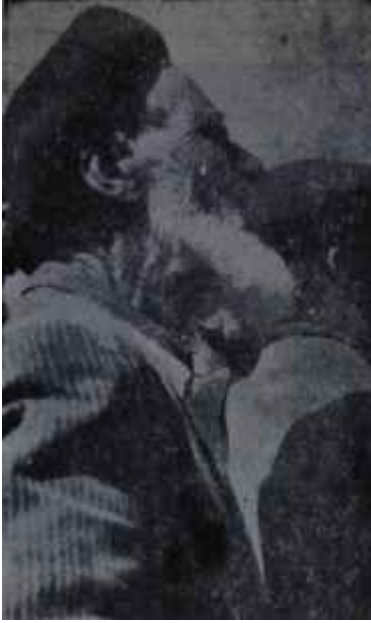
Türk köylüsü Yeni Mükellef

demek aptallık sayılacak, iyi niyetli mükellefin karşısına çıkacak güçlükler ona en sonda lanet olsun derirtecek, kaptıkaçtı usuller benimse- necek, ne İsa, ne Musa memnun ka- lacaktır.