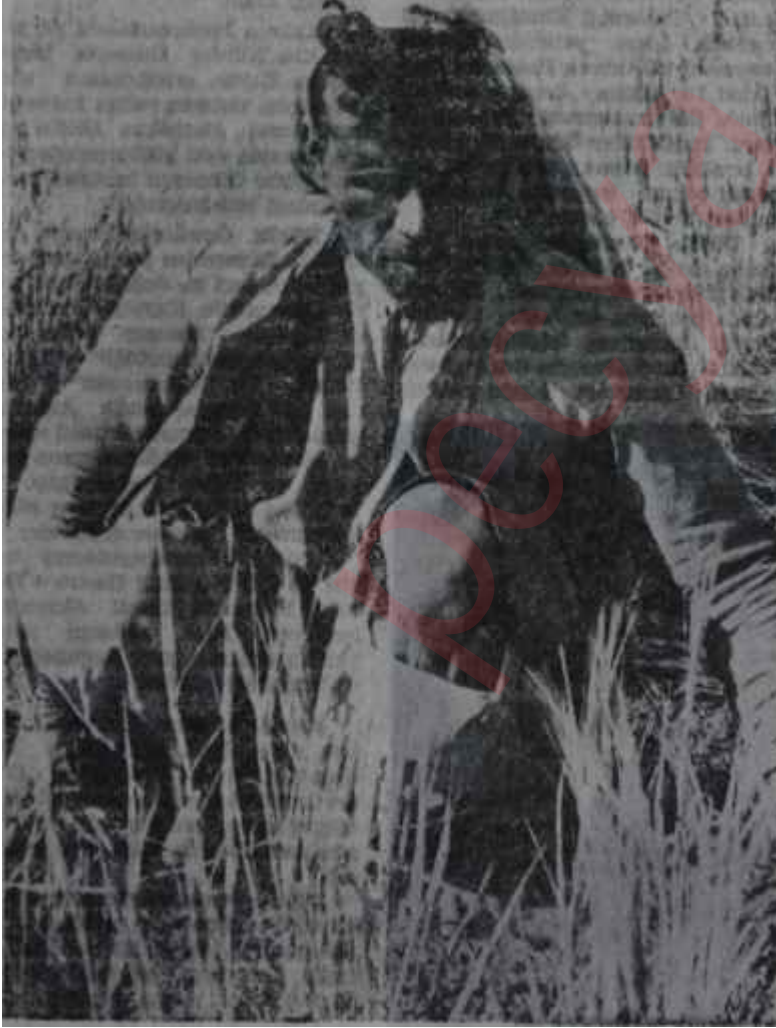
Tarlada çalışan çiftçi Kitabı olacak

Aynı şekilde, "Gerçek ve götürü usulde hasılat", "Gerçek ve götürü u-sulde giderler", "Bilanço esası" "Zirai kazançlarda asgari kazanç esas" gi-bi fasıllarda da fazla miktarda "ma-sa başı kokuşu" mevcuttur. Bunlar tatbikatta, basta Maliye mekanizma-sı, pek çok kimsenin başını derde sokacaktır. Vergi tarhi mutlaka bir mesele olacak, zaten kifayetsiz kont-rol sistemi vergiyi bir adalet deęil, adeletsizlik unsuru haline getirecek-tir. Tıpkı başka bir çok sahada oldu-ğu gibi vergi ödememek akıllılık, ö-