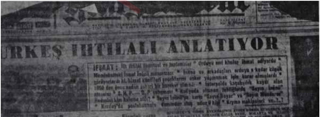
Türkeşin ihtilâl ile ilgili ifşaatının çıktığı Yeni İstanbul'daki ilân

Türk Silâhlı Kuvvetlerinin, kendisini başka ordulardan ayıran bir ta-