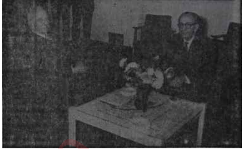
İNÖNÜ GÜMÜŞPALA İLE AF KONUSUNDA GÖRÜŞÜYÖR

mında bir değişiklik bahis konusu değildi. Geçmiş siyasi mücadelelerin; yarılarını sarmak Kabinenin hedefiydi: Ama o programda belirtilen sırada da bir değişiklik yoktu. Evvelâ cemiyette tabii hayat başlayacak." millet memleket meseleleri üzerine gi-