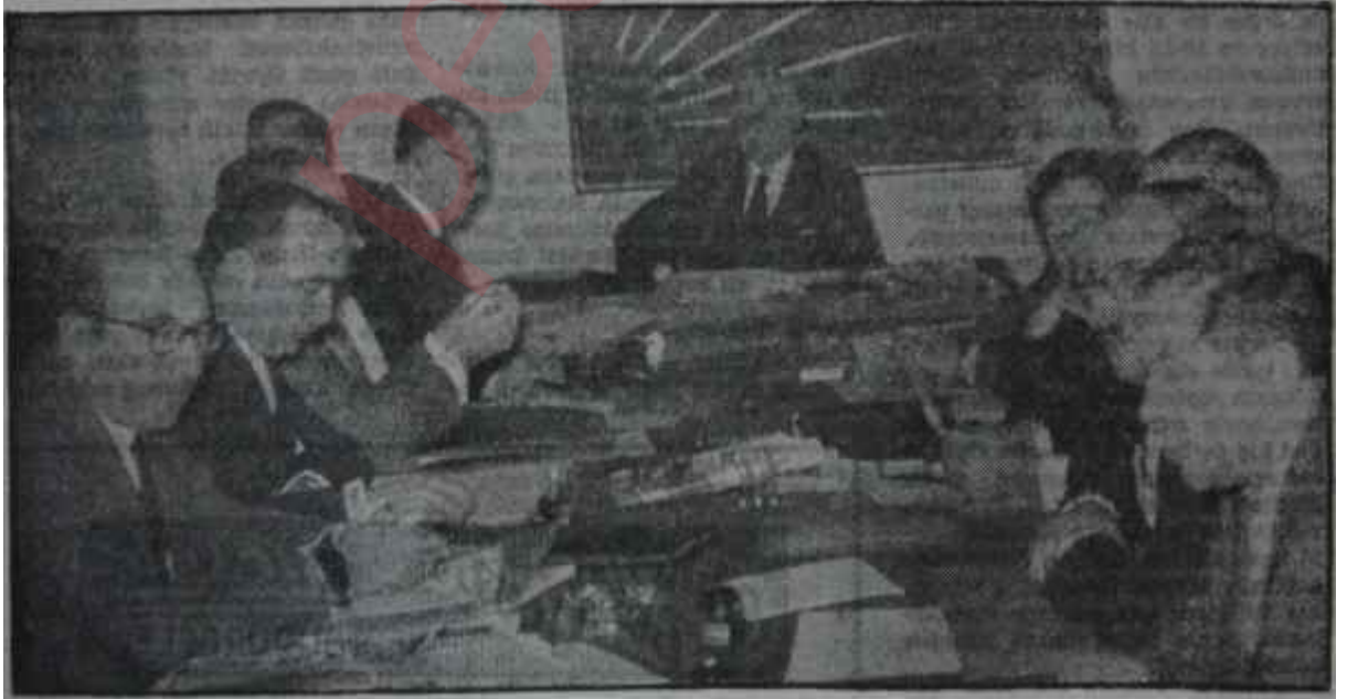
C. H. P. Meclisi İnönünün başkanlığında toplantı halinde

Gazeteciler dışarıya çıkarılınca, Genel Başkan toplantıyı açtı. Gündemin ilk maddesini, İnönünün. Başbakan sıfatıyla Parti Meclisine verdiği izahat teşkil ediyordu. (Bk. YURTTA OLUP BİTENLER-"Hükümet" ve "Adalet") Zaten Öğleden evvelki müzakereler hep memleket meseleleri etrafında cereyan etti. Saat 14 de oturuma ara verildi, öğle-