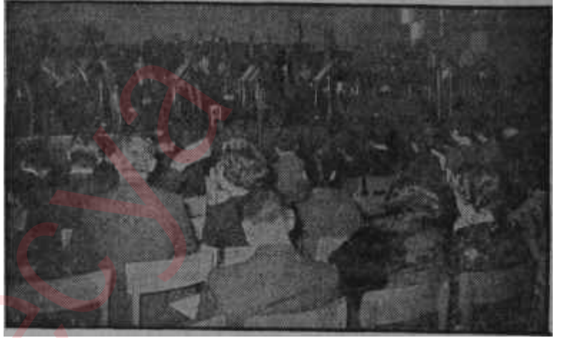
Eski Sergievindeki yeni Konser salonu

İstanbul Opera binası hâlâ iskelet halinde durmaktadır. Ankara ise, 1961 yılı içinde bir konser salonuna kavuşmuştur. Cumhurbaşkanlığı Senfoni Orkestrasının malı olan yeni konser salonu, ayrıca, Türkiyenin ilk konser salonu olmak şerefini de ta