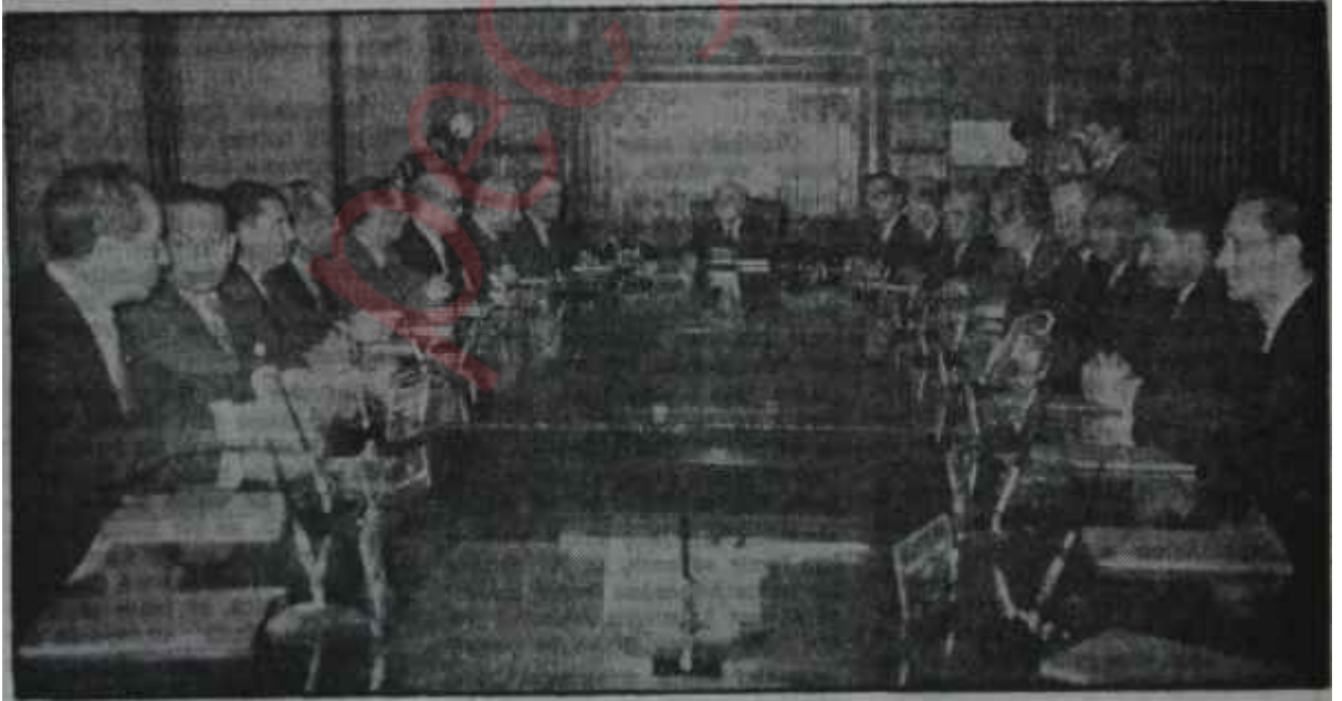
İsmet İnönü toplantı halinde

"— Tabii, o çıkıncaya kadar bizim canımız çıkmazsa!.."