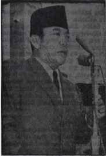
Soekarno Dikenleri çikaran adam

Onbeş yıl sonra, 1553 de, yine Hind sultanlarının yardımına koşan Seydi Ali Reis'in donanması korkunç bir fırtınanın önünde sürüklenerek Gucerat kıyılarında parçalanmıştır.