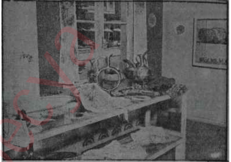
Türk El Sanatları sergisinde bir köşe

Anadolulu köylü kadının kullandığı klasik gümüş kolyeler, habbeliler, mercanlılar, halhallılar ve telkariler hemen hemen hiç bir değişikliğe tâbi tutulmamıştır ve o nisbette de güzeldir. Türk El Sanatlarını Tanıtma Derneğinin en güzel parçaları belki bakırlardır. Bakırlar Türk usulü, el işi dövme mahsulüdür. Çoğu, Hitit medeniyetinden kalma eserleri kopye etmektedir. Modeller Eti müzesinden alınmıştır. Vaktiyle rakı soğutmak için kullanılan simit şeklinde bir toprak vazodur, bakırdan dövülerek ve tek parçadan çıkartılmıştır.