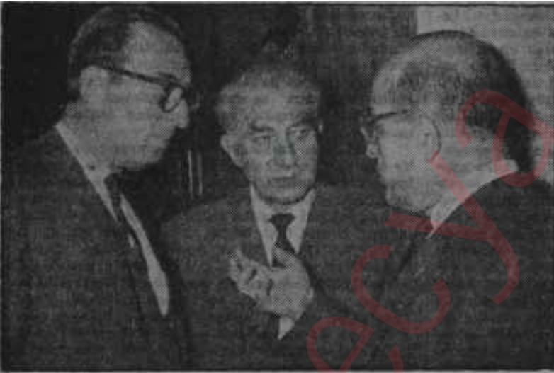
C. H. P. li ve A. P. li Bakanlar Meclis koridorlarında

Bitirdiğimiz hafta, Bakanlararası bir komite kuruldu ve Doğuya yapılacak yardımın planlanması işine süratle geçildi. Bir yandan da, elde mevcut imkânlar kullanılıyor ve yardım yapılıyor. Ancak, ortada bir fasit daire vardı. Mesela, tohumluk buğday azdı. Halbuki, tohumluk buğdaya büyük ihtiyaç hissediliyordu. Dağıtılan tohumlukları ise köylünün bir kısmı -bazen zaruretten, bazen tamahtan- satıyordu. Geniş imkânlar mevcut olsa, dert bu kadar büyük olmayacaktı. Ama, im-