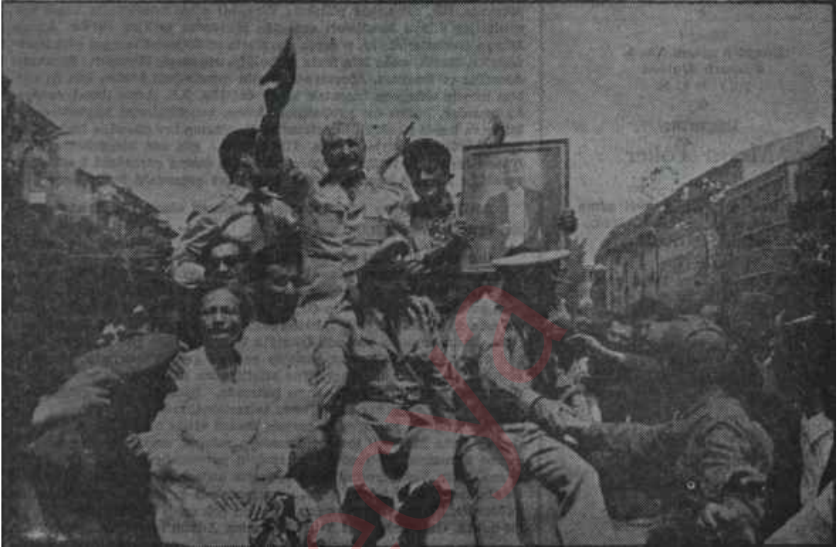
Ankara sokaklarında 27 Mayıs kutlanıyor Ah gafiller, bir bayram bu kadar çabuk unutulabilir mi, hiç?