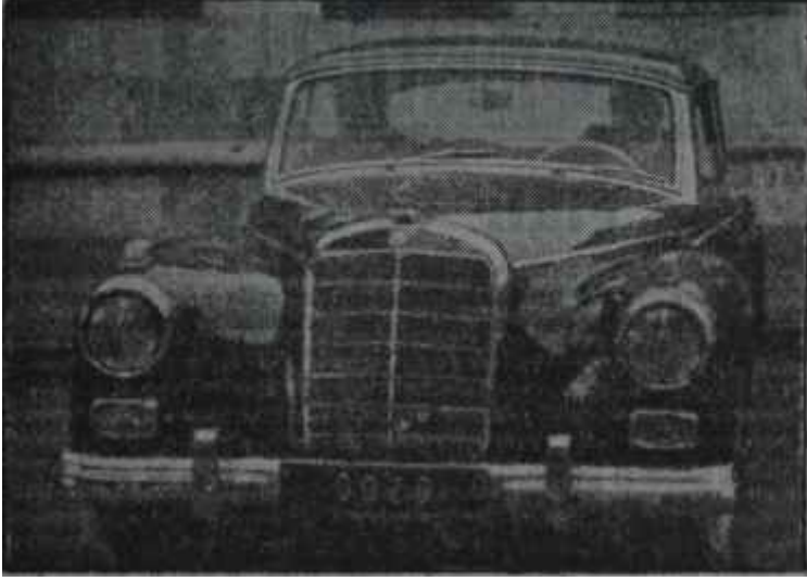
Bayındırlık Bakanının Mercedes'i