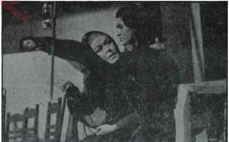
"Bernarda Alba'nın Evi"