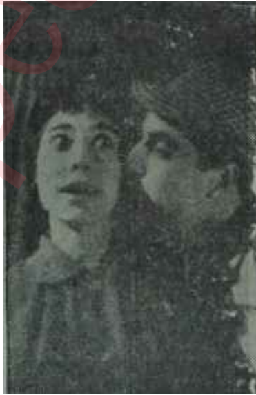
"Ay Mavidir" Niçin olmasın?.