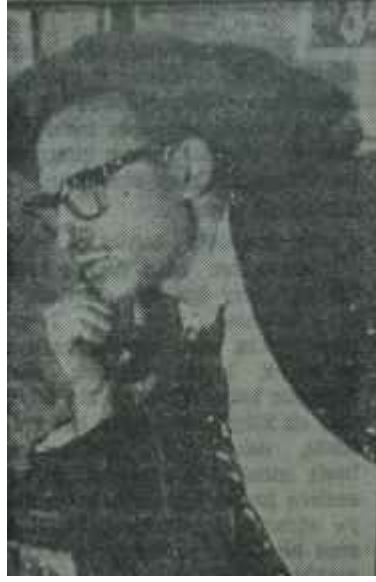
"Dolap"ta Çetin Köroğlu "Tuzak"ta tuzak..

Mihverleri üzerinde dönen panolarıyla kah içi, kâh dışı kolayca aksettirilen konak, bir lokal ışık altında ve kuyunun yanbaşında, sembolik bir şekilde canlandırılan kuyunun altından geçen su yolu, mahalle afacanlarının kopardıkları fırtınalarla sonbahar yaprakları gibi titreyen, ha yıkıldı ha yıkılacak korkusunu veren Aktarın dükkânı, karın ağrısından yeri göğü inleten Karakolukçunun öfkesiyle sarsılan -ve dağılmıyan- karakol, seyirciye eski İstanbulu veremiyor belki. Ama genç kuşakların dekoru, eşyayı bile canlı -nerdeyse dile gelecek- komedi unsuru halinde kullanan yeni sanat anlayışını, bu anlayışın taze buluşlarla süslediği modern bir Musahipzadeyi tanıtıyor. Aynı zamanda eski