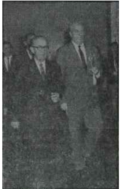
Gümüşpala İnönüye gidiyor

Zira C.H.P. içinde bir kulis, günlerdir başlamışta. Tek müstağni İsmail Rüştü Aksaldı. Bu yüzden o, kabineye tek Başbakan Yardımcısının girmesi kararlaştırıldığında adeta bayram etti. Buna mukabil, parti isinde su başı sayılacak mevkide kim varsa, İdeal Bakanın kendisi olduğa hususunda şaşmaz inanca sahip görünüyordu. Bir, Eski Takım vardı. Bunların isminden tarafsız umumi efkar cidden bıkmış olduğundan ve C.H.P. de yeni bir ruh aradığından Basın topyekün aleyhlerinde vaziyet aldı. Nitekim bizzat C.H.P. içinde "Allah aşkına, güneş altında gençlere de bir yer!" feryadı yükseldi. Bunun yanında partiçi kombinezonlar çeşitli kuvvet gruplarından müteşekkil bir karma ekip formülü üzerinde düğümlendi. Halbuki, memleket iş görecektir, dinamik, kafasında sağlam ve yirminci asrın ikinci yarısına uy-