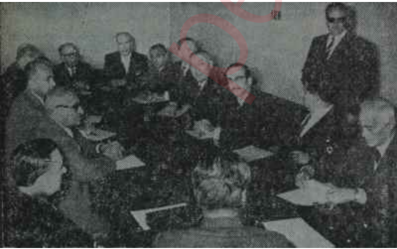
A.P. Genel İdare Kurulu karar için toplantı halinde