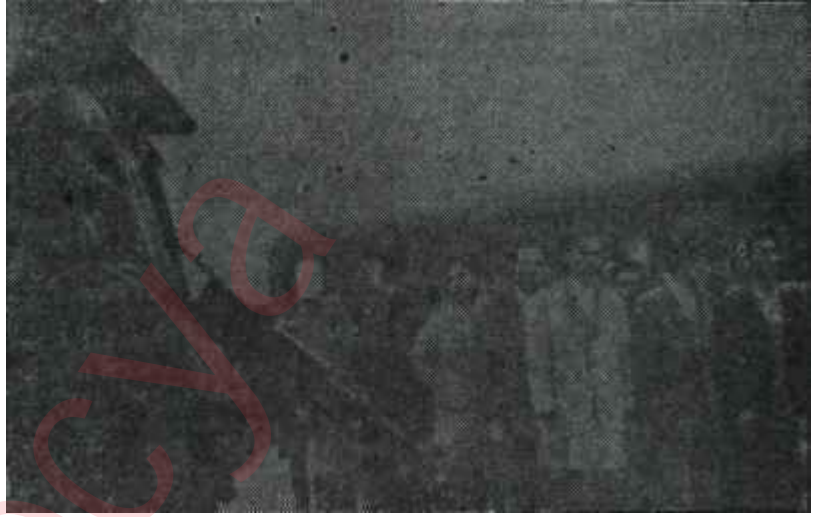
Fransız anavatanında Cezayirliler Kanı kan temizlerse...

Şimdi Güvenlik Konseyinde cereyan eden konuşmalardan ve bilhassa Leopoldville hükümeti temsilcisinin isteklerinden durum hakkında biraz daha bilgi edinilmesi mümkün olmuştur. Evvelâ merkez hükümetin yalnız Çombe ile değil, fakat aynı zamanda son günlerde bir dargınlık çıkaran Gizenga ile de uğraşmak zorunda olduğu anlaşılmaktadır. Diğer taraftan, Çombenin askeri kuvvetleri zayıfla-