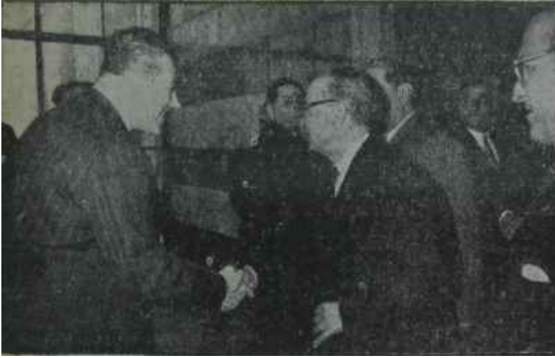
Gümüşpala Meclis koridorunda C.H.P. li Satırla