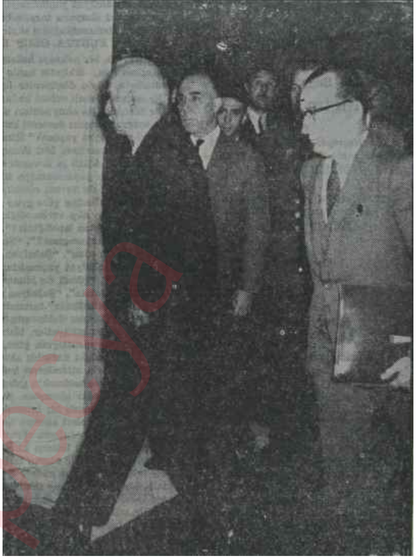
İsmet İnönü Başbakanlıktaki dairesine giriyor

Ancak, bir hükümet, mutlaka, başındaki şahsiyetin karakterini taşır. Menderes hükümetleri Bakanlarının davranışları Menderesin devlet ve hükümet anlayışının, bilhassa onları itmek istediği istikametlerin birinci derecede neticesi olmuştur. İhtilâlden sonra Başbakanlık kasasından Bakanlara ait ve hiç iftihar sebebi teşkil etmeyen hususları havi dosyaların çıkmış olması geçmiş devrin tipik karakterini ortaya koymuştur. Bir İnönü kabinesinde hiç kimsenin en ufak hafifliğine müsaade edilmeyeceğini, bütün Türkiye gibi, o kabinenin her partiden üyelerinin de müdrük oldukları muhakkaktır. Bunun yanında, içine girdiğimiz rejimi