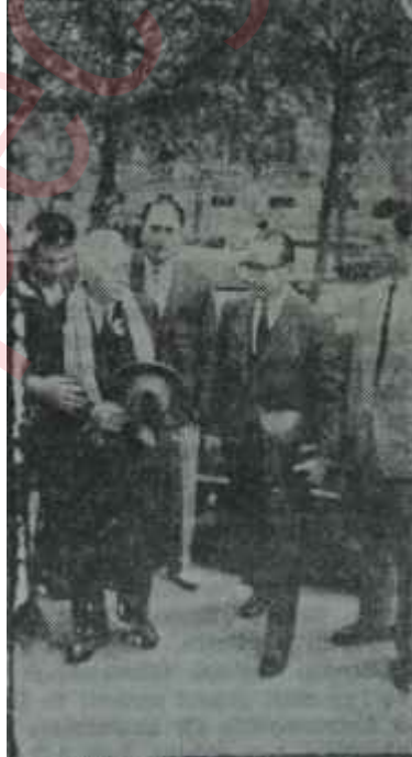
İnönü Başbakanlığa geliyor Ümit kapısı

Bu sırada ümitsizlik ve hayal sukutu, Y.T.P. lilerde, bilhassa onun, taktik kullanmış "aydın kafa"larındaydı. Bunlar bütün hesaplarını A.P. nin C.H.P., C.H.P. nin A.P. ile uyuşamayacağı esası üzerine bina etmişlerdi. Be o zaman, işte, Başbakanlık kendi ufacak partilerine ve onun liderine düşecekti! Y.T.P. liler, bilhassa krizin en ileri günlerinde