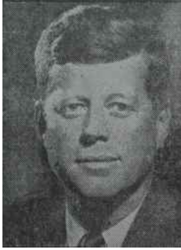
Başkan Kennedy İlâç elinde

Türk milletinin, 1945 te seçtiği sistem içinde yaşamaya azimli olduğu ve bunun için elinden geleni yaptığı, idarecilerinin son gayretleriyle sabit haldedir. Türk Silâhlı Kuvvetleri, bütünü itibarıyla, bu gayretlerin desteğidir. Ama rejimin, çeşitli tehlikeler içinde bulunduğu bir gerçektir. Sistemin temel taşı, ekonomik durumdur. Memleketin idaresini eline alan Koalisyon, en kısa zamanda bu halkın iktisadi sıkıntılarını çare bulamazsa, milletin her şeye rağmen Demokrasiye karşı muha-