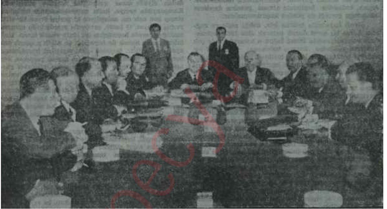
A.P. ve C.H.P. heyetleri koalisyon için yaptıkları müşterek toplantıda

bir menfi tutum olarak tefsiri tercih ettiler. Zaten seçimlerden büyük sayıda temsilciyle C.H.P. ve A.P. çıkmış bulunduğuna göre, koalisyon-da fazla kalabalığa da lüzum yoktu. Hükümet, ciddi işler yapmak için kuruluyordu, bu bakımdan dinamik ve cevval olmasında fayda vardı. Durum Başbakanlık tarafından çıkarılan bir tebliğle, heyecan içinde bekleyen umumi efkâra bildirildi ve her tarafta inanılmaz sevinç, ferahlık, neşeyle karşılandı. İnönü, haberi Cumhurbaşkanı Cemal Gürsele vermek üzere Çankaya'ya çıktı. İki parti birer müzakere heyeti tesbit edecekler ve bu heyetler akşam vak-