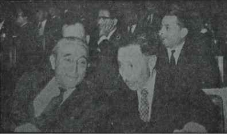
C.K.M.P. Grubu T.B.M.M. de Muhalefet grubu