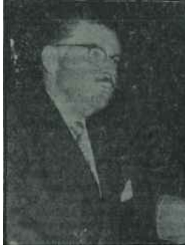
Ertuğrul Akça Fırsat ganimettir

Daha eğlencelisi, koalisyona katılan A. P. fırtınayı geçiştirmek üzereyken otobüsü kaçırın Y. T. P. de. koalisyona katılmadığı için gerçek kasırga kopuverdi.