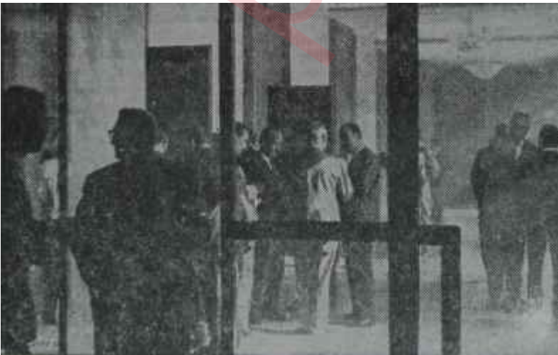
A.P. liler meşhur Grup toplantısının kulisinde

P. grubuna bu plânla gidildi. Kulise hakim hava daha az elektrikli, milletvekilleri ise uykusuzdu Belli ki gece hayli çalışmışlardı. Nitekim Apaydınlar, Gruba hayli geç geldi-