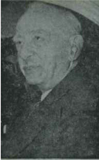
İsmet İnönü Makûs talih önünde

Bunlara rağmen İsmet İnönü, 11 Kasım günü yeni hükümetle ilgili olarak ilk temaslara Meclis binasında kendisine ayrılan dairede başladı.