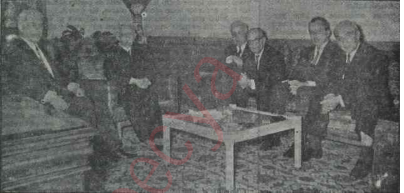
Fuat Sirmen siyasi Parti liderleriyle koalisyon konusunu görüşüyor

Sirmen, siyasi hayatının o devresine ait hücumlardan bir kısmını âdi dedikodu saymakta ve onların hatırlanmasından hoşlanmamaktadır. Hatırlatıldığında da "Bu suali dediko-