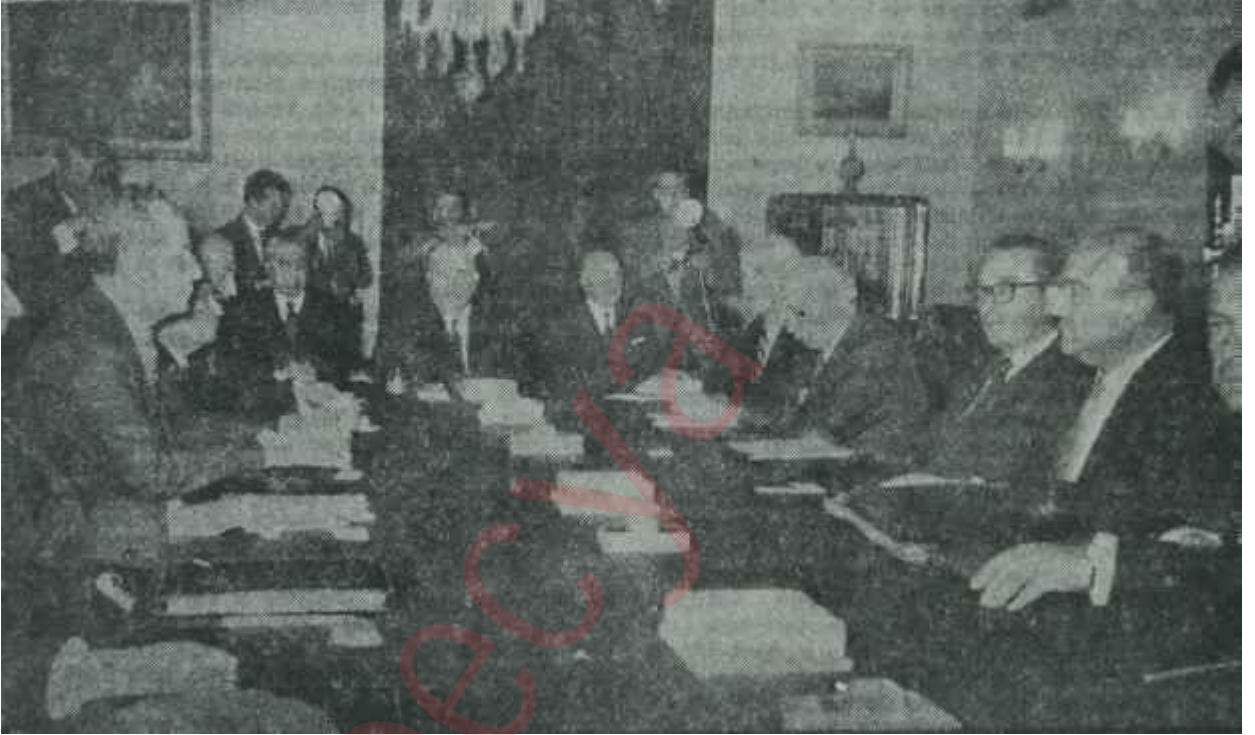
Siyasi Parti liderleri Çankaya da Gürselle birlikte bir masa etrafında

Doğrusu istenilirse, İsmet İnönünün iki 11 Kasımdan hangisinde aldığı yükün daha ağır olduğu düşünülecek bir meseledir. Eğer bu yükler kendisine tevdi edilirken tanınan hareket serbestisi nisbeti göz önünde tutulursa, üstelik aradan geçen 23 yılın o orta boylu, sağlam yapılı adamın yaşına tam 23 yaş eklediği hesap edilirse şu anda İsmet İnönünün durumu kolaylıkla anlaşılır ve mesuliyet duygusuna sahip pek az kimsenin gıptasını çeker. Bugün