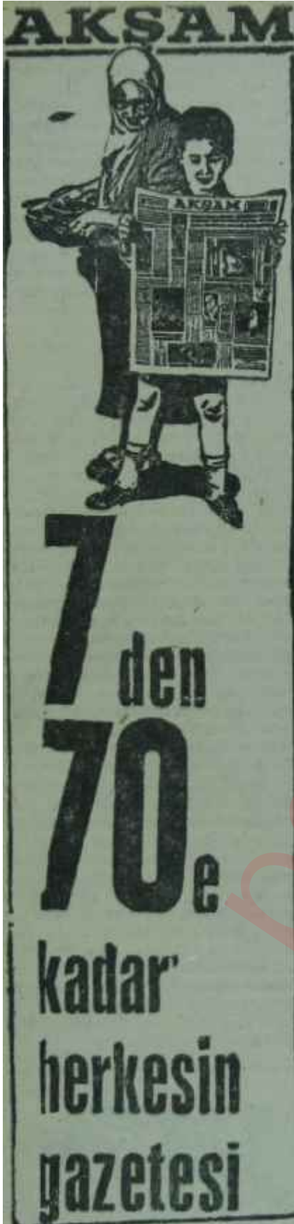
AKİS - Reklam -246