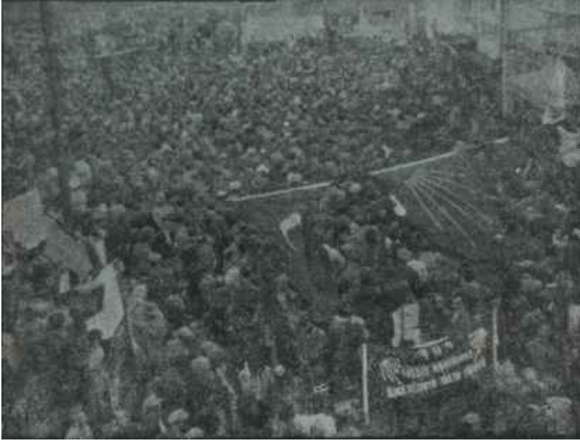
C. H. P. liler bir mitingte Kimin peşinden gidecekler ?

yapacaktı. Fakat seçim sonrasında ilk günleri, o sırada yaptığı bir basın toplantısında belirttiği gibi ihtiyar liderin iradesini çelikleştirdi. Mücadeleyi iyi niyetle, hattâ sevinçle aldı. Memlekete selâmet getirecek her hal çaresine rıza göstereceğini peşinen ilân etti ve partisiyle birlikte bekledi. Ama şartlar, C.H.P. Genel Başkanı İnönüye değil, Malatya milletvekili İsmet İnönüye memleketin şiddetle, acilen muhtaç olduğunu gösterdi.