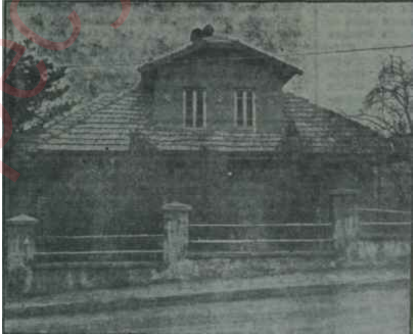
Y.T.P. Genel Merkez binası

cek bir saatte kalktı. Gece hem yorulmuş, hem de uykusuz kalmıştı. Buna rağmen neşesi yerindeydi. Başkent o sabah bahar günlerinden birini daha yaşıyordu. Küçükesattaki evinden Parti Merkezine kadar yürümeyi tercih etti. Üzerine mavi çizgili bir elbise giydi. Kravatını itinayla bağladı ve Y.T.P. Genel Merkezinin