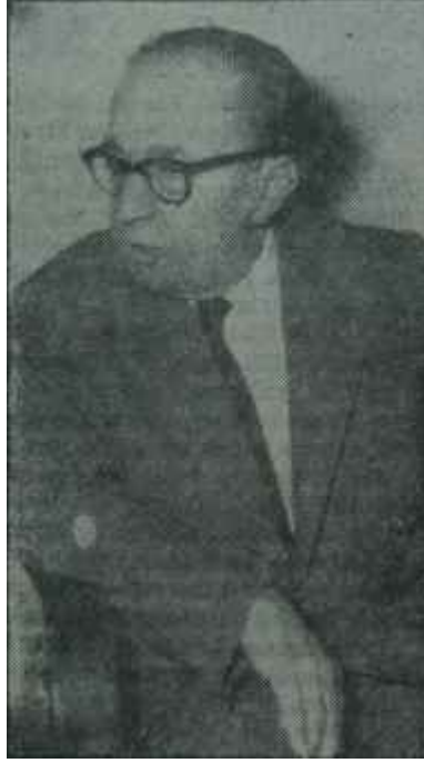
Ragıp Gümüşpala Tahravalli üstünde

Sabah gelip çıktığında, senatörlükler 100 ü bulmuş, milletvekillikleri 250 nin üstüne fırlamıştı. O zaman, selahiyetliler daha ciddi meselelerin üzerine eğilmek lüzumunu hissettiler. Memleket idare edilecekti. Bir kabine kurmak gerekiyordu. Hü-