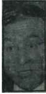
Kasım Gülek : Devlet Başkanı dırlar. Emrettiler gittim.