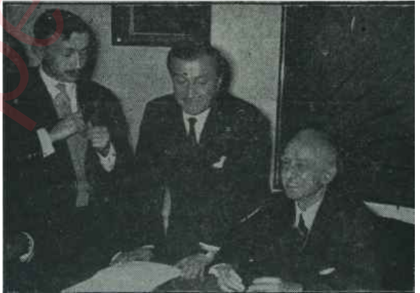
İsmet İnönü basın toplantısında konuşuyor

İnönünün. partisinin mücadeleye devam edeceği, fakat bir Milli Koalisyonla da, başka çare kalmazsa gi-