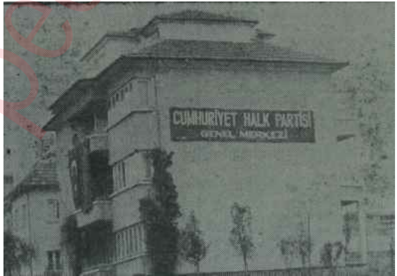
C.H.P. Genel Merkezi

Ancak, C.H.P. içinde, öyle demedi- ği pek âlâ bilinen kimseler "Ben demedim 'mi" diye ortaya çıkmak fırsatım kaçırmadılar. Adanada se- natörlükleri alacağım, 12 milletve- kilinin ise asgari 8 ini kazanacağını ilan eden eski Genel Sekreter bile senatörlüklerin hepsini kaybettikten