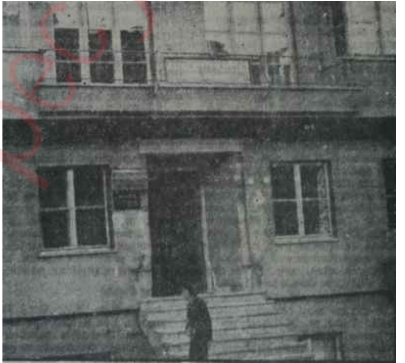
A.P. Genel Merkezi İspanyada şato

Osmanın üzerinde söz söylemek istemediği konu, Y. T. P. ile A. P. nin