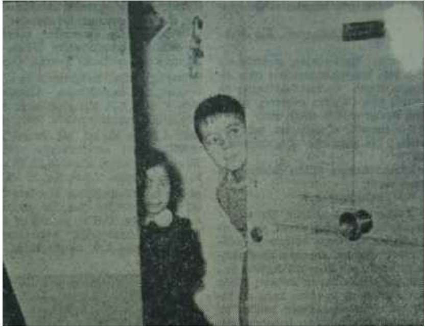
Tunçkanatın açık kapısı ve çocukları Her gelişin bir gidişi vardır

Senatör Gürsoytrakla, Yarbay Gürsoytrak arasında büyük bir fark olmayacaktır. Genç Havacı Yarbay, Senatör olarak, İhtilâle inanmış bir insanın rahatlığıyla hareket edecek-