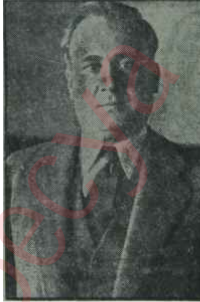
Nadir Nadi Uyarıcı

Nadir Nadi "Uyarmalar"ı üç bölüme ayırmış. Birinci bölüm, D. P. nin iktidara gelip ilk icraat örneklerini vermeğe başladığı günlerde yazılmış yazılarla başlayıp, 1954'e kadar uzanmaktadır. Nadir Nadi bu devrede bazan tatlı, bazan uyarıcı ve sertçe bir dille, tecrübesiz D.P. iktidarına doğru yolu göstermeğe çalışmakta, bu parti iktidarının sağa sola kaymasını önlemek için gayret sarfetmektedir. Kitabının bu ilk bölümüne Nadir Nadi "İlk Uyarmalar" adını takmıştır. 1954'den sonra yazdığı yazılara Nadir Nadi "Akıntıya Kürek" adını vermiştir. Tâ 1958'e kadar, Türk milletiyle beraber, Nadir Nadi de Cumhuriyet gazetesinin başyazı sütununda akıntıya kürek çekmiştir. D. P. iktidarının başındakile-