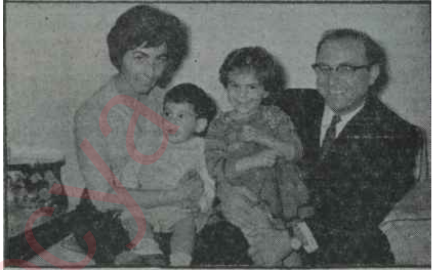
Kurdaş ailesi evlerinde

Mersinli ailesi, 15 Ekim seçimlerine büyük bir sevinç içinde girmektedir. Meşrutiyet caddesinde, 4 numaralı apartmanın 8 numaralı dairelerinde eski hayatlarını yaşamağa devam edecek olan Mersinliler için Bakanlıktan ayrılmak bir iç ezildiği husele getirmeyecektir. Zira yakışıklı ve kabiliyetli mühendis bunu çok evvelden ailesine bildirmiş ve vazifesi-