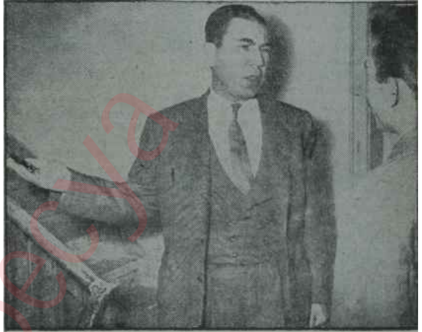
Sezai Okan evinin kapısı önünde

Bütün bunlara rağmen genç Generali yalandan tanıyanlar hareketlerinde fazla değişiklik görmemektedirler. Yakınlarıyla şakalaşmaktan geri kalmamaktadır. Kendisiyle bir şakalaşma vesilesi, 30 Ağustosta General olduğundan beri sırtından Üniformasını çıkarmamasıdır. Arkadaşlarının merakı, bunu, gece yatarken çıkarıp çıkarmadığıdır.