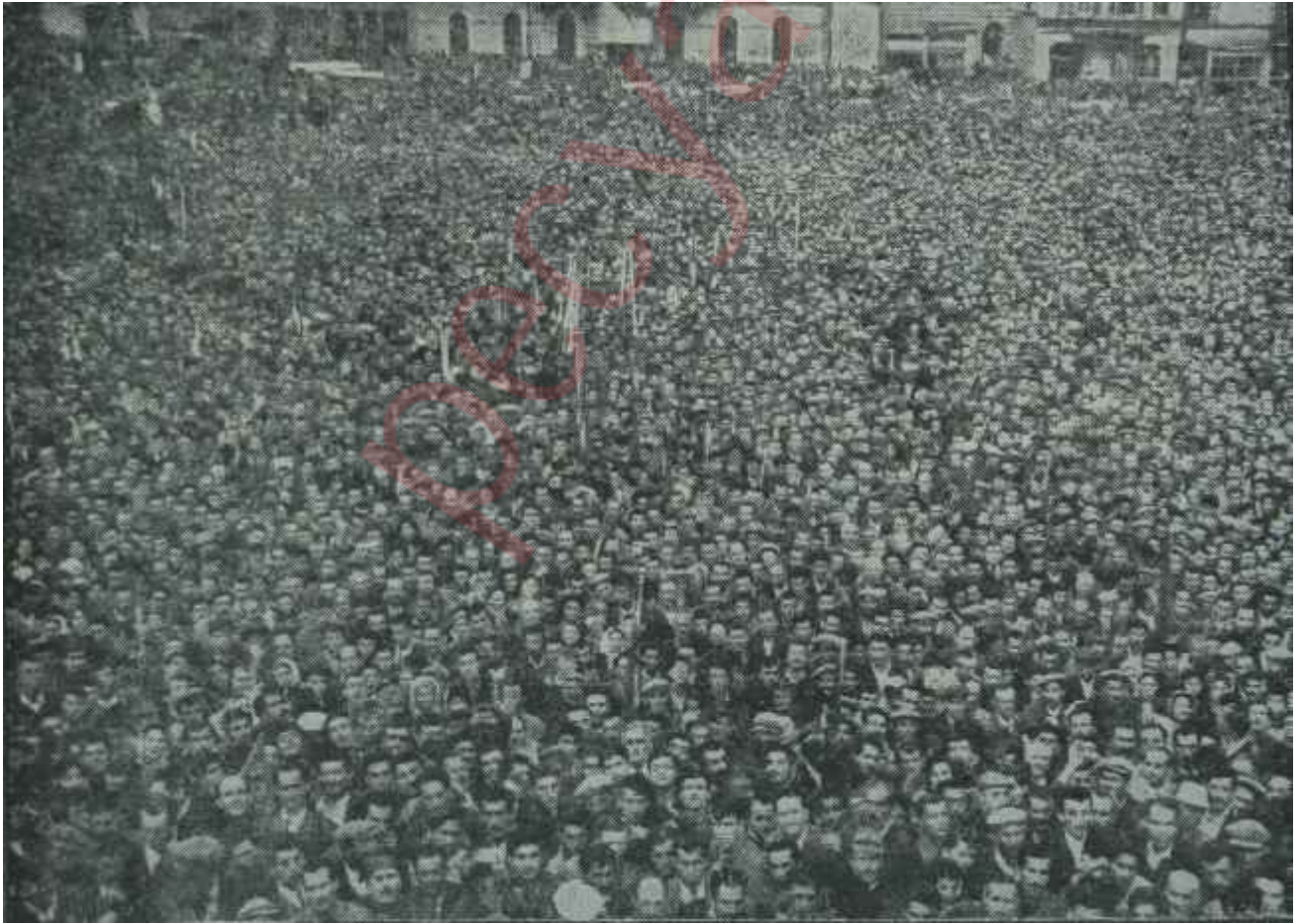
İstanbulda yağmur altında İsmet İnönüyü dinleyen muazzam kalabalık

İnönünün, bitirdiğimiz haftanın son iki gününde İzmir ve İstanbula yaptığı seyahat bir nevi "1961 Seçim Kampanyasının neticesini alma" seyahati oldu. Büyük kütlelerin harekete geçmediği bu kampanya, İzmirde ve İstanbulda büyük kütlelerin C. H. P. Genel Başkanına sevgi göstermek üzere harekete geçmeleriyle kapandı. Hadiseye, gene İnönü İstanbulda doğru teşhis koydu: Koparılan bunca gürültü, atılan bu kadar nara arasında C. H. P. nin hislerine hâkim