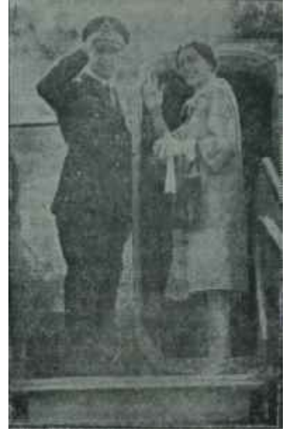
Şah ve Diba Yeşilköyde Modern aile

Dünyanın en popüler kadınlarından biri olan İmparatoriçe, cezbettiği alâka bakımından kocası Şehinşahu gölgede bıraktı. Bütün gazeteciler, karşılayıcılar ve halkın dikkati onun üzerine toplanmıştı. Hele Milli Marşlar dinlenirken, foto muhabirleri resim almak için burnunun dibine ka-