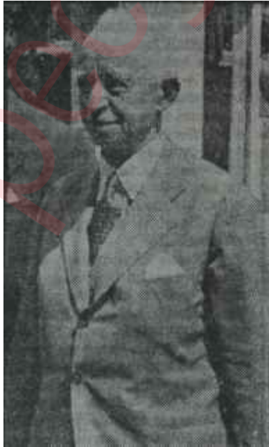
İsmet İnönü 78. lik delikanlı

A. P. aday listesi, açıklandığında, doğrusu istenirse bir hayli başın sallanmasına sebep oldu. 62 ilde teş-