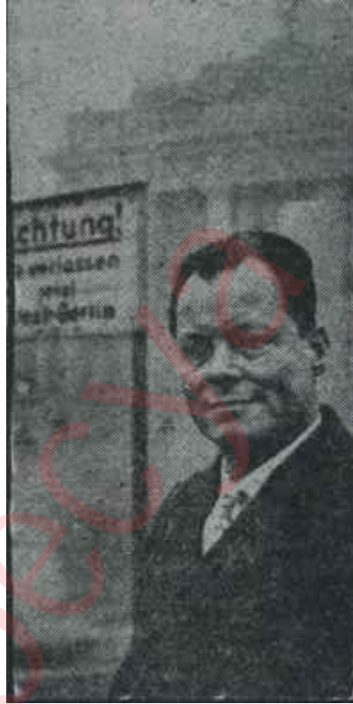
Willy Brandt Ha gayret

17 Eylül pazar günü Batı Almanya'da yapılan umumi seçimlerde, memleketi 12 yıldan beri idare eden yaşlı Şansölye Adenauer'in partisi Hıristiyan Demokratlar mutlak çoğunluğu elden kaçırdılar. Adenauer'in partisi bundan evvelki 1957 seçimlerinde 270 milletvekilliği sağ-