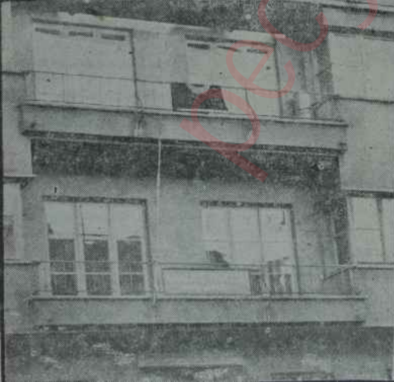
A. P. Genel Merkez Binası İç i sizi yakar, dış i bizi