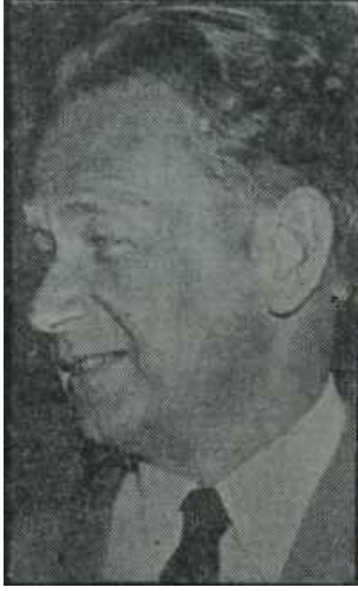
Dag Hammarskjöld Esrarengiz ölüm,

Hammarskjöld'un Kuzey Rodezyada beklendiği Ndola hava alanında, şafak sökerken projektörler söndü. Dünyanın dört yanına haberler ulaştı: Milletlerarası teşkilâtın 1 no'lu adamı kaybolmuştu! Zihinlerde derhal bir paralel hâsil oldu: Hemen