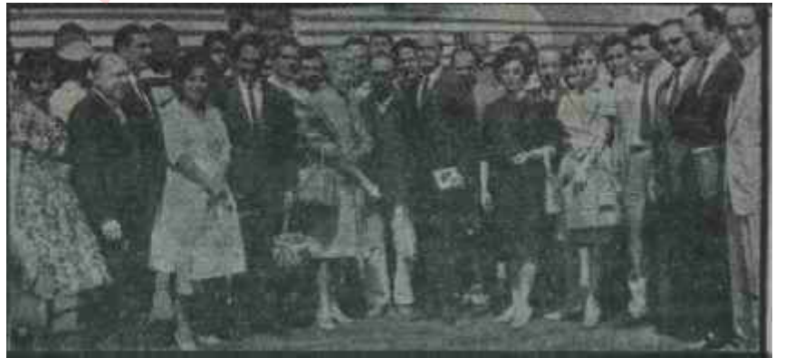
Sanatçılar "Atina yolculuğuna çıkarken

Ankara Radyosu Yassıada kararlarını açıklar ve müvezziler Atina gazetelerinin bu kararlarla ilgili ikinci baskılarını koştururlarken, Rex Tiyatrosunun boş salonu önünde "Kral Oidipus"un umumi son provası yapılıyordu. Bu prova temsilden farksızdı. Bazı meraklılar -ki bunların, arasında bugün hepsi Atinaya gelmiş olan Türk gazetecileri ve "Midasın Kulakları" yazarı da vardı- temsili ilgiyle tâkibettiler. Prova bitin-