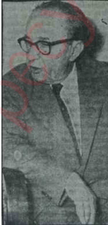
Ragıp Gümüşpala Tahterevallide bir adam