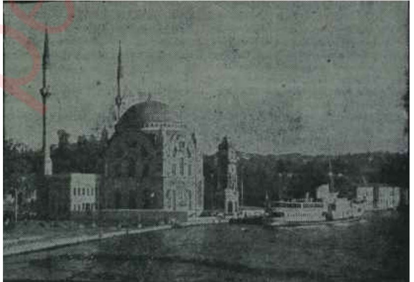
M. B. K. Yassıada İrtibat Bürosu

Ölüm cezalarının infazında, mevzuat gereğince Yüksek Adalet Divanı üyeleri ve Başkâtibi ile Egesel ve Yardımcıları -idam mahkûmu yerine bir başkasının asılmasına mahal vermemek için-, bir doktor -infaza sıhhi bir mâni olup olmadığımı kontrol