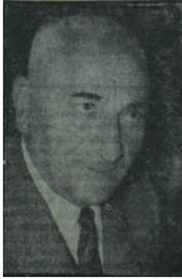
Cemal Gürsel İmtihan saati

Hikâye, Çankaya Köşkünden plakasız şâhâne bir Cadillac'ın yola çıkmasıyla başladı. Cadillac'ın arkasında, sağ taraftaki camdan dışarıyı seyretmekte olan, gri fötrü sol kaşı üzerine yıkık, ince' çizgili lâcivert elbiseli General, biraz düşünceli görünüyordu. Saat 18'e yaklaşiyor, gün yavaş yavaş kararıyordu. Şâhâne Cadillac Çankaya yokuşunu ağır ağır indi. Otomobilin arka -sağında oturan General başkent sokaklarında dolaşan vatandaşları düşünceli gözlerle seyrediyor, gelene geçene dikkatle bakıyordu. Sanki bir şeyler anlamak istiyordu. Cadillac Kavaklıdere'den aşağıya kayıp Kızılay -yeni adıyla Hürriyet- meydanına gelince, biraz daha yavaşladı. Babacan tavırlı General, kalabalık bulvarı tetkike koyuldu. Otomobil, yoluna devam ediyordu Bulvarda her günkün-