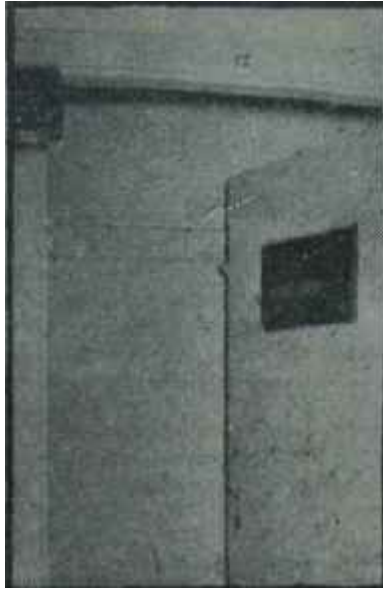
A. P. nin kapısı Giren pişman

Aslında Menderesle alâkalı teşebbüs, ilk teşebbüs olmaktan uzaktı. M.B.K. Başkanı ve üyeleri, hem Gümüşpalanın gibi A.P. ye aktarılmış eski D.P. lilere mavi boncuk dağıtma gayesi değil, milli menfaat konusunda bir görüşü ifade eden ciddi bir teşebbüsle daha karşılaşmışlar, onun üzerinde önemle durmuşlardı. Aralarında yaptıkları görüşmeler, milli menfaat konusundaki görüşlerinin bu görüşe uymaması neticesi bilinen istikamette gelişmişti. Nitekim, daha Yüksek Adalet Divanı hükümlerinin açıklandığı saatte Menderesi âkibetinden kurtaracak hiç bir şey kalmamıştı. Gümüşpalanın açıklanan gayretleri, daha ziyade partiiçi mülahazaların neticesi oldu.