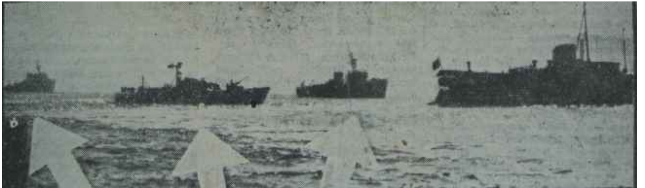
Fenerbahçe vapuru hücum botları refakatinde son seferini yapıyor Uzun bir hikâyenin sonu

Saat 15.20 idi ki spiker 438. sanık hakkındaki kararı açıkladı: Beraat! Böylece saat 10'da idamla başlayan hükümler, 50 dakikalık yemek tatili çıkarılırsa, tam dört saatte tefhim olundu.