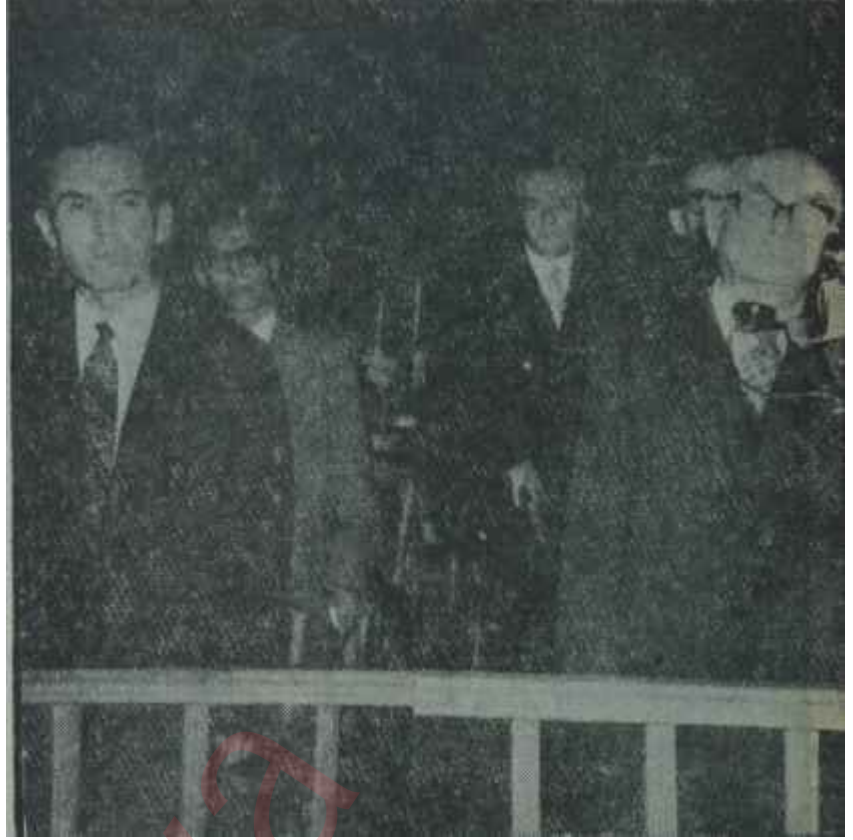
Bayar ve Polatkan idam hükmünü dinlerken

Hadisenin cereyan ettiği sıralarda İstanbulda yeni bir gün başlıyordu. Çamlıca sırtlarında doğmak üzere olan güneşin ilk pırıltıları vardı. Deniz son derece sessizdi. Muhabir bir sigara yaktı ve beklemeğe ko-