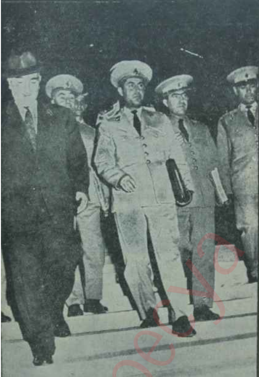
M. B. K. Üyeleri ve Gürsel toplantıdan çıkıyorlar.