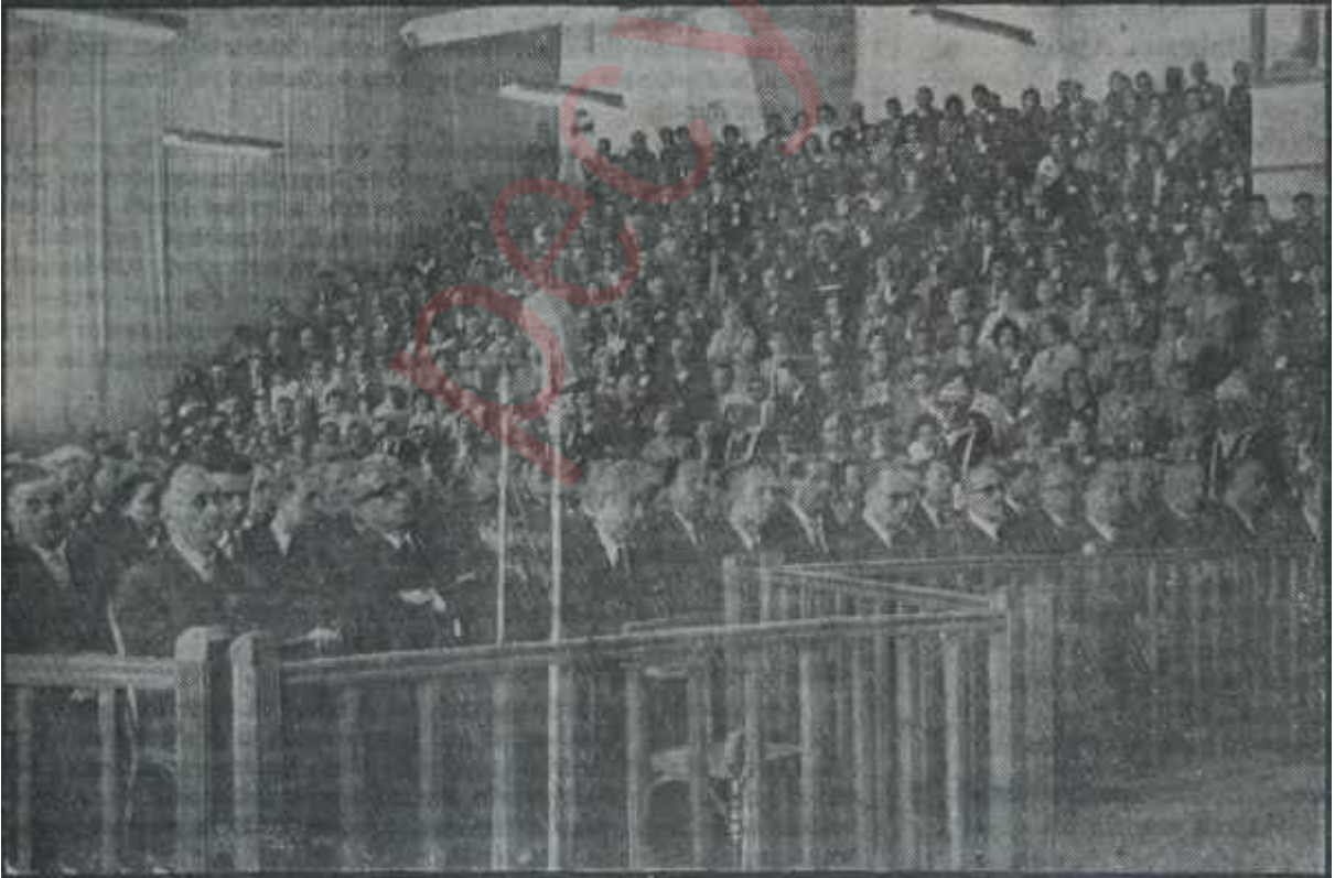
Anayasa Dâvasının suçluları Yüksek Adalet Divanı huzurunda "Bu manzarayı unutmayınız !"

Biz Türkler zaman zaman "Kabahat ölümlerinde mi, öldürmede mi?" diye sorarız. Şu anda, bu soruların herkesin ağızındaki cevabı aynıdır. Bu kahatın yanına, son yünlerin tansiyonu içinde kabahatlıların yakınlarının, paralı savunucularının, onların siyasi mirasına göz dikmiş olanların gâfletleri, dalâletleri, hatta hıyanetleri katılmıştır. Öyle davranışlara girişilmiştir ki en geniş müsamahanın sahipleri bile "yok ,bu kadarı da olmaz!" diye isyan etmişlerdir. Bunca faktöre rağmen sükûnetin, basiretin kudret sahiplerine bu nisbette hakim olmuş bulunması, anlamaya hiç kimsenin saf iyi niyetle bir türlü yanaşma