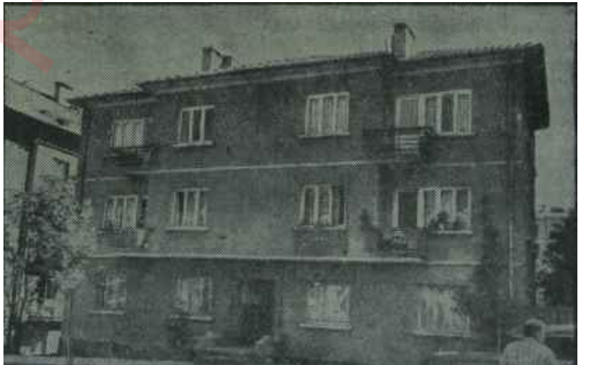
Necatibey caddesindeki Edirne apartmanı

Liderlerin Başbakanlıktan ayrılmalarından bir buçuk saat sonra Ankara Radyosu M.B.K. İrtibat Bürosunun Zorlu ile Polatkanın sabaha karşı asılmak suretiyle idam edildiklerini, ancak Menderesin, tekrar komaya girmesi dolayısıyla asılmamış olduğunu bildiren tebliğini okuyordu.