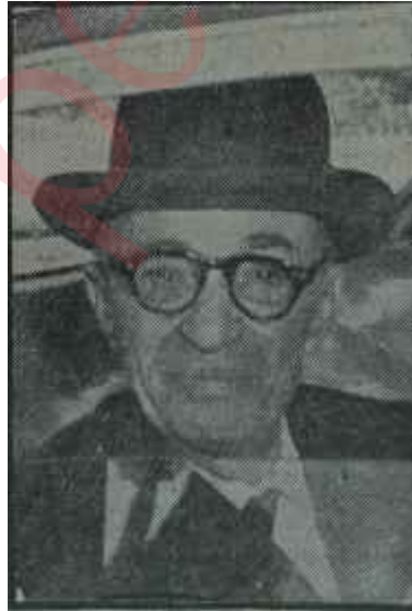
Ragıp Gümüşpala Siyah şapkalı adam

Ertesi gün C.K.M.P. tarafından yayınlanan bir bildiriye Küçüğe ateş püskürölünce, kibar Kurmay da bir açıklama yaparak, bu sözleri sarfetmediğini son derece nazik bir şekilde bildirmek zorunda kaldı. Fakat hiç bir tevill, Bölükbaşının söylediklerinin hakikaten saçma olduğu gerçeğini örtemedi ve umumi efkâr, irikiyim lider hakkında bir kere daha notunu verdi. Hele, Bölükbaşının beyanından kendi payına gocunan A.P. de yorgun savaşçısı Şinasi Osmanın ağzından bir açıklama ile C.K.M.P. ye yüklenince, işler daha da kızıştı. Osma, açıklamasında, A.P. nin tarihi vazifesini yaptığım izah ediyor ve