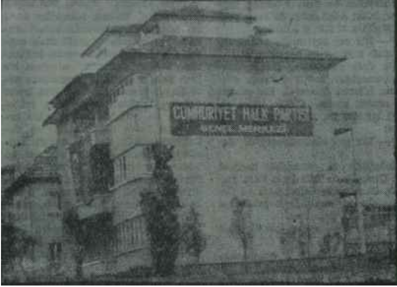
C. H. P. Genel Merkez binası

Gazeteciler, böyle bir günün sabahında iki devlet adamının beş on dakika içinde ne konuşabileceklerini merak eder ve Yıldırım - Mülâkatın esrarını çözmeye çalışırlarken bir yeni haberle karşılaşılar: Başkan Gürselin özel kaleminden, İnönünün ziyaretinden pek az evvel parti liderle-