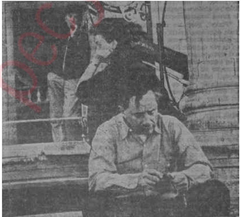
Elia, Kazan "Baby Doll - Taş Bebek'in çekimi sırasında

"Boomerang", yargıladığı bir tutuklunun suçsuzluğuna karar veren bir savcının küçük politika' Oyunlarına ve baskılatma karşılık yine de kendi fikrinden dönmeyişinin ve bunun savunmasını sonuna kadar götürdüğünün hikâyesidir. Baş rollerinde Dana Andrews ve Jane Wyatt oynamaktadırlar. Böylece Kazan, Broadway sahnelerinde "Deep Are the Roots" oyunu ile adımını attığı kavgacı plâformda Boomerang'la bir sağlam adım daha atmakta ve üçüncü ve daha ciddi adımı olan "Gentleman's Agreement-Centilmen Anlaşması"yla da gözüpek bir rejisör olduğunu ortaya koymaktadır.