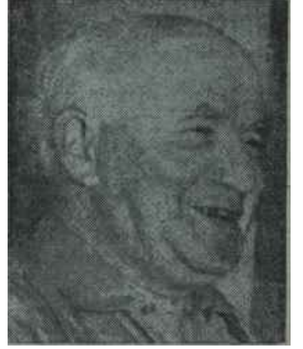
David Ben Gurion

Nüfusu iki milyonu ancak aşan bu küçük ve fakat dinamik memleketin bu kere seçimlere karşı gösterdiği nisbî alâkasızlığı dahili durumun istikrarı, harici politikada ise partiler arasında görüş farklarının hemen mevcut olmayışıyla, yâni geniş bir tâbirle İsrailinin "tuzunun kuru" olmasıyla izah edenler vardır. Bun-