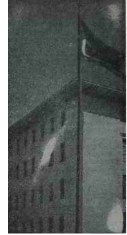
İstanbul Radyosu İstim arkadan gelir

Ankara Radyosundan daha doyurucu olduğu yıllardır kabul edilmiş olan İstanbul Radyosunun şimdi bu duruma düşmesinin sebepleri acaba nelerdir? Niçin başta İstanbul Radyosu olmak üzere bütün radyolarımızda bir kalkınma, bir kıpırdanış görülmemektedir? Niçin hâlâ radyolarda kültüre, eğitime önem verilmekte, her önüne gelen bir program hazırlıyabilmektedir? Yahut neden