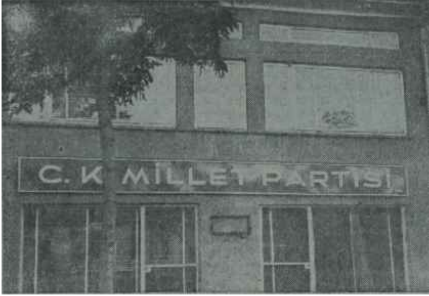
C.K.M.P. Genel Merkezi