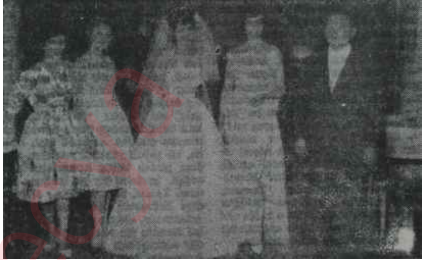
Yardımsseverler Derneğinin defilesi

Emek mukabili yardım Yardımseverlerin başlıca gayesi, işsiz iş vererek, iş öğreterek o-