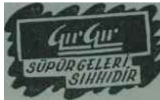
AKİS - Reklâm — 116

"On the Waterfront -Rıhtımlar; Üzerinde" de Kazan'ın başlangıç yıllarının tersine olarak, gerçeklere sırt çevirdiğinin en elle tutulur delilidir. Filmde hiç bir açıklama yoktur, alışılmış bir "iyi adam- kötü adamlar" ve genç kız hikâyesi, sözde sosyal bir problemi de birinci plâna çıkararak anlatılmaktadır. Sendikacılık, klişe ölçüler içinde gengsterlik filmlerine uydurulmuş, kötü adamı -Lee J. Cobb- döven iyi adam -Marlon Brando- Öcünü aldıktan sonra sevgilisine -Eva Marie Saint- kavuşmuş, böylece her iş de kendiliğinden halledilmiştir. Kazan, son filmleri olan "East of Eden-Cennet Yolu"nda Habil-Kabil hikâyesini günümüze uygulayıp Freud'cu bir gözle inceleme çabası gütmekte, "Baby Doll -Taş Bebek" ve "A Face in the Crowd -Kalabalıkta Bir Yüz" filmleri ise Kazan'ın eski Kazan olmaktan güne uzaklaştığını belgelemektedir.