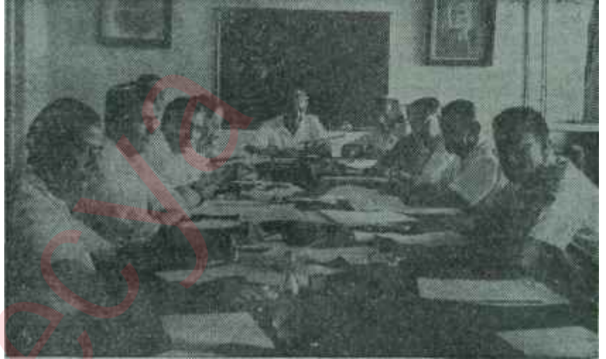
C. H. P. Merkez İdare Kurulu çalışıyor Sarı köşkün lâmbası hep yanıyor