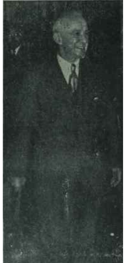
İsmet İnönü İşaret'i verecek