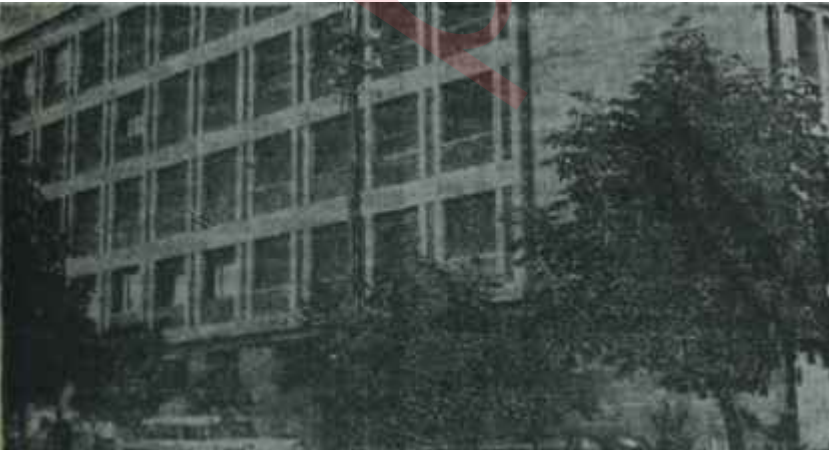
Türkiye Şeker Fabrikaları İşletmeleri Umum Müdürlüğü Fağfur kâse

Fakat meseleyi bu şekilde mütalâa etmek hiç te uygun düşmemektedir. Bir defa, tatbik edilen madde 39. maddedir ve Milli Eğitim Bakanı Tahtakılıçın Yassıadadakileri güldüren icratı basında günün konusu halindedir. Hal böyle olunca, bir çattık kaşlı Umum Müdürün dilediği gibi at oynatmasının hesabı sorulmalıdır. Sanayi Bakanı İhsan Soyakın bu hususta ilgili dairelere talimatı da mevcuttur. Fakat mesele, iyi niyetli ve kabiliyetli bir Bakanın talimat yazmasıyla bitmemektedir. Doğrusu istenirse, sakıt zihniyeti hortlatmağa çalışan bir takım kimselelerin artık hizaya getirilmesi ve hatalarının tashihi yönüne gidilmesi şarttır.