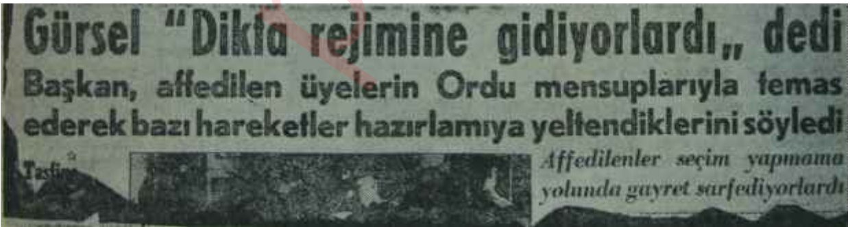
Gürselin 14'lerle ilgili beyanatını havi kupür Perhiz ve lahana turşusu

Biz de hiç konuşulmamasından vaz geçtik. Ama, ne olur yarabbi, az konuşunuz! Az konuşunuz ki şu intikal devri çok şerefli kapansın.