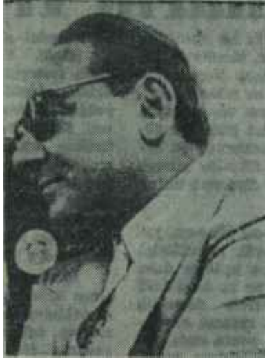
Adnan Menderes Aktörü bu...

Adamın ismi Elia Kazan'dı. Ünlü rejisör, Yassıada Duruşmalarını tâkip ediyordu. Dikkatle tâkip ettiği ve arada bir başını sallıyarak acıdığını belli ettiği adam ise, Menderes'ti. Elia Kazan, daha evvelki yıllarda gördüğü Türkiye'nin düşük Başbakanını, şimdi acıyan nazarla seyrediyordu. Ünlü rejisör, iki Menderes arasındaki korkunç farkı hayretle görmüş ve bu rolü değme aktörün kıvrımayacağına kanaat getirmişti. Keredeydi o şâşaalı devrin küstah, mütecaviz Menderesi, neredeydi şu sandalyada oturan insan yıkıntın!