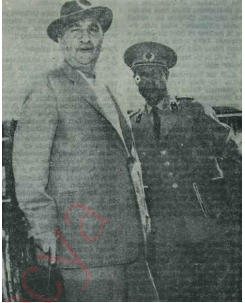
Cemal Gürsel İstanbulda Az konuşmanın fazileti

Berlin Meselesinden dolayı Üçüncü Dünya Harbinin kopması pek uzak bir ihtimalken, ihtilafın Soğuk Harp kısmına Türkiyenin aktif şekilde karışması ise daha da uzak. İmkânsız bir başka ihtimalken bunların şu sırada "yarının ismi" gibi tefîre tâbi tutulmasındaki hata gözler önündedir. Referandumdaki kırmızı oyların nisbetindeki nisbi yüksekliğin sebebinin orada ve burada arayanlar, hadisede kıymetli ipuçları bulabilirler. Talihsiz ve ihtiyatsız beyanlar, bir türlü önlenemeyen ayaküstü hasbıhaller, bu hasbıhallerde şöyle-ine sarfediliverilmiş sözler bir süredir memleketin havası üzerinde menfi tesirler yaratmaktadır. Bir Devlet Başkanının, bir Hükümet Başkanının, bir İhtilâlin başının basma Allahın her günü söyleyecek bir sözü, verilecek bir haberi bulunması imkânsızdır. Buna rağmen bir Devlet Başkanı, bir Hükümet Başkanı, bir İhtilâlin başı Allahın her günü konuşur oldu mu, sözlerinin akisleri mecburen çok çeşitli ve sık sık pek talihsiz olmaktadır. Devlet Başkanlarının, Hükümet Başkanlarının. İhtilâllerin başlarının basınla temaslarının bir nizam ve intizama tâbi tu-