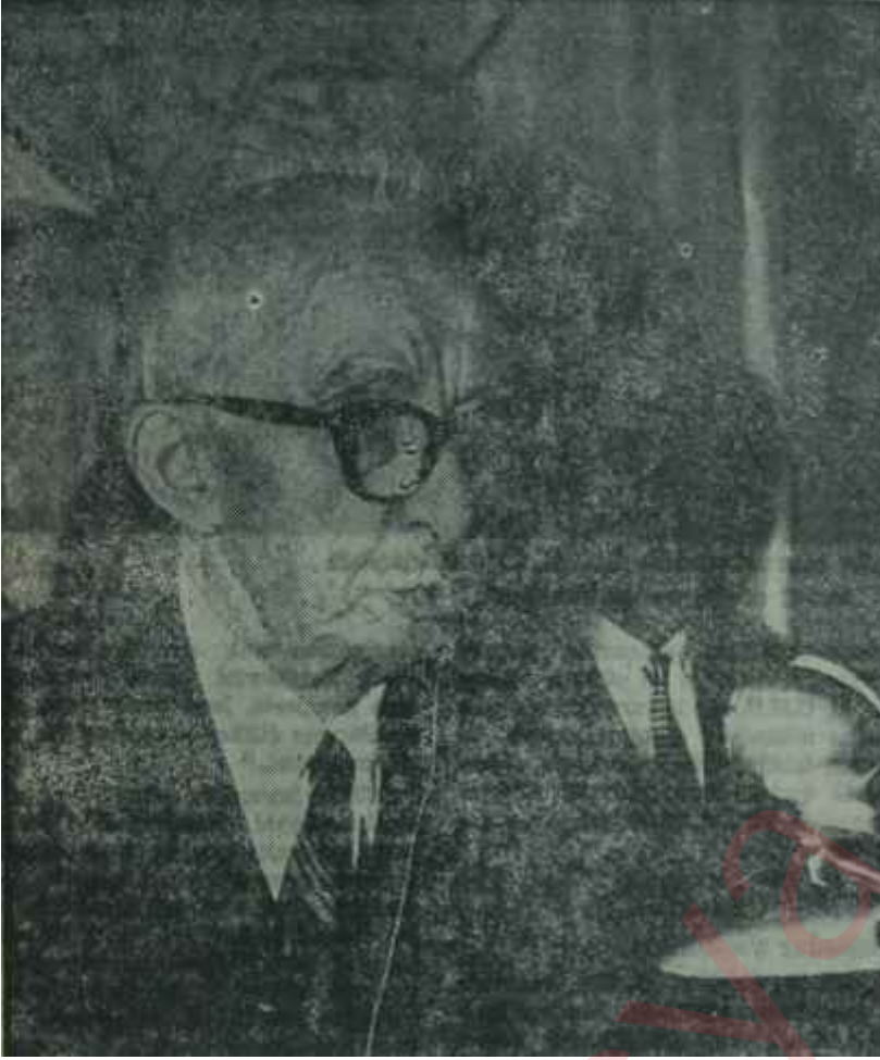
İnönü Gençlik Kurultayında konuşuyor İşareti çekti

1961 tarihleri arasındaki olayları Sembolize eden büyük bir pano mevcuttu. Atatürkün ve İnönünün büyük resimleri altıoklu bayraklarla süslenmiş, salonun iki yanına yerleştirilmişti. Duvarlarda birçok dövizle rastlanıyordu. Bantların üzerinde Atatürkün ve İnönünün vecizeleri yazılıydı. Bunların içinde en çok dikkati çeken, Gençlik Kollarının bir sloganıydı. Bantta, "Şahısların değil, ülkelerin ve ilkelerin peşindeyiz" yazılıydı. Bir başka bantta Kemal Atatürk imzalı şu sözler mevcuttu: "Müş küllerinizin halinde daima İsmet Paşaya müracaat ediniz" Salonun soluna asılmış bir başka bantta ise. "Şalisi ve oportünist politikaya paydos!.." deniliyordu.