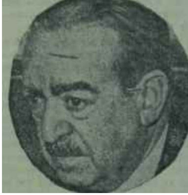
Ahmet Emin Yalman