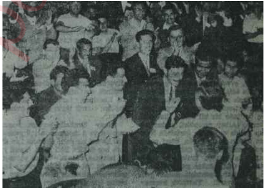
C.H.P. Gençlik Kurultayında gençler Kongrelere yol gösterdiler

Saatlerin 17'yi gösterdiği sırada delegeler oylarını kullanmağa başladılar. Kurultaya büyük ümitlerle taşınan. Anadolu illeri delegelerinin yüzlerinden memnun olmadıktan açıkça belli oluyordu. Herşey iyiydi. Herşey güzeldi. Gelgelelim Gençlik Kurultayına, hiç mi hiç istenmeyen bir hava hakim olmuş, delegelerin büyük bir kısmını ziyadesiyle üz-müştü. Gençlik dâvaları bir yana atılmıştı. Yaklaşan seçimlerde göster-