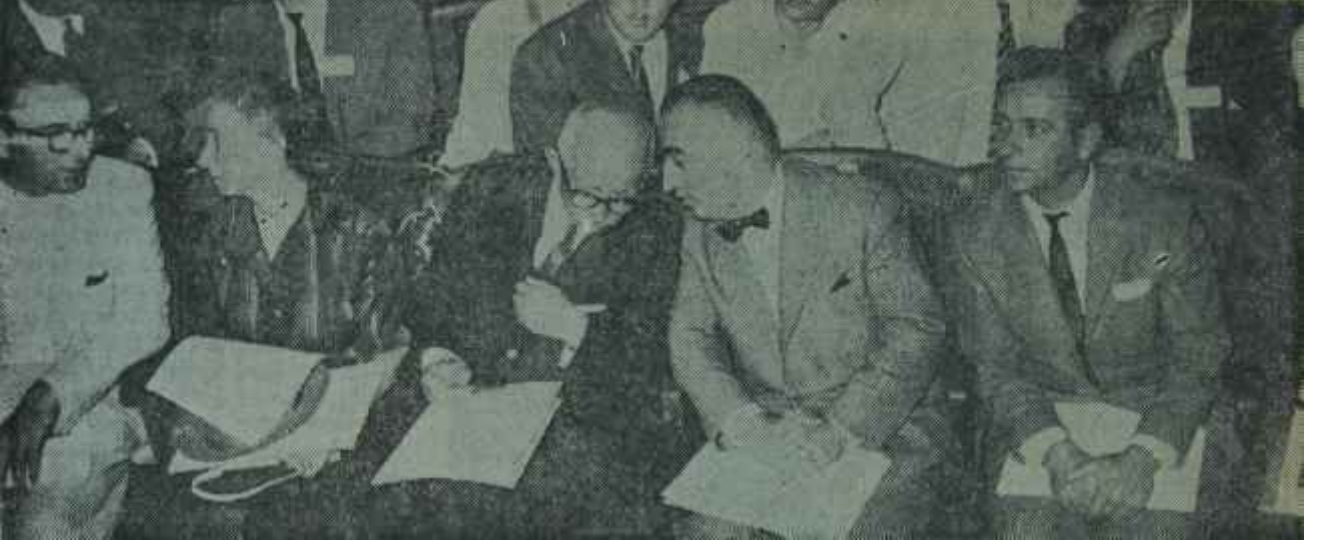
C. H. P. Gençlik Kurultayın da İnönü ve arkadaşları Mesut günün mesut insanları

sinin şu veya bu şekilde 14'lerden bir yakın arkadaşı bulunmakta, beraberce geçirilen günlerin hatıraları zaman zaman gözleri yaşartmaktadır. Ama ortadaki gerçek, bütün bunları bir kenara koymak lâzımgeldiğini göstermektedir. 13 Kasım günü Devlet ve Hükümet Başkanının tebliğiyle feshedilen M.B.K. nin 23 kişiden ibaret bugünkü üyeleri, müşterek sorumluluk yüklenmişler ve durumu kabul etmişlerdir. Hisler bir yana, gerçeklerin göz önüne alınması ve ona göre hareket edilmesi gerekmektedir. Komitede bir kısım üyenin bu mesele hakkındaki fikri, ortaya atılanların tamamen aksidir. 14'ler hâdisesine kapanmış gözüyle bakan bu üyelerin yanı sıra, diğer düşüncelerin şahsi görüşler olarak kabul edilmesi zarureti mevcuttur. Nitekim hâdiseler, durumun bu olduğunu açıkça ortaya koymuş ve aslında yazılmaması gereken sözlerin ortaya çıkardığı patırtı bitirdiğimiz haftanın sonlarında kendiliğinden kapanmıştır.