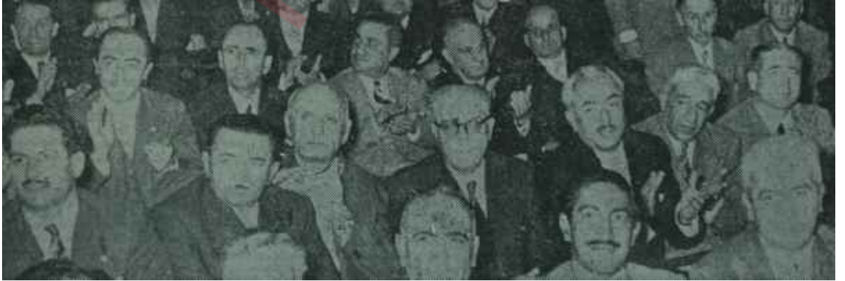
Alkış tutan sabık D.P.Meclis grubu üyeleri Gün ola, harman ola

Menderes, sırta geçirilen bir kudret hırkasının insanı ne yaptığını, 400 milletvekili ise bir kudret hırkasının karşısında insanların ne bale gelebileceğinin âdeta elle çizilmiş resmidir. Şimdi, kelle kurtarma çabasında iki tarafın birbirini suçlaması, ya da temiz niyetlerinin delili olarak ötekinin sünepeğini göstermeye kalkışması ise şark topluluklarının dışa vurmuş bir iç hastalığından ibarettir.