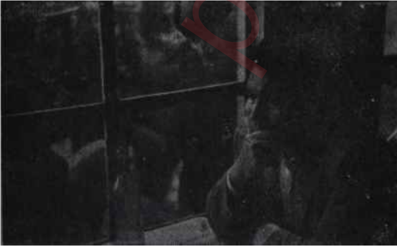
Yaşar Kemâl kahvehanede Boş gezenin dolu kalfası

Yaşar Kemâl, bu arada artık memleketinin meseleleriyle de yakından ilgileniyordu. Kadırlî bir pamuk memleketiydi. Bu kasabada çeltik tarımı yapıyordu ve bu yüzden her yıl binlerce çocuk sıtmadan ölüyordu. Yaşar Kemal ve arkadaşları toprak ağalarıyla bu konuda kıyasıya bir savaşa girişmişlerdi. Ayrıca toprak reformunun da savunucuları arasındaydı. Toprak ağalarının büyük