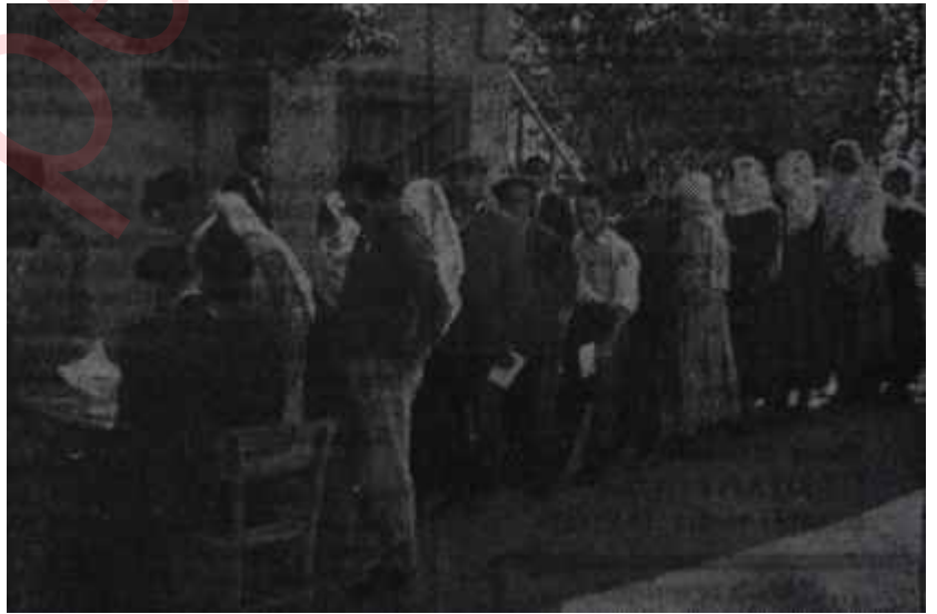
Referandum günü oy kullananlar

Haftanın başında, hiç beklenilmeyen sayıda kırmızı oy sandıklarından çıktığında esen şaşkınlık havası içinde bu, bir çok sebebe bağlandı. Sebeplerin başında, "Vatandaş kandırıldı" geliyordu. Eski Demokratlar, bin propagandayla büyük bir kütlenin basiretini bağlamışlar ve onların kırmızı oy kullanmalarını sağlamışlardı! Bir defa bu peşin hükümle harekete geçilince, tefsirler tahminleri, tahminler hikâyeleri, hikâyeler masalları takip etti. Efen-