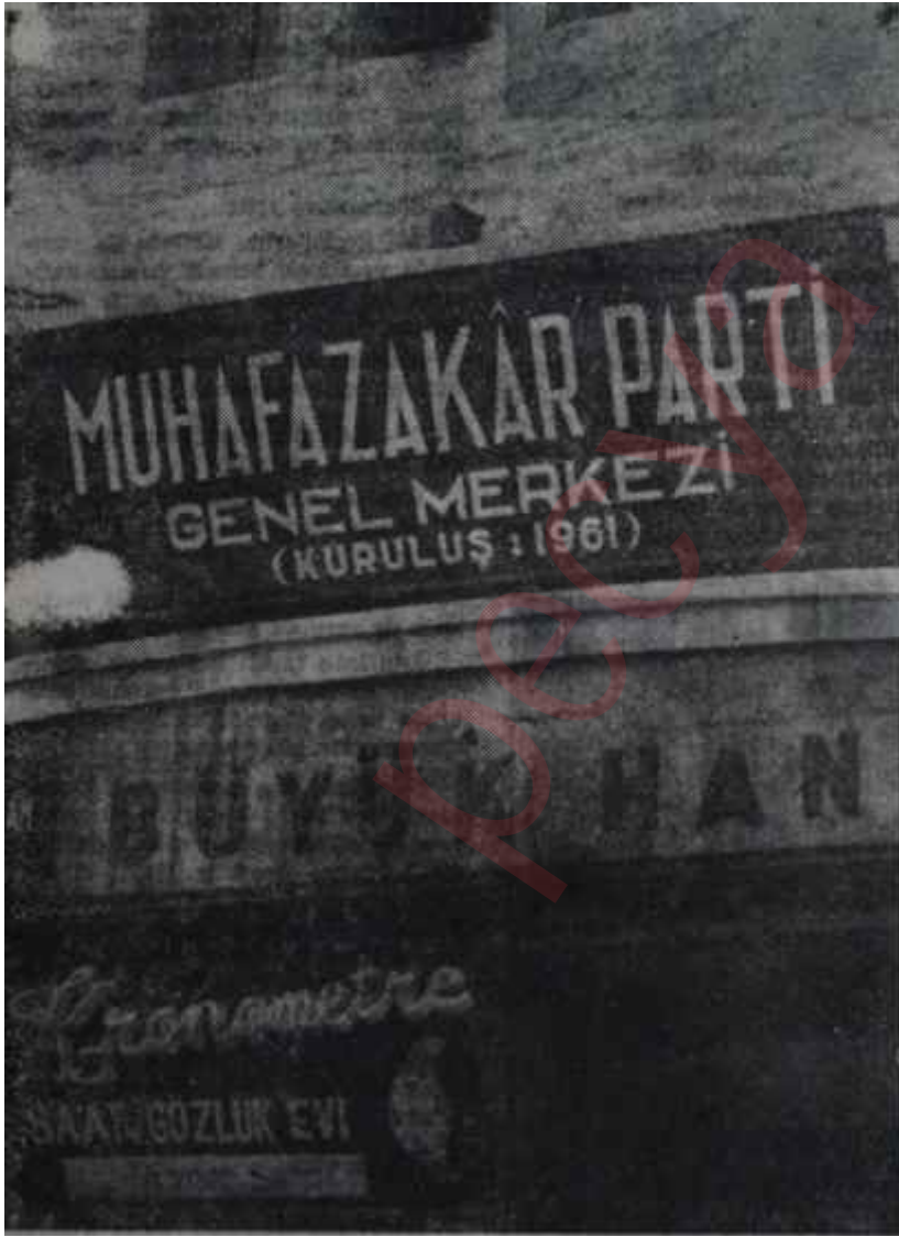
Muh. P. Genel Merkezinin levhası Rumbadan cumbaya

Teşebbüs, çapından umulmayacak bir önemi bitirdiğimiz haftanın sonunda aldı. Muhafazakâr Partinin pavyon sahibi Genel Başkanının mektupları her iki partide, tetkik edilirken meşhur "Bütün dünya proleterleri, birleşiniz!" sloganını hatırlatır şekilde "D. P. oylarının bütün mirasçıları, birlesiniz!" propagandası İşletilmeye açıldı. İşin şampiyonluğunu, tahmin olunabileceği gibi gerici basın yapıyor ve bir hayanın yaratılmasına çalışılıyordu. Baksanıza, Referandumda ne güzel netice alınmıştı! Ee, seçimlere de birlik halinde ve tek bayrak altında gidilirse, oylar dağılmayacaktı. Ancak gerici