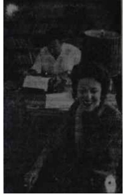
Yaşar Kemâl eşiyile Pygmalion hangisi?

Y aşar Kemal için talihsizliğin İki dört yaşında başlıyor. Bu talihsizlik öyle ufak tefek çeşidinden değil, bir gözüne mal oluyor. Hemite Köyü, Adananın Osmaniye İlçesine bağlıdır. Bu köyün, bir başka adı da Gökçelidir -ki Yaşar Kemal'in de soyadıdır-, Ceyhun ırmağının kıyısında, çevresi Kayalıklı bir vadide, bereketli toprakları olan, buğday, arpa, pamuk tarımıyla geçinen bir Türkmen köyü. Küçük Yaşarın babası Sadık bu köye tâ Van ilinden yetmiştir. Vanın Muradiye ilçesine bağlı göl kıyısındaki Ermiş köyünden. Hemitede çiftçilikle uğraşır, kuzun tüccarlığı yapar. Yaşar, ailenin tek oğludur. Rem tek oğuldur, hem de tek çocuk. Onun İçin de adım Yaşar koymuşlardır. Geleneklere göre, bu tek oğul için her yıl kurban kesilir. Yaşar, dördüncü yıla basınca 1922 yılında doğmuştur» gene bir celep gelir ve kurban keser. Ne olursa işte o kurbanın kesildiği sırada olur. Celep, kurbanın karnını yararken, bıçağı kayar, kendisini dikkatle seyrelmekte olan küçük Yaşarın çö-