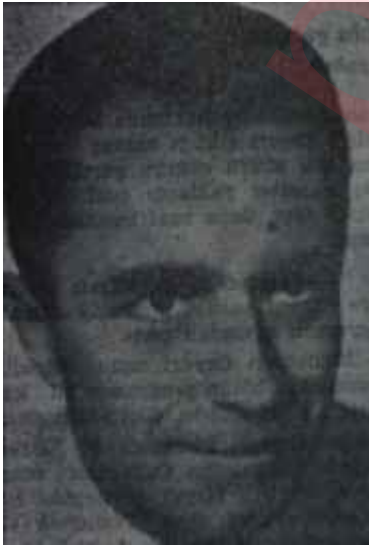
Kejisör Antonioni Tam isabet!

Lidia sokakları dolaşır, şehir dışına çıkar, erkeksiz ve yapayalnız bir kadındır. Avunmak, unutmak gereğim iliklerine kadar duymaktadır. Yeni bir inşaat, yangın yerleri,