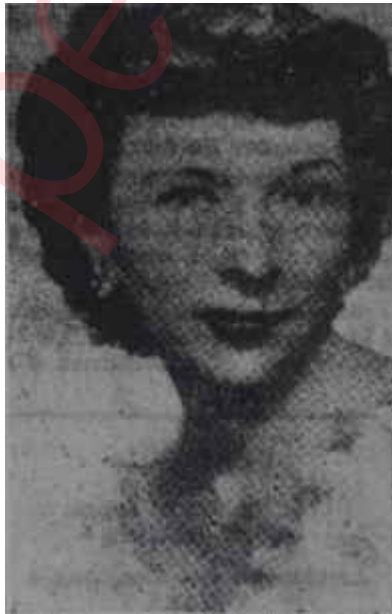
Dorothy Carnegie Saadet öncüsü

Başarının ilk şartı ne istediğini bilmekse, ikincisi işini sevmektir. Bunu da insan arzu ile, yavaş yavaş elde edebilir. En basit işin bile ilgi çekici tarafları vardır. İki inşaat amelesine, "Ne yapıyorsunuz?" diye sormuşlar, birisi omuz silkmış, "Tuğla, diziyorum" demiş, öteki memnun, "Kilise yapıyorum" diye cevap vermiş. İnsanın işini sevmesi için işine ait bütün bilgileri edinmesi, her yerde işine ait malûmat toplamaya çalışması, işi hakkında kafa yorması lâzımdır. Kadının bu konuda eşine