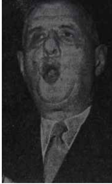
De Gaulle Hoşnutsuzlar ülkesi kralı!

General De Gaulle'ü 1958'de iktidara getiren Cezayir. 22 Nisan ayaklanmasıyla bu sefer onun idaresine karşı cephe aldı. Gerçi bu az çok anlaşılır bir tutumdur. Cezayirdeki 400 bin kişilik ordunun "Cezayir Fransanıdır" parolasına bel bağlanmış olan kısmı ve müfrit Avrupalı halk, 1958 de Generali bu parolayı gerçekleştirdi diye Parise zorla kabul ettirmişlerdi. Fakat De Gaulle. 16 Eylül 1959 nutku ile Cezayir için otodeterminasyonu kabul edip, gerekirse Cezayirlilerin bağımsızlığı seçmelerini de göze aldığını ifade edince, işler değişti. Bir bakıma Cezayirli müfritler aldatılmış oldular, fakat