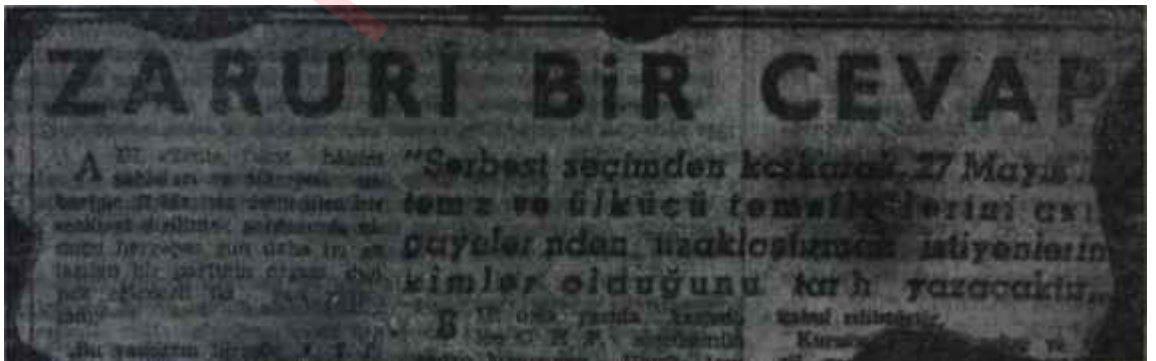
Ulus Gazetesindeki polemik yazısı 'Yetimin ahı!'

İnsan C. H. P. yi görünce, elde değil, dünyalar kadar serveti olup bunu yemesini bilmeyen zenginler karşısında Sokaktaki Adamın duyduğu hissi duyuyor: Biraz acıma, biraz hiddet, ama hepsinden fazla istihfaf!