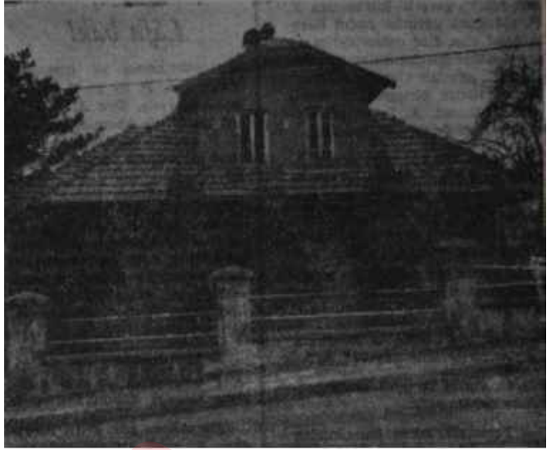
Y.T.P. Genel Merkezi