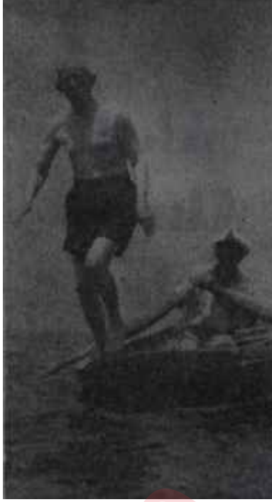
İnönü çivileme atlıyor Yüreklere yağ eritiyor

Kurultay için Genel Merkezin en esaslı hazırlığı, İktidar alındığı takdirde C.H.P. nin çeşitli konularda nasıl davranman gerektiği hususunun umumî efkâr önünde ve Kurultay çerçevesi içinde tesbitidir. Bu, yeni politika hayatımızda, da bir ye-