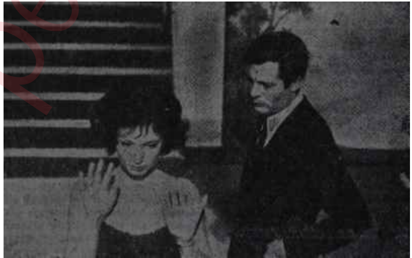
Monica Vitti ve M. Mastroianni "Gece"de

Büyük iş adamının köşkünde verilen davet, daha önce Fellini'nin yaptığı "La Dolce Vita - Tatlı Hayat"daki davete çok benzemektedir. Fellini ile Antonioni arasındaki tek uçurumlu fark -sinema ustalıklarının dışında-, birincinin suçlayıcı davranışına karşılık, ikincinin çokluk duruma seyirci kalması ve teşhir ile yetinmesidir. Antonioni, "La Notte - Gece"de sosyetenin çılgınca yaşayışını kendinden hiç birşey katmadan yalnızca gösterir, karşılığın seyircisine verdirir.