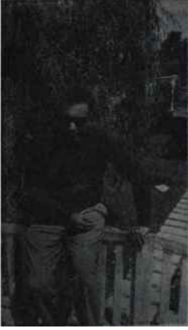
Yaşar Kemâl evinin önünde İnden yuvaya!

portaj kitabı daha vardır: "Çukurova Yana Yana". 1957 de üçüncü röportaj kitabı olan "Peri Bacaları" yayınlanmıştır. 1960 yılında da, "Orta Direk" adlı romanı kitap haline gelmiştir. Ayrıca "Çakırcalıyı Biz Öldürdük" adlı biyografisi ile "Karcacaoğlan" adlı resimli romanı henüz kitap haline gelmemiştir. "Yusufoçuk Yusuf" adlı son romanı ise Taninde tefrika edilmiştir. Bundan başka, bir çok röportajları, küçük hikâyeleri, senaryoları vardır. "Beyaz Mendil" adlı senaryosu 1955 - 56 mevsiminin en güzel filmi seçilmiştir.