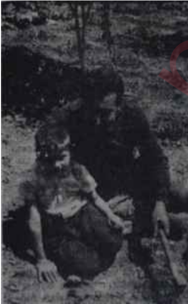
Yaşar Kemal ve çocuk Yaşatlar

B üyükadanın Maden mevkiinde sarp bir yamaç üzerine yapılmış dört köşk vardır. Bu köşkler, C.H.P. nin eski İstanbul İl Başkanı avukat Esat Muhlis Sırmalınınındır. Doğrusu buraya yeryüzü cenneti demek bile gerçeği tam olarak anlatmak için biraz yetersiz kalabilir. Pencerelerinden göz alabildiğine, duru, aydınlık, dinlerdirli bir mavi gökyüzüyle, yaşama sevincini çoğaltan, büyüten, geliştiren, yaşlıyı genç, genci çocuk eden, oynak, işveli bir mavi deniz görünür. Bu maviler yetmezmiş gibi bir de çamın binbir yeşili ve kokusu dört-bir yanı tarar. İşte böyle bir yerde, bu köşkerin en küçüğünde, Muhlis Sırmalının oğlu film rejisörlüğü yapan Şakir Sırmalıyla yakın arkadaş olmanın verdiği avantajla, 4000 liralık yıllık kirayı 2500 liraya indirmenin yolunu bulmuş, bir adam oturur. Oturur, çalışır ve bol bol denize girer. Kendisine sorarsanız, "mükemmel bir yüzücü" olduğunu ileri sürer. Bütün gürültülerden, günün dağdağasından uzak, denizle, gökle, çamla ve bunlar kadar önemli olan son derece anlayışlı bir kadınla birlikte alabildiğine sessiz bir yaşama düzeni içinde olan adam, son günlerde memleket içinde değil ama