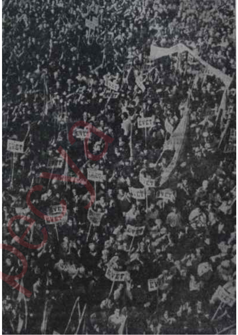
C.H.P. nin Taksimdeki EVET mitingi

Partilerin dışında, bilhassa tarafsız küteller üzerinde en büyük tesir M. B. K. den ve onun Başkanından gelmiştir. Komite üyelerinin ve bizat Cemal Gürselin faal şekilde EVET kampanyasına katılmaları bir takım