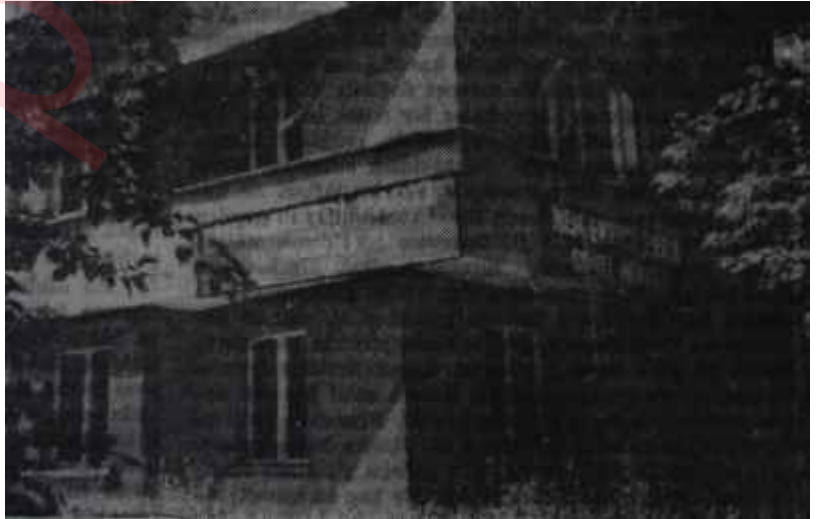
C.H.P. Genel Merkez binası Amasyanın bardağı değil ki...

Basın mensupları nimeti gökte ararken yerde bulmuşlardı. Derhal Beleni sıkıştırmağa başladılar.