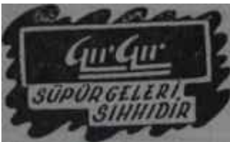
AKİS - Reklâm — 59