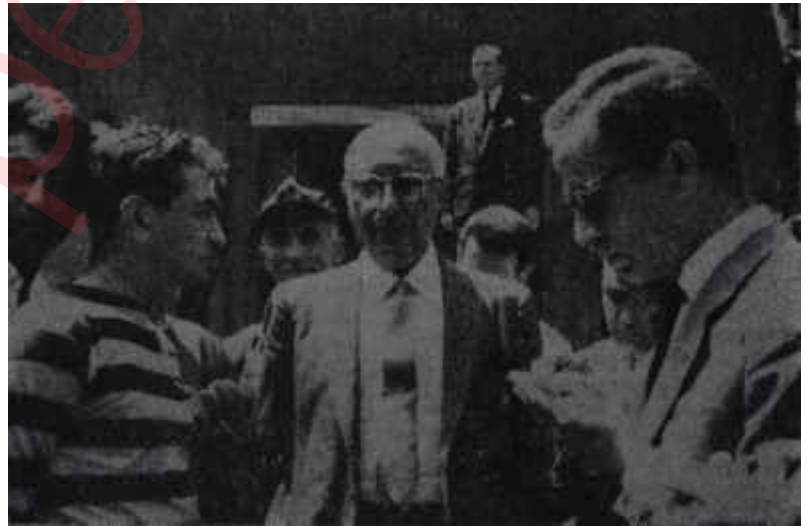
Selim sarper gazetecilerle "Ayrılık ölümden beter" değil!

Ne var ki söylentilerin, çok az da olsa, doğru tarafları mevcuttu. Sarperin bazı meselelerde gücendiği, daha doğrusu üzüldüğü biliniyordu. Dışişleri Bakam olarak yetkisi dahilindeki bazı konular üzerinde tutumunun aksi -bunların büyük bir iyi niyetle yapıldığından emindi- beyanlarda bulunulması yılların diplomatom müş-kül durumda bırakıyordu. İş yeni den tezgâhlamak durumuna düşüyor ve ister istemez insan olarak Üzülm eden edemiyordu. Tâyinlerle ilgili söylen-tilere gelince, denilebilir ki, biraz boşa atıp, dolu tutturulmuştu. Sarperin bundan evvelki bazı tâyinlerde üzü-