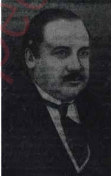
Ziya Gökalp Maziden sesler

Günümüzün iyi şairlerinden biri iken, yavaş yavaş kendini tüketme yoluna giren Ümit Yaşar Oğuzcan, güzel şiirlerini içine edan kitaplarından birini. İki Kişiye bir Dünyayı üçüncü defa bastırıyor, Türkiye'de