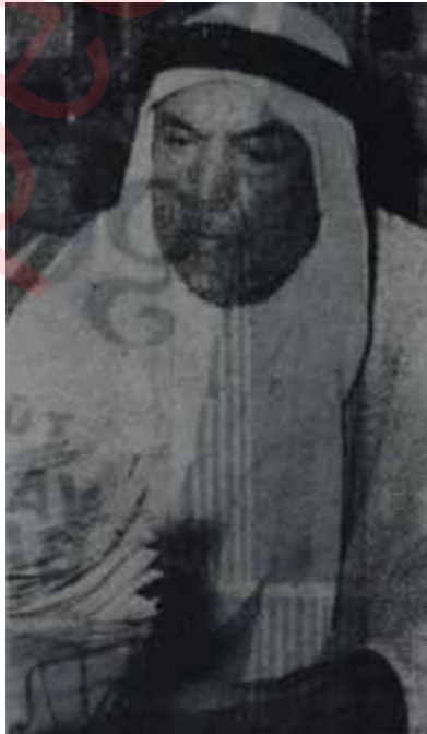
Küveyt Emiri Essabbah

Bu çerçeve içinde mütalaa edilince Küveyt buhranı genel hatlarıyla petrolün, yâni geri kalmış Arap memleketlerinin şimdilik tek servet kaynağının bölüşülmesi dâvasında -Hattâ gerekirse Bevan plânına göre - bir merhale gibi görünmektedir. Bunun en yakın neticesi, petrole sahip olanlarla bundan yoksun bulunanların münasebetlerinde yeni bir gerginlik şeklinde tezahür edecektir ki, müşahhas olarak bu da Birleşik Arap-Cumhuriyetiyle Suudi Arabistan arasındaki münasebetlerin tekrar bozulmasına yol açabilir.