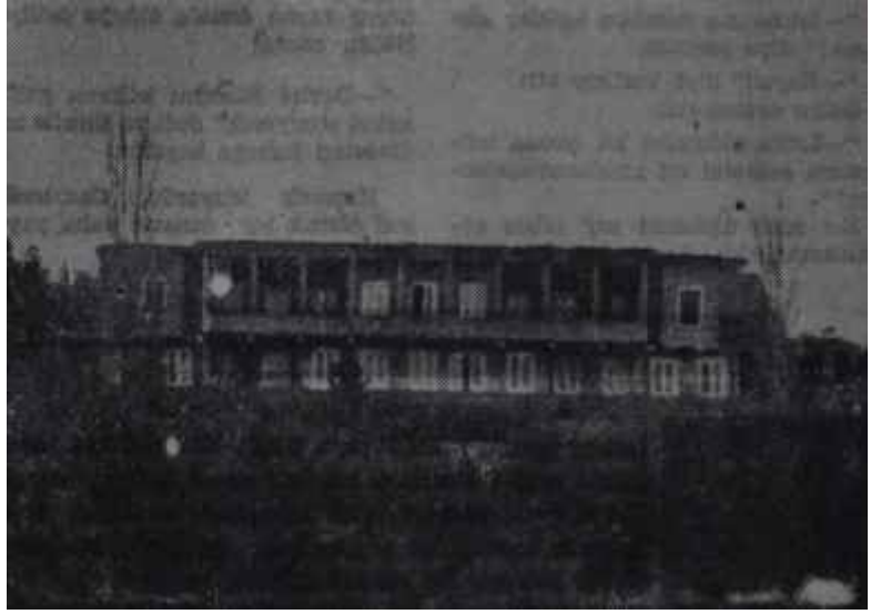
Hariciye Köşkü Kemali: İki saat!

Ancak haftanın içinde Sarperin karşısına, bu meseleyle ilgili bir engel çıkıverdi, İki memleket arasında balıkçıların mübadele edileceği, haberi basında geniş yer aldı. Bu Bulgar Hükümetinin cesaretini arttırdı. Büyükelçinin ağız değişti. Sarper bir kere daha tezgâhladığı işe yeniden girişmek mecburiyetinde kaldı. Kal-