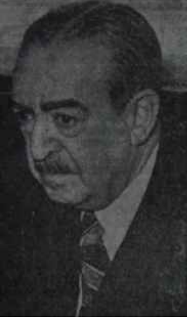
Ahmet Emin Yalman