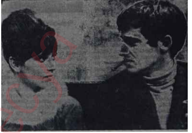
A. Karina ve Jean - Paul Belmondo "Kadın Kadındır" da Fransayı yine "Yeni Dalga" temsil ediyor

Her yıl Haziranın son haftası ile Temmuzun ilk haftası arasında başlayıp biten Berlin festivali, 1950 yılından sonra ise birinci sınıf festivaller arasına katılmıştır. Başlangıç yıllarında yalnızca turist celbiyle şehrin varlığını duyurma bakımından önemsenen Berlin festivali, daha sonra yarı politik bir yön almış ve yılda on günlüğüne de olsa -yıllar yılı Doğu ile Batı arasında bir çekişme konusu