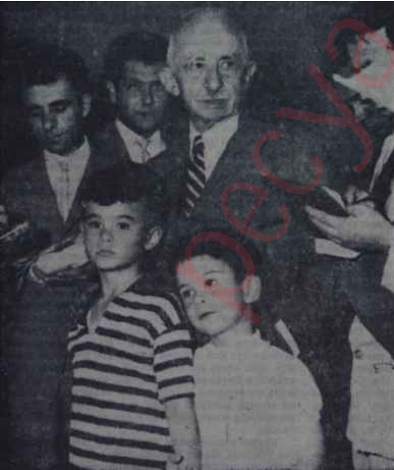
İnönü Maltepede basın mensuplarıyla

Kış başında geçirdiği rahatsızlıktan bu yana İstanbul gelmemiş olan İnönü, sâdece sıhhatli değil, aynı zamanda memnun ve neşeli de görünüyordu. Bu hali herkes üzerinde son derece müsbet bir tesir bıraktı. Zira bir takım haberler kulaktan kulağa uçurulmuş, başarı ihtimallerini İnönünün sıhhati üzerine bina eden büyük politikacılar hayallerini hakikat diye yaymaya çalışmışlardı. Şimdi ise trenden pür sıhhat ve pür neşe-Basın taktığı isimle- 77 yaşında bir delikanlı inmişti. İnönü, damadının kullandığı ve içinde eşi, kızı, gelini ve torunlarıyla iki yeğenin