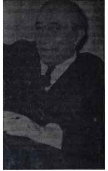
Osman Bölükbaşı Politik üsütme