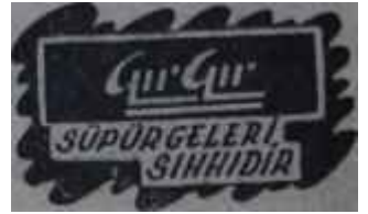
AKİS -Reklâm — 50

Nihayet öğleye doğru Memleketçi Partiden bir ses geldi. Memleketçiler kaderlerine razı oluyorlar ve çekilecek kur'ada kendilerine en son konuşma isabet etmişçesine hareket edebileceğini belirtiyorlardı. Pazar-tesi günü gelip konuşmayı yapacaklardı. Bölükbaşından haber daha geç