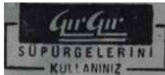
AKİS - Reklâm — 27