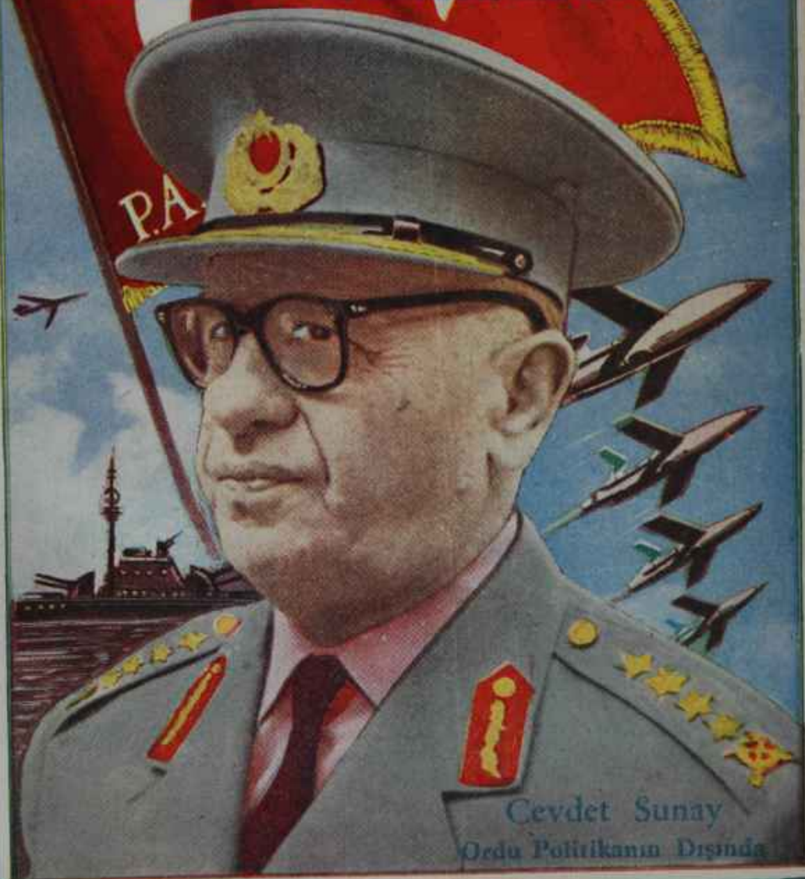
Cevdet Sunay Ordu Politikasının Dışında