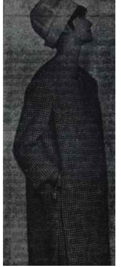
Şık bir elbise Güzelliği ucuzluğunda

fetlerinin, plaj çantanızda bir mendil kadar yer tutacak yumuşak, küçük, çoğu zaman iki parçalı mayoların zamanı geldi. Gene de birçok modellerde göze çarpan şey, pardesülerdir. Çünkü bir yaz gardrobunun temel kıyafeti bu sene beyaz bir pardestiştir. Vakıta serin yaz akşamları için beyaz bir sveterin, bir yarım ceke-ti: de aynı vazifeyi görebileceğini düşünmek mümkündür ama, çok ince kumaştan dikilmiş yazlık beyaz bir pardesünün giyimli bir kıyafet olarak çok yasak savacağı ve senenin gözdesi emprime elbiselerle güzel bir