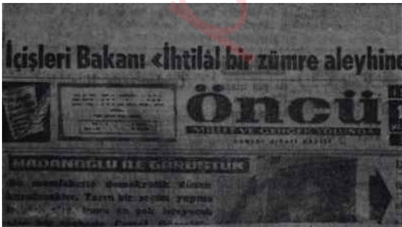
"Öncü"nün değişen manşeti yeni rüzgâra yeni yelkenler

Hemen birinci sayfanın sağ alt köşesinde, tek yıldızlı makaleler sökün etmeğe başladı. Y.T.P. nin nâsir-i efkârı haline gelen öncünün ü-