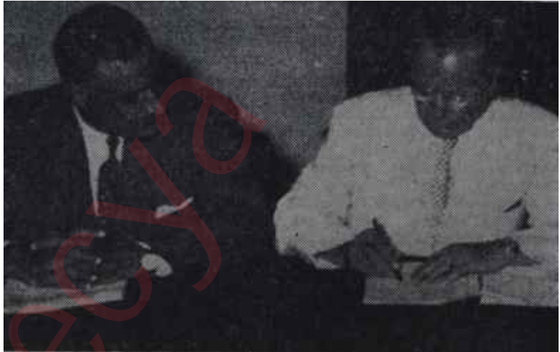
Abdünnâsır ve Tito İki baş bir el içindir