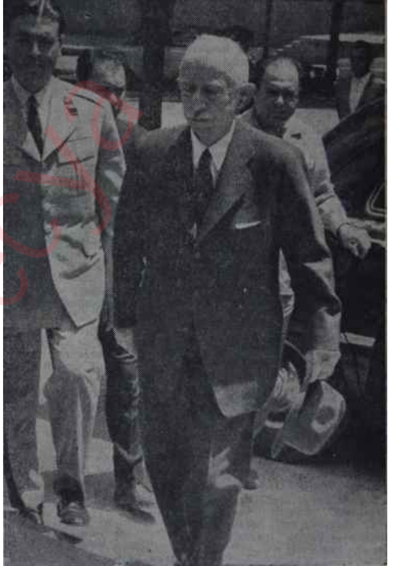
İnönü Cemal Gürseli ziyaret için Başbakanlığa geliyor

Basın Bürosunu boş bulan gazetecilerle fotoğrafçıların koridoru geçme teşebbüsü Özel Kalem Müdürü tarafından mahirane şekilde önlendi. Foto muhabirleri, isteklerini Özel Kalem Müdürü vasıtasıyla Başkana duyurdular: Acaba mülakattan bir resim çekebilirler miydi? Özel Kalem Müdürü iki siyaset adamının bulunduğu Başbakanlık makam odasına