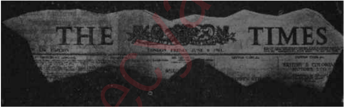
The Times'in başlığı Hayaller âleminde yeni »esler

Bu, biz Türklerin, içinde bulunduğumuz bir hâdise. Eğer muteber Times'ın tahmindeki isabet derecesi buysa 1961 Times'ının pek acınacak halde bulunduğunu görmemek kabil değildir. Ama, "manie de contradiction" denilen rahatsızlığa müptelâ Hotham'ın haber