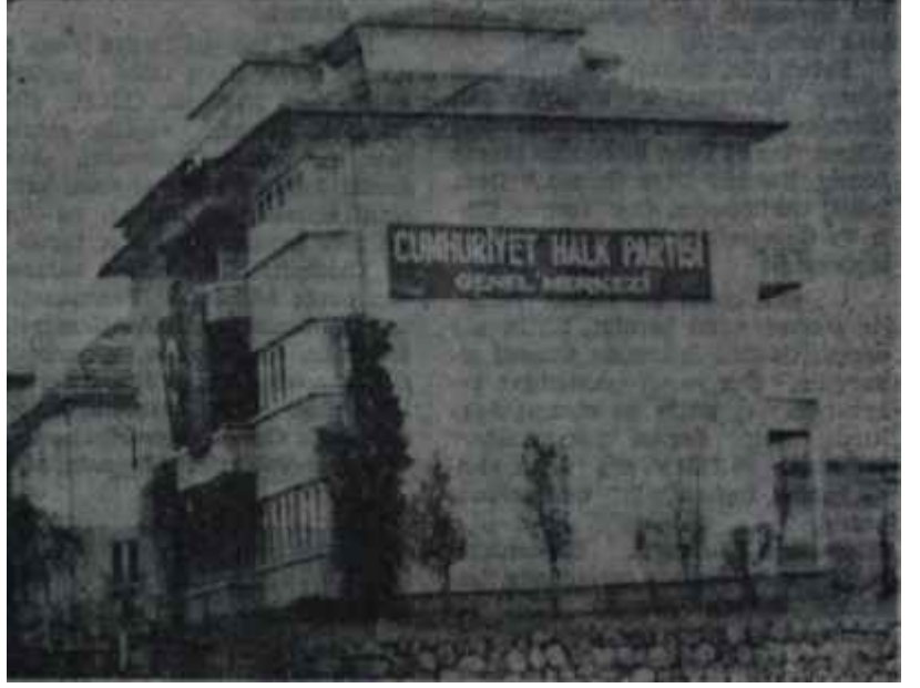
C.H.P. Genel Merkez binası

Gürsel, başını sallayarak menfi cevap verdi.