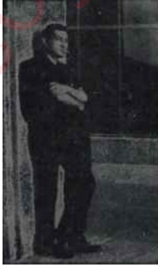
Bartınloğlu Meclis kapısında Bekle babam bekle da aksettirilmektedir.

Bu haftanın alâka uyandırıcı başka bir faslı, YASSIADA DUYUŞMALARI kısmıdır. Muhtemelen Temmuzun ikinci yarısında sona erip hükmü tefhim olunacak bu uzun hikâyenin sonu yaklaşırken Adada cereyan edenler de dikkati daha fazla çekmeye başlamıştır. Adaya alt notlar, bir kaç haftadan beri olduğu çerçevesi yazılar-