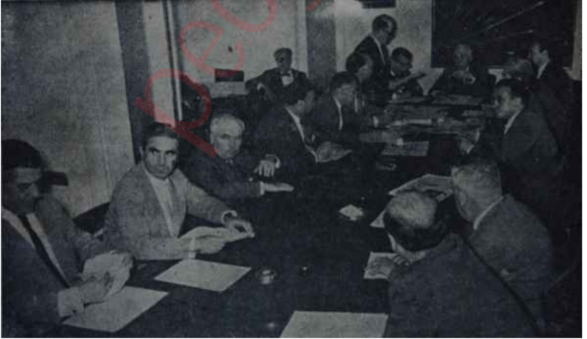
C.H.P. Meclisinin İnönü başkanlığındaki toplantısı Olgun meyveyi düşürmek için ağacı sarsmak şarttır

Fakat muhakkak ki C.H.P. Meclisinin hafta sonunda yaptığı toplantının en mühim konusu son hadiseler oldu. M.B.K. içinde cereyan edenler titizlikle incelendi, değerlendirildi.