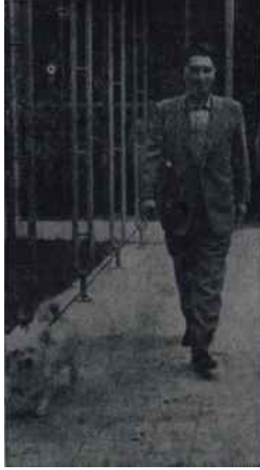
Madanoğlu gezintide Vazife henüz bitmedi

İki ihtilâlcî el sıkıştılar. Sonra Kumandanlığın kapısında kayboldular Bir saate yakın süren sohbetin