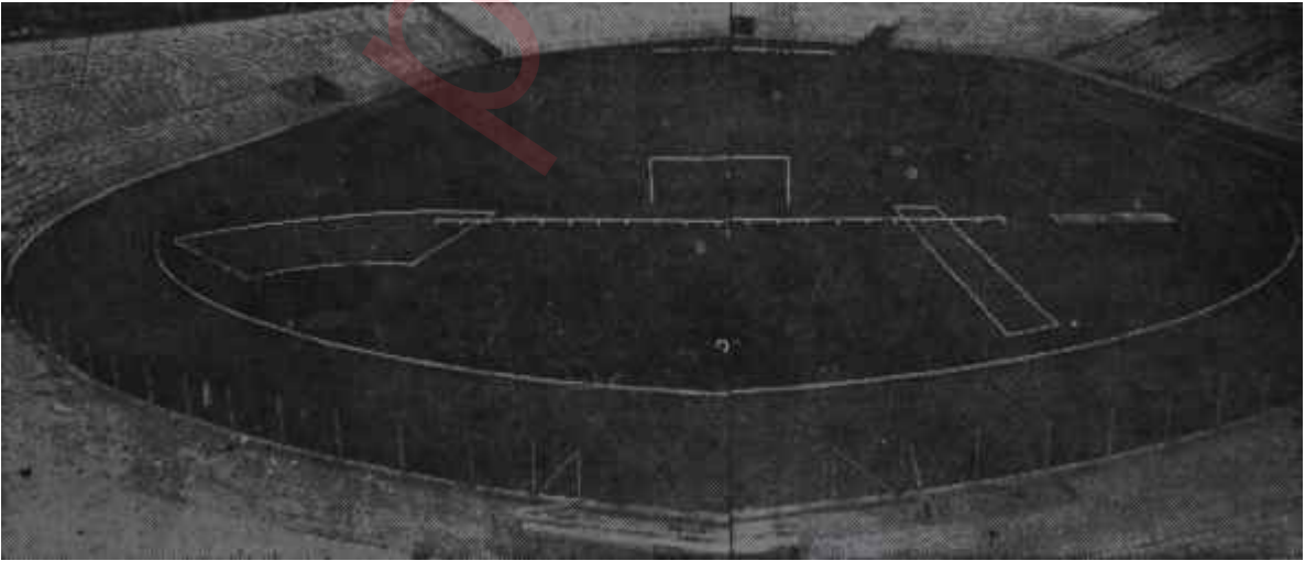
19 Mayıs Stadyumunun umumi görünüşü Pazara uymayan evdeki hesabın sonu

Son zamanların modası şikâyet müessesesi, Fenerbahçe - Beşiktaş maçından sonra da devam etti. Maçı seyredemeyen kimseler, derhal soluğu şikâyet mercilerinde aldılar. Bölge Müdürünü ve diğer ilgilileri Millî Birlik Komitesine kadar şikâyet ettiler. Dâva bile açanlar oldu. Onlara göre herşeyden Ankara Bölgesi mensupları mesuldü. Halbuki Ankara Bölgesi görevini yapmıştı. Stadın alacağı seyirci miktarı düşünülmüş, ona göre bilet satılmıştı. Emniyet tedbirleri için de bütün makamlara başvurulmuştu. 35 bin kişilik stada 50-60 bin kişiyi sığdırmak nasıl mümkün olabilirdi?: Mümkün olamazdı ama, şikâyet müessesesi meraklılarına bir suçlu lâzımdı.