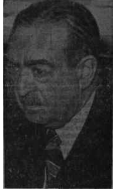
Ahmet Emin Yalman

D ünyayı idare etme arzusu ne sevimli, ne tatlı, ne zararsız bir heves!