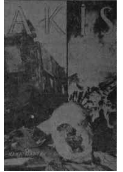
AKİS'in değişen kapağı