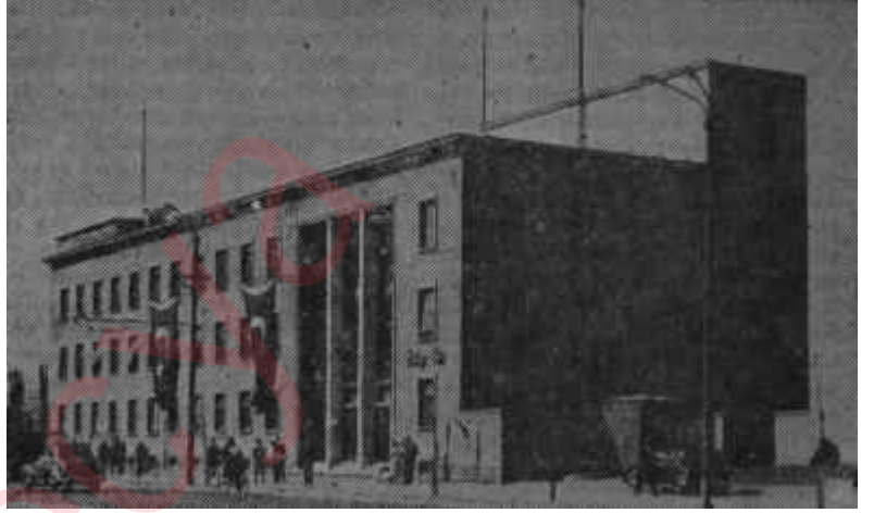
Ankara Radyosunun binası

günde Devlet radyolarının matem yapması ise başka bir hatanın meydana çıkmasına sebep oldu. Ortada bütün memleketi ilgilendiren bir hadise varsa, matem milletçe tutulur. Sadece radyoların mateme girmesi manasızdır. Üstelik dinimizde bile mateme yer verilmiş değildir. Demek ki düşük iktidar devrinden kalma bir alışkanlıkla bu yola gidilmiş, ortalık boşboşuna heyecana verilmiş, radyoda matem yapılması prensibi kabili edilebile Türkiye radyoları her zaman olduğu gibi yine radyoculuğa yakışmayan bir şekilde bu görevi yerine getirmişlerdir.