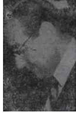
Adnan Menderes Hesap günü