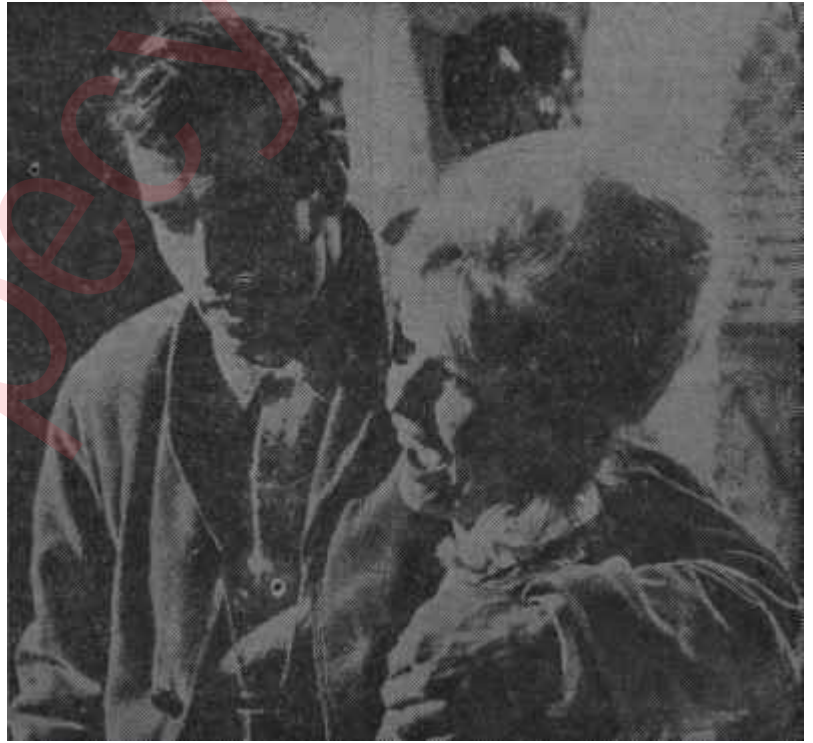
Brigitte Bardot eski kocası Vadimle

Adı "zeki'ye çıkmış prodüktör Raoul-Levy'nin yıldızı Brigitte Bardot'dan yakınması, aynı yıldızla film çevirmekten vazgeçmesi, Hollywood taktiklerini kullanan her sinema prodüktörünün kaçınılmaz akibetidir. Raoul-Levy'nin bu karara varmasında en büyük rolü rakamlar oynamıştır. Levy'nin Brigitte Bardot ile çevirdiği ilk filmi "Et... Dieu Crea la Femme - Ve Allah Kadını Yarattı" 300 bin dolara mal olmuş, yıldızda da 36 bin dolar ödenmiştir. Filmin dünya pazarlarından prodüktörüne getirdiği kâr toplamı ise, 21 milyon doları aşmaktadır. Topu topu 340 bin dolar civarında bir paraya çıkarılan hiç bir film -şimdiye kadar-Fransız sinemasında maliyetinin 60 katı kâr getirmemiştir. "Zeki" prodüktör Raoul-Levy'nin bir çeşit yağlı kuyruk saydığı Brigitte Bardot'ya sınıksı sarılmasının ve ikinci filmi "Une