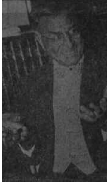
Kasım Gülek Taşa balta

O gün, kongrelerden baş alıp Temsilciler Meclisinde görüldüğünde bir kaç C. H. P. li eski Genel Sekreterin yanına gittiler. Ellerinde bir takrir vardı. Gülek, daha takririn altında İsmail Rüştü Aksalın imzasını görünce nevrinin döndüğünü hareketleriyle belli etti. Kendisine, takririn mânân anlatıldı. Mecliste temsilcisi bulunan üç partinin. C. H. P. nin, C. K. M. P. nin ve Y. T. P. nin selâbiyetli şahısların müşterek takrirle, içinde bulunduğumuz ıntikal devresindeki kanuni tasarruflarından dolayı M. B. K. ni her nevi mesuliyetten tenzih eden, bu tasarruflar hakkında Anayasa Makkemesine gidilmesin! önleyen, fakat gelecek Meclislerin de selâhiyetlerine ambargo koymayan, yani bu tasarrufların kanunlarla değiştirilebilmesini mümkün kılan Ur madde teklif ediyorlardı. Arzu, bunun ittifakla geçmesini temindi Bu bakımdan takrir, bütün partilerin isimleri bilinen temsilcileri tarafından imzalanmıştı. Meselâ Günaltay, kendisinden imzası istendiğinde partide fiili bir vazifesi bulunmadığını hatırlatmış, fakat eski Başbakan sıfatının ve partideki mânevi yerinin takrire kıymet verdireceğinin söy-