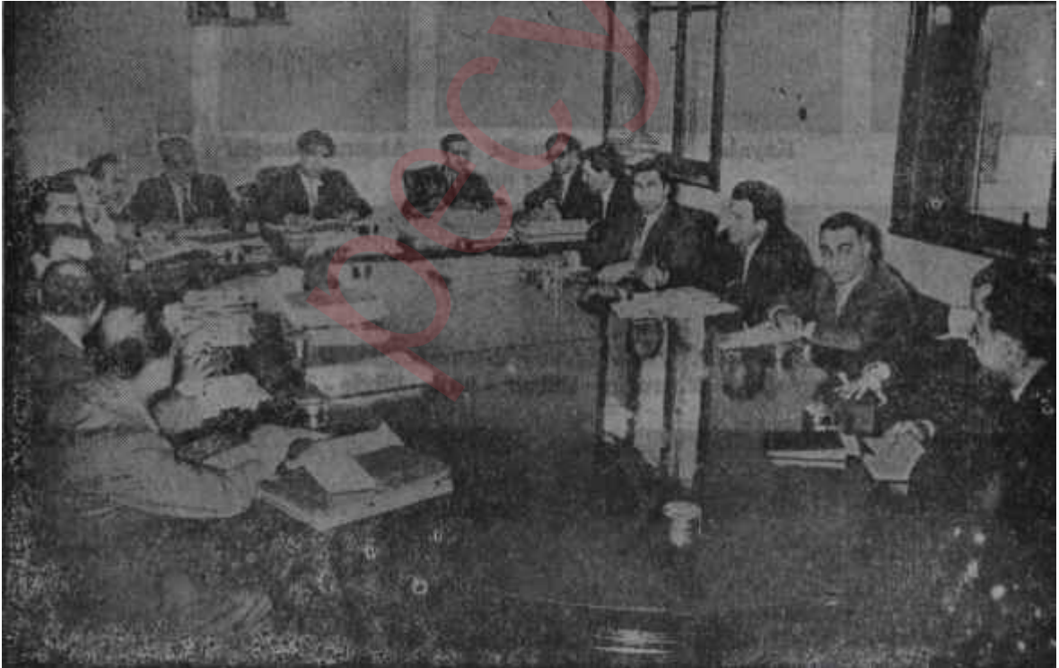
M.B.K. üyeleri toplantı halinde

Temsilciler Anayasa üzerinde görüşürlerken Komitenin kurmayları boş durmuş deęillerdi. Onlar da metni, madde madde olmaktan ziyade, konu konu dikkatle incelemişler. Üzerinde çalışmışlardı. Genç İhtilâlcilerden ekseriyetinin, Temsilcilerden ayrıldıkları fazla nokta yoktu. Aslına bakılırsa evvelâ Anayasa Komisyonunun, sonra da Temsilciler Meclisinin çalışmaları sırasında Komitenin umumi temayülleri dikkat nazara alınmıştı. Bir çok noktada gayrresmi istişareler yapılmış, Temsilciler ile Komite karşılıklı anlayış göstermişlerdi. Bu bakımdan, esas itibariyle bir görüş farkı bahis konusu deęildi ve bazı gazetelerde çıksa, Komitenin metinde çok deęişiklik yapacađını bildiren haberler emin kaynakların haberleri olmaktan uzaktı. Komitenin teferruata taallük eden yeni bir kaç fikrini de, Temsilciler kabul'etmeye hazırıldılar. Bu arada. Genel Kurmay Başkanlığının Hükümet içinde kime baęlanması