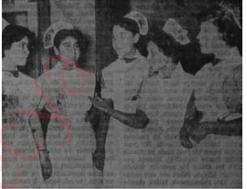
Gönüllü hemşireler vazife başında Koruyucu melekler

O akşam Nümune Hastahanesine yalnız Gönüllü Yardımcı Melekler