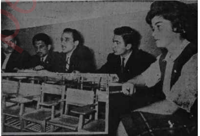
O.D.T.Ü. nde boş sıralar ve temsilcilerin basın toplantısı İncir çekirdeğinin içi