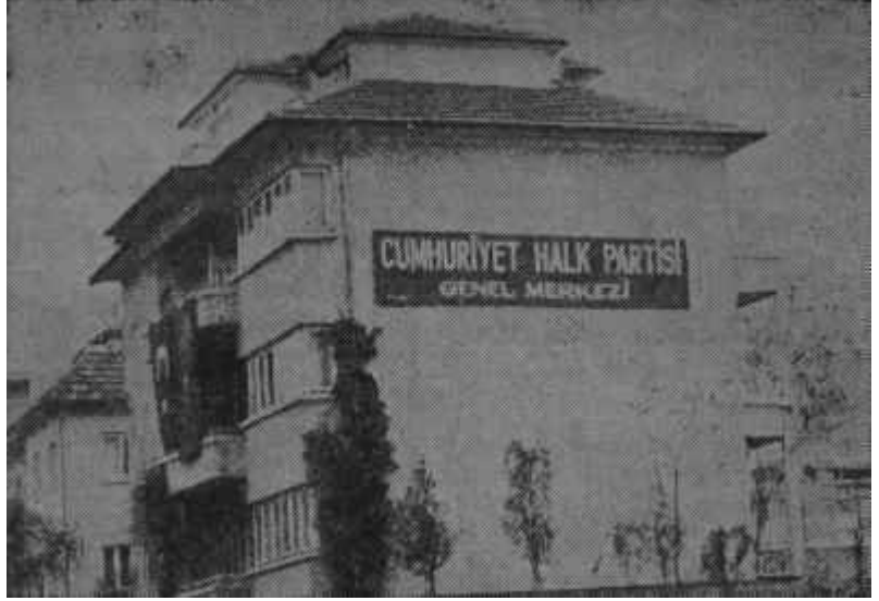
C.H.P. nin Karanfil sokaktaki Genel Merkez binası

Haftanın tam son günü Eskişehirin Mihaliçik ilçesinde yapılan ve İnönünün arzuladığı hava içinde cereyan eden gençlik kolu kongresinde Genel Başkanın bu mesajı alkışlar ve görülmemiş bir tezahürat arasında okunduğunda hatırlara ister İstemez İkinci Dünya Harbi sırasında geçmiş olan bir hâdise geldi. Sene 1942 civarı. Pearl Harbour'u takiben Japonlar Güney Doğu Asyayı hallaç pamuğu gibi atmışlar, akla gelen her yere Mikadonun bayrağını çekmişler. Ev arada bölgenin milletleri Tokyo'nun gözüne girme yarışında. Hepsisi, birbirini peşine Müttefiklere harp ilân ediyorlar Bunlardan biri de, o sırada Siam adını taşıyan küçük Tayland. Siam hükümeti, büyük bir cakaıyla Washington'a nota veriyor ve harp ilân ediyor. Ama, o ne? Was-