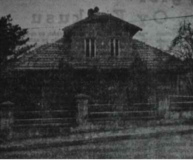
Y.T.P. Genel Merkez binası "Yolcu! Hür. P. ne bir rahmet..."

"- Vallahi kardeşim, dikkat etmek lâzım. Artık rejimi kavgası edecek değiliz, zira rejim meselesinin ihtilâlle halledildiğine inanıyoruz. Böyle olunca, biraz daha vakur davranmak yetinde olur. Bana kalırsa bütün partileri buna âzami derecede dikkat etmelidirler" dedi.