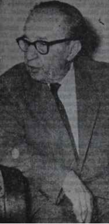
Ragıp Gümüşpala Bekçili lider

derine gazetecilerin arzularını hemen yetiştirmiş ve şöyle sunturlu bir demec hazırlanmıştı. Gümüşpala demesinde İnönü'nün sözlerini pek sevdiğini belirtiyordu. Ama hemen arkasından -kıdemli bir politikacı taktiğiyle- C.H.P. mensuplarının baskısından bahsediyor ve demece onların kulak asmalarını temenni ediyordu. Demec hazırlanıp bittikten sonra Ur kere daha okundu, lider de, akıl hocaları da pek beğendiler.