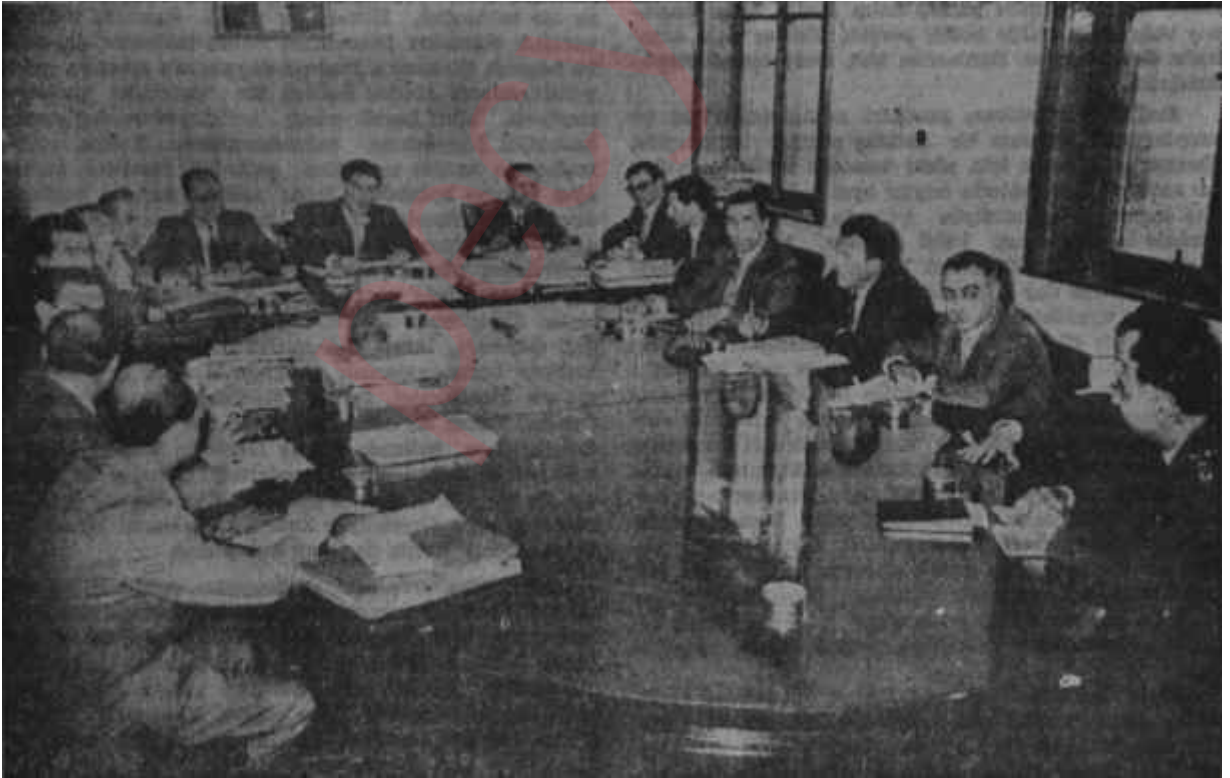
M. B. K. son toplantılarından birinde

Hemen hemen aynı günlerde başka bir Komite ve Hükümet üyesi, Sıtkı Ulay da, İstanbulda Kuyruk konusunda çetrefil bir beyanda bulunurken gazetecilerin Erken Seçimle alâkalı sualine maruz kalmış ve işi bir matematik formülle ifade etmiştir. Ulaya bakılırsa formül şudur: "Seçim — X + Yeter Zaman: Kurucu Meclis" Einsteln'in bile içinden kolay kolay çıkamayacağı bu formülü gazetecilere yazdırdıktan sonra Sıtkı Ulay işi daha da karıştırmış ve "Artık X'in ne olduğunu da siz bulun!" demiştir. İstanbullu gazeteciler başlarını kaşıyarak Devlet Bakanının yanından ayrılmışlar ve o akşam gazete idare-