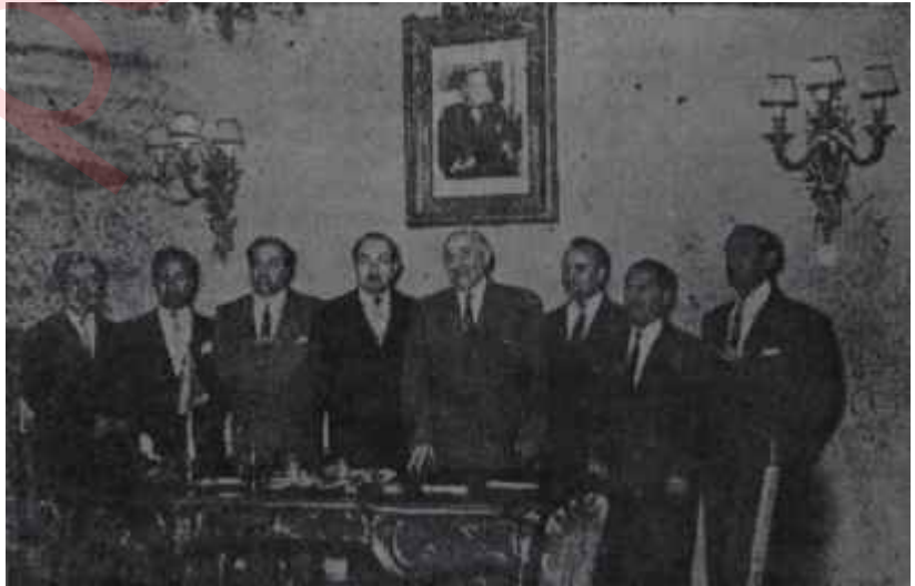
Eminsu temsilcileri Başbakanlıkta Ticareti olmayan ziyaret

Kahverengi elbiseli, saçları düz taranmış, bıyıkları itinayla düzeltilmiş adam, etrafını saranlara dert an-