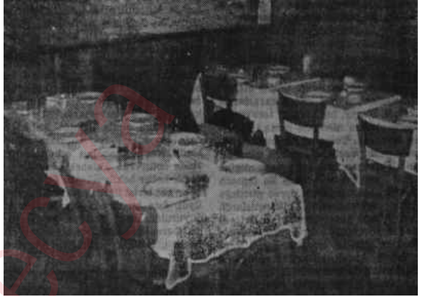
Tomannın Gaskonyalılarından bir köşe

dan Emniyet Müdürlüğüne, Merkez Kumandanlığına, 66. Tümen ve Zırhlı Tugaya bir emir ulaştırıldı. İstihbarat Teşkilâtı, bazı gençlerin çarşamba gecesi İstiklâl Caddesinde nihayetlenen Küçük Parmakkapı Sokağındaki birinci sınıf Gaskonyalı Torna meyhanesine, mukabil bir hareket olmak üzere baskın yapacaklarını haber almıştı. Sevkedilecek lüzumu kadar kuvvetle, bildirilen mahal muhafaza altında tutulmak üzere saat 17 den itibaren tertibat alınacaktı. Emir, titizlikle ve harfiyyen yerine getirildi. Yüzden fazla polis ve asker Gaskonyalı Torna Meyhanesi civarındaki kilit noktalarını tuttu. Hattâ 8. Zırhlı Tugay bir tank birliğini de tahrik etmişti. Emniyet Müdürü, 66. Tümen Kumandanı, Merkez