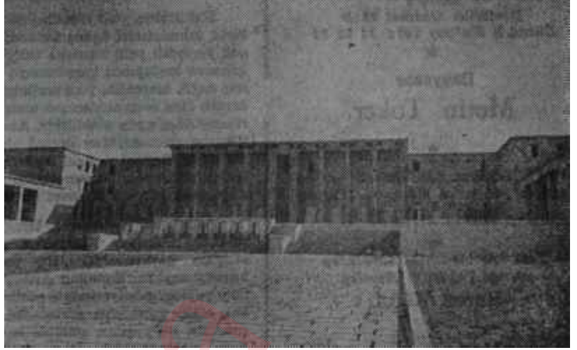
Yeni Meclis binası

İş ve ticaret alemindeki rahatsızlığı Menderesin o meşum ekonomi politikasına bağlamak kabildir. Gerçeğin bu olduğu da muhakkaktır. Çok ağır bir rahatsızlığın bünyede aksaklıklara vesile vermemesi imkânsızdır. Türk milleti, hangi iktidar gelirse