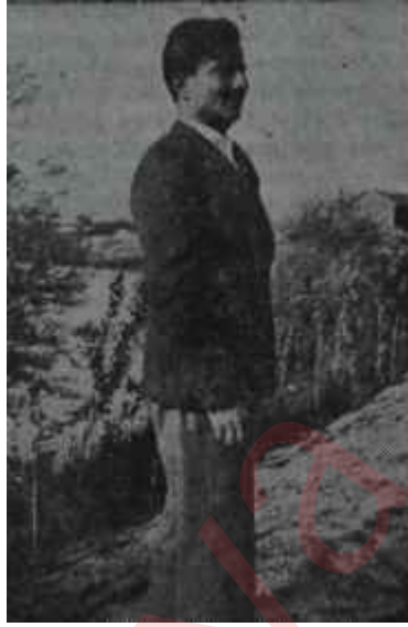
Aksal lise öğrencisi Geçmiş zaman olur ki...

"— Onun o hayreti aile içinde bir şaka mevzu olarak kaldı.."