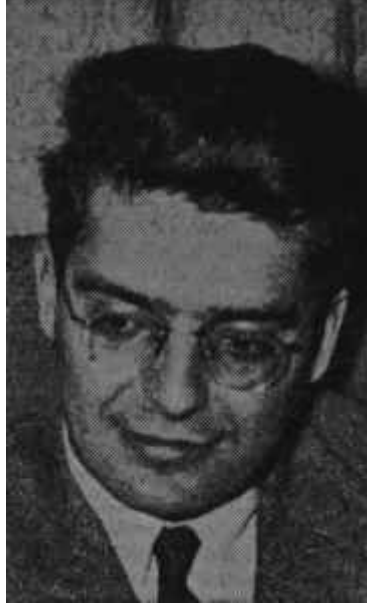
Aydın Yalçın Yolculuk var

Geçen hafta içinde başkentte olaylar bu minval üzere devam edip giderken öfkelenen, ancak boşalamayan politikacılar da mevcuttu. Bunların çoğunluğunu A.P. nin Tuna caddesindeki kırık dökük Genel Merkezinde bulmak mümkündü. Adalet Partisi ileri gelenleri gene bir pürüzle karşılaşmışlardı. Bu defaki pürüz gerçeği, devleti idare edenlerle çatışmayı gerektirmiyordu ama, esasen pek iyi geçinemedikleri basın, A.P. nin karşısına dikilmişti. Gaziantep'te geçen ve gazeteciler hakkında pek iltifat-kâr olmayan sözlerle ortaya çıkan olay, politikacılık oynamağa devam eden A.P. ileri gelenlerini ziyadesiyle müşkül vaziyette bıraktı. Allahtan bu defa gafı, meşhur Genel Başkanları yapmamıştı. Yoksa, A.P. idarecileri