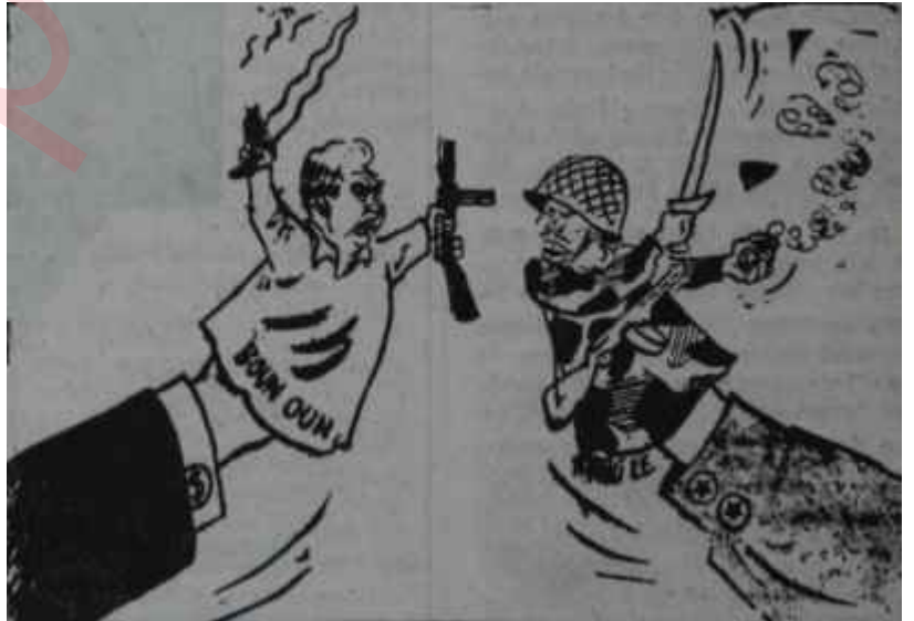
Laos'ta kukla oyunu

Moskovaya verilen İngiliz tekliflerinin aynı olan bu esaslar, Kennedy - Macmillan görüşmesinden birkaç gün sonra yapılan Kennedy - Gromyko görüşmesi sırasında, Sovyet Dışişleri Bakanına da açıklanmıştır. Doğrusu aranırca, Kennedy ile Gromyko arasındaki görüşmenin çok dostane geçtiği söylenebilir. İki devlet adamı, yardımcılarının da katıldığı kısa bir yuvarlak masa toplantısından sonra Beyaz Evin bahçesine çıkmışlar, başlayan baharın yeşerttiği ağaçların altında iki saatten fazla