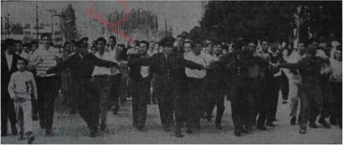
Gençler ve Subaylar 27 Mayıs'tan sonra elele