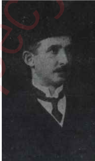
İsmet İnönü Tarih olan adam