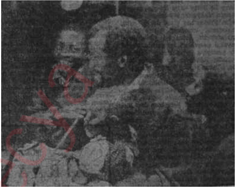
Rogosin'in "Come Back Africa" sından bir sahne

Bu bağımsız yenilerin ortaya çıkışında an çok tesirli olanlardan birisi, de, gerekli para buldukça çıkabilen "Film Culture" dergisidir. Yeniler için bayrağı ilk açan derginin editörü Jonas Mekas olmuş ve yazdığı "Kendimizi Aldatmayalım" başlıklı yasında "Amerikada biç bir sinema adamı yoktur. Kendi işimizi kendimiz görelim, kimsenin bizim istediklerimizi yerine getirmeye gönlü yok.." sözleriyle çevresini uyandırmaya çalışmıştır. Bu uyardıktan sonra işin başa düştüğünü gören Mekas ve arkadaşları 1957 yılında Edouard de Laurot'un rejisörlüğünde ilk film-