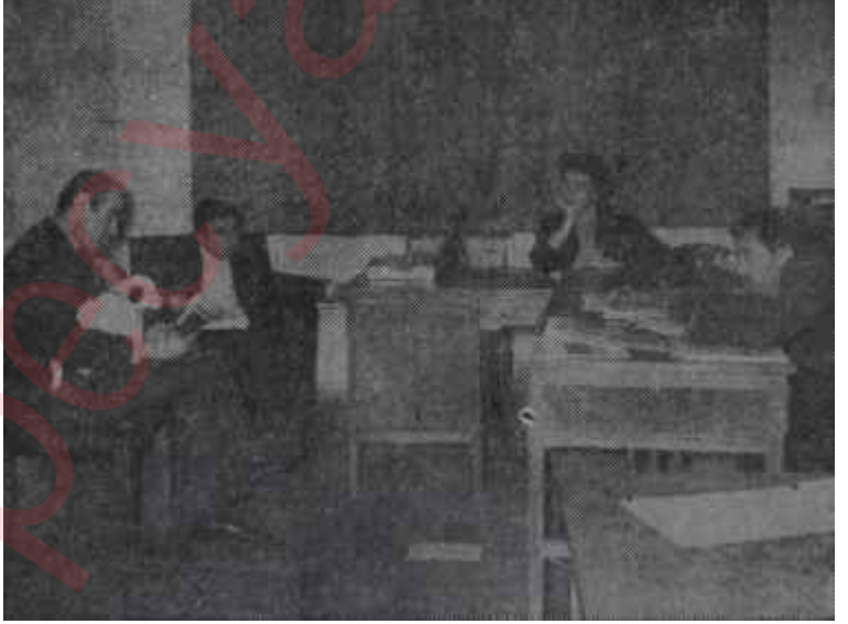
İşsiz kalan Öncücüler

Yayınlanan hiç bir gazete yayımlanması yasak edilen bir gazete kadar insana hüznün, topluma zarar veremez. Bu gerçek bir defa kabul edilirse, tutulacak yolu tesbit daha da kolaylaşır. Ortada başka bir suç varsa, ceza aleni ve ferdi olmalıdır.