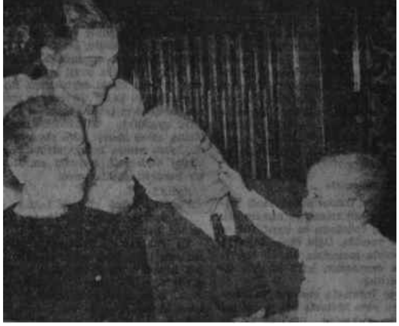
Aile yuvasında İnönüler Sağlam kafa sağlam ailede bulunur

Yemeklerden sonra bir yarım saat dinlenmeyi İhmal etmez. İsteddiği zaman uyuyabilme alışkanlığını İstiklal harbi sırasında edinmiştir. "Uzun boylu uyuyabilme imkânı yok" der ve fırsat buldukça, 13-20 dakika gözünü kapamakla zindeliğini muhafaza ettiğini söyler. Geceleri geç yatar, sabahları 9 civarında kalkar. Fakat efkârı bir işi varsa, herkesten evvel hazır olur. Yanındakilere geç kalacak-