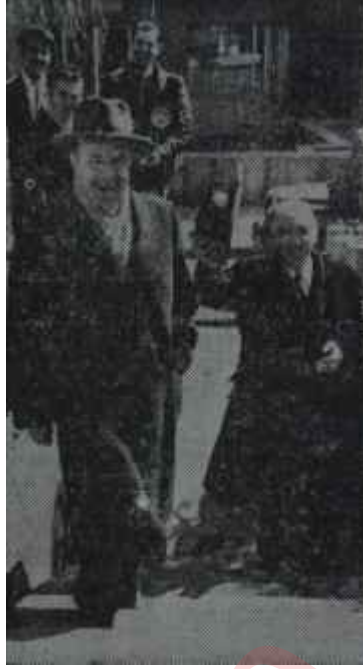
Foto muhabirleri çalışmağa başla-mışlardı. Bol bol poz tespit edildi. Bir sıkıntılı devirden sonra CH.P. li-

"— Haydi canım, toplanlık bile. Çekin bakalım" dedi.