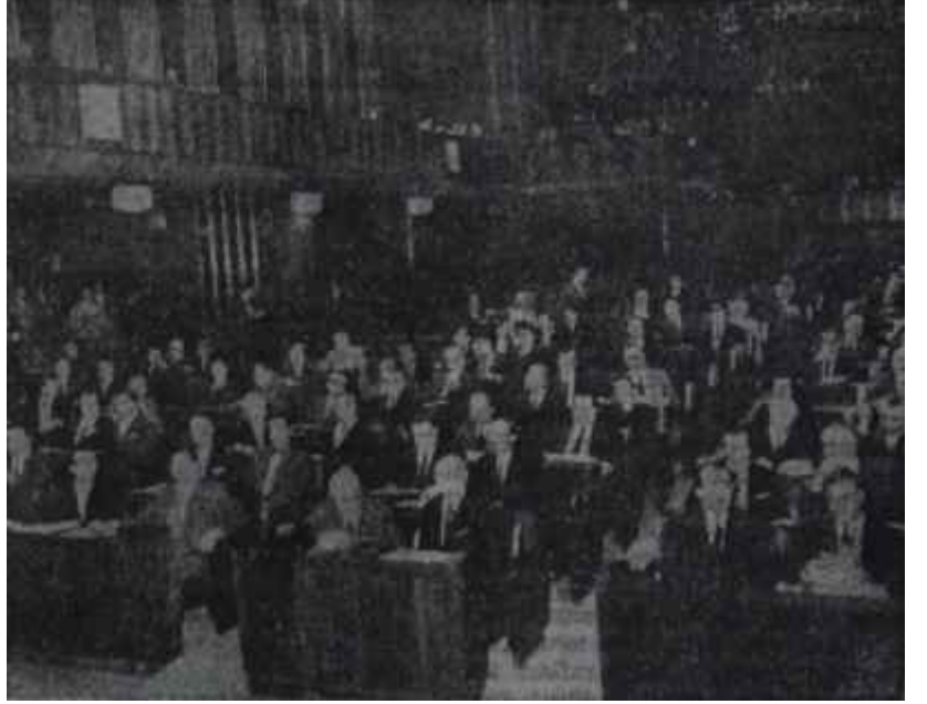
Temsilciler Meclisinde Anayasa müzakereleri II. Cumhuriyet inşa ediliyor.

"— Bir haftaya kadar yazacak bol bol haber çıkacağından eminim" dedi.