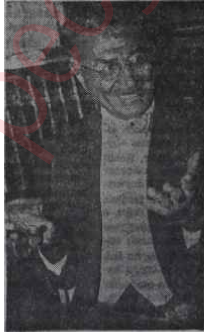
Kasım Gülek "Tehlikeli alakalar"

Tanini çıkardığı sırada Kasım Gülek, C.H.P. içinde bütün şansını kaybetmiş bulunuyordu ve bu büyük partide bir daha suyun yüzüne çıkması bahis konusu değildi. Muhalefet devrinde saklayamadığı kifayetsizliğini C. H. P. nin memleketi ve devleti idare etmek için kalifiye elemene muhtaç bulunduğu; bir sırada elbette ki örtecek hali yoktu. Bunun yanında, halefi Aksal her gün vaziyetini bileğinin ve kafasının kuvvetiyle, karakterinin pekiğiyle sağlamlaştırıyordu. Bir Kurltayda Güleğin girişeceği bir manevranın kendisini pestile çevirmesi işten bile değildi, o halde; başka bir kapı hazırlamak lazımdı. Kasım