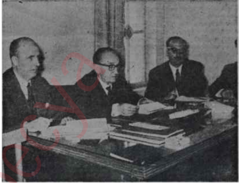
Gümüşpala basın toplantısında konuşuyor Mareşal II

Gümüşpala, AKİS muhabiriyle konuşması sona erdiğinde Genel İdare Kurulu toplantısına katılmak üzere yandaki, biraz daha genişçe salona geçti. Kapılar, "son günlerin hâdiseleri"ni görüşmek üzere bir şeraya gelen Genel İdare Kurulu üyelerinin üzerine kapandı. Aynı kapı-