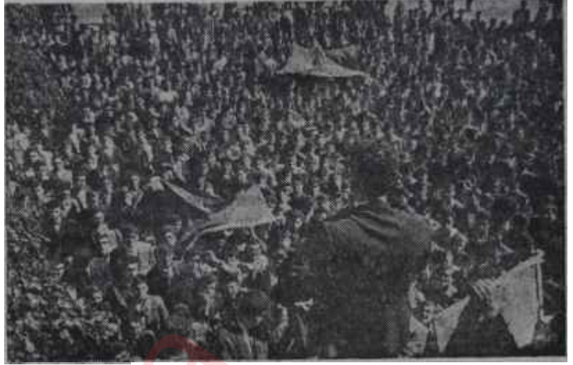
Bir seçim mitinginin de halk topluluğu Yarıncı Türkiyeden bir levha

Şu anda hiç kimsenin şüphe etmemesi gereken husus, verilen müsaadeyle birlikte tozkoparan bir faaliyetin seçim gününe kadar memlekette hüküm süreceğidir. Bu arada pek çok cerahatin, pisliğin de bazan insanın midesini bulandıracak tarzda akacağı unutulmamalıdır. En can sıkıcı manzaralar karşısında bile yapılacak şey sınırlara hakim olmak ve asla hiddete kapılmamaktır. Açık hayatın en büyük zorluğunun bilhassa ilk devrelerdeki aşırılıklara tahammül olduğu gözden uzak tutulmazsa ve bu tahammülü göstermenin herkesten ziyade kudret sahipleri için vazife bulunduğu hatırlanırsa kritik devre mesut şekilde neticelenecektir. Bunun için bu milletin olgunluğuna güvenmek, demokratik nizam içinde bütün aşırılıkların cemiyetten gerekli tepkiyi kendiliğinden göreceğini bilmek, politikacıların, kalem erbabının, umumi efkara çeşitli yollardan hitap edenlerin hep melek olmadıklarını hesaba katmak şarttır. Bilinmelidir ki tozkoparan fırtınalar en sonda mutlaka diner ve eğer gözgözü görmez haldeyken bir yanlış adım atılmadıysa selâmete çıkarılır. Bütün mesele serinkanlılığı elden bırakmamak, asaba hakim olmak, tahammül göstermek, Demokrasinin dertleri ve güçlükleri de bulunan, bir rejim olduğunu hatırlamaktır. Zira bizim iyiliğimizi istemeyenlerin de başımızı belâya sokmak için son meydan muharebelerini bu, önümüzdeki kritik devrede, verecekleri muhakkaktır. On aydan beri her teşebbüslerinin sonunda hüsrana uğ-