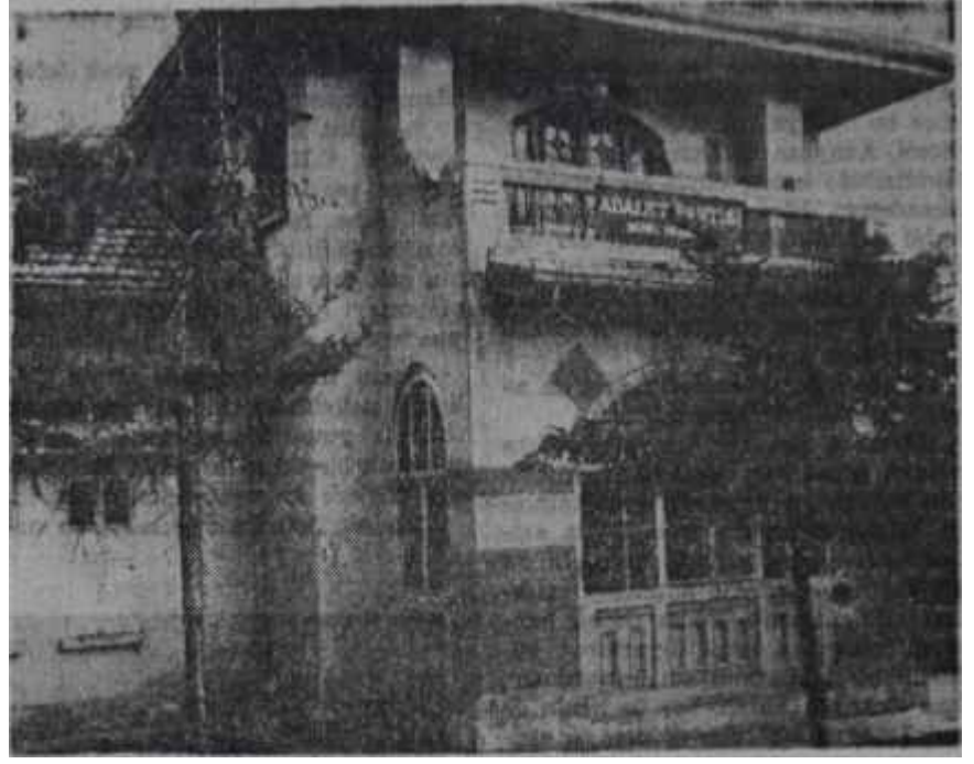
A.P. Genel Merkez binası Fırtınada bir gemi

Adalet Partisi liderinin başına gelenler, sadece okumağa olan me-