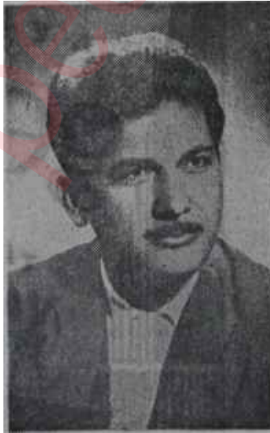
Şahinkaya Dil Yolun yarısını aştı

: ( Şahinkaya Dilin şiirleri, Çağdaş yayıncıları, Küntüncü Matbaası Ankara 1961, 32 sayfa 250 kuruş ). Şahinkaya Dil de tıpkı Ümit Yaşar Oğuzcan gibi yıllar yılı şiirle uğ-