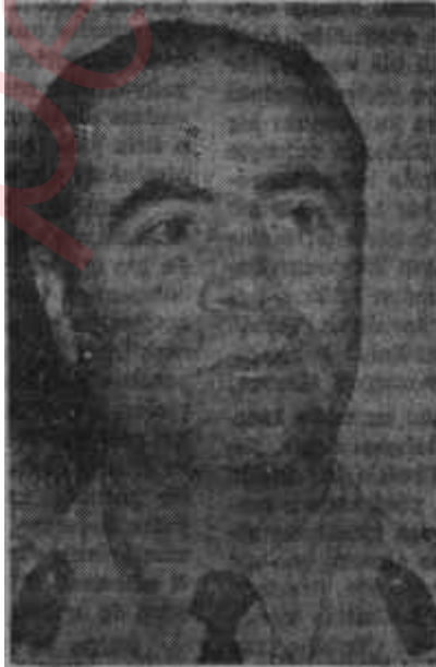
Şefik Soyuyüce Hayal aleminden bir ses

Dâvanın kendisi kadar, gün ışığına çıkışı da enteresan oldu. İstanbul gazetelerinden biri tarafından öğrenilen -biraz da yanlış olarak- haber, gazetenin birinci sayfasında okuyucuya bildirildiği gün. Danıştay üyelerinin keyfi birden kaçtı. Gazetecilerin gelmesini beklediler ve bekledikleri çıktı. Danıştay o gün basın mensubu akınına en fazla uğrayan resmî daireydi. Tabii ziyadesiyle girip çıkılan oda, Danıştay Başkam Tefvik Gerçekerin makam odası oldu. Başkan ne yapacağımı şaşırılmıştı. Haberin duyulmasını -hangi sebeptendir bilinmez- istemiyordu. Halbuki gazeteciler için aslım astarım öğrenmek merakındaydılar. Bazıları, meseleyi kendisi derecesinde biliyorlar, sâdece tevsikini istiyorlardı. Gerçekler iki kocaman kıskacın arasındaymış gibi sıkıntılı bir gün geçirdi. Kimisini yuvrak laflarla atlatmağa çalıştı, kimisine müphem cevaplar ver-