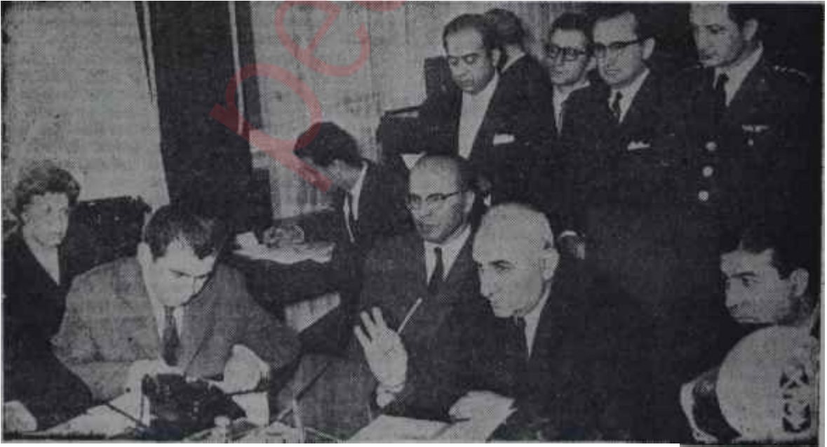
Başkan Gürsel ve basın mensupları son basın toplantısında Beklenen sürpriz

Yabancı muhabir, suallerine, veri-len cevaplardan dolayı teşekkür etti ve yerine oturdu. Bu defa, sıra yerli muhabirlere gelmişti. Sağ taraftaki koltuk blokundan hafifçe doğrulan bir gazeteci, Başkana sualini sora-