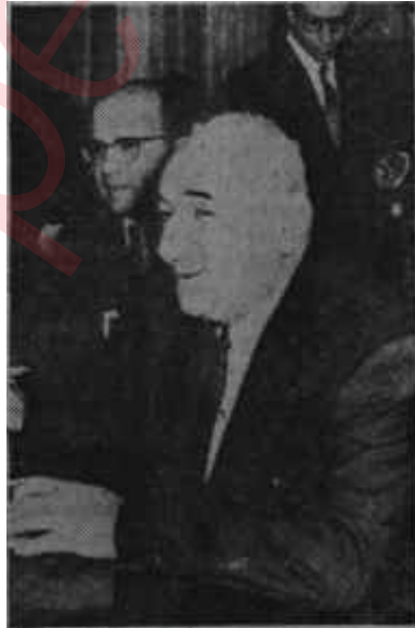
Gürsel bir suali dinliyor

Toplantının havası gittikçe ısınmağa başlamıştı. Salonunda bulunan gazeteciler açılmışlar, Başkan sükûnetine nisbeten kavuşmuştu. Mütemediyen gülmüşüyor ve öndeki