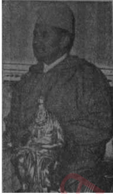
Muhammed V Sultan öldü, yaşasın sultan!

V. Muhammedin ölümünden sonra yerine oğlu Mulay Hasan geçti. Otuziki yaşındaki Mulay Hasan, Fas tahtına II. Hasan unvanıyla oturur