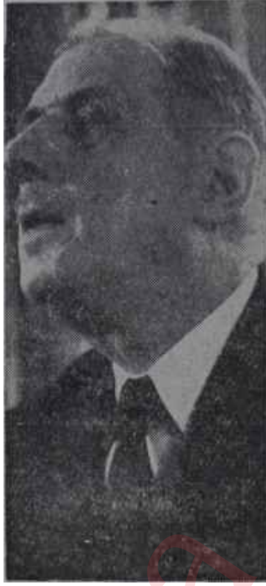
General De Gaulle Anlaşmaya doğru

Fransız hükümeti bu görüşünü de-iştirmedikten sonra, Başkan Burgiba iyimserlikte haklı olamazdı. Fakat geçen haftanın ortasında Patisten gelen haberler General De Gaulle'ün nihayet Cezayir milliyetçilerinin önemini anladığını gösterdi ve Burgiba'nın iyimserliğini hakir çıkardı. Evet, Fransız hükümeti Cezayir meselesine çıkar bir yol bulabilmek için Geçici Cezayir Hükümeti ile görüşmelere girişmeyi kabul edi-