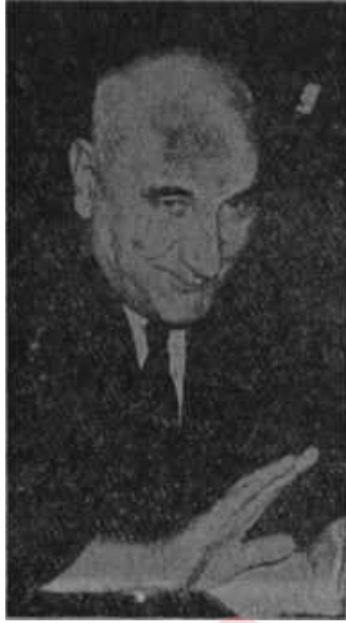
Gürsel konuşuyor Açık kalpli bir adam