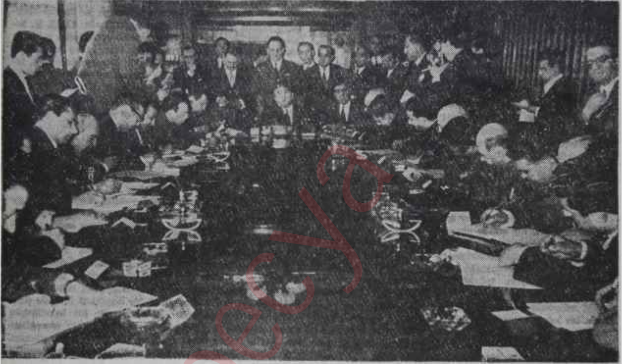
Cemal Gürsel basın toplantısında gazetecilerle birlikte

Bitirdiğimiz haftanın sonlarında Başkan Gürselin basın toplantısında bir takım düğümlerin çözülmesini bekleyenler, beklediklerini bulamadılar. 2 Mart perşembe gününe kadar bütün tahminler -ve o andaki