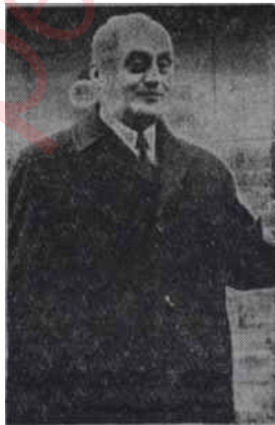
Sıtkı Ulay Basiretli bir ihtilal

da hızlandı. Boş sandalyaların doldurulması bekleniyor. Ve harıl, harıl adam aranıyor. Sandalyalardan en önemlisi muhakkak ki Milli Eğitim Bakanlığıydı. Bu Bakanlığa yeni bir tayin yapmak ve Feyzioğlundan boşalan yeri doldurmak gerekiyordu. Yapılan temaların çoğunda teklif sahipleri tereddüt ediyorlardı. Milli Eğitim Bakanlığı âdeta insan öğüten bir değirmen haline gelmişti. M. B.K. bununla ilgili bir toplantı yaptı. İhtilâlin öncüleri meseleyi halletme azminde ve kararlıydılar. Doğrusu ya, işi pek kolayca hallettiler. Eğitim Bakanlığına Ahmet Tahtakılıçı asaleten tayin etmek galiba yapılacak işlemin en isabetlisiydi. 147 ler problemini Tahtakılıç vekâleten baktığı Bakanlığın bütçe müzakerelerinde maharetle halletmişti! Tahtakılıç gibisi bulunamazdı! Üstelik C.K.M. P. li Bakanın bu sandalyaya fazlaca sempatisi olduğu hareketlerinden anlaşılıyordu, öyleyse... Öyleyse Tahtakılıç Çalışma Bakanlığında alınır, Millî Eğitim Bakanlığında getirilirdi. Böylece, alan da satan da memnun kalıyordu. M.B.K., 147 lar konusu Üzerinde durmak istemediğini defalarca açıklamış ve bu rakamdan pek hoşlanmadığını ortaya koymuştu. Böyle bir mesele de M.B.K.. gibi düşünen veya düşünmeyi tercih eden bir politikacının Milli Eğitim Bakanlığı koltuğunda bulundurulması son derece iyi ve isabetli bir hareketti. Tahtakılıç, Verilen yeni vazifeyi itl-