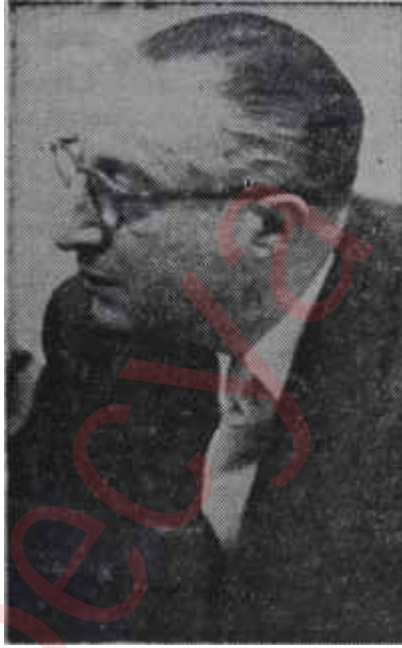
Selim Sarper Silgiyi eline aldı