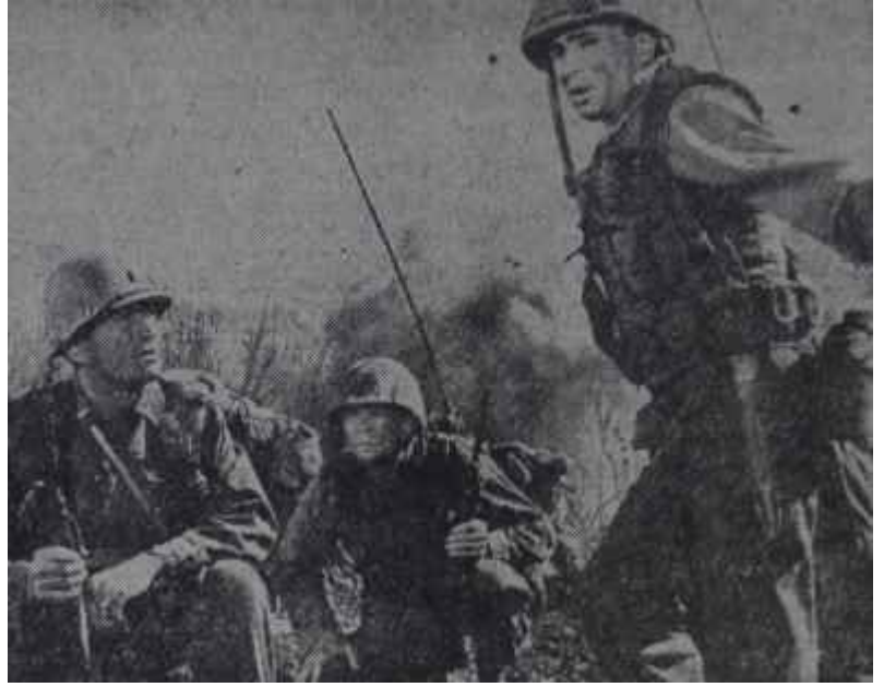
Gregory Peck "Pork Chop Hill - Mücadele Tepesi"nde Savaş ortada

"Batı Cephesinde Yeni Birşey Yok - Ali Quiet on Western Front"