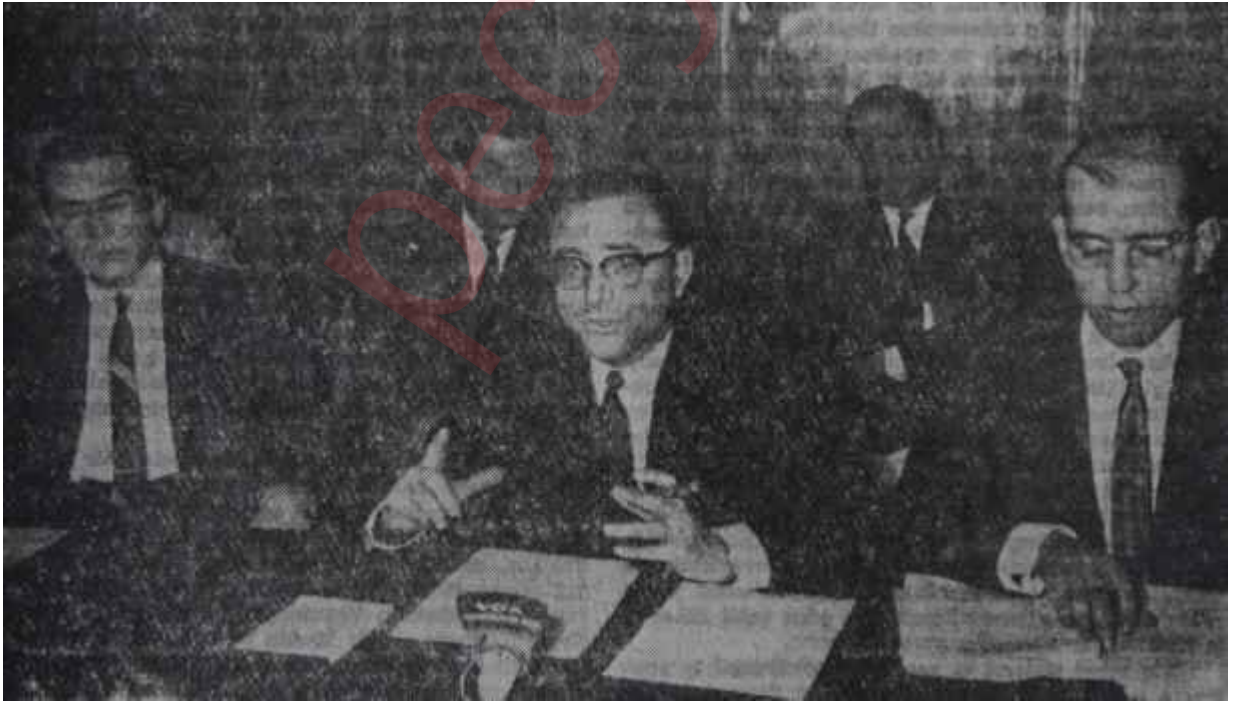
Maliye Bakanı Kemal Kurdaş basın toplantısında konuşuyor İnsan pembe gözlük takarsa...

Bakanın bildirdiğine göre 1961 yılı bütçesi 8 milyar 665 milyon lira olarak bağlanmıştı. Bunun 1 milyar 700 milyonu yatırımlara, 5 milyar 965 milyonu ise cari masraflara ayrılmıştı. Bütçe gelirlerinin 7 milyar 640 milyon lirası normal devlet varidatından. 450 milyonu tasarruf bonola-