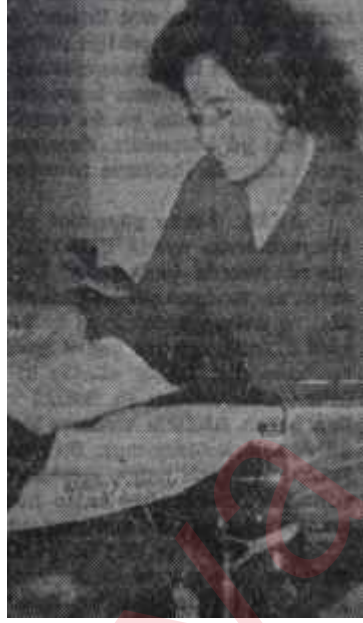
Bir muhasebeci Başı dertte kadın

Bitirdiğimiz hafta, memur maaşları da sâdece hoşnutsuzluk yaratmış değildi. Böyle bir desteğe şiddetle muhtaç, eski rejimin üvey evladı ordu mensupları ve sivil memurlar et-