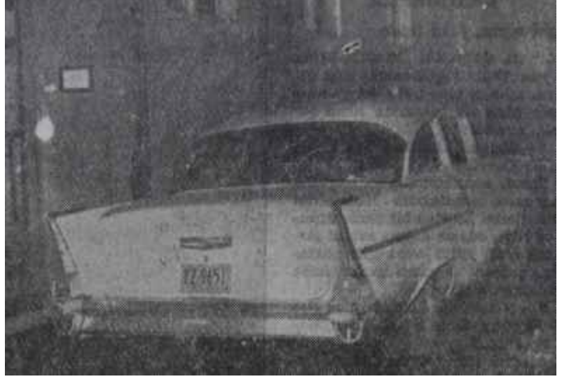
Yalçının Amerika plakalı otomobili Yeni Partinin seyrüsefer arabası

Toplantı dağıldığında, salonda bulunanlardan hemen pek çoğu memnun, gülümsüyordu. Zira buna benzer